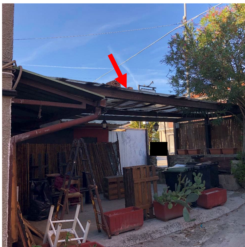
Foto 6 – Tettoia eseguita in assenza di titolo, per la quale si prevede la demolizione (indicata con la freccia rossa)