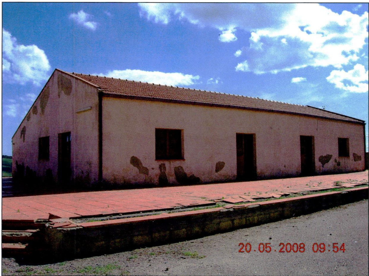
FOTO 1 - IL FABBRICATO DEDICATO AGLI UFFICI SORGE SU UN PIAZZALE RIALZATO DI CIRCA 50 CM RISPETTO ALLO SPIAZZO ASFALTATO CHE LO CIRCONDA.