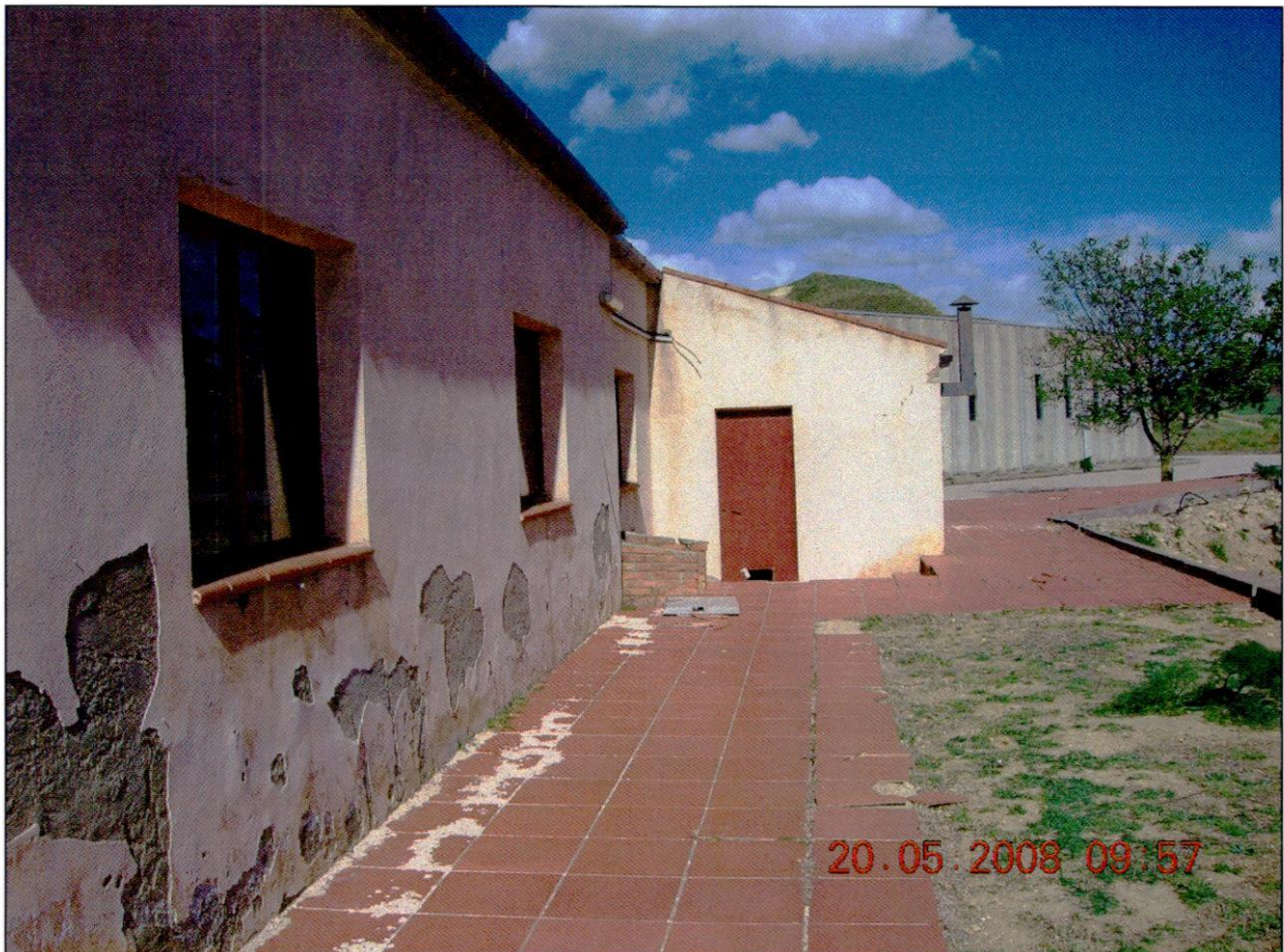
FOTO 2 - IL RETRO DEL FABBRICATO. SULLO SFONDO SI SCORGE IL CAPANNONE PREFABBRICATO CHE OSPITAVA IL CASEIFICIO.