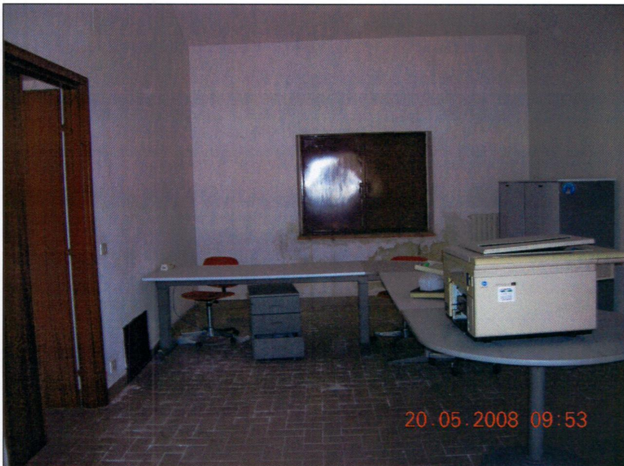
FOTO 6 - IL LOCALE UFFICI.