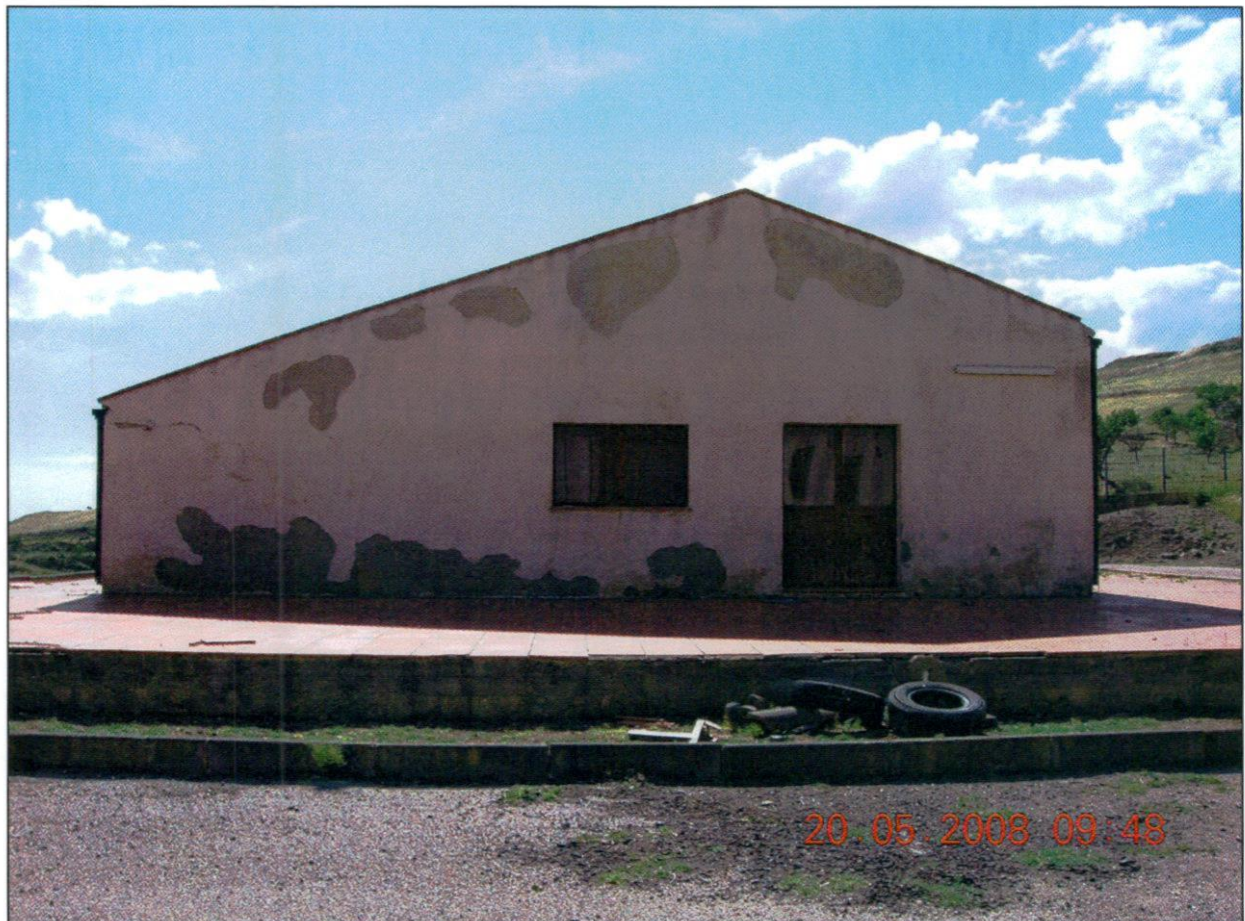
FOTO 4 - SU TUTTI E QUATTRO I PROSPETTI L'INTONACO PRESENTA UNO STATO DI INVECCHIAMENTO NOTEVOLE.