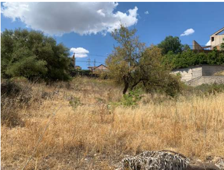
Terreno al Foglio 11 part. 162