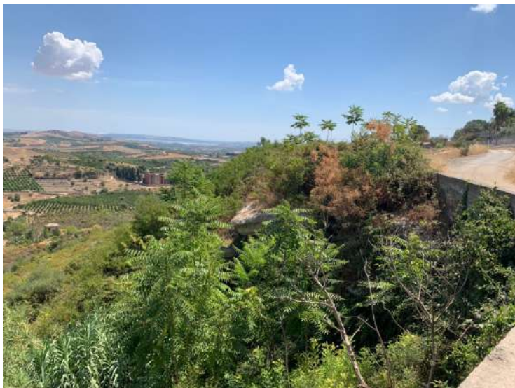
Terreni al Foglio 12 partt. 4 e 113 visti dalla strada comunale parallela alla ferrovia

occorre rilevare che, viste le caratteristiche orografiche impervie, tenuto conto dei vincoli per fascia di rispetto ferroviario e stradale, considerato che in particolare la particella 4 risulta vincolata per intero ai sensi della detta Legge Galasso (L. n. 431/85), il potenziale edificatorio di ciascun fondo è pressochè nullo, tranne per la particella 113 il cui indice di edificabilità potrebbe essere utilizzato in fondi adiacenti e con la stessa destinazione urbanistica per perequazione edilizia (zona E agricola).