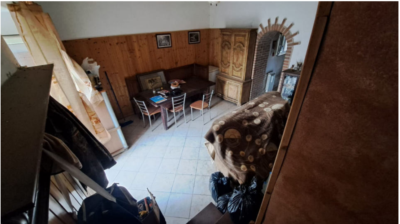
Vedute interne – soggiorno al piano terra