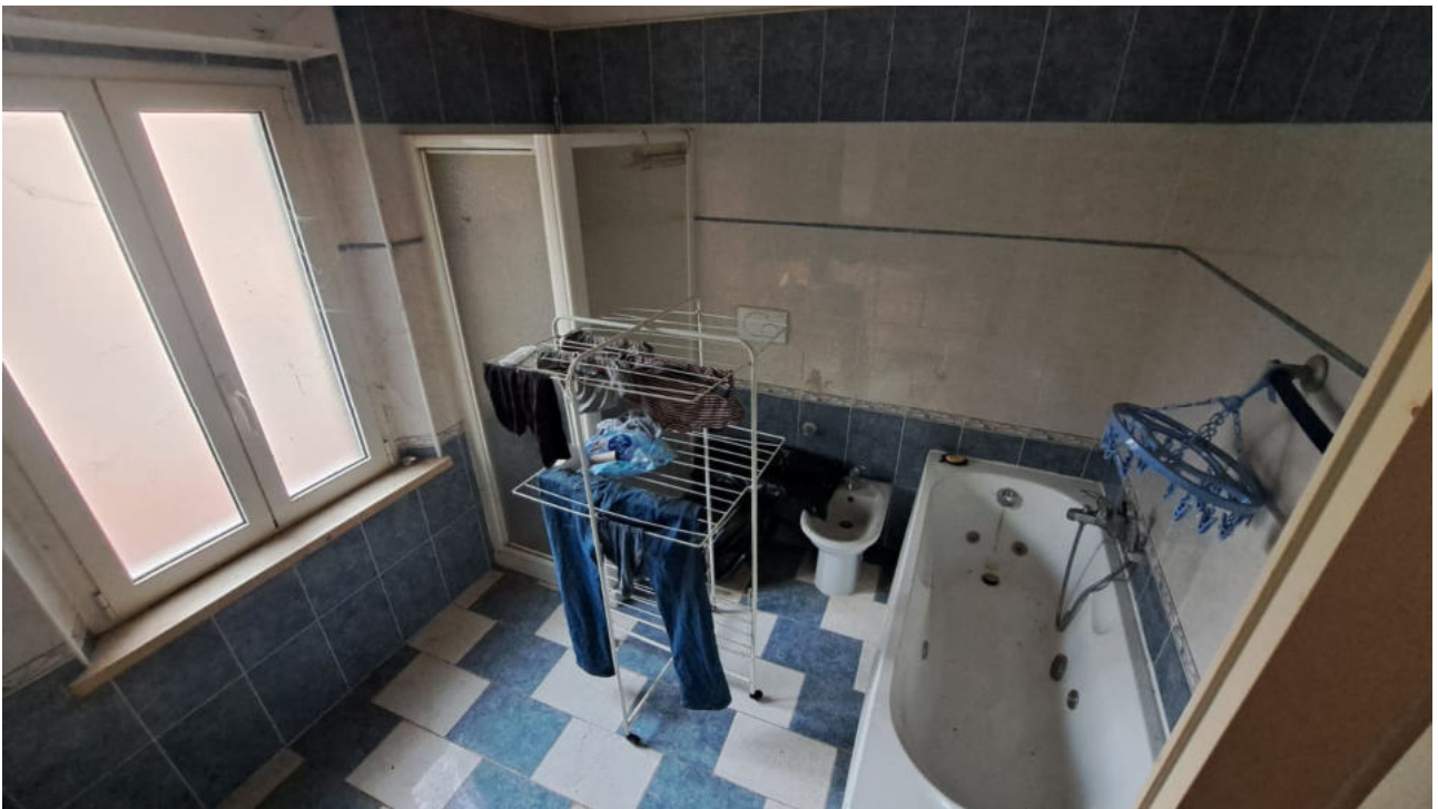
Vedute interne piano primo – camera da letto e bagno