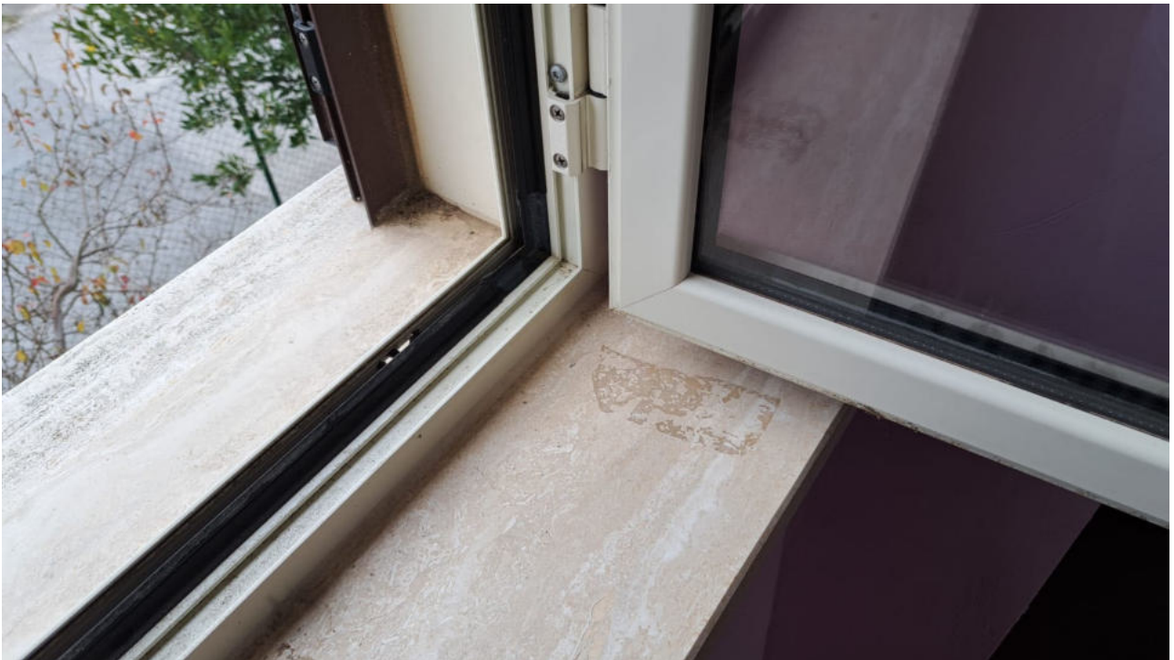
Vedute interne piano primo – particolare bagno e infissi