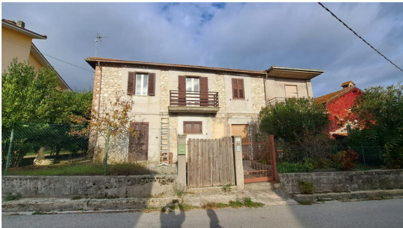
Vedute esterne del fabbricato e delle aree di accesso