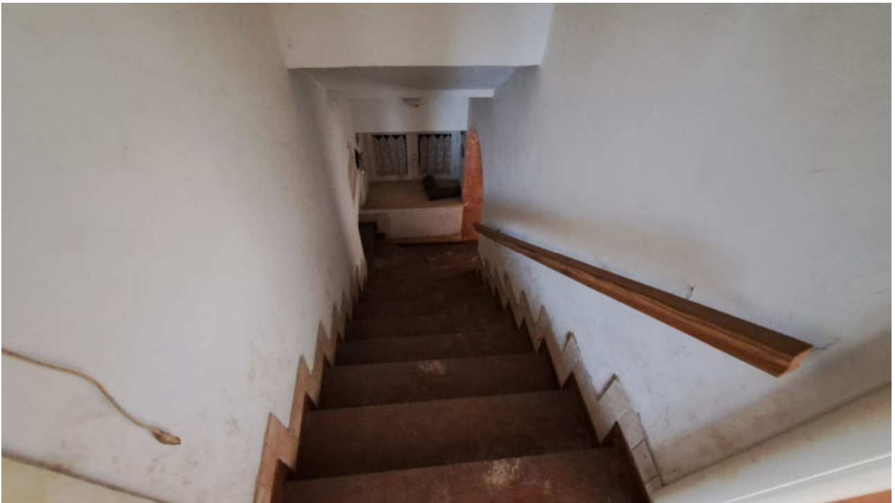
Vedute interne – soggiorno al piano terra e scala di accesso al piano primo