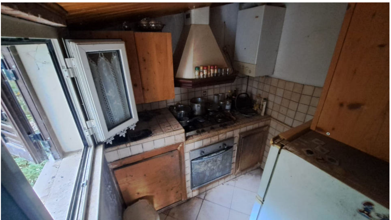
Vedute interne – cucina al piano terra