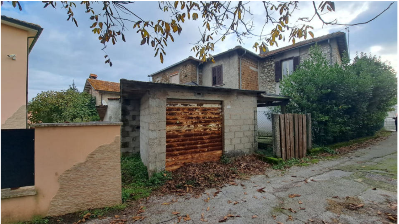
Vedute esterne del fabbricato – prospetto posteriore