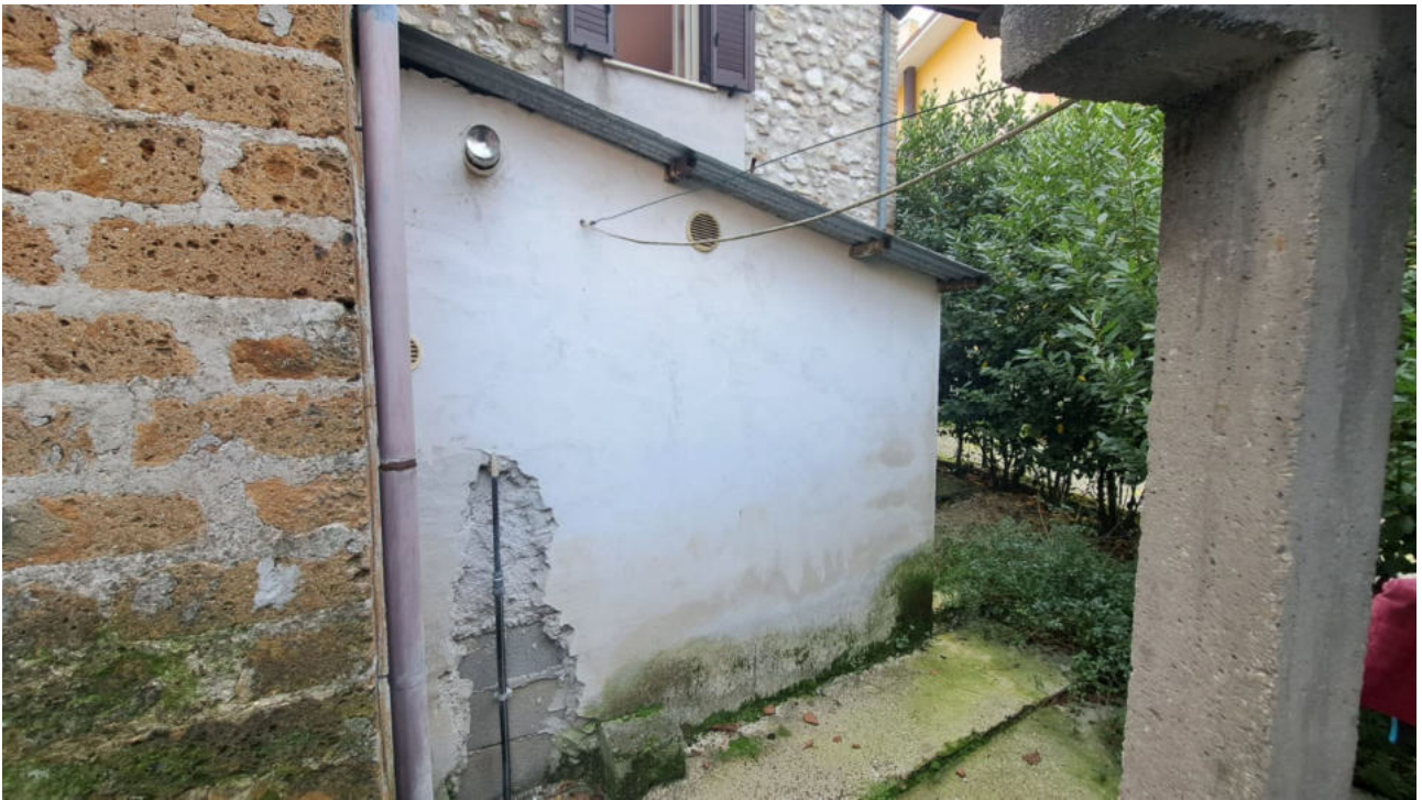
Vedute esterne del fabbricato (corte sub 3)