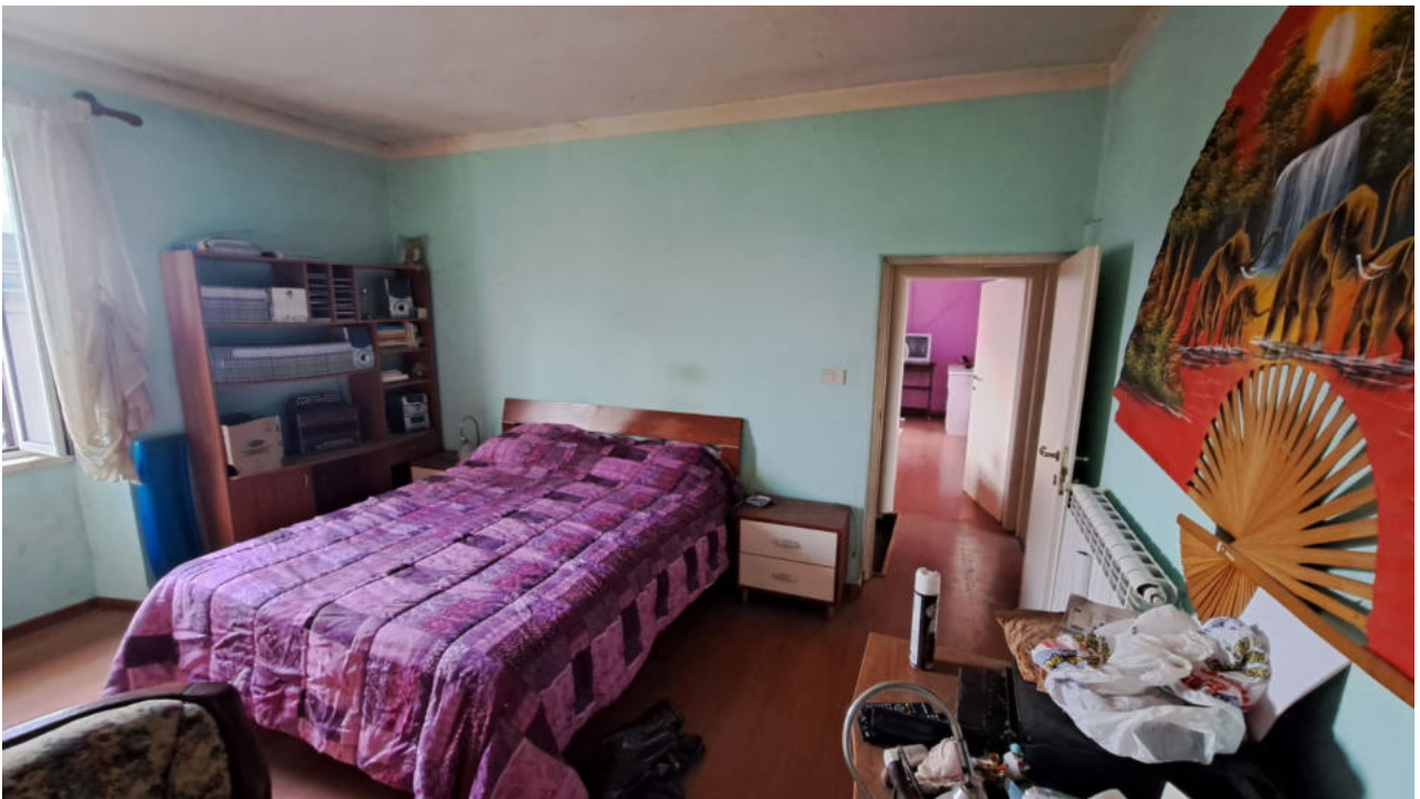
Vedute interne piano primo – camere da letto