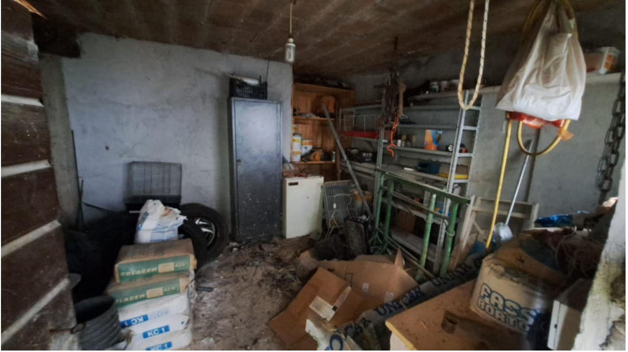
Locale ad uso cantina al piano terra