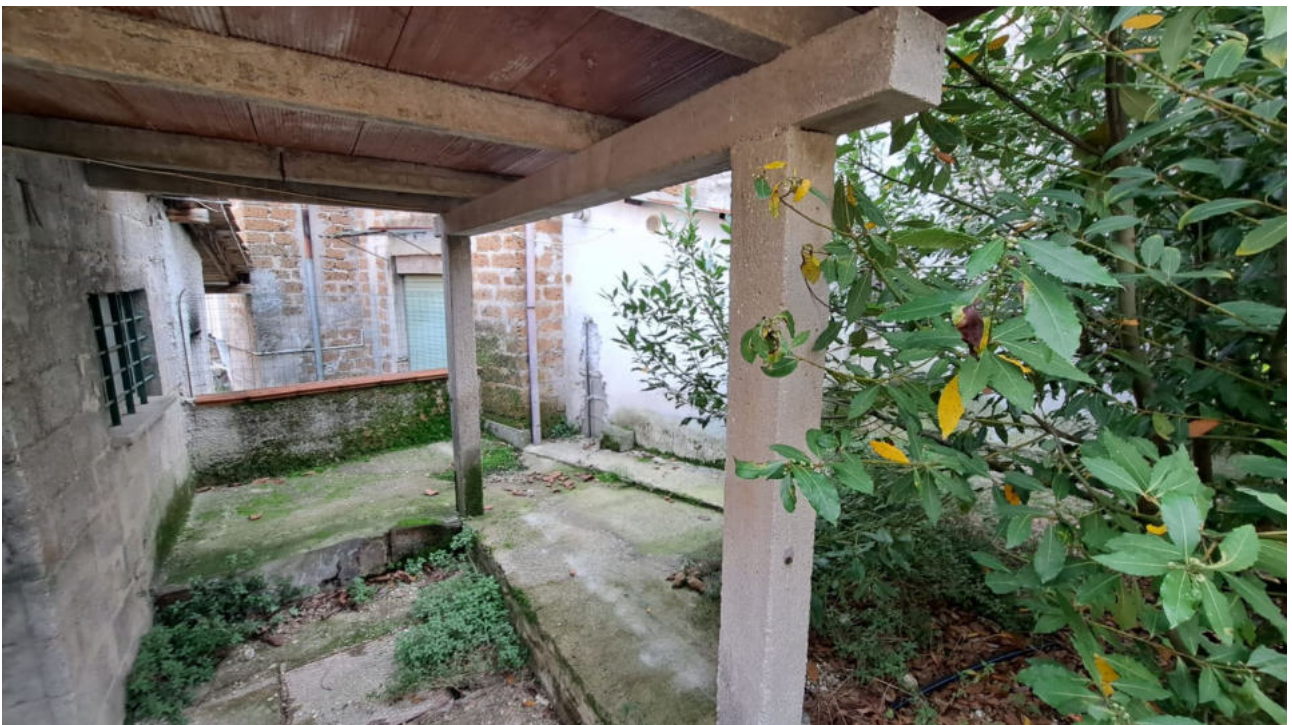
Vedute esterne – manufatto ad uso cantina