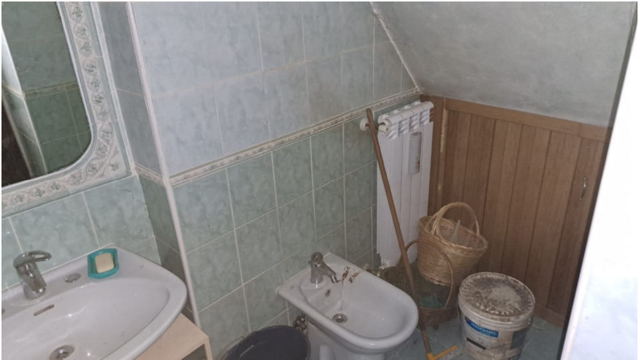
Vedute interne – bagno al piano terra