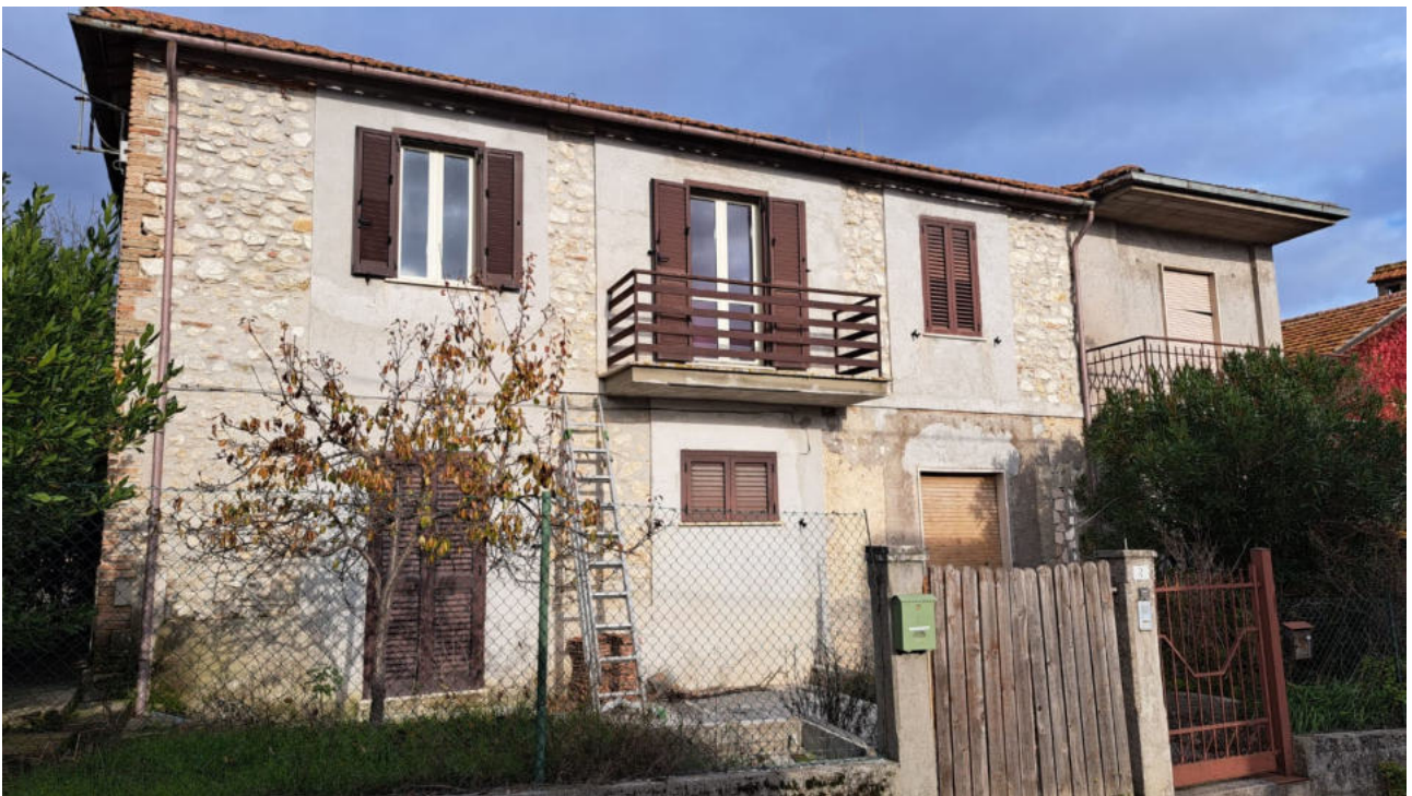
Vedute esterne del fabbricato lato ingresso via Spinacceto