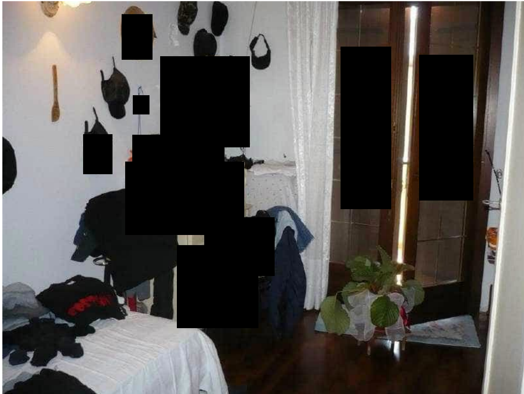
LETTO – PIANO PRIMO