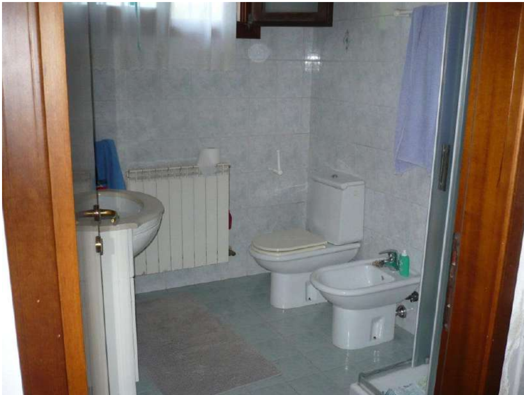
BAGNO – PIANO TERRA