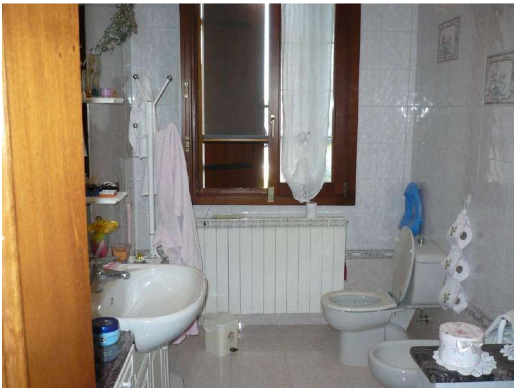
BAGNO – PIANO PRIMO