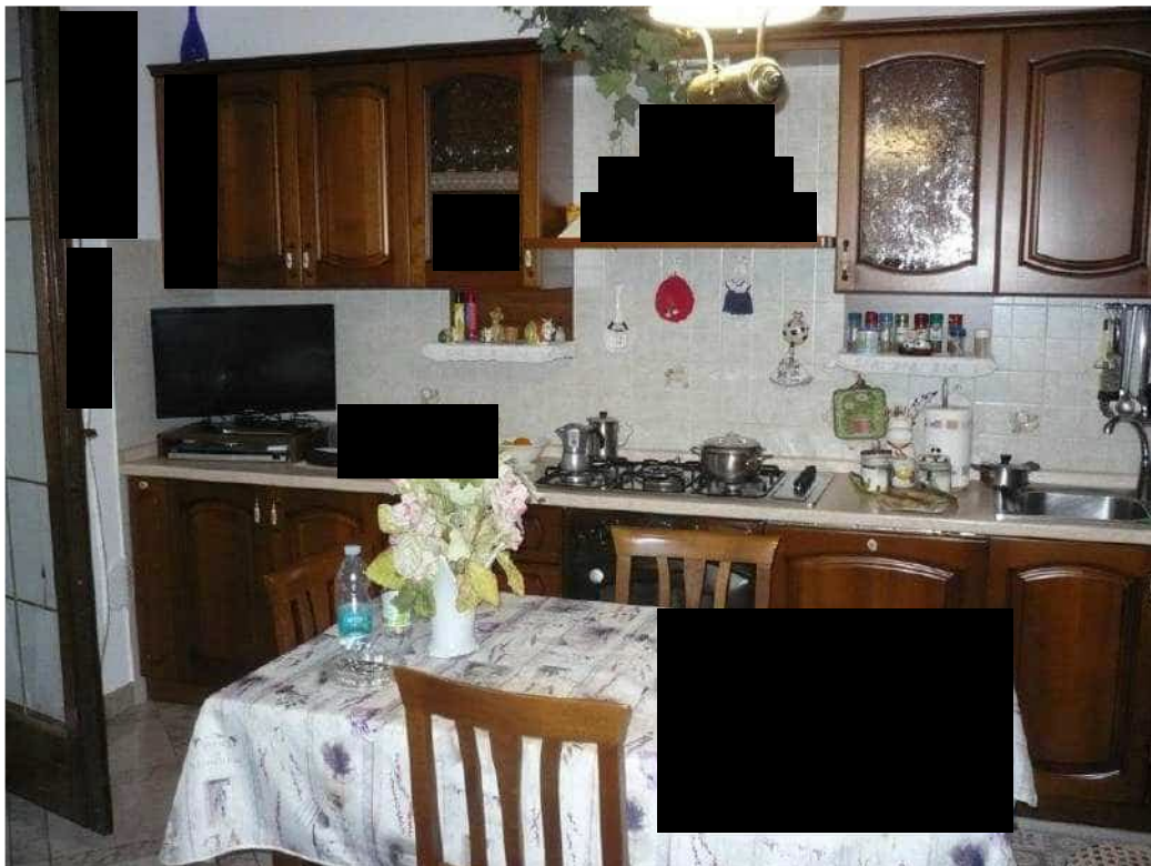
CUCINA – PIANO PRIMO