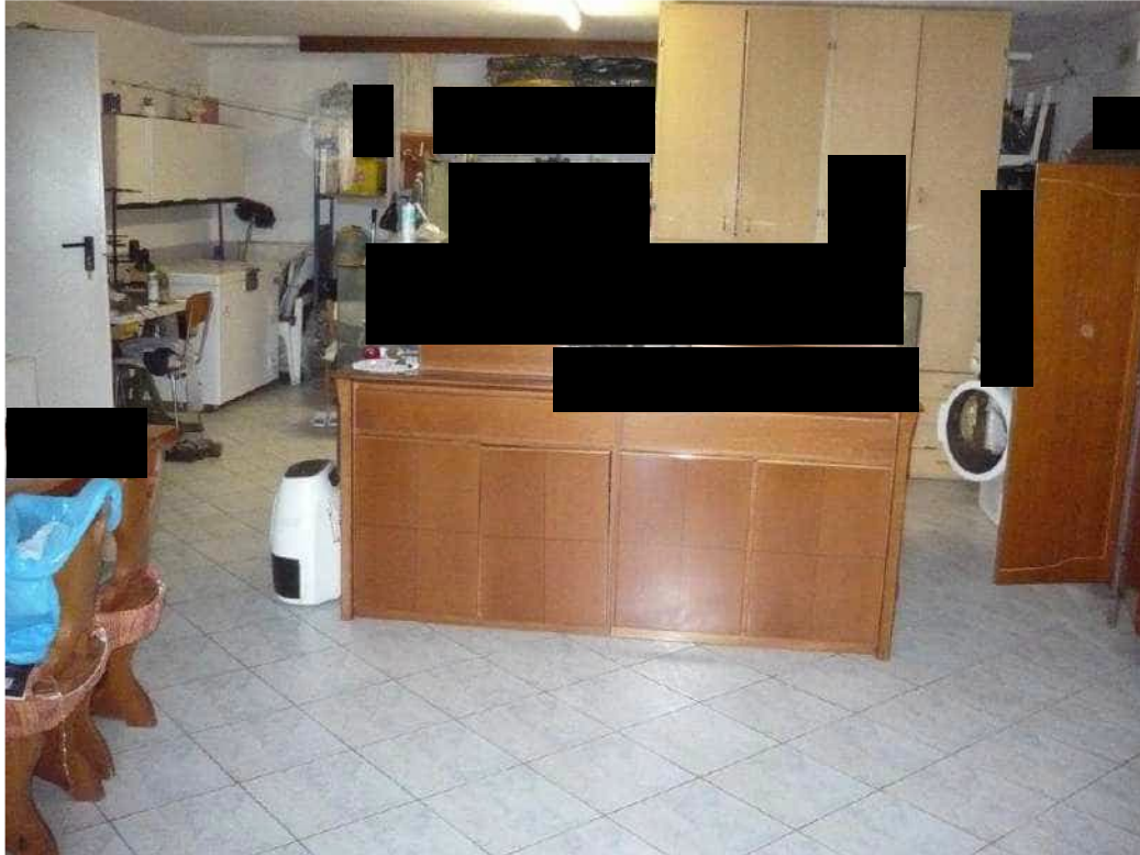
GARAGE – PIANO TERRA