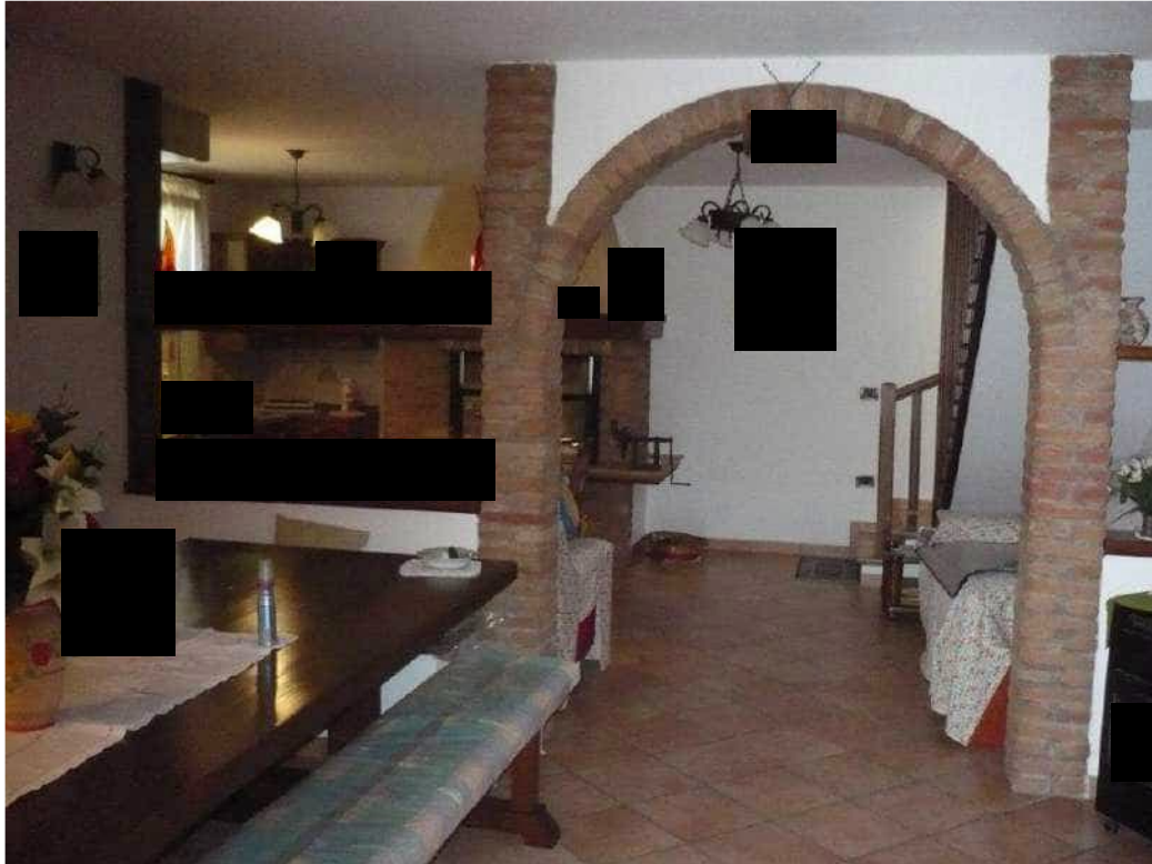
DISBRIGO – PIANO TERRA