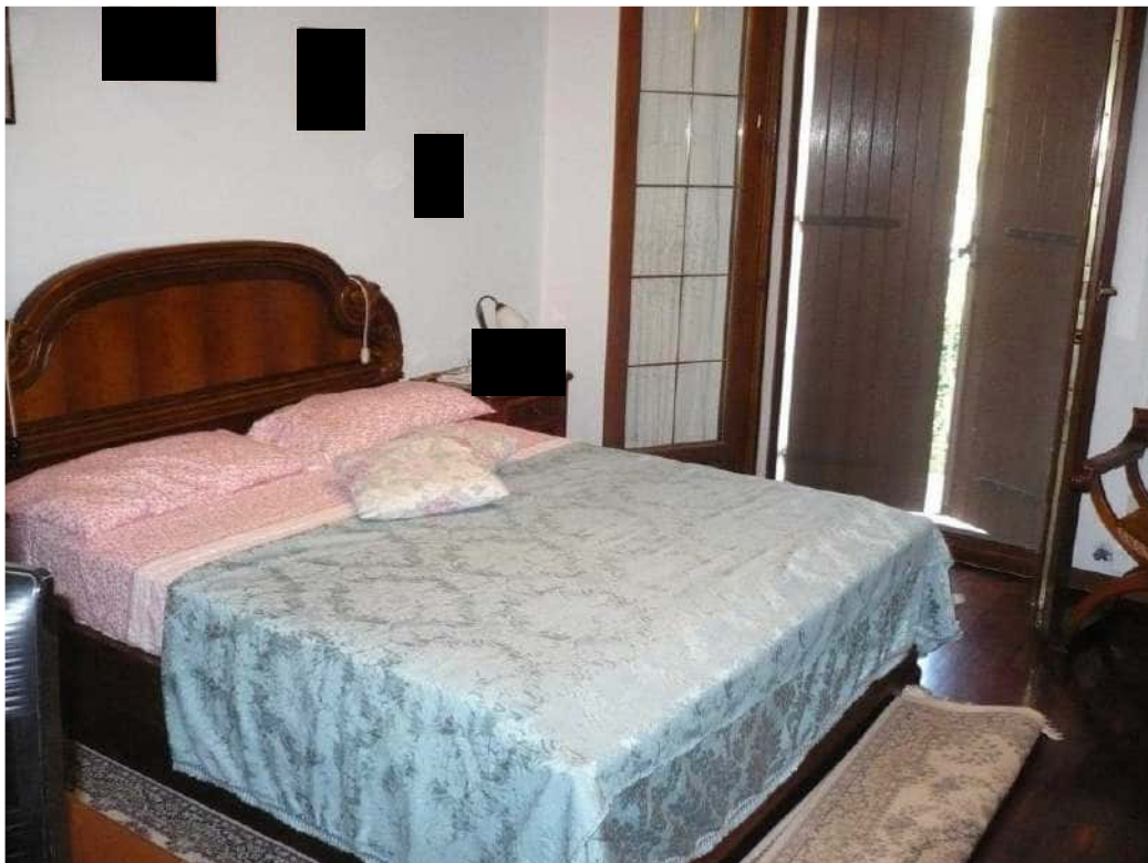
LETTO – PIANO PRIMO