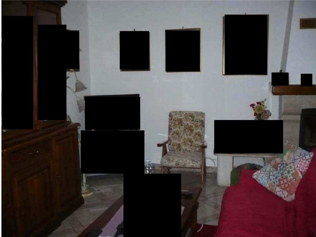
SOGGIORNO – PIANO PRIMO