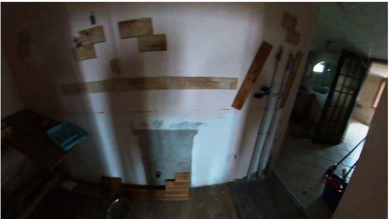
Figura 11 Interni piano terra