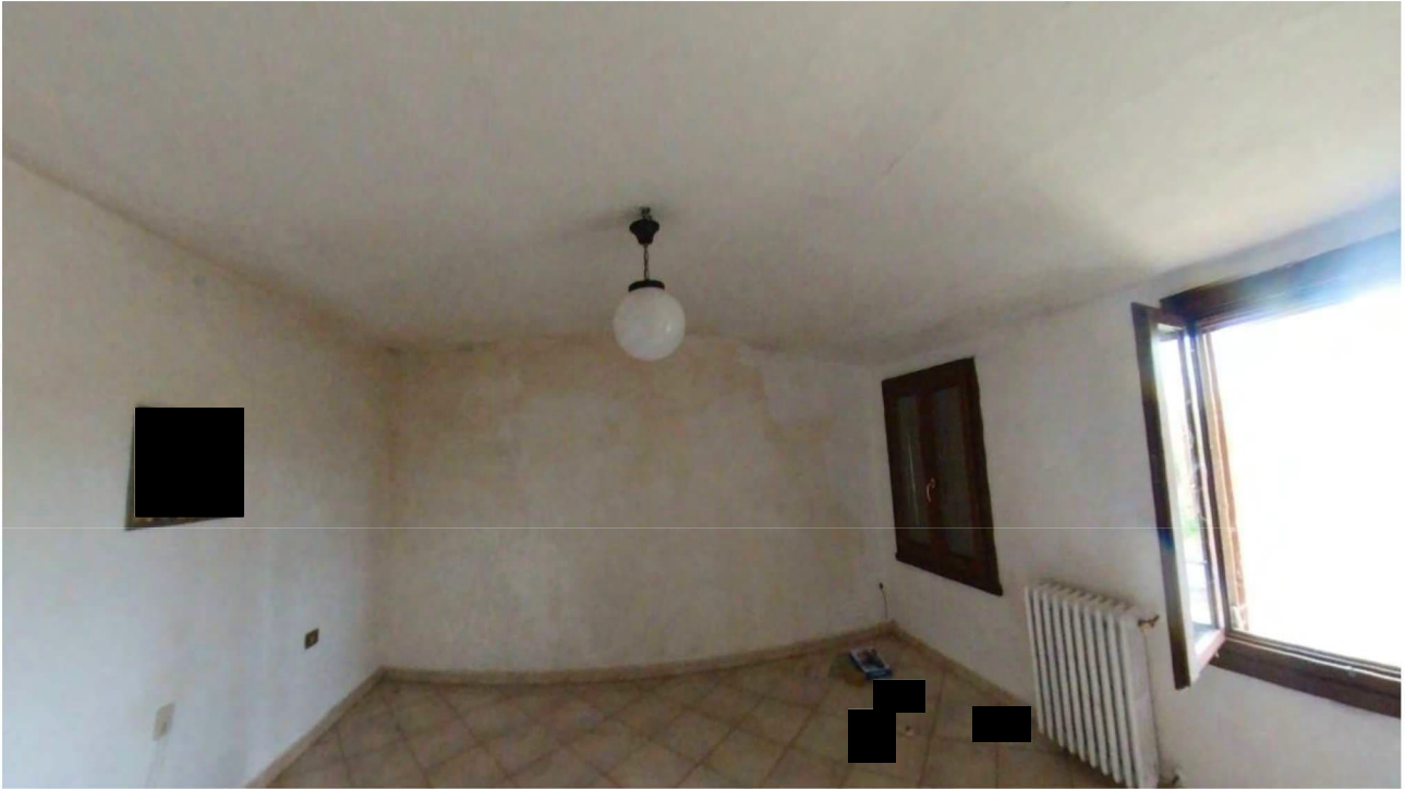
Figura 16 Interni primo piano