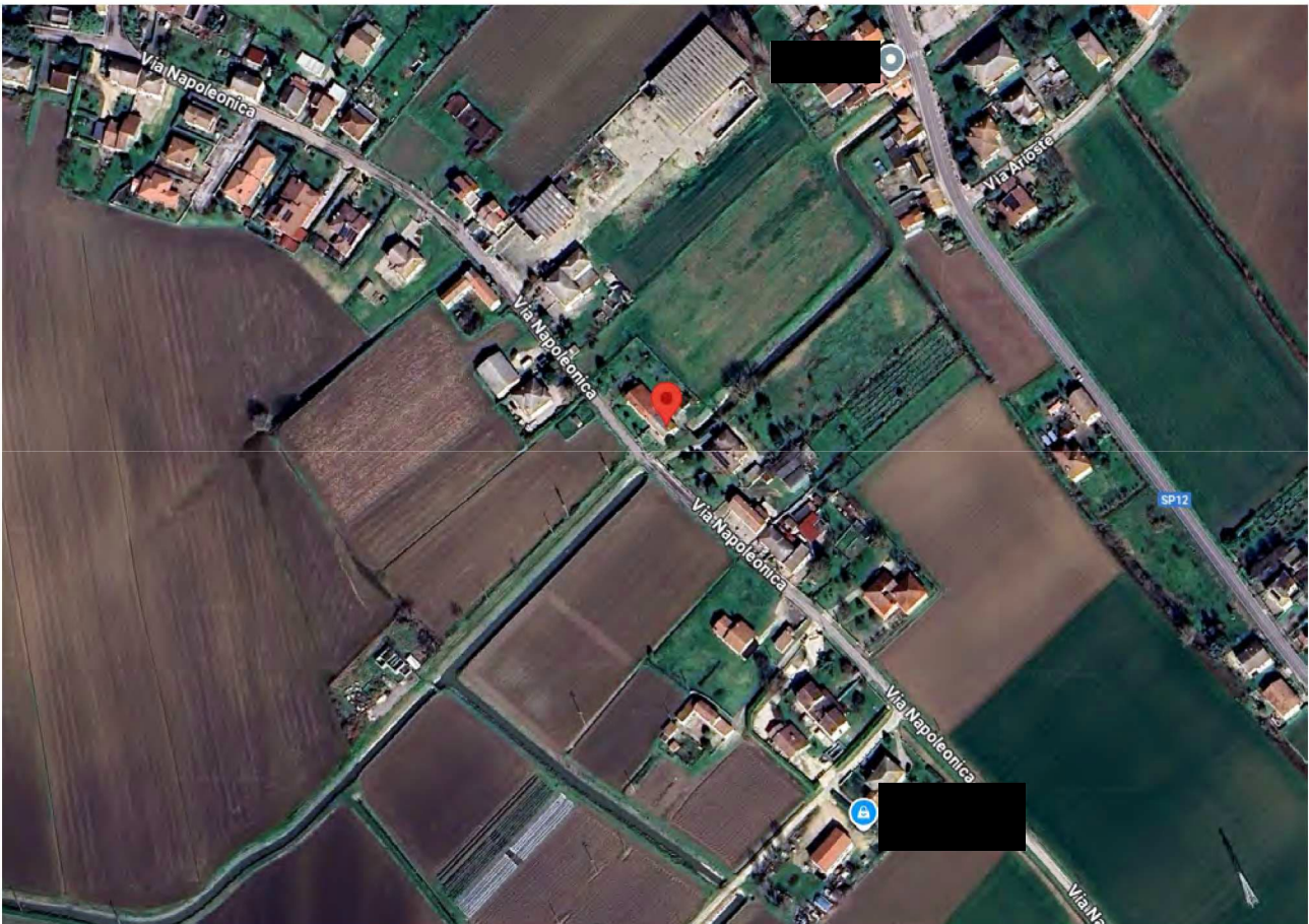
Figura 1 Veduta aerea della zona