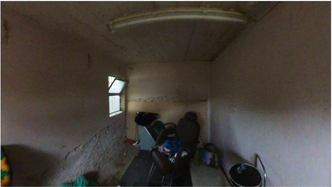
Figura 23 Interno pertinenza cantina