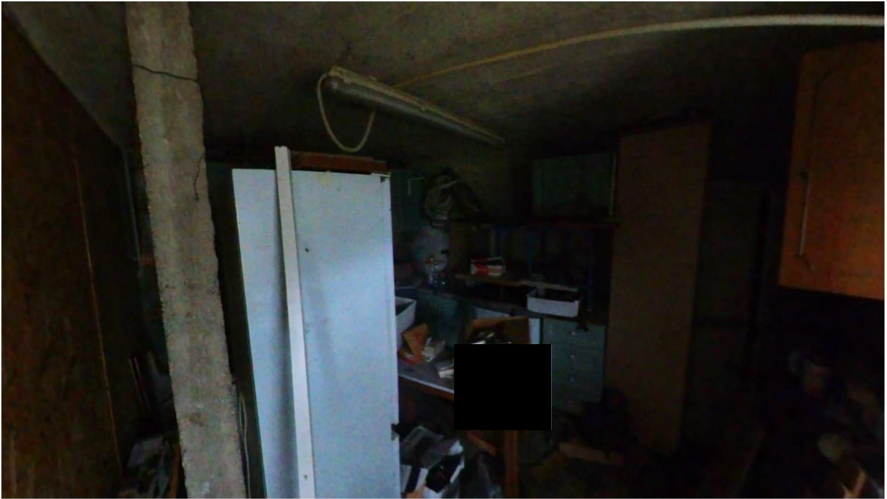
Figura 24 Interno pertinenza cantina