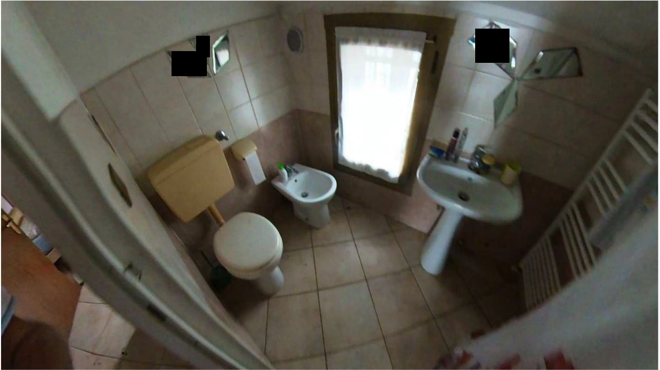
Figura 22 Interni primo piano