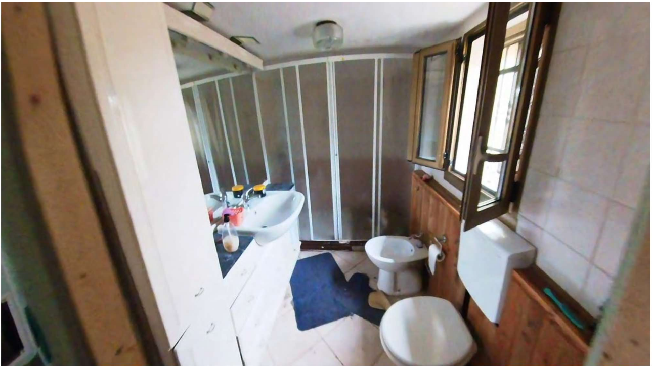
Figura 13 Interni piano terra