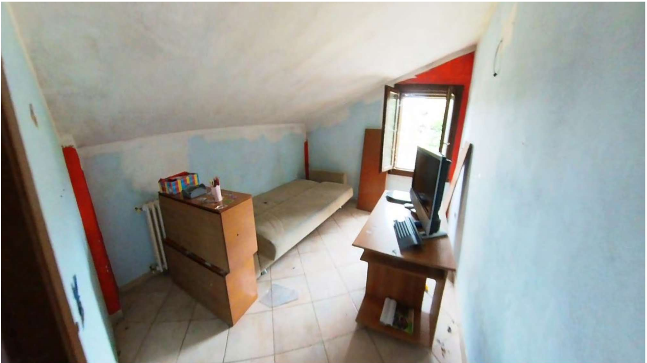
Figura 21 Interni primo piano (sottotetto Nord