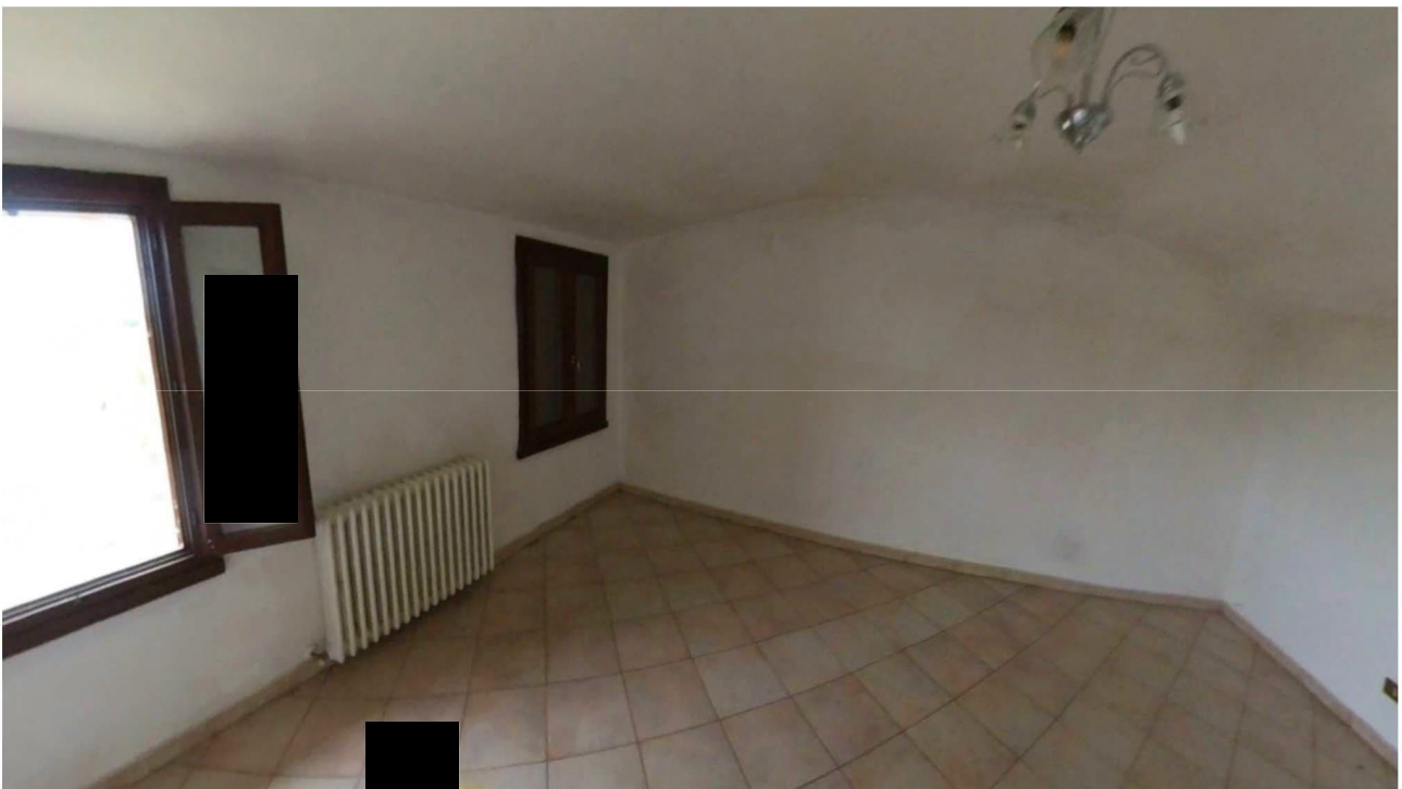
Figura 17 Interni primo piano