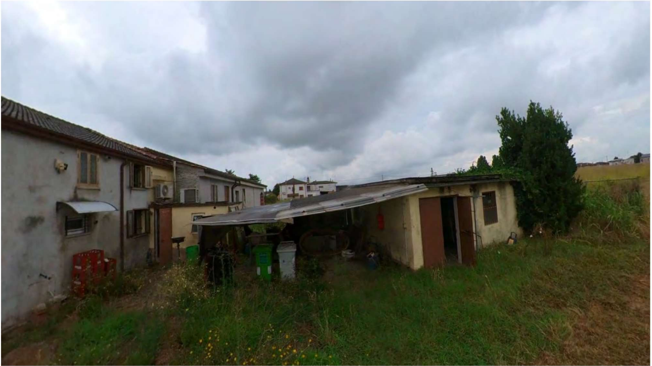
Figura 6 Veduta pertinenza esterna e baracca da rimuovere