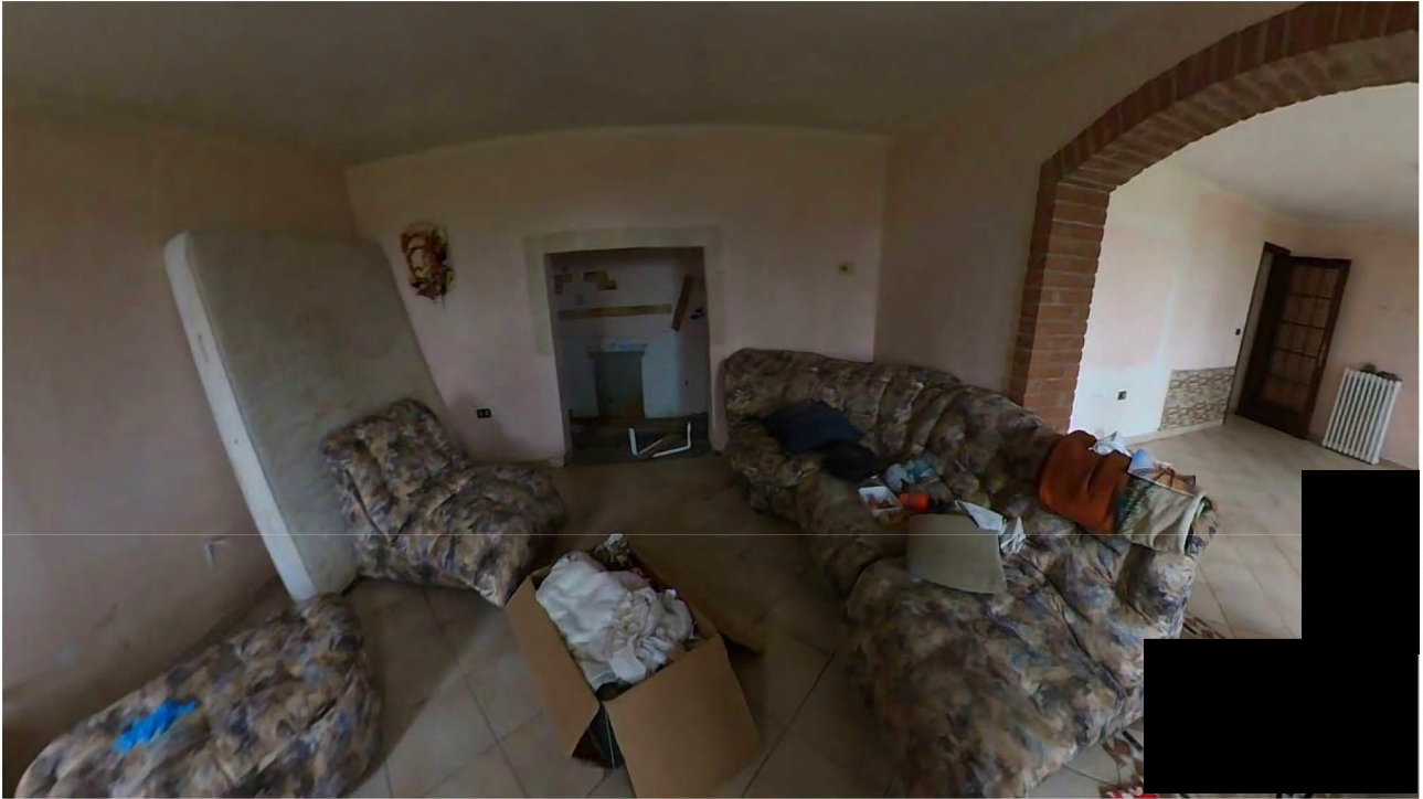
Figura 8 Interni piano terra