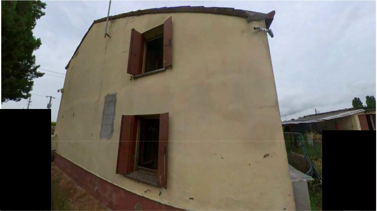
Figura 4 Veduta Est