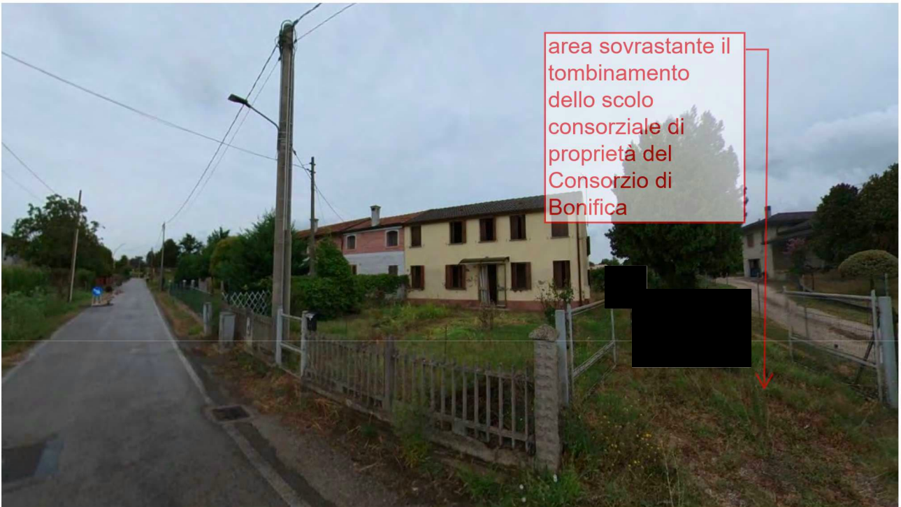
Figura 2 Veduta dalla Via Napoleonica