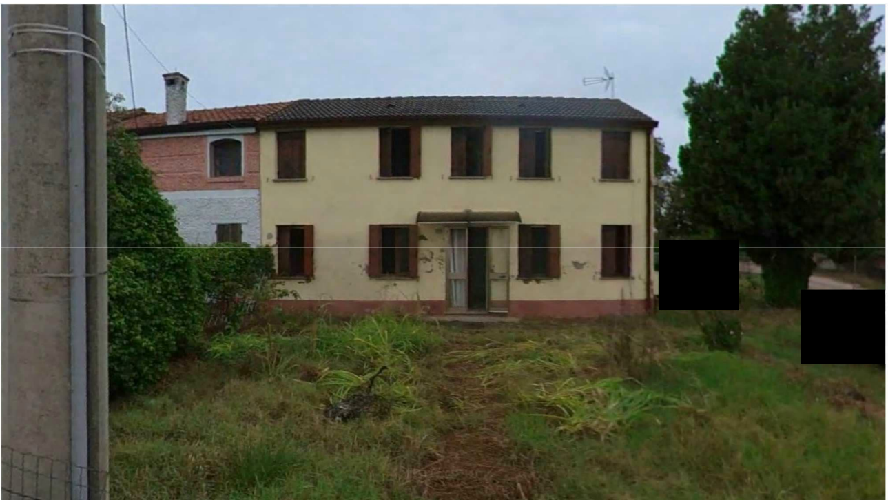
Figura 3 Veduta Sud