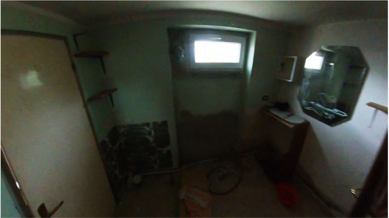
Figura 12 Interni piano terra