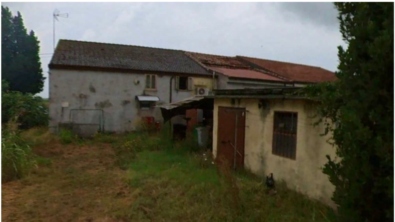
Figura 5 Veduta retro (lato Nord)