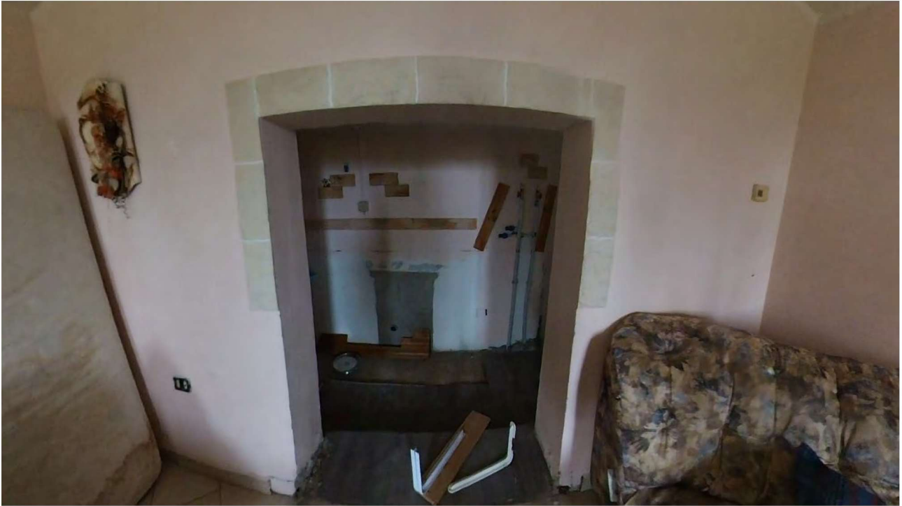
Figura 10 Interni piano terra