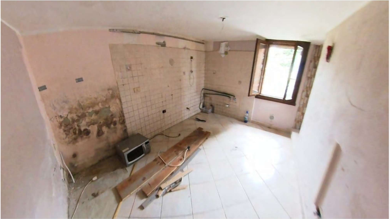
Figura 14 Interni piano terra