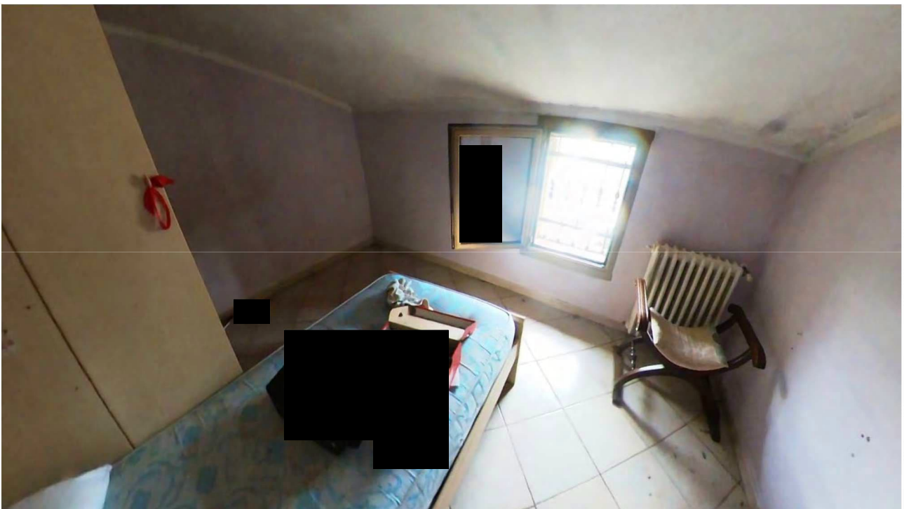
Figura 19 Interni primo piano (sottotetto Nord