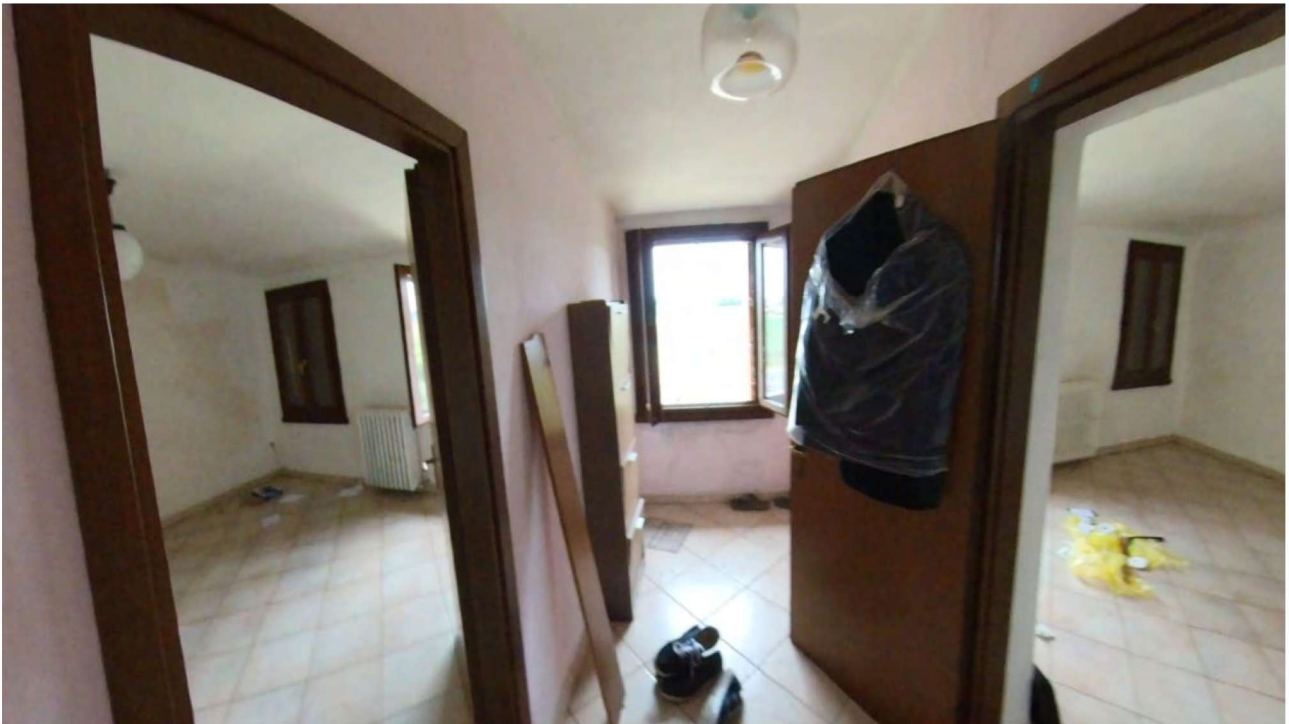
Figura 15 Interni primo piano