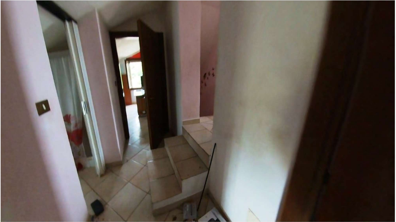
Figura 20 Interni primo piano