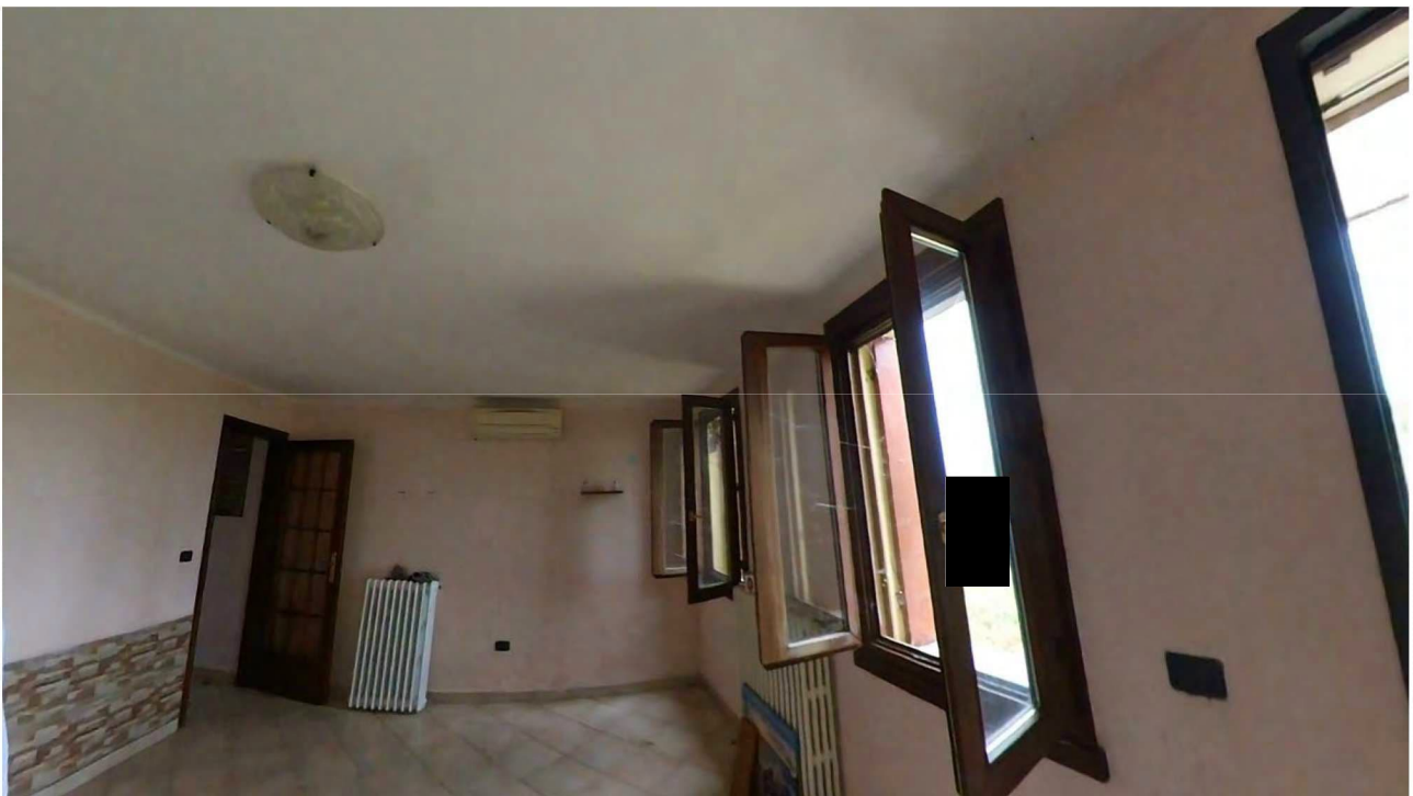
Figura 9 Interni piano terra