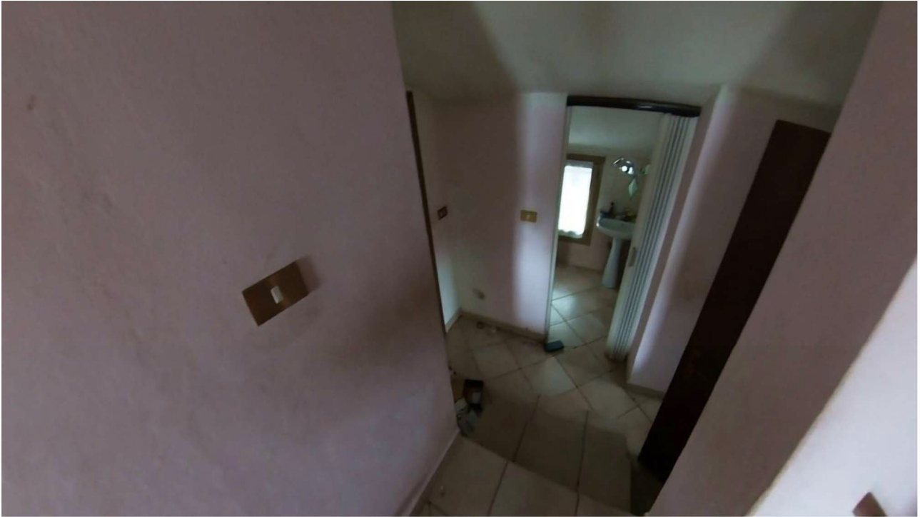
Figura 18 Interni primo piano