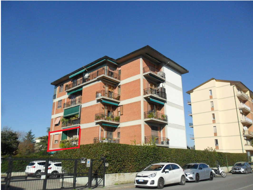
FOTO 01 – Ripresa fotografica dell'immobile con individuazione del bene oggetto di procedura