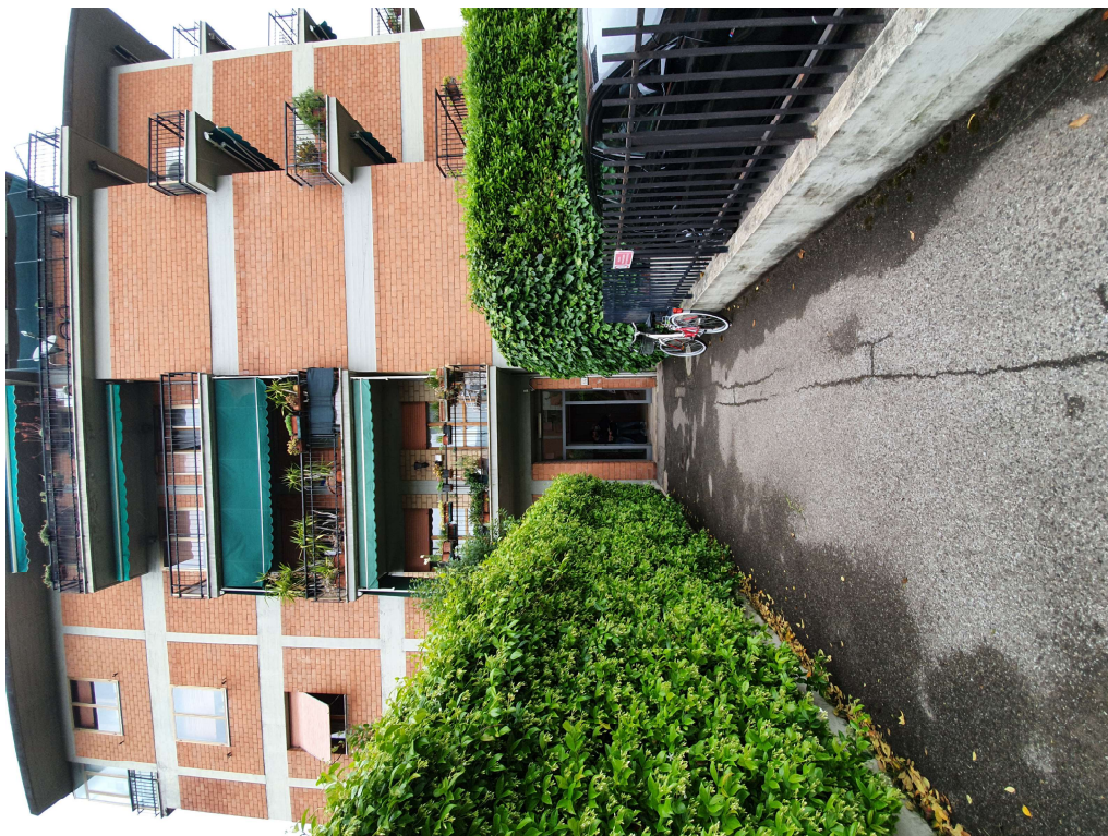
FOTO 02 – Ripresa fotografica dell'accesso alle scale condominiali con sopra il balcone della zona cucina del bene oggetto di perizia