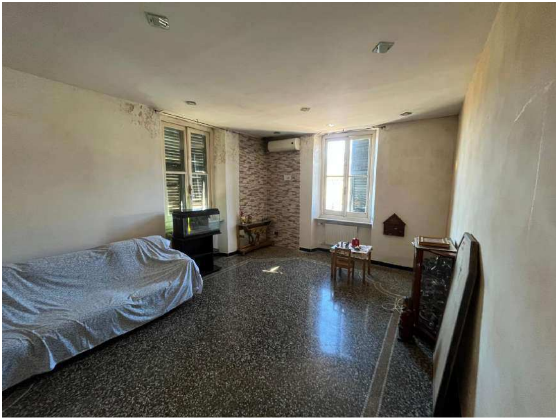
FOTOGRAFIA N°7 Vista della zona soggiorno