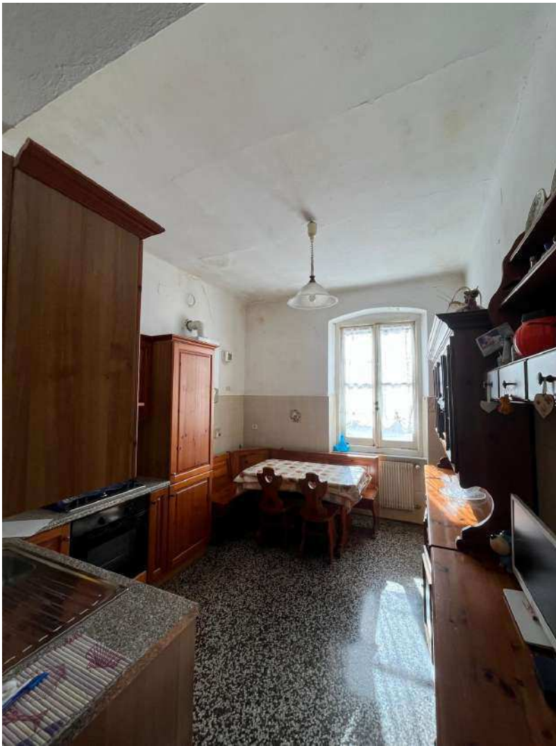
FOTOGRAFIA N°9 Vista della cucina