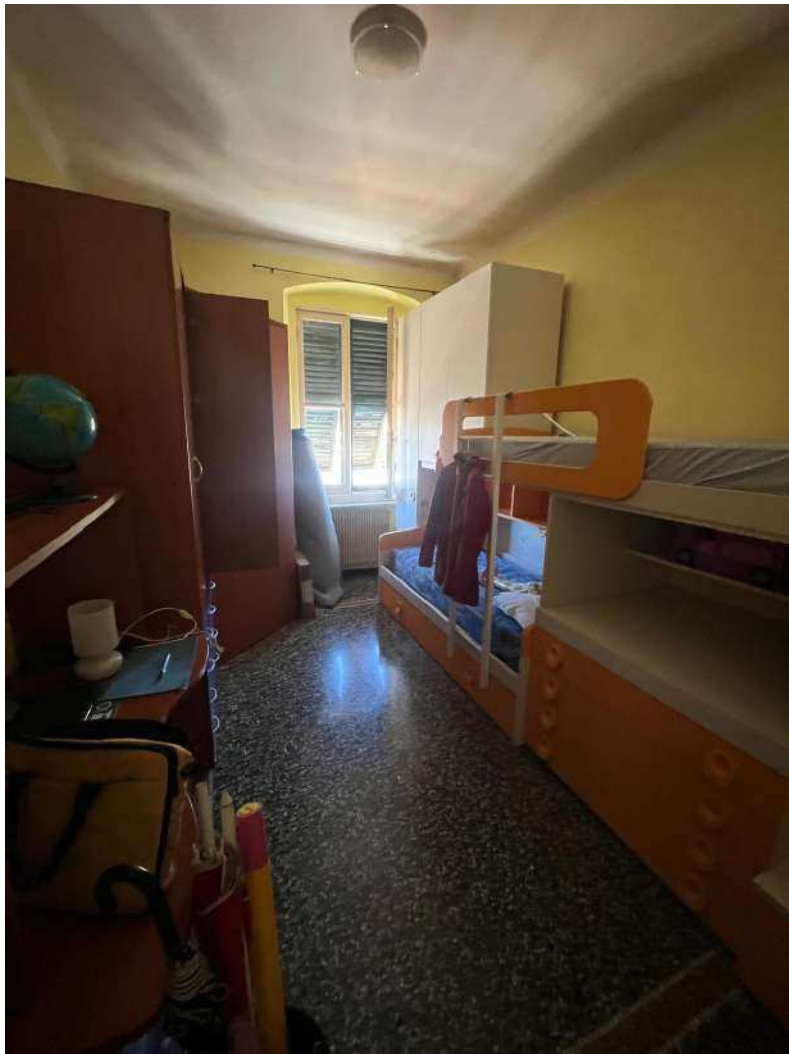
FOTOGRAFIA N°11 Vista della cameretta