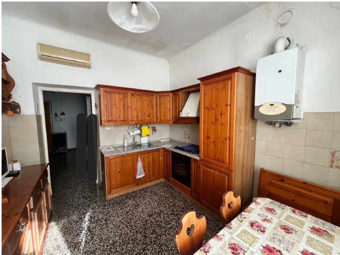
FOTOGRAFIA N°10 Ulteriore vista della cucina