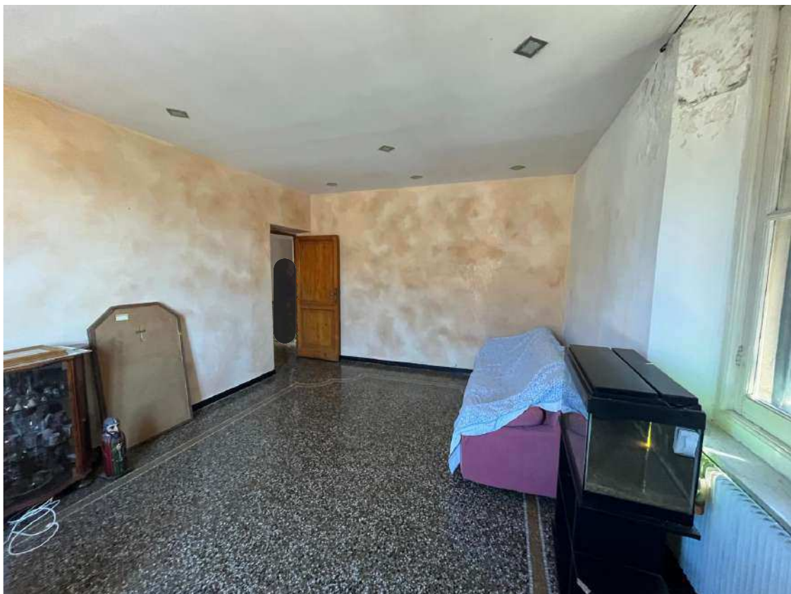
FOTOGRAFIA N°8 Ulteriore vista della zona soggiorno