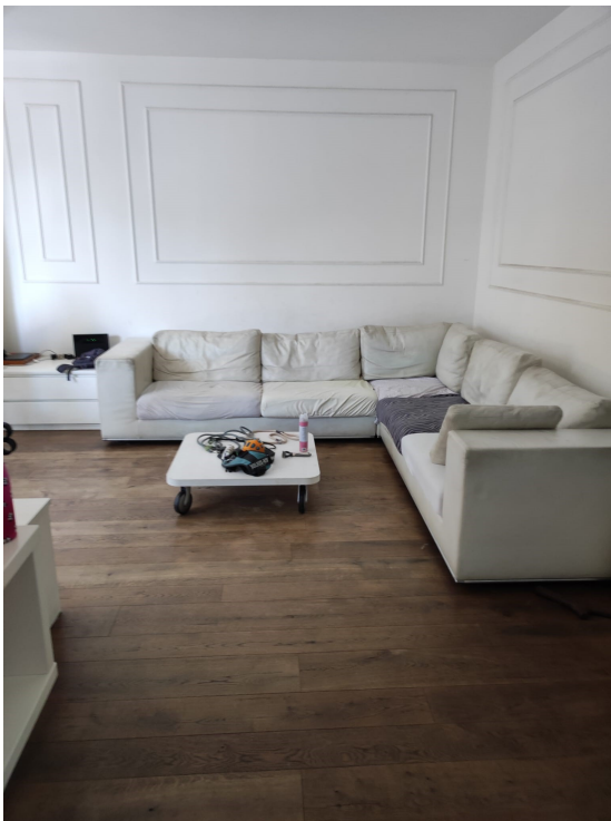
Soggiorno (p. 1°)