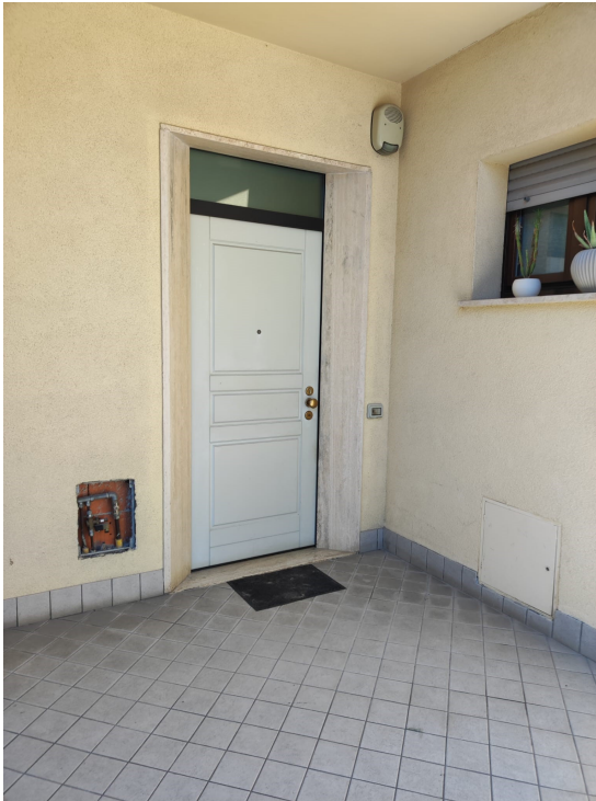
Ingresso esterno all'unità abitativa (p. 1°)