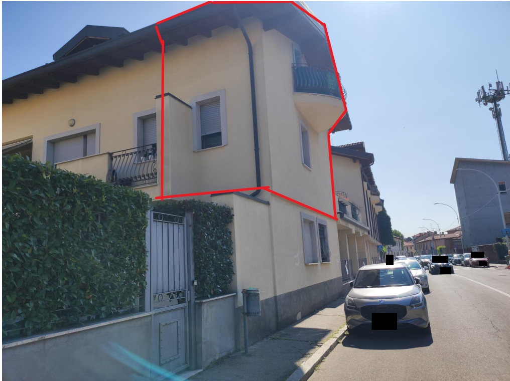
Prospetti su Via San Michele e identificazione dell'unità abitativa