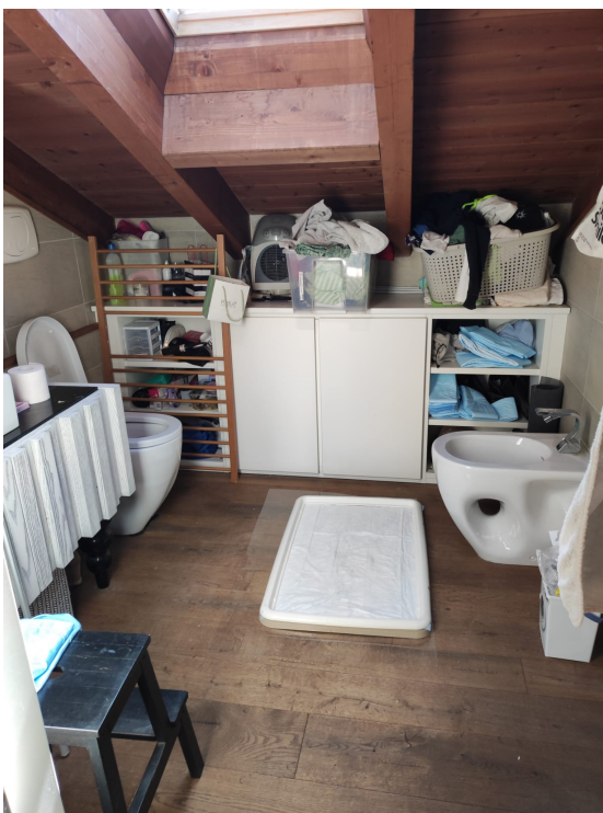
“Sgombero” (wc) - p. sottotetto