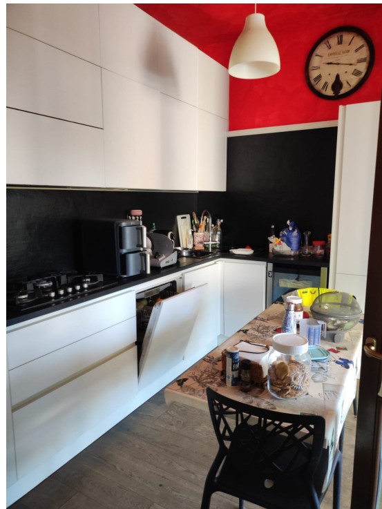
Cucina (p. 1°)