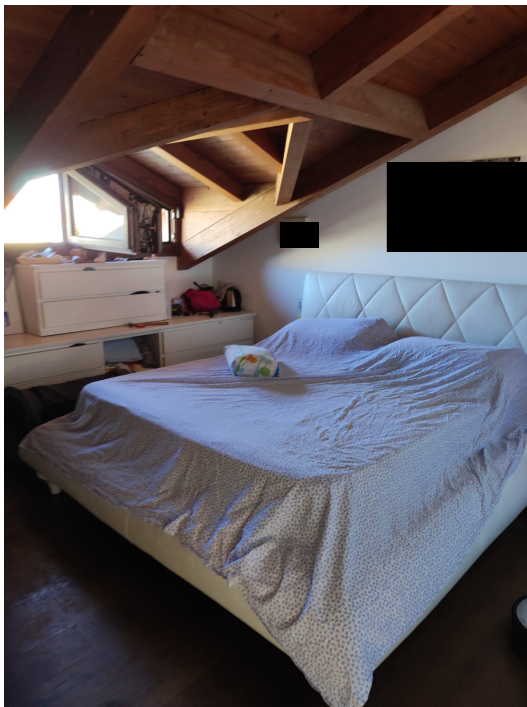
“Sgomberi” (camera e studio) - p. sottotetto