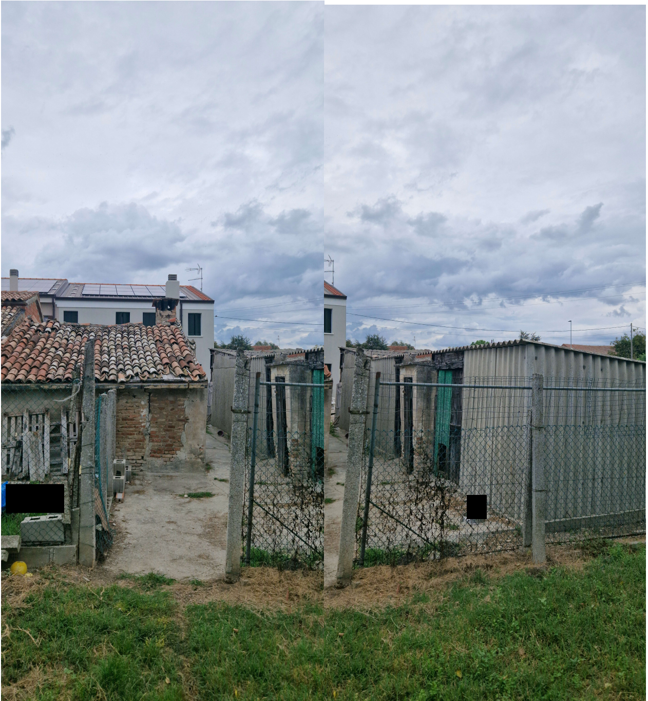
Particolare con possibile amianto