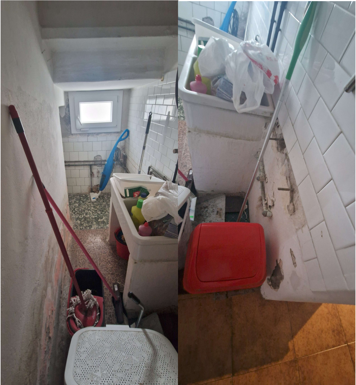
Particolare del sottoscala