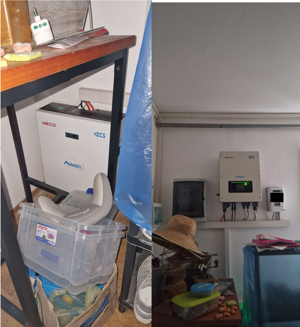
Inverter e batterie del fotovoltaico