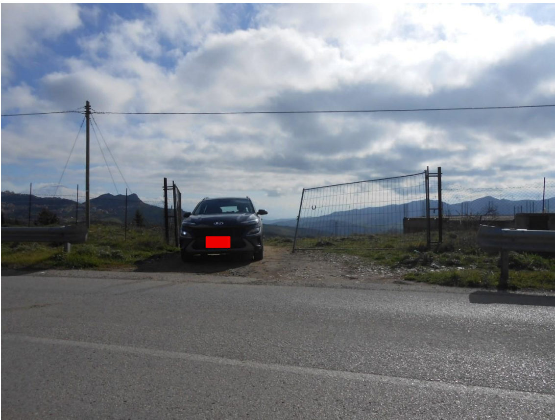
Foto passo carraio

Il passo carraio esistente, dovrà in ogni caso rispettare, le distanze di visibilità previste ai sensi del Decreto del Ministero delle Infrastrutture e dei Trasporti del 19.04.06, punto 4.6 (triangolo di visibilità) e del D.M. 05.11.2001 (distanza di visibilità per l'arresto).