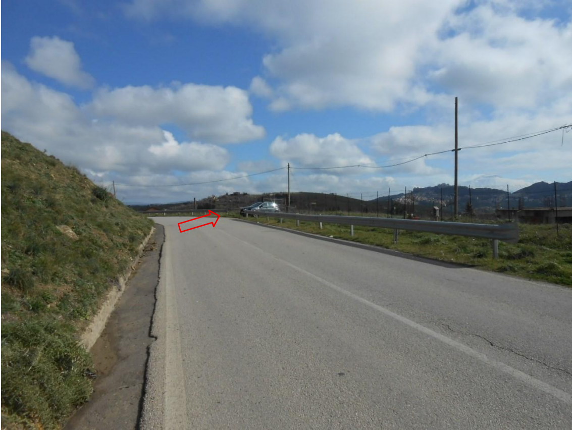
Foto passo carraio