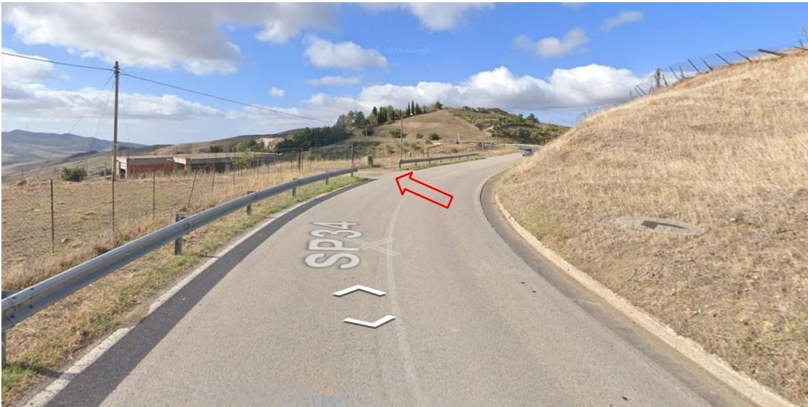
Foto passo carraio