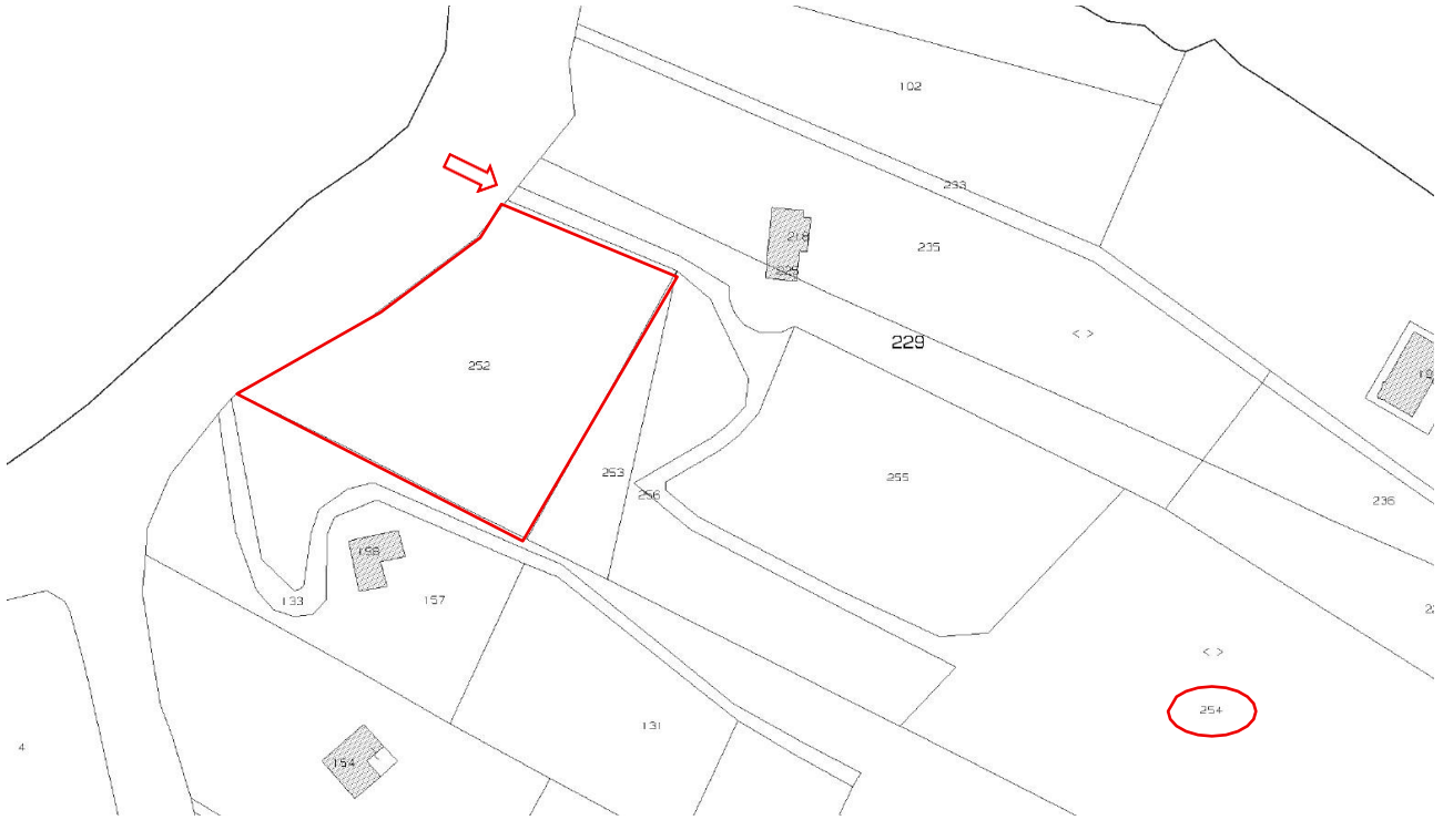
Stralcio mappa catastale al 01.01.2014