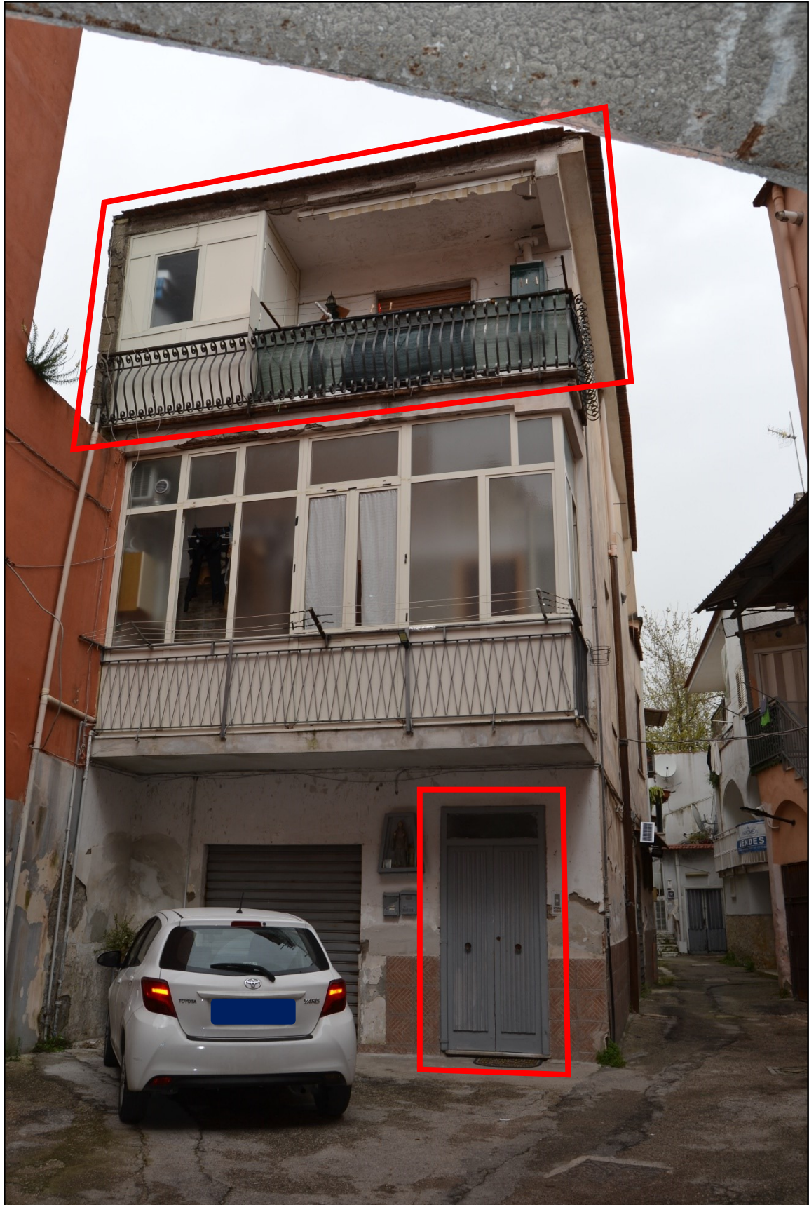
Foto 1: Vista dalla corte comune (in evidenza l'unità immobiliare pignorata ed il portone di ingresso al vano scale del fabbricato)