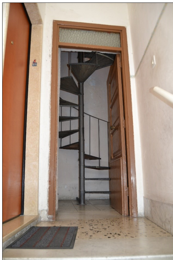
Foto 3: Pianerottolo al primo piano e scala che conduce al secondo piano del fabbricato