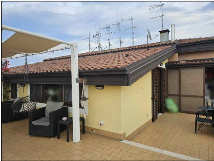
FOTO 19 - Corpo A - Terrazzo e tettoia