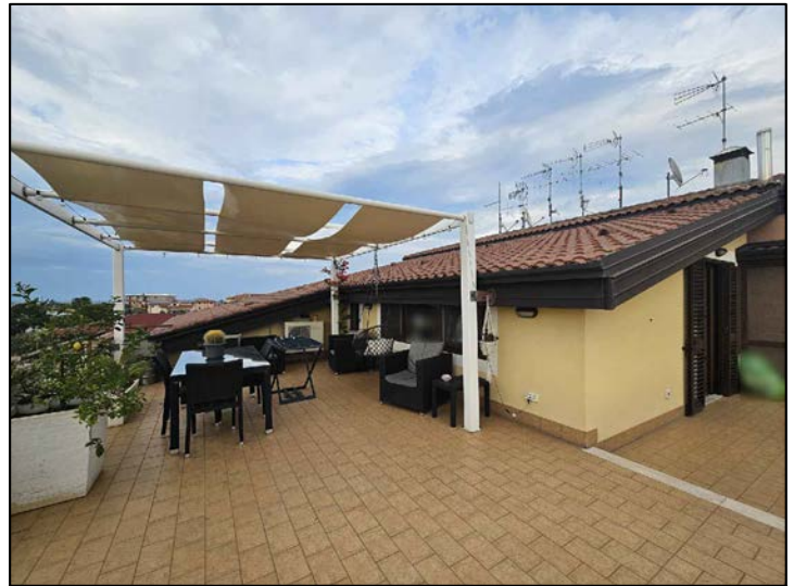
FOTO 20 - Corpo A - Terrazzo e tettoia