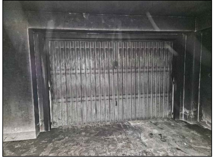
FOTO 24 - Corpo B - Interni Box Auto