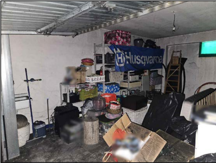
FOTO 25 - Corpo B - Interni Box Auto