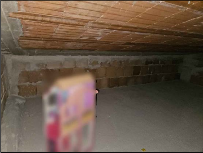
FOTO 23 - Corpo B - Ingresso Box Auto