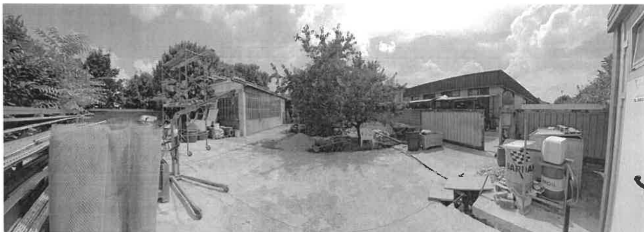
Area Urbana al Sub. 703.