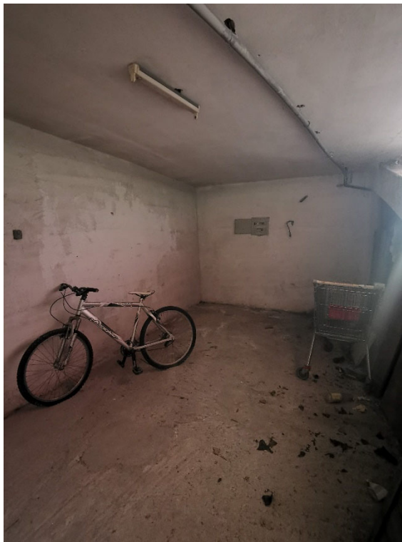
Punto fotografico 3