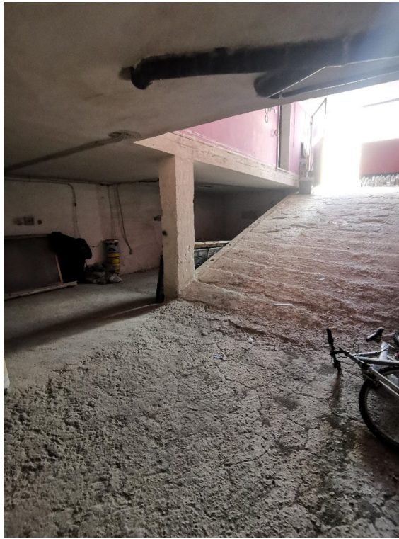
Punto fotografico 2