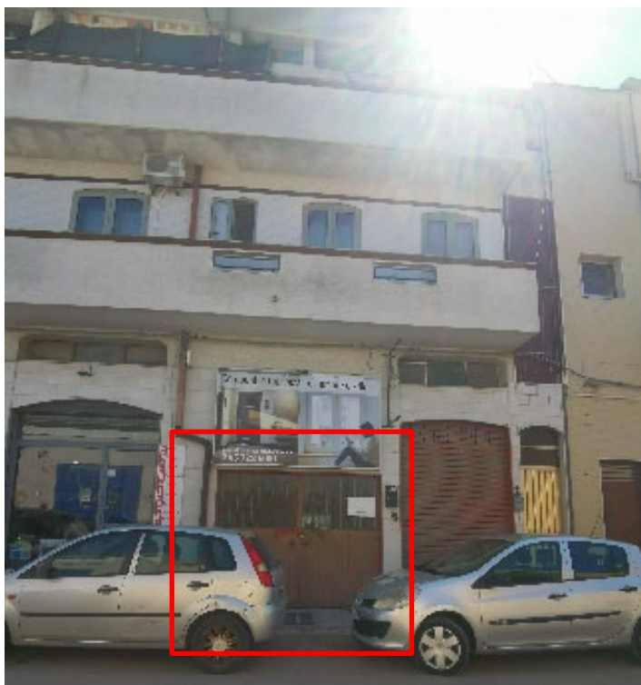
PROSPETTO FRONTE STRADA