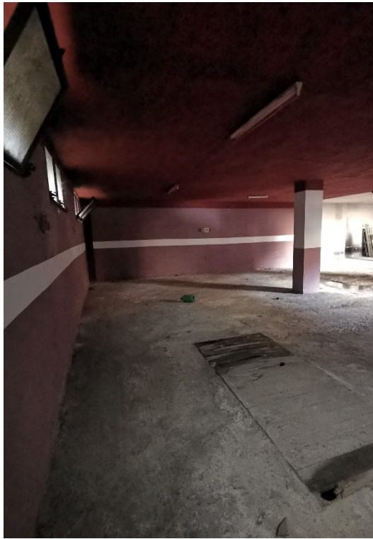
Punto fotografico 8