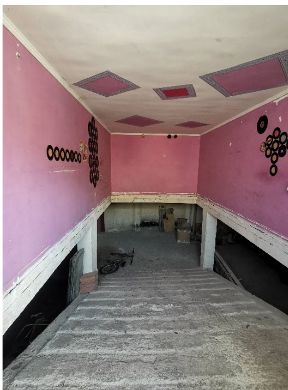
Punto fotografico 1