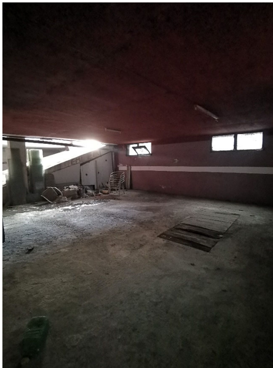
Punto fotografico 7