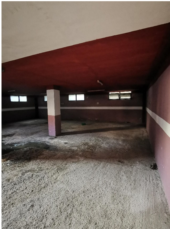
Punto fotografico 5