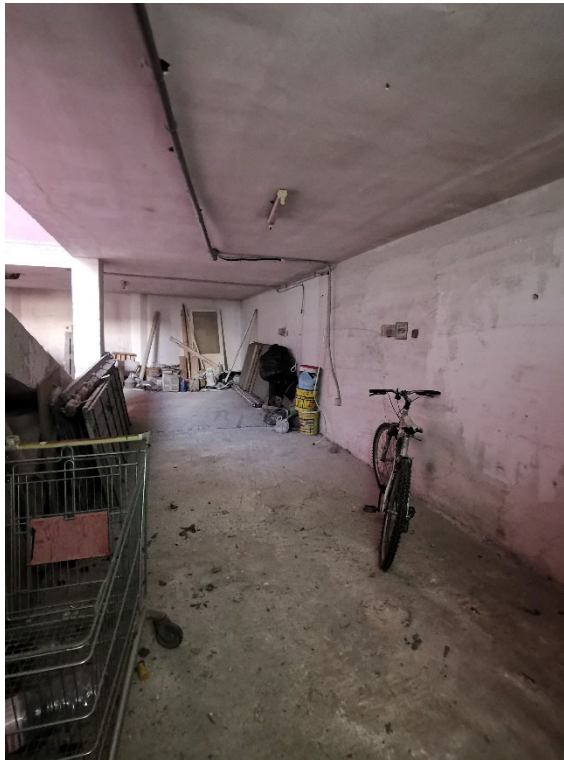
Punto fotografico 4