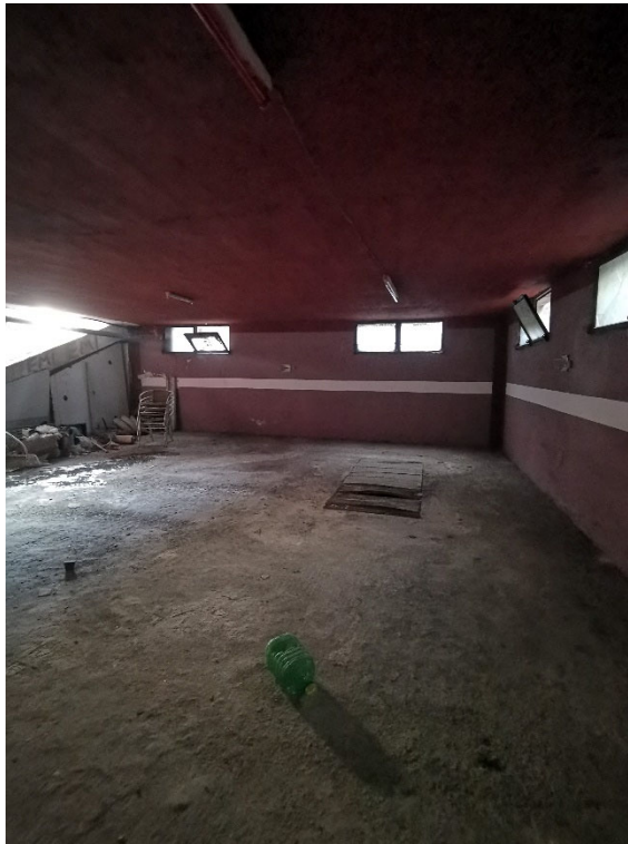
Punto fotografico 6