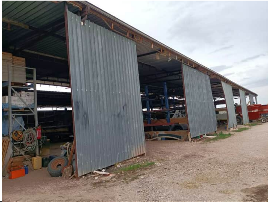
Struttura precaria presente sul terreno