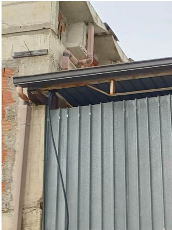
Demolizione di parte della struttura in c.a per ancorare la struttura precaria all'immobile principale

Via Ten. Cataldo, 82 - 95041 CALTAGIRONE (CT)