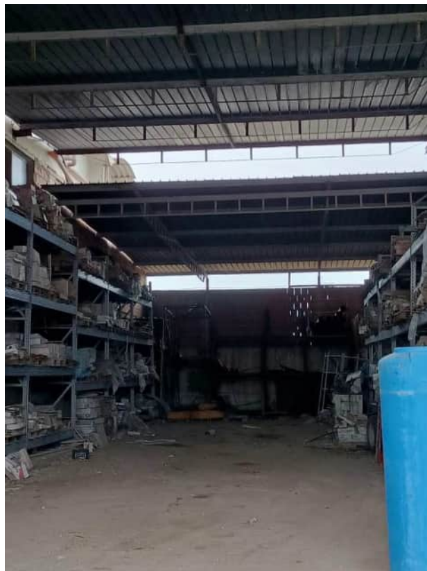
Vista delle due falde di copertura