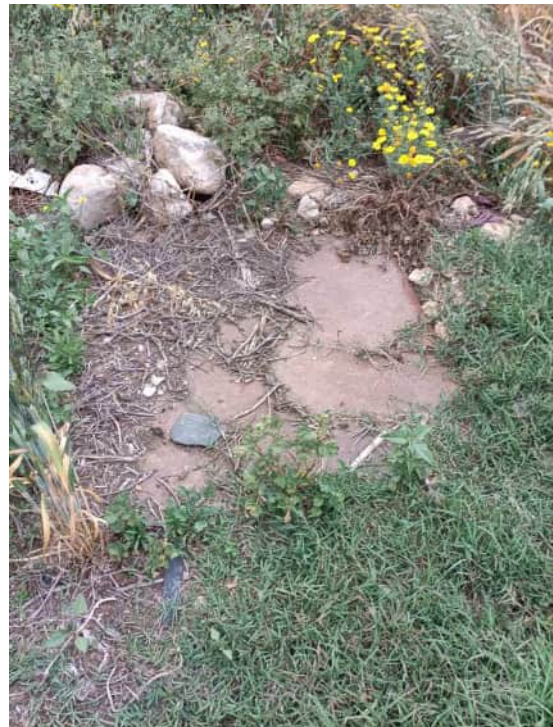
Fossa settica tipo Imohff limitrofa al prospetto nord (coperchio)