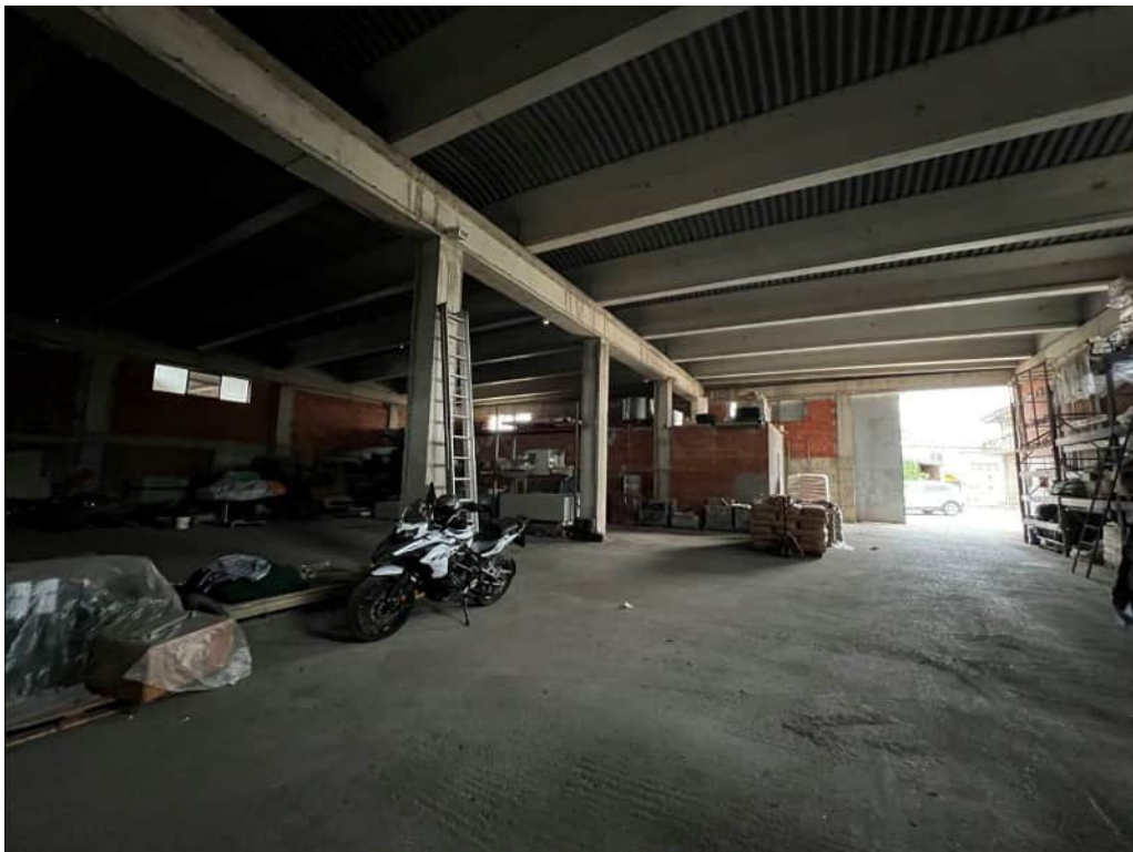
Vista sull'ingresso carrabile