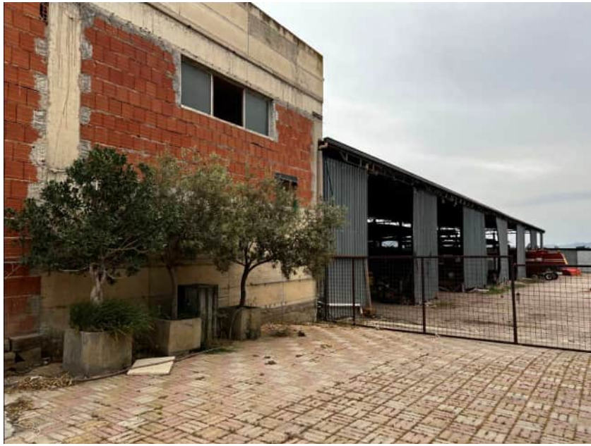
Prospetto degl'immobili sulla Via Libertà e vista del terreno occupato da tettoia

Via Ten. Cataldo, 82 - 95041 CALTAGIRONE (CT)