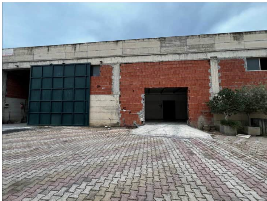
Ingressi degli immobili sulla Via Libertà