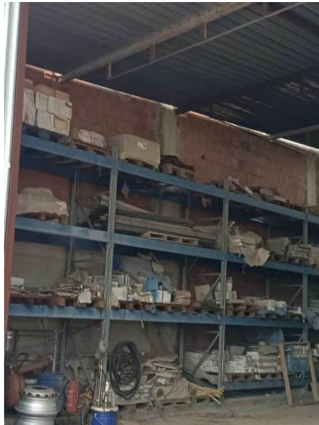
Ancoraggi non idonei