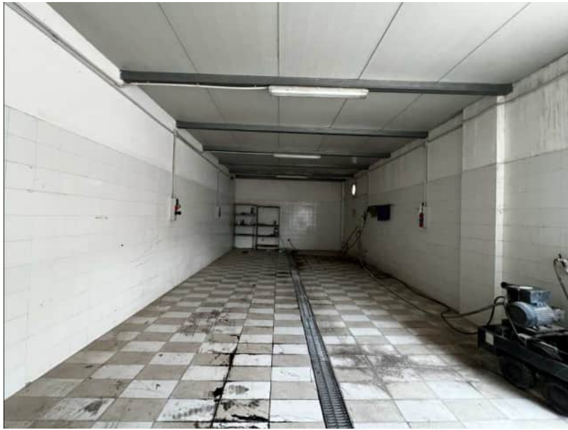
Vista della copertura realizzata con struttura metallica e pannelli coibentati e canaletta di scolo

Via Ten. Cataldo, 82 - 95041 CALTAGIRONE (CT)