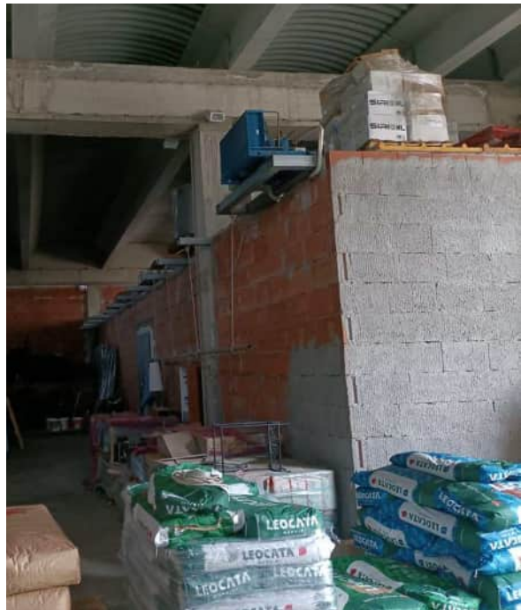
Vista dell'immobile distinto in catasto al foglio 45 part.293 sub.2 ricavato all'interno del sub.1