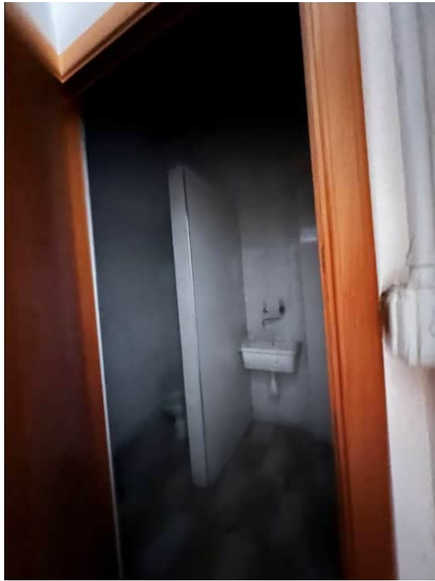
Antibagno e servizio

Via Ten. Cataldo, 82 - 95041 CALTAGIRONE (CT)