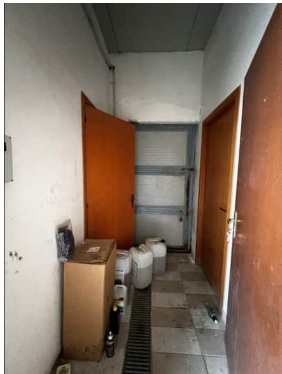
Disimpegno dell'area dei servizi