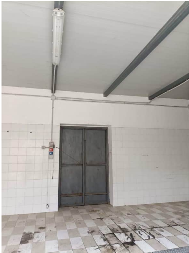
Apertura che mette in comunicazione il suddetto immobile con il sub. 1