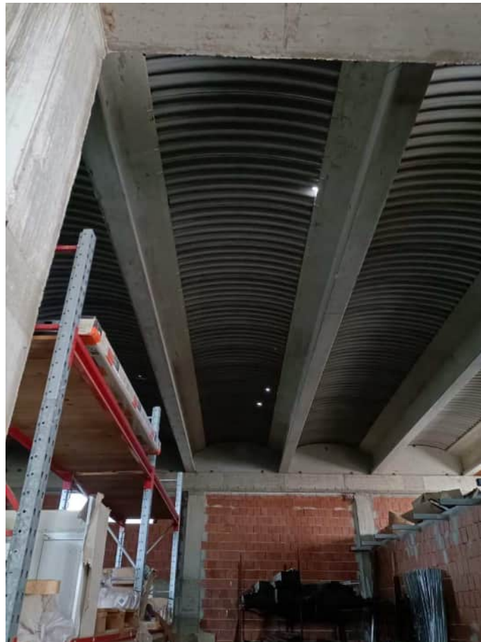
Vista della copertura e delle aree con fori che permettono l'ingresso delle acque meteoriche