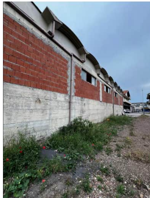
Vista del prospetto nord da due angolazioni