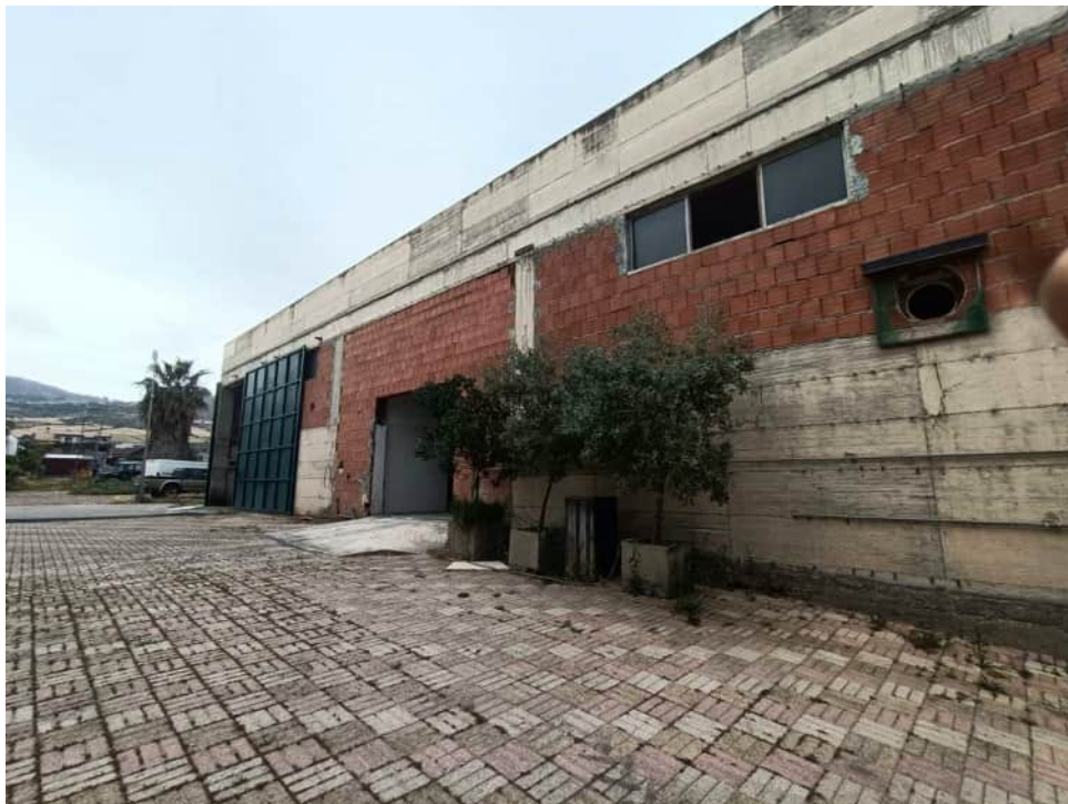
Prospetto principale dell'immobile oggetto del fallimento

Via Ten. Cataldo, 82 - 95041 CALTAGIRONE (CT)