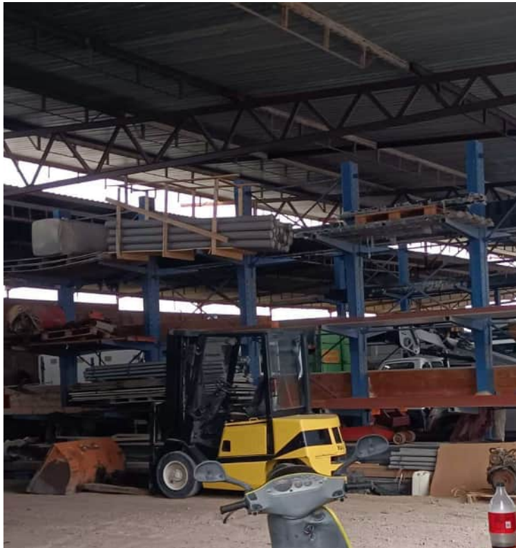
Particolare della struttura di copertura

Via Ten. Cataldo, 82 - 95041 CALTAGIRONE (CT)