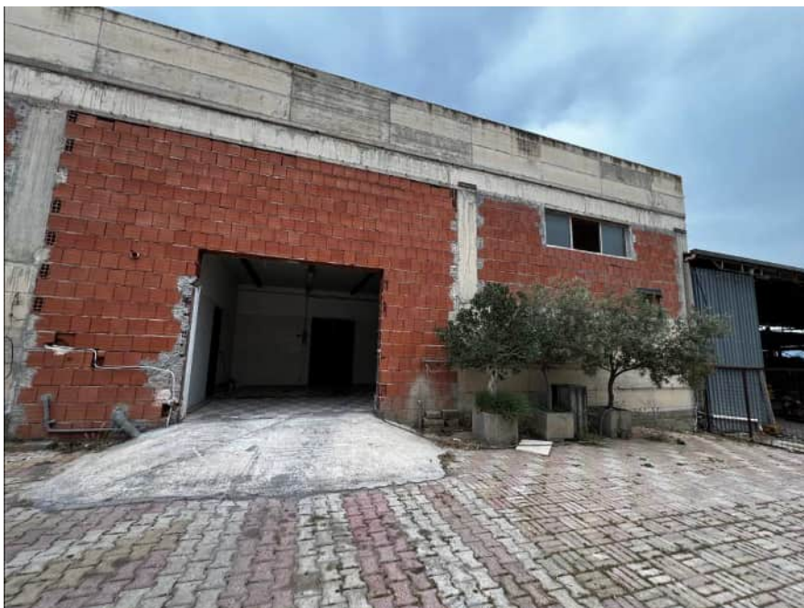
Ingresso dell'immobile sprovvisto di porta