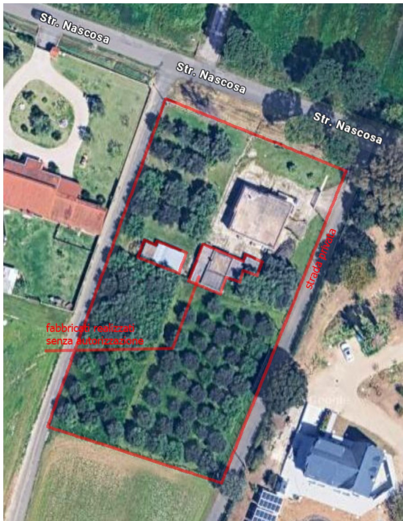
Localizzazione dei Beni n.1 e 2 su base aerofotografica (anno 2025) con individuazione dei fabbricati realizzati senza autorizzazione edilizia e della strada privata di accesso al cortile del Bene 1