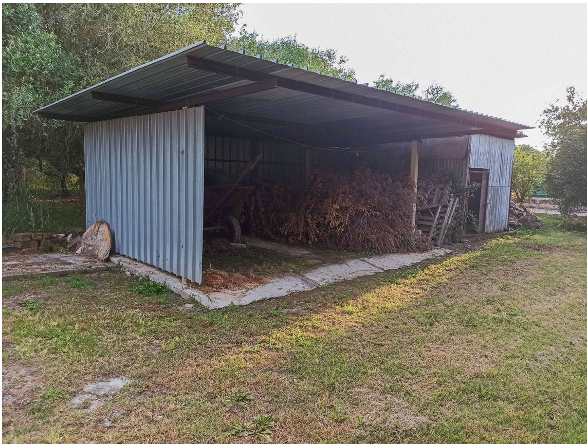
Foto n.21 - vista dei fabbricati A (ricovero attrezzi) e B (tettoia) realizzati senza autorizzazione sul confine SUD-OVEST Foto n.22 - vista dei fabbricato A (ricovero attrezzi) realizzato senza autorizzazione sul confine SUD-OVEST