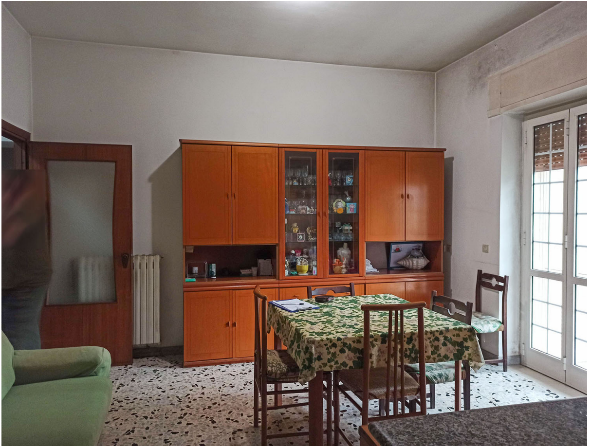
Foto n. 38 - vista della cucina tinello