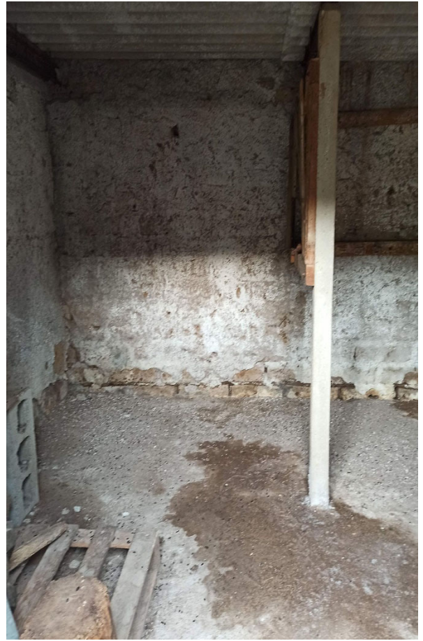
Foto n. 23 – vista degli interni del fabbricato A (ricovero attrezzi) Foto n. 24, 25 – vista degli interni del fabbricato C (pollaio/porcilaia)