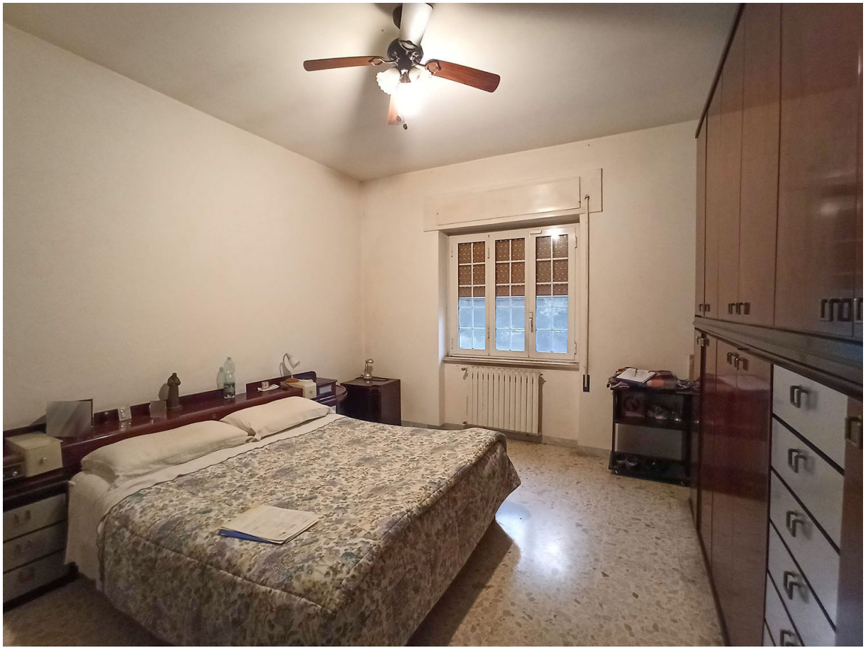
Foto n. 41 , 42 - viste della camera matrimoniale