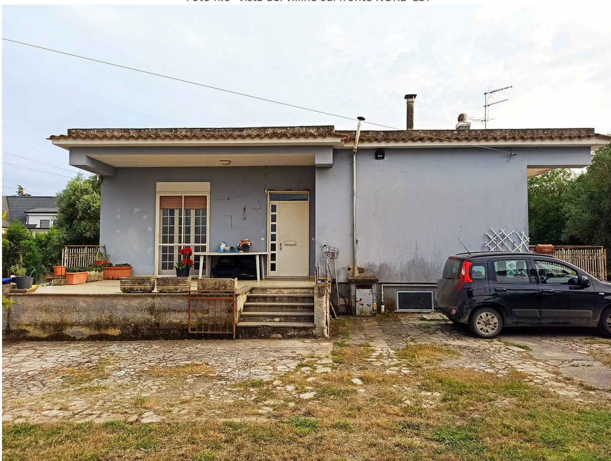
Foto n.6- vista del villino sul fronte NORD-EST