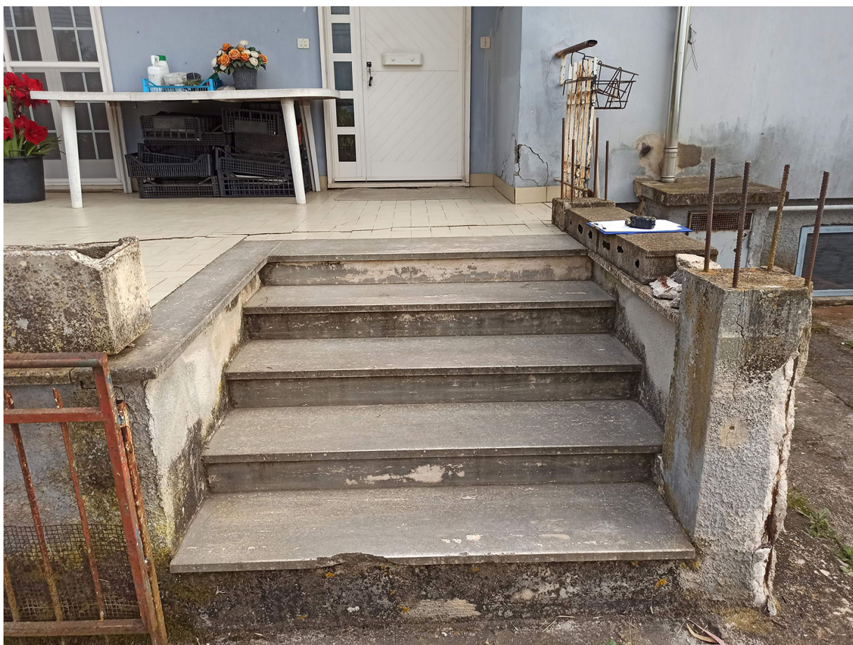
Foto n.9- vista della terrazza sul versante NORD-EST su basamento rialzato con la pavimentazione lesionata ed i gradini in stato di degrado