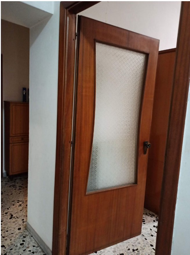
Foto n. 53 - dettaglio della porta con vetrina della cucina- tinello