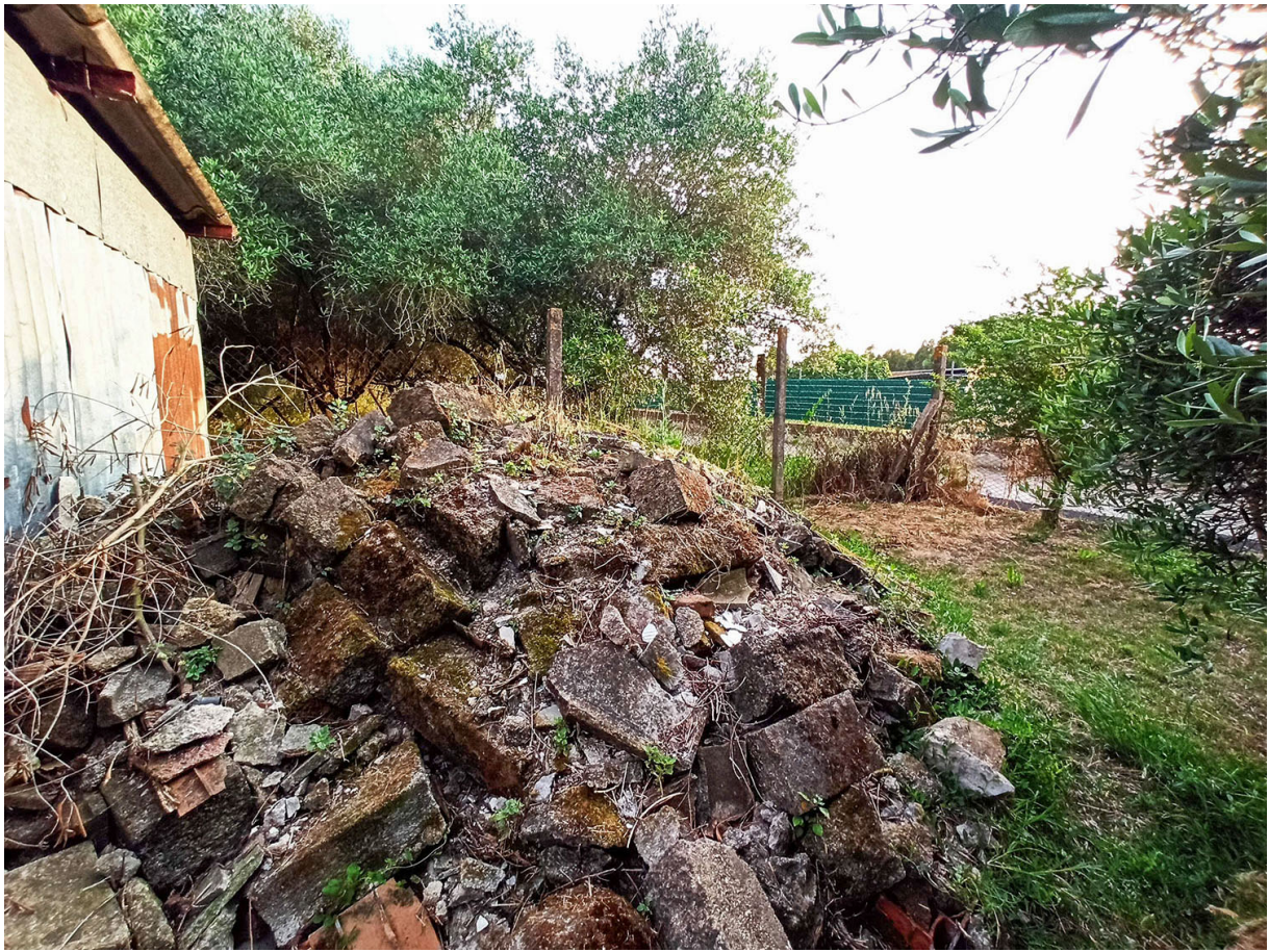
Foto n.32 - vista del cumulo di pietre e laterizi depositato in prossimità del confine SUD-OVEST