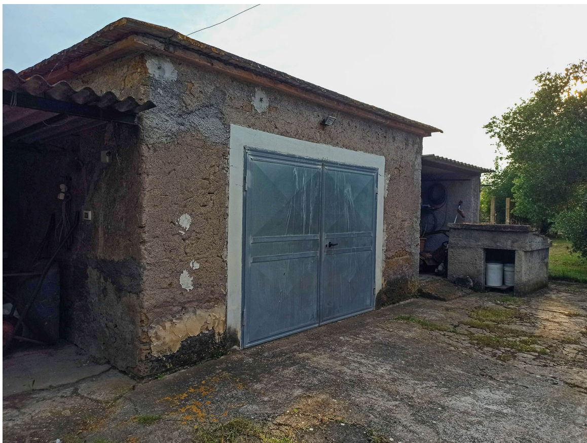
Foto n.18 - vista dei fabbricati E (deposito/autorimessa) – D (tettoia) realizzati senza autorizzazione sul confine SUD-OVEST