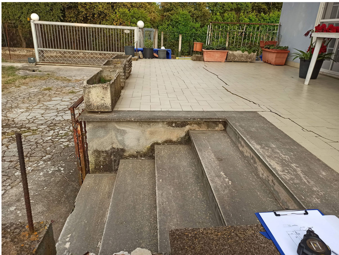
Foto n.8- vista della terrazza sul versante NORD-EST su basamento rialzato con la pavimentazione lesionata ed i gradini in stato di degrado