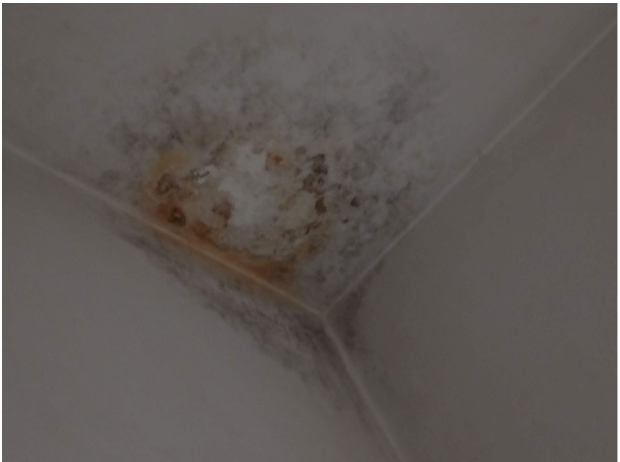
Foto n. 55 - dettaglio delle macchie di umidità per infiltrazione dal lastrico di copertura