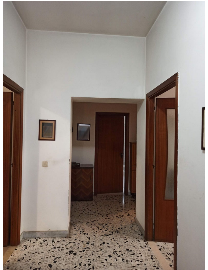
Foto n. 33 - vista dell'ingresso Foto n. 34 - vista del disimpegno Foto n. 35 - vista del soggiorno-pranzo