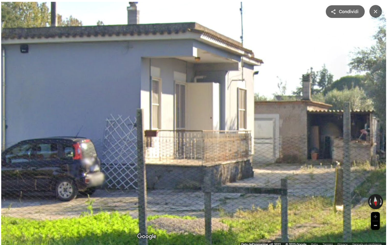
Foto n.14- vista del villino sul lato NORD - OVEST con la terrazza