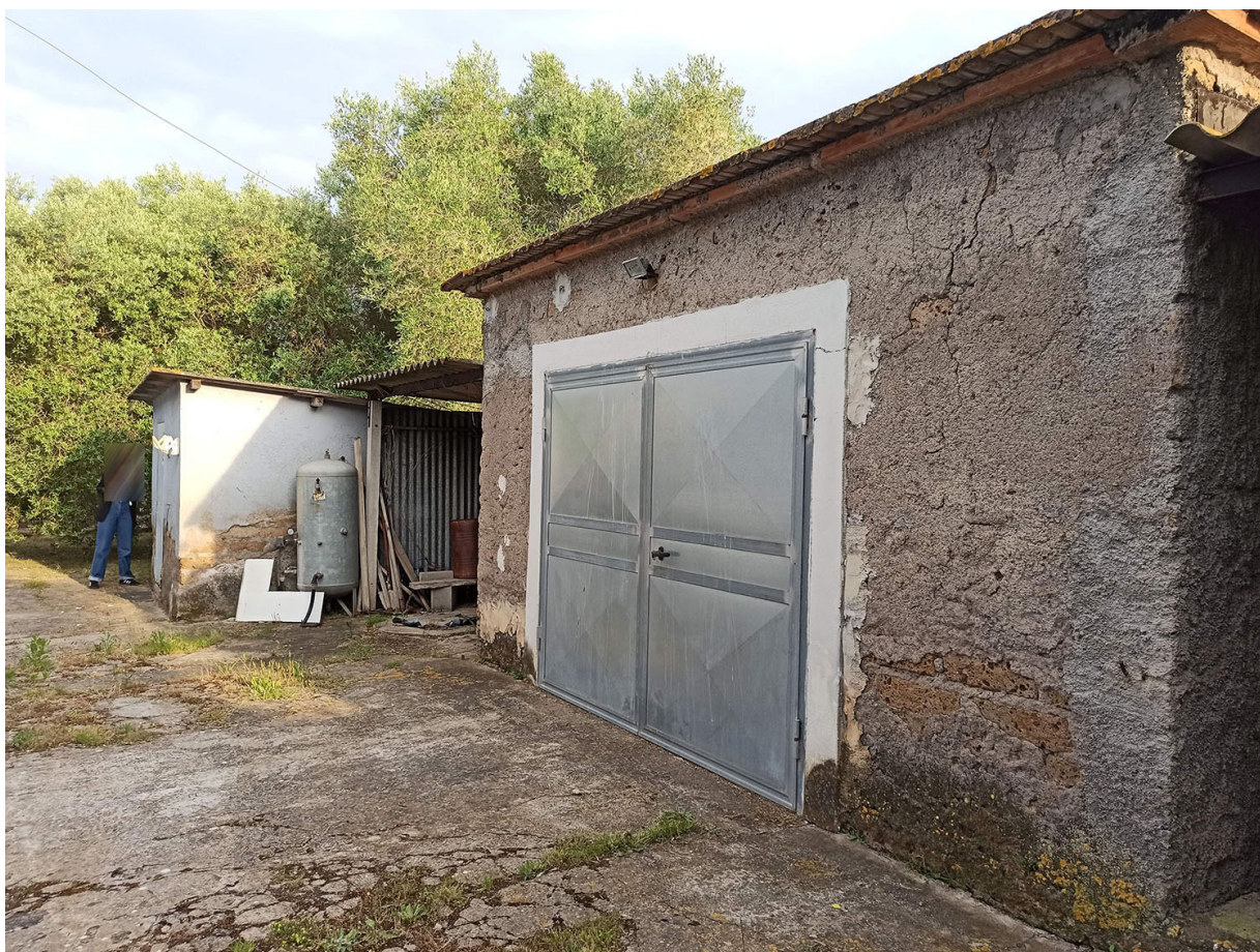
Foto n.17 - vista dei fabbricati E (deposito/autorimessa) – F (tettoia) – G (locale tecnico) realizzati senza autorizzazione sul confine SUD-OVEST