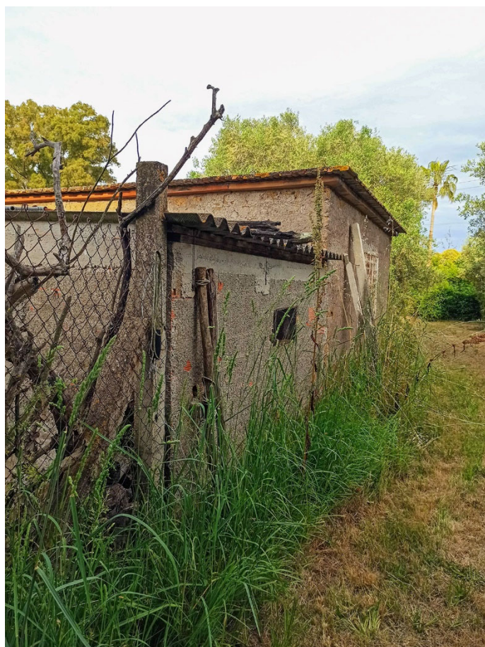
Foto n. 60 - vista del confine recintato del terreno sul versante SUD-OVEST