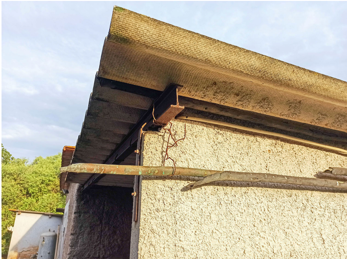
Foto n. 29 - dettaglio del fabbricato D (tettoia) copertura in cemento amianto, muratura in blocchi di cls e travi in acciaio