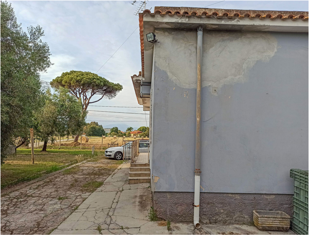
Foto n.13- vista del villino in direzione SUD-EST con il paramento murario in stato di degrado per umidità ed infiltrazioni dal lastrico solare