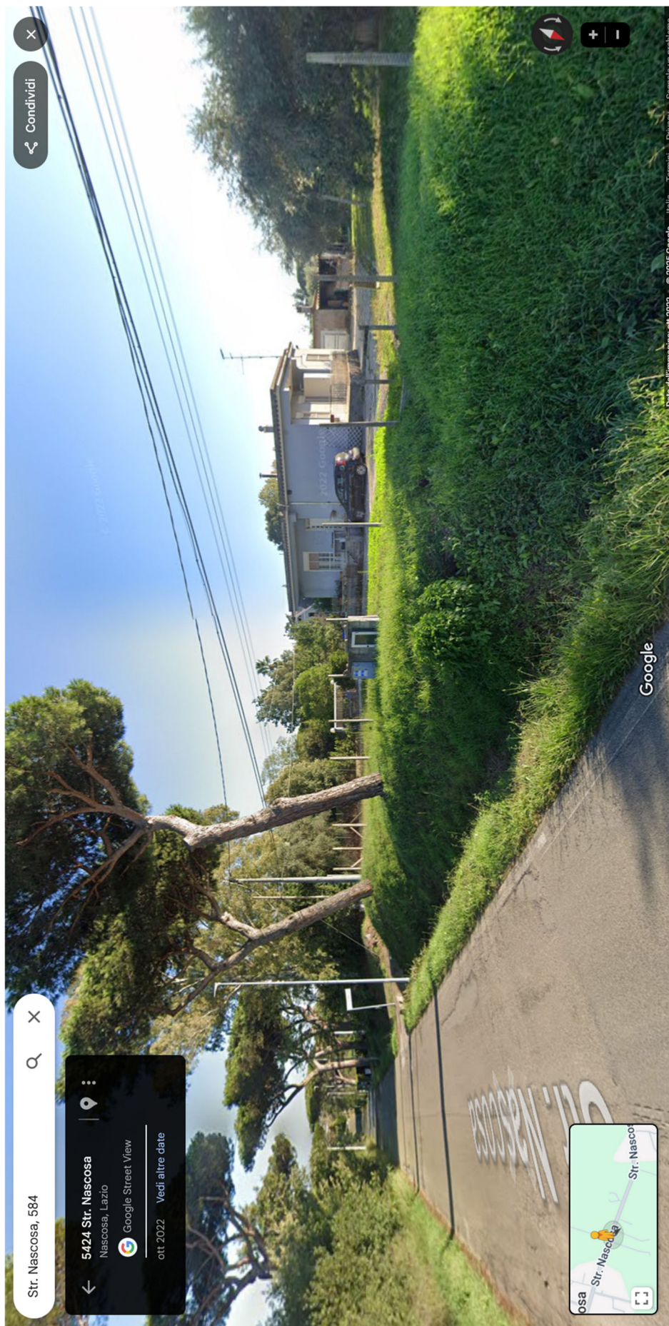
Foto n.1- Bene n.1- vista del villino dalla strada Nascosa