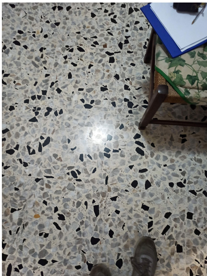
Foto n. 47 , 48 - dettagli della pavimentazione in marmettoni e marmo chiaro