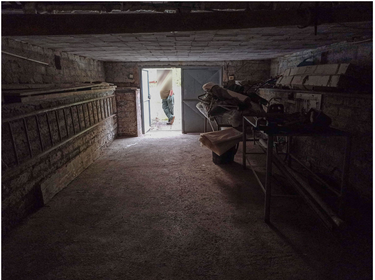
Foto n. 56, 57 - viste dell'interno del deposito al piano seminterrato realizzato in difformità edilizia