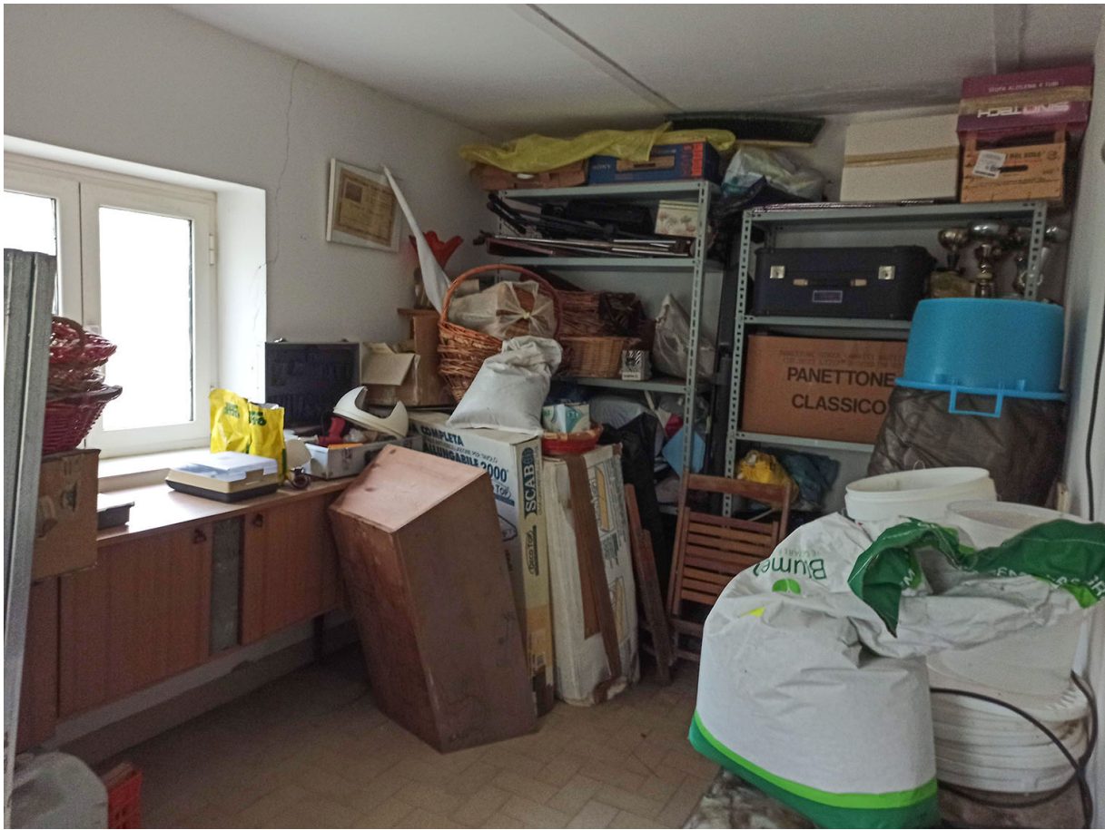
Foto n. 28 – vista degli interni del fabbricato E (deposito/autorimessa)