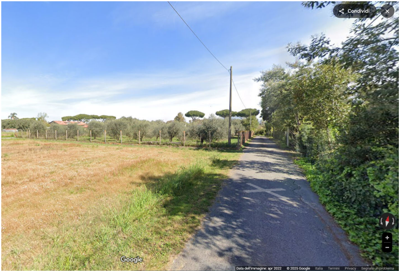
Foto n. 58 , 59 - vista del confine recintato del terreno dalla strada privata sul versante SUD-OVEST