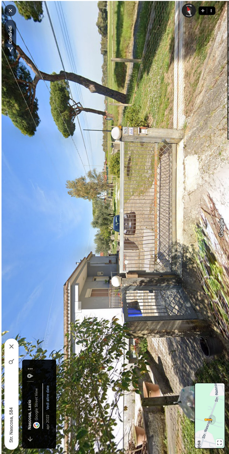
Foto n.4- Bene n.1- vista del villino e del cortile con il cancello di ingresso in primo piano