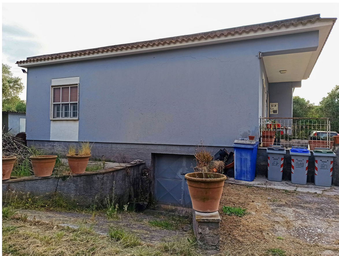
Foto n.10- vista del villino in direzione SUD-EST con la rampa di accesso al piano seminterrato