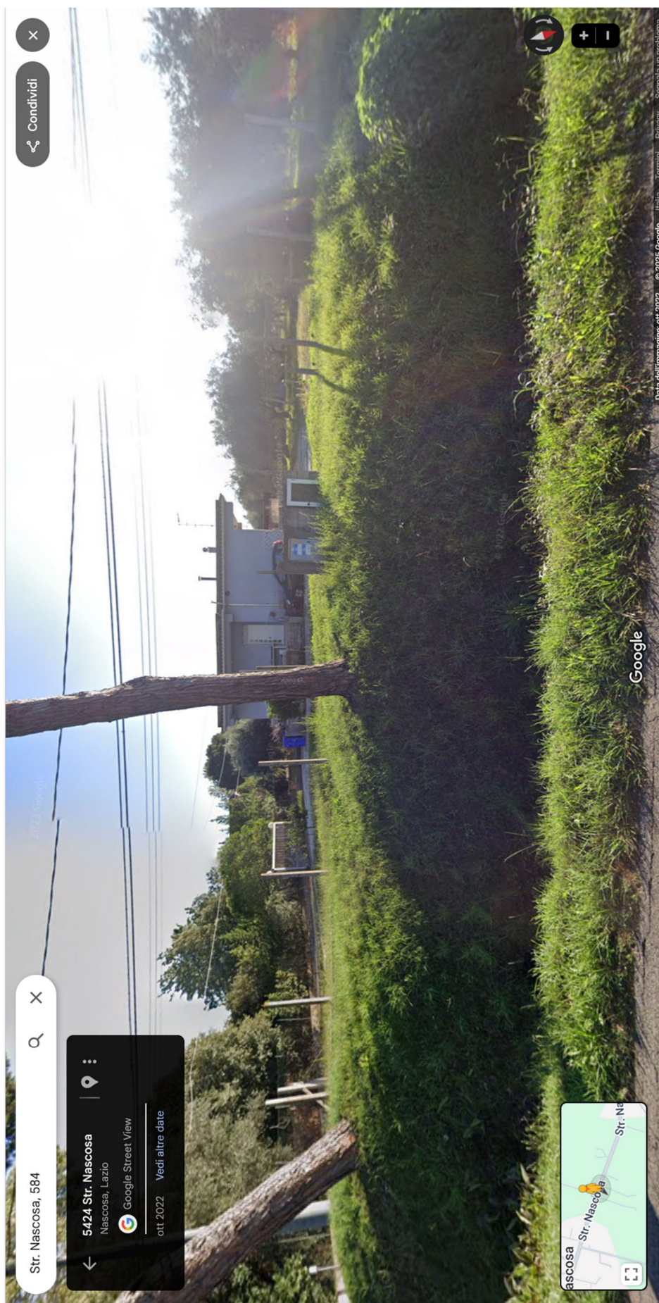
Foto n.2- Bene n.1- vista del villino dalla strada Nascosa con in primo piano il fosso di scolo delle acque