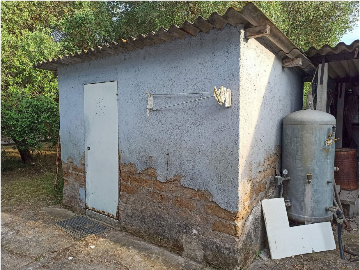
Foto n.15 - vista del fabbricato G (locale tecnico) realizzato senza autorizzazione sul confine SUD-OVEST Foto n.16 - vista del fabbricato F (tettoia) realizzato senza autorizzazione sul confine SUD-OVEST