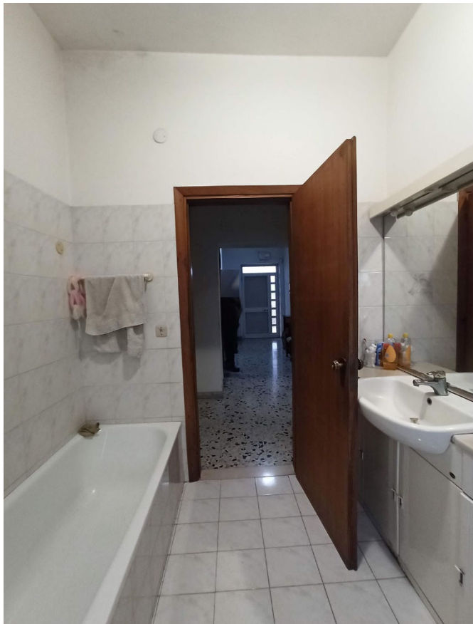
Foto n. 45 , 46 - viste del bagno