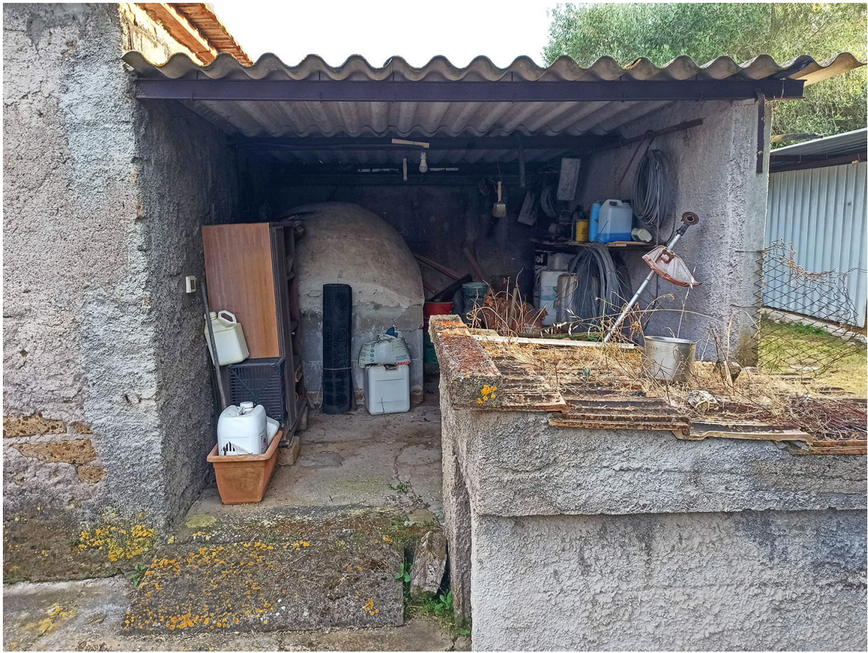
Foto n.19 - vista dei fabbricato D (tettoia) realizzato senza autorizzazione sul confine SUD-OVEST Foto n.20 - vista dei fabbricati C (pollaio/porcilaia) – D (tettoia) realizzati senza autorizzazione sul confine SUD-OVEST