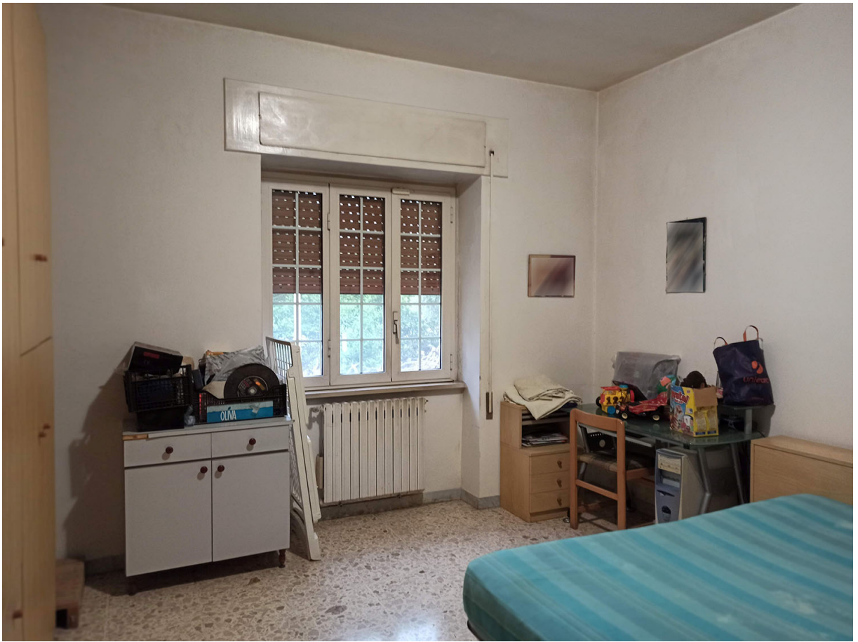
Foto n. 43 , 44 - viste della camera doppia