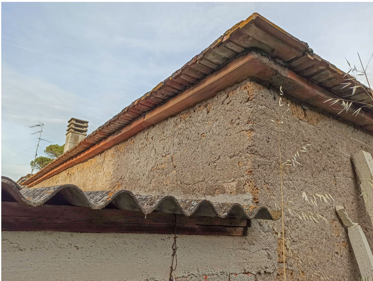
Foto n. 30 - dettaglio dei fabbricati C (pollaio/porcilaia) con copertura in cemento amianto, la muratura in pietra di tufo e travi in legno e E (deposito/autorimessa) con copertura in solaio di latero-cemento e tegole di laterizi Foto n.31- vista del cortile con i fabbricati realizzati senza autorizzazione