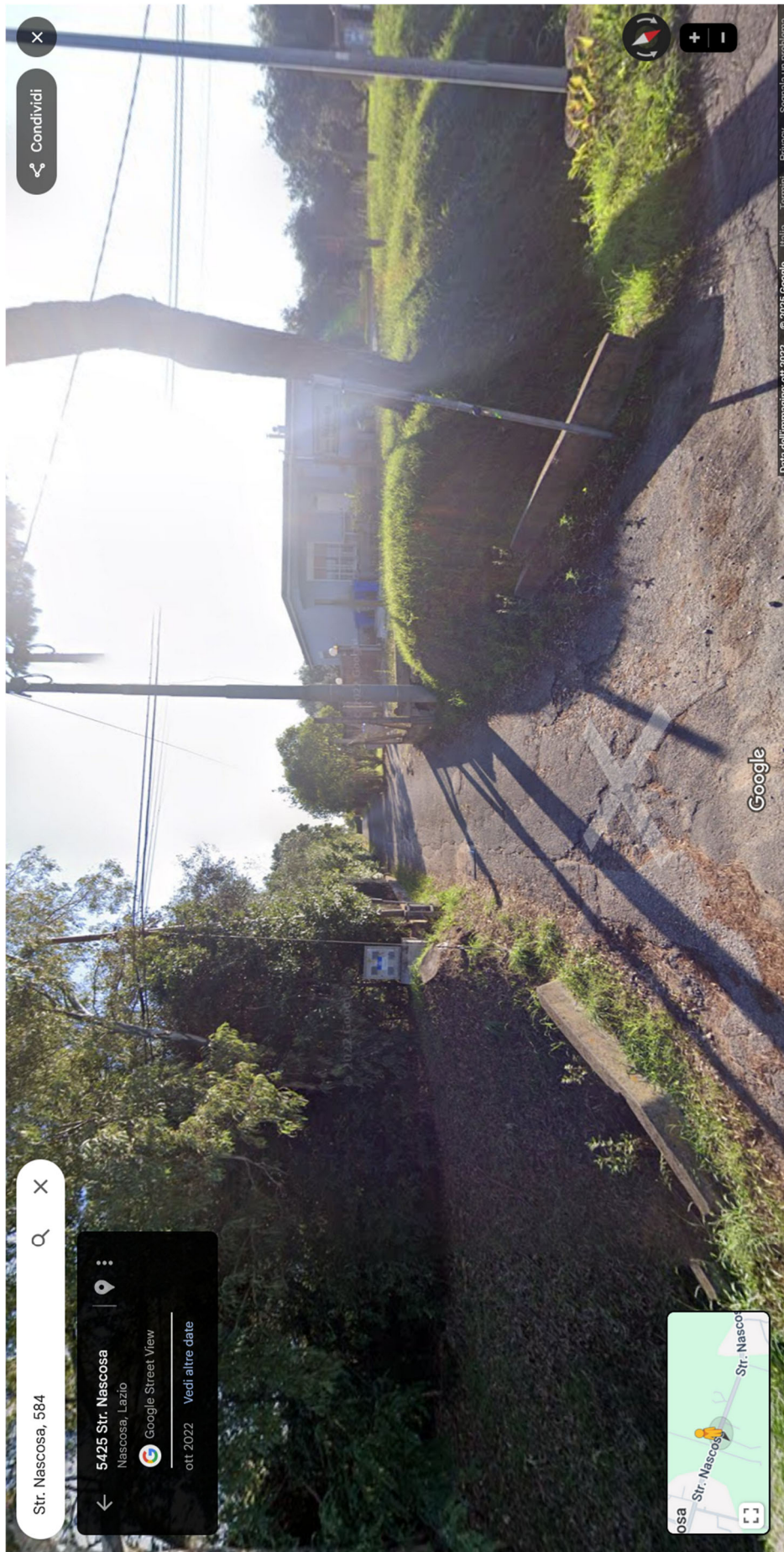
Foto n.3- Bene n.1- vista della strada di accesso al villino dalla strada Nascosa