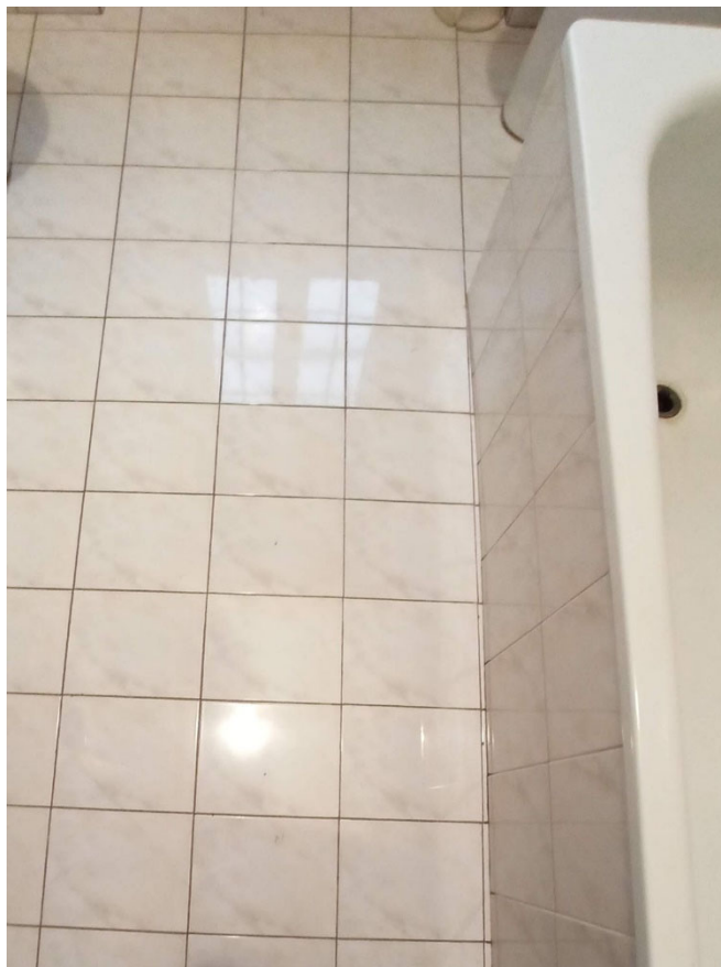
Foto n. 49 , 50 - dettagli della pavimentazione in marmittoni e ceramica del bagno Foto n. 51 , 52 - dettagli degli infissi in alluminio con vetrocamera e del radiatore in ghisa dell'impianto termico