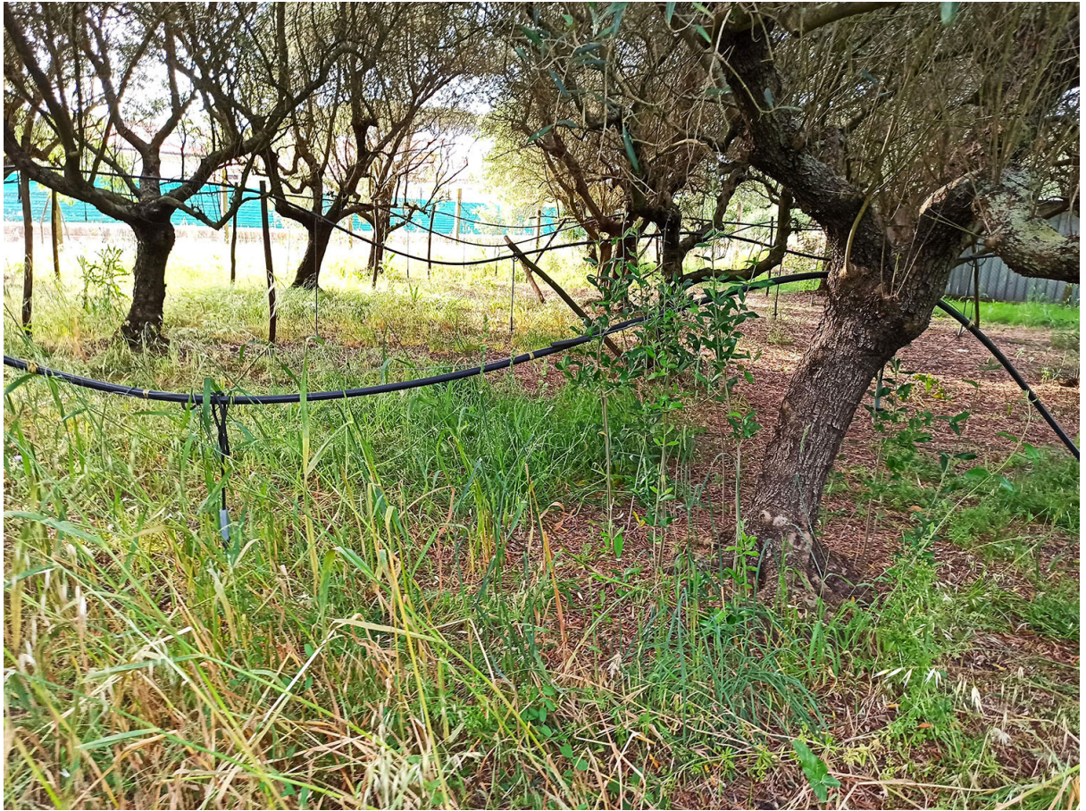
Foto n. 63, 64 - viste del terreno coltivato ad oliveto