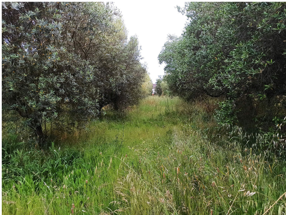
Foto n. 62 - vista del terreno coltivato ad oliveto