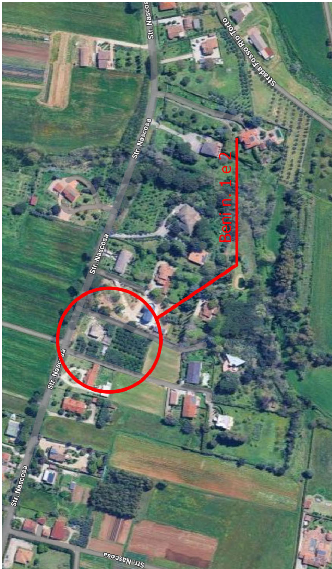
Localizzazione dei Beni n.1 e 2 su base aerofotografica (anno 2025)