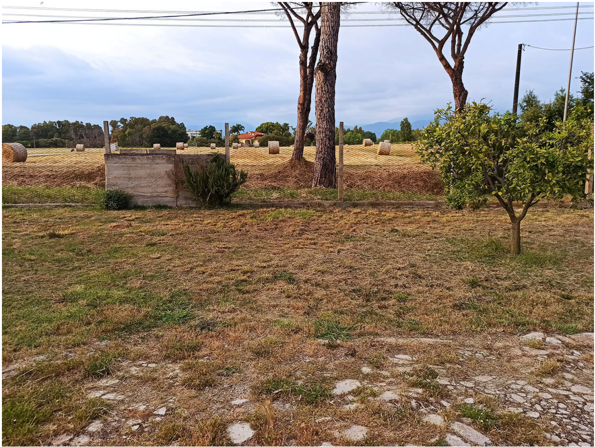
Foto n.7- vista del cortile sul versante NORD-EST con la strada Nascosa