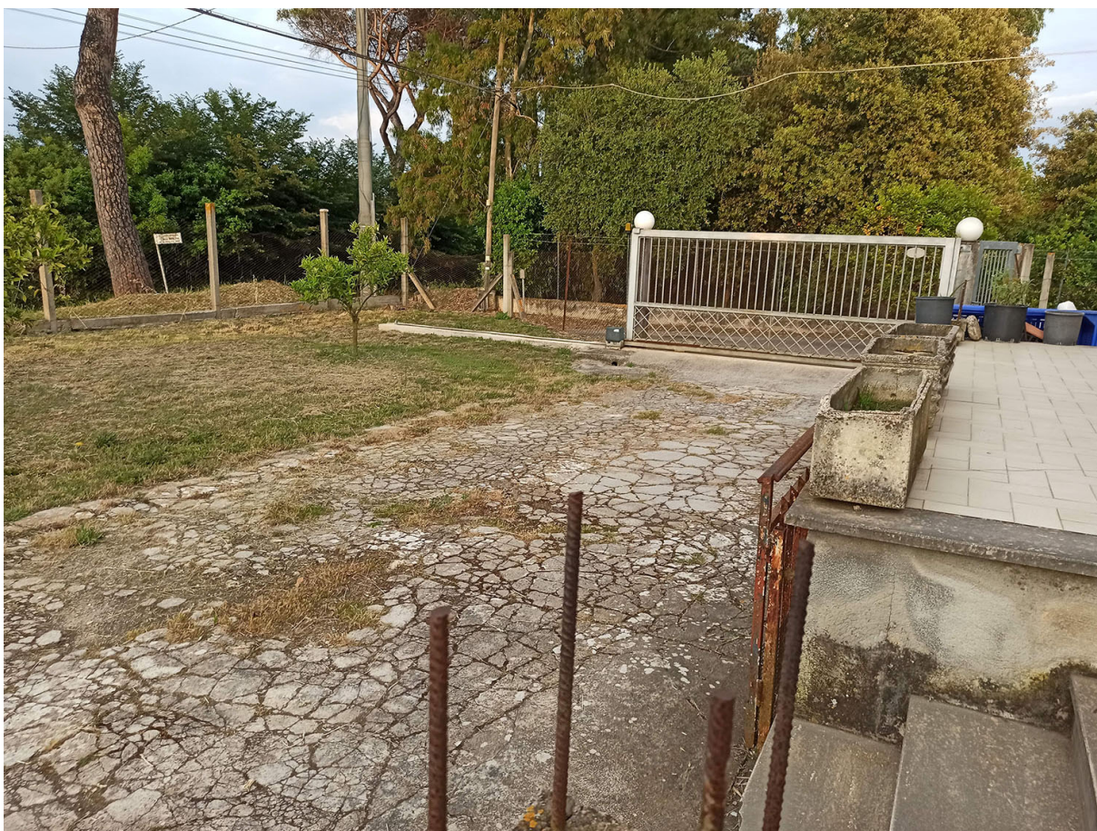
Foto n.5- vista del cortile sul versante NORD-EST con l'area pavimentata in cls in stato di dissesto