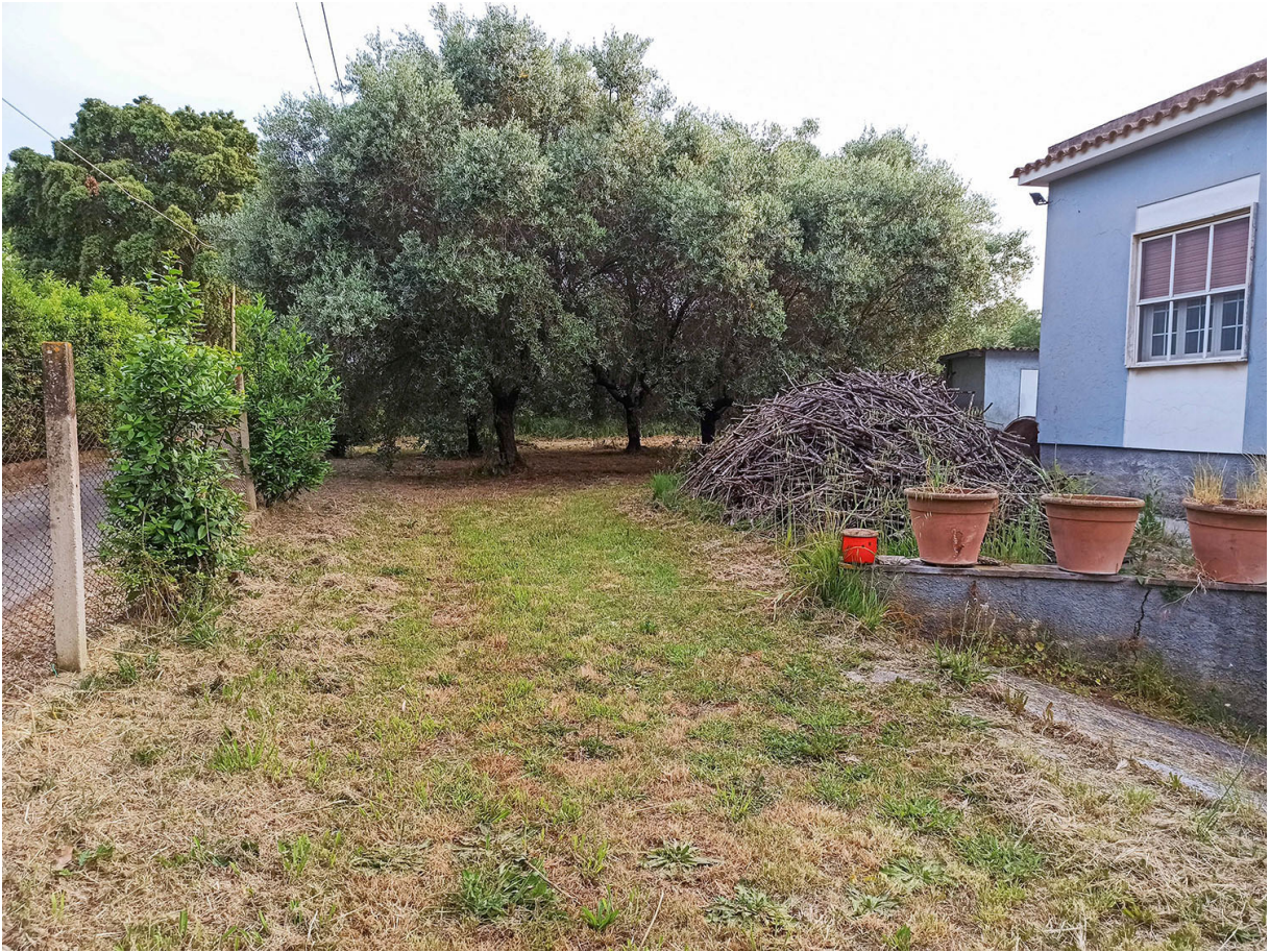
Foto n.11- vista del cortile sul lato di confine SUD-EST con le alberature di olivi e la catasta di legname depositata Foto n.12- vista del villino in direzione SUD-OVEST con il motore esterno del climatizzatore delle camere da letto