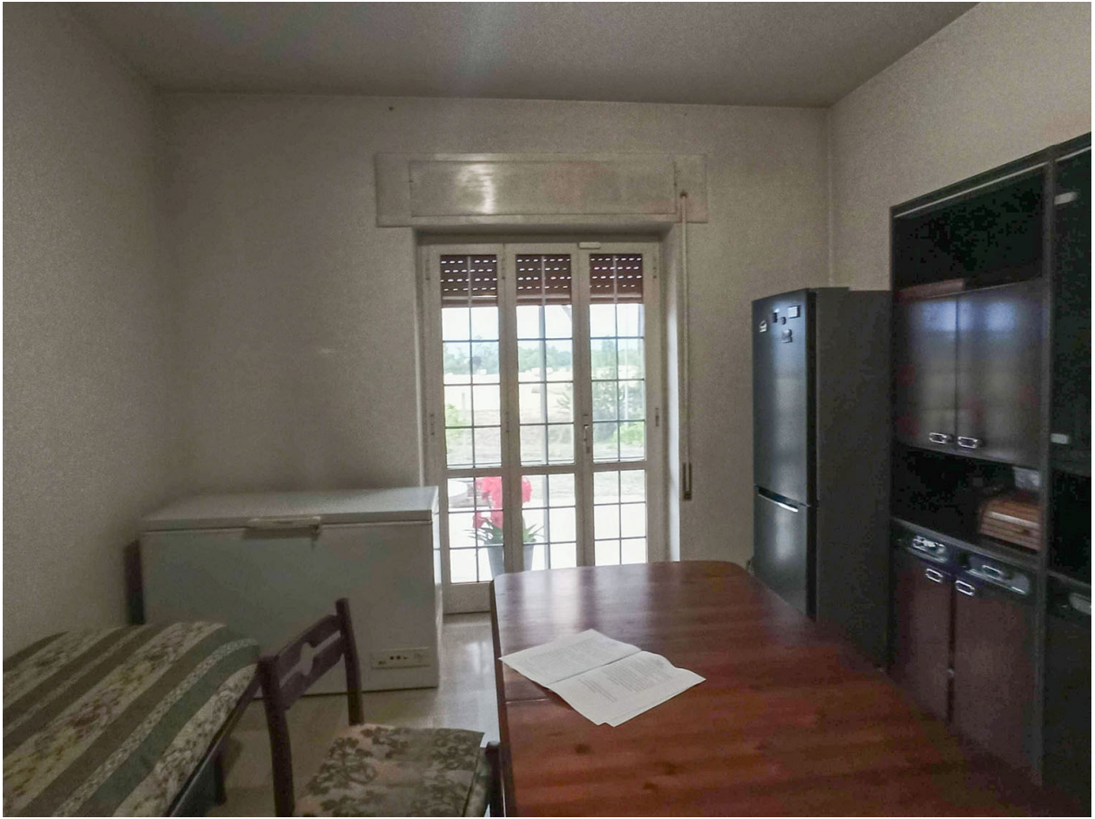
Foto n. 36 - vista del soggiorno-pranzo Foto n. 37 - vista della cucina tinello