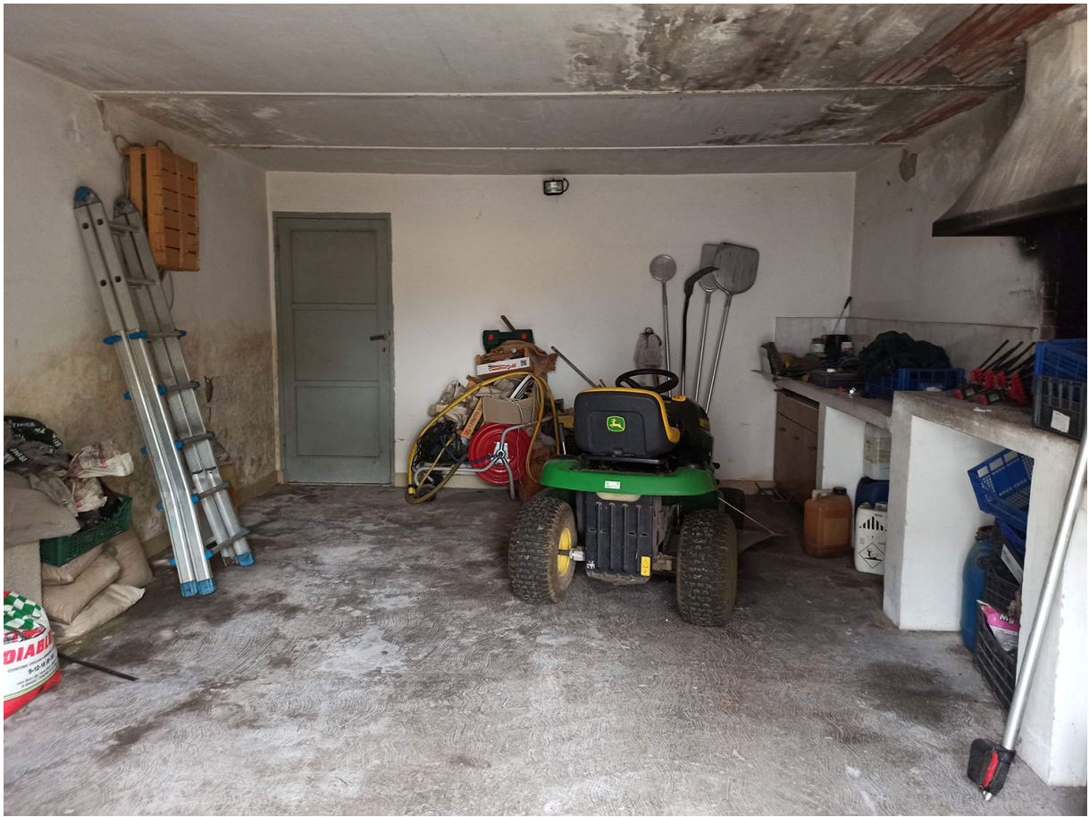
Foto n. 26, 27 – vista degli interni del fabbricato E (deposito/autorimessa)