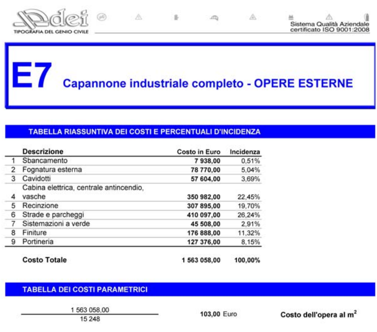
Fig. 4 – Valori parametrici costo di costruzione opere esterne (da “Prezzi Tipologie Edilizie” DEI Tipografia del Genio Civile, ed. 2014)

Nella tabella che segue, dunque, sono riassunti i valori utilizzati per il calcolo delle aliquote del costo di costruzione relative alle superfici coperte ( C_{SC} ) ed alle superfici esterne attrezzate ( C_{SE} ).