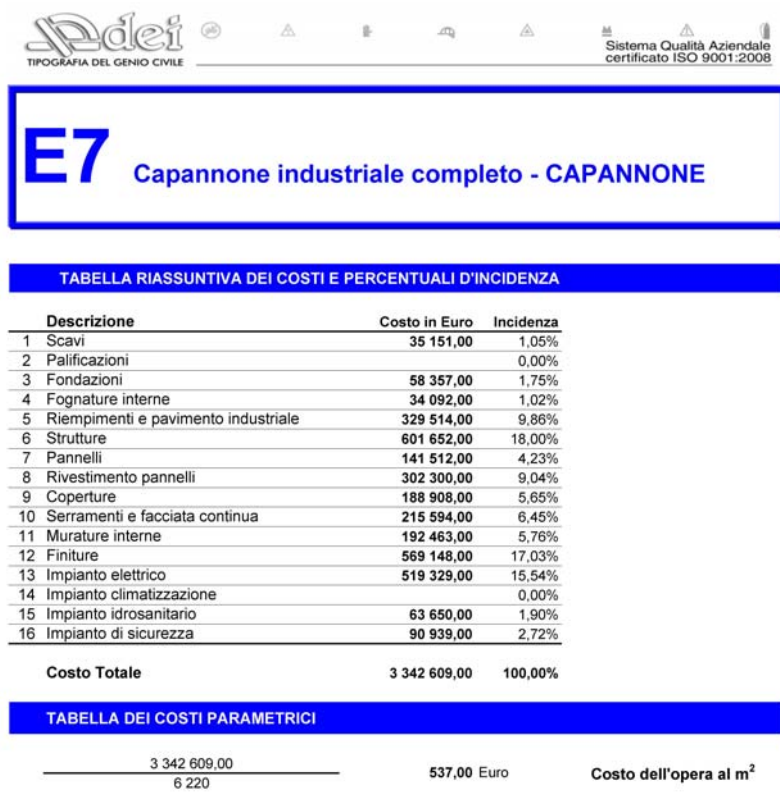
Fig. 2 – Valori parametrici costo di costruzione capannone (da “Prezzi Tipologie Edilizie” DEI Tipografia del Genio Civile, ed. 2014)