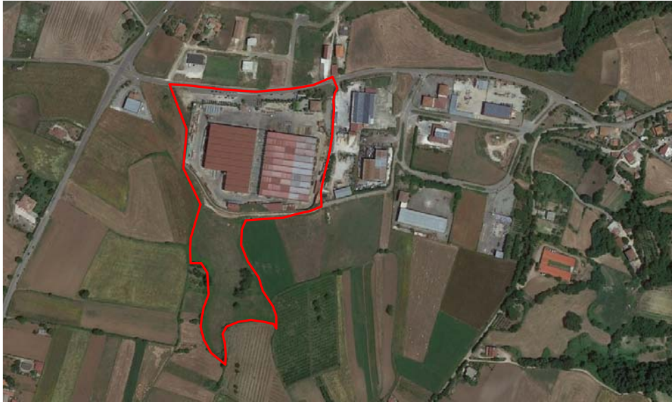
Fig. 1 – Vista aerea delle aree di proprietà G.A.M. Oil & Gas S.p.A.