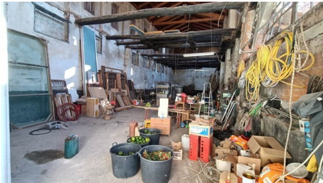
Fotografia A.68 - FOTO INTERNE EDIFICIO ADIBITO AD AZIENDA AGRICOLA / LABORATORIO LAVORAZIONE CARNI BOVINE (SUB. 15 - LOTTO 3)