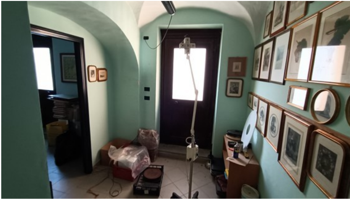
Fotografia A.55 - FOTO LOCALI AD USO MAGAZZINO/UFFICIO/DEPOSITO A PIANO TERRA (SUB. 16 - LOTTO 2) - EX SUB. 1/parte