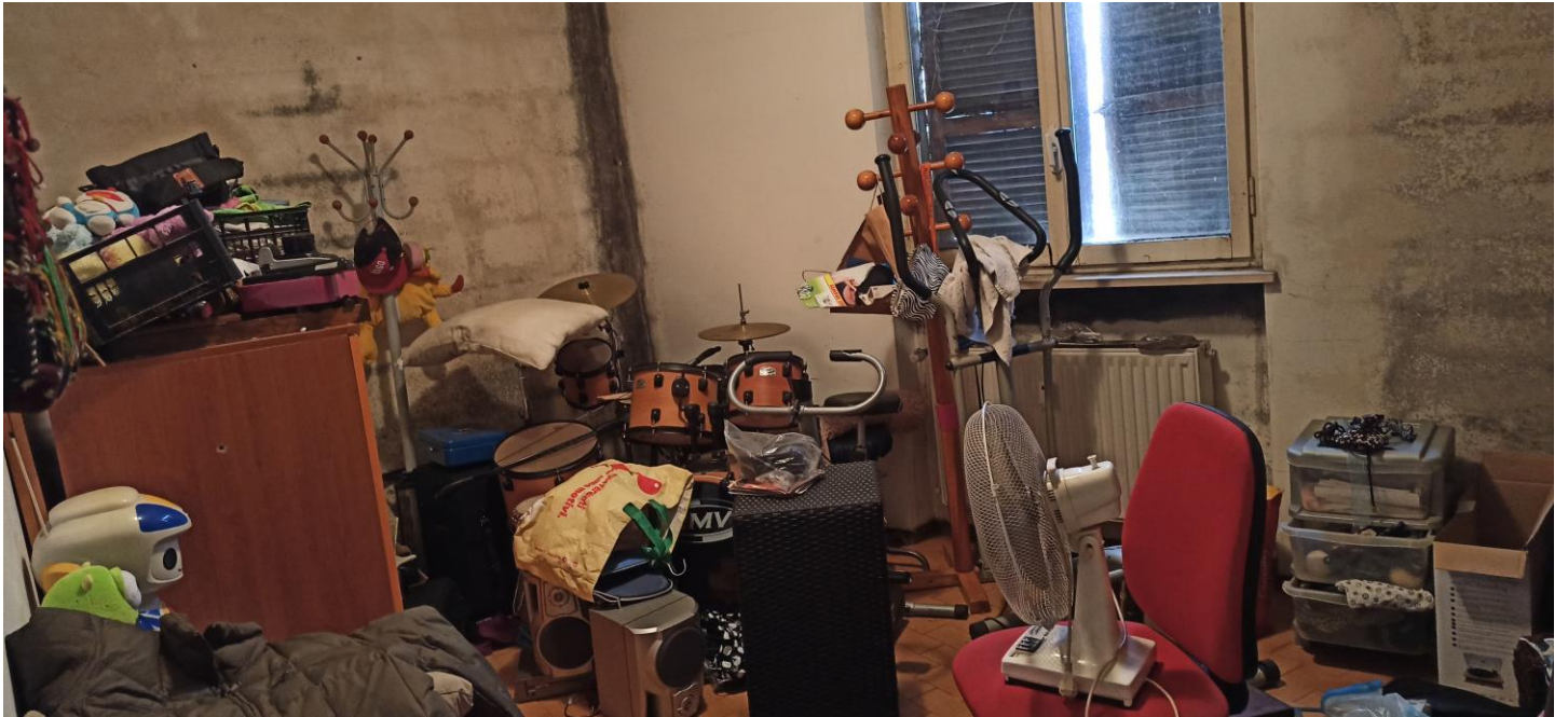
VISTA CAMERA (PRESENZA DI MUFFE)