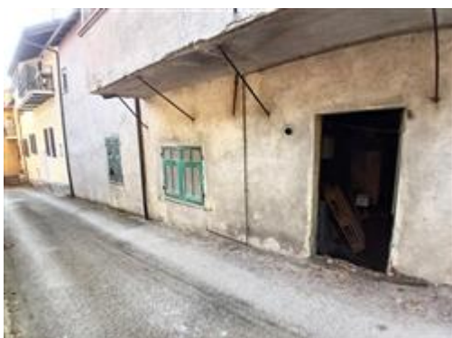
PROSPETTO SECONDARIO SU STRADA VICINALE DI SAN ROCCO