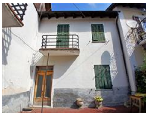
FABBRICATO VIA AL CASTELLO 12