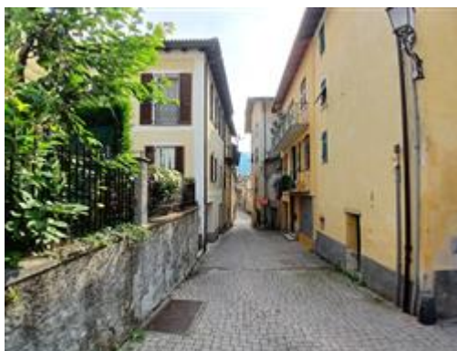
VIA AL CASTELLO