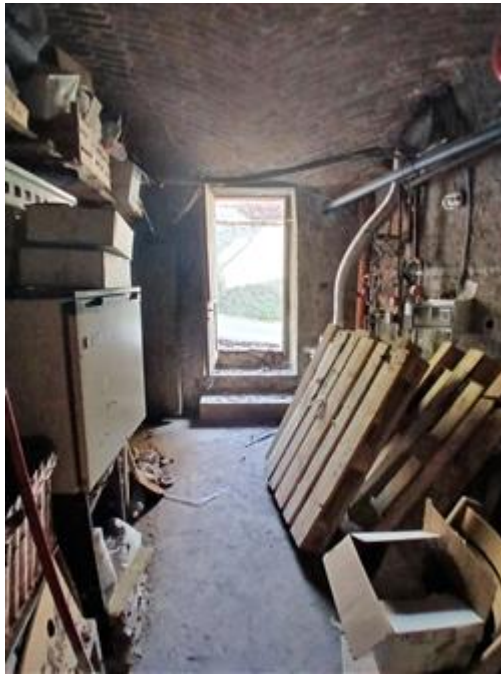
LOCALE DI SGOMBERO