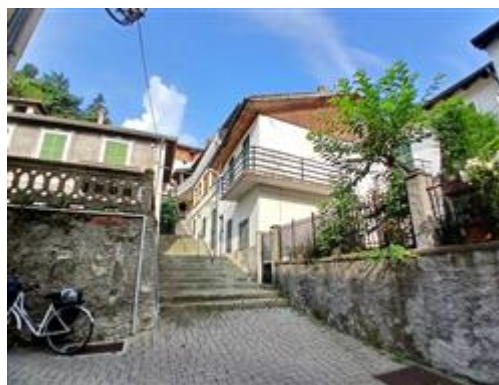
VIA AL CASTELLO