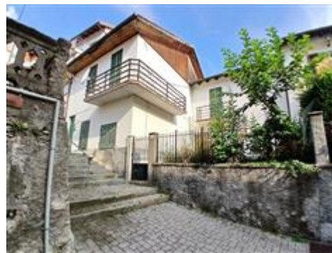
FABBRICATO VIA CASTELLO 12-14