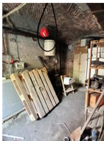
LOCALE DI SGOMBERO