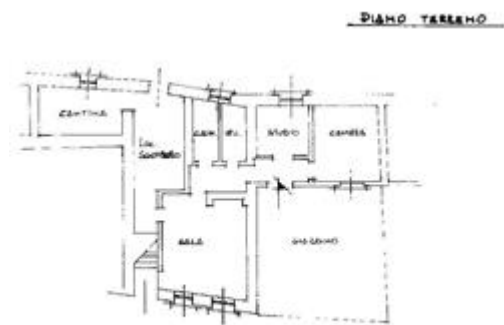
PLANIMETRIA CATASTALE IN ATTI ANNO 1992