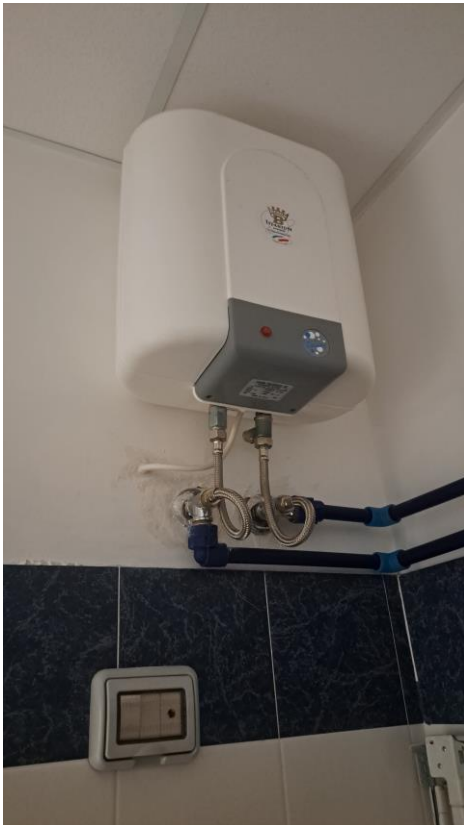
Foto 8 - scaldabagno