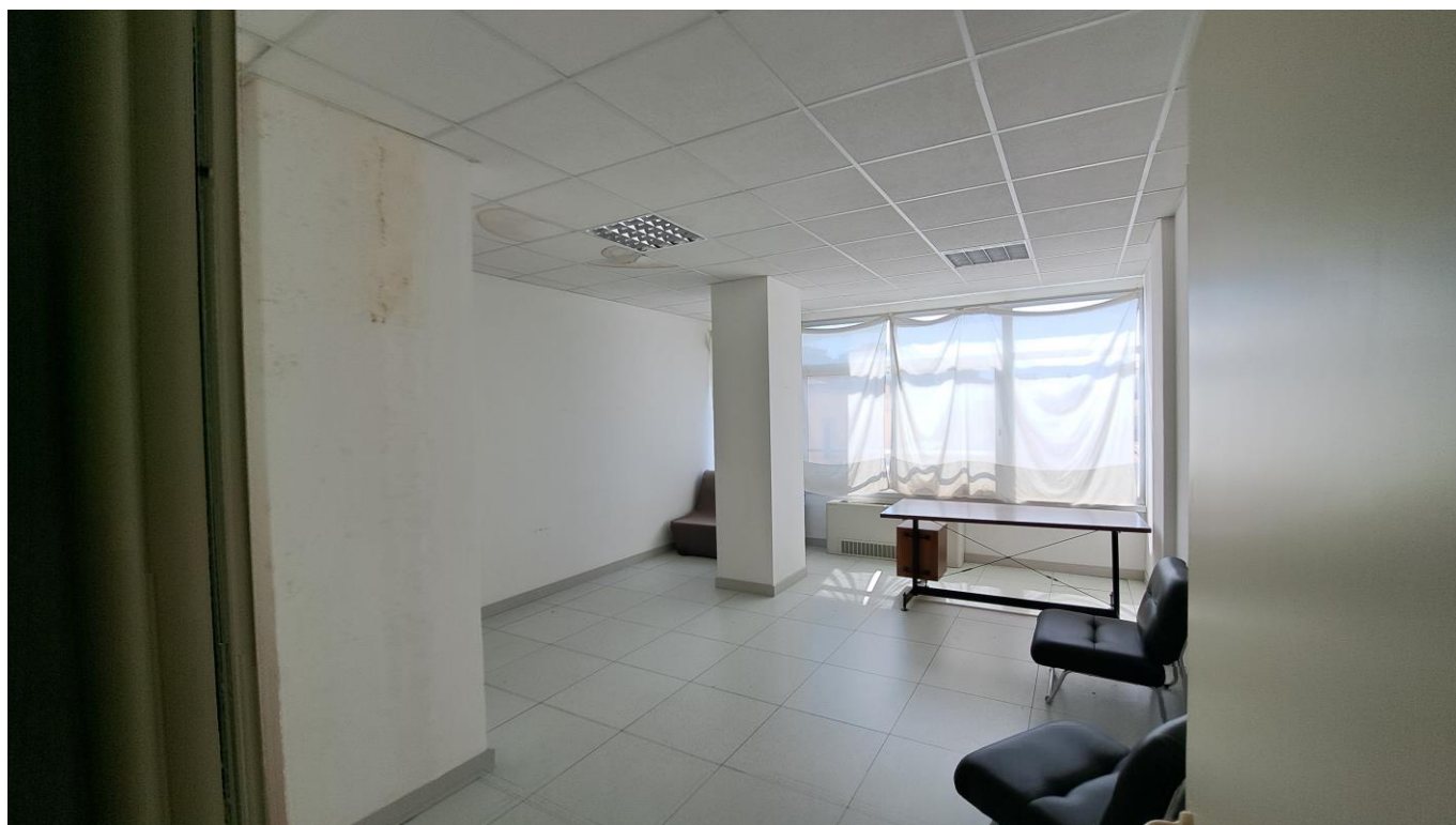
Foto n° 1 – Vista della stanza principale dell'ufficio – via degli Oleandri n. 94 – Piano 1 - Aprilia

Riferimento – Rilievo e Planimetria dell'unità immobiliare sita in Aprilia (cap 04011) in via degli Oleandri n. 94 Piano 1 Interno 8