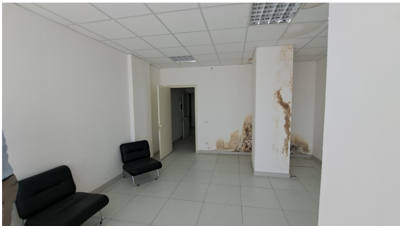
Foto n° 5 – Vista dell'ufficio dalla vetrata. Si osserva il deterioramento di intonaco dovuto ad una passata infiltrazione d'acqua proveniente dal soffitto in corrispondenza del bagno dell'immobile