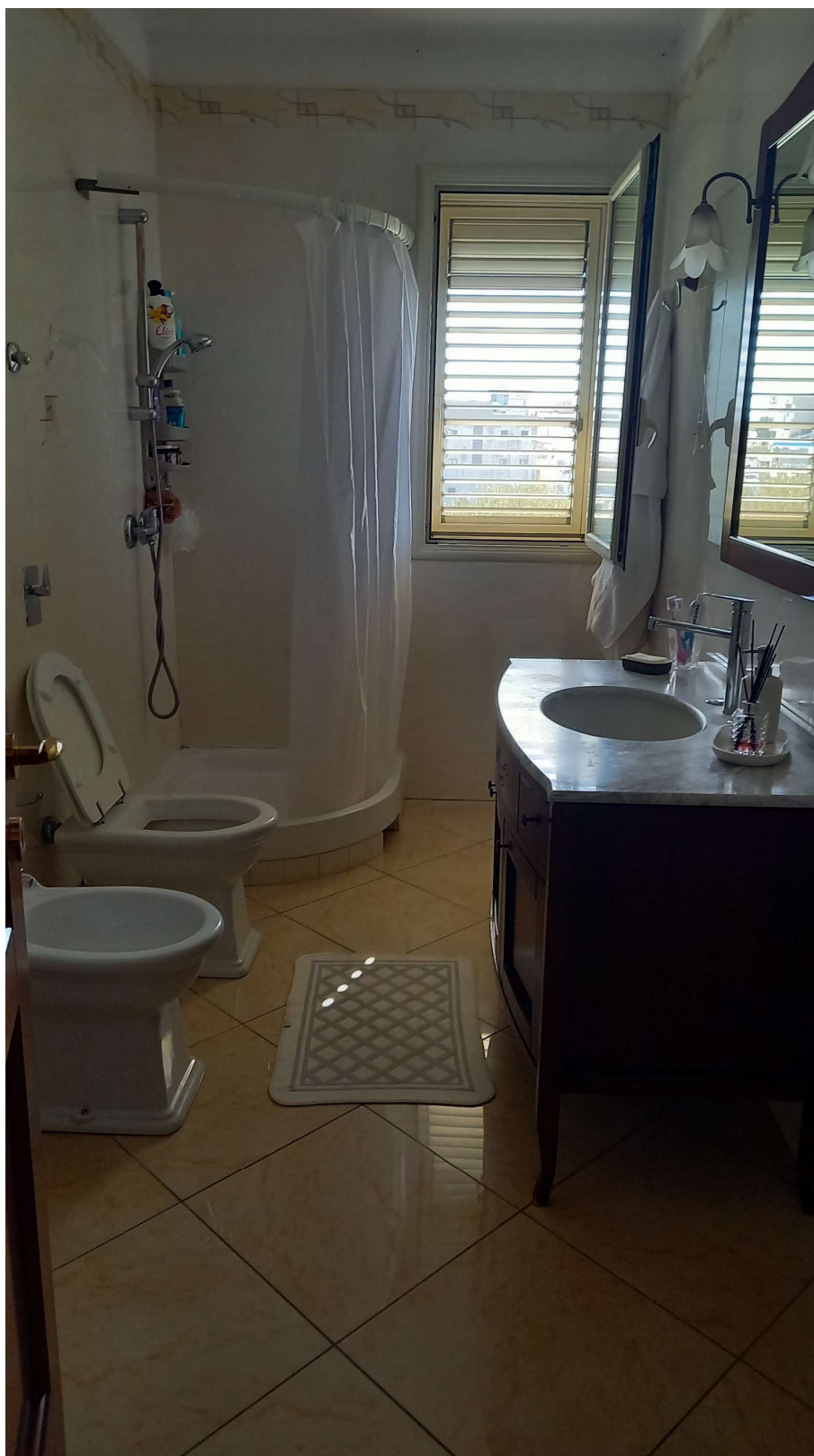
FOTO N. 8 - bagno