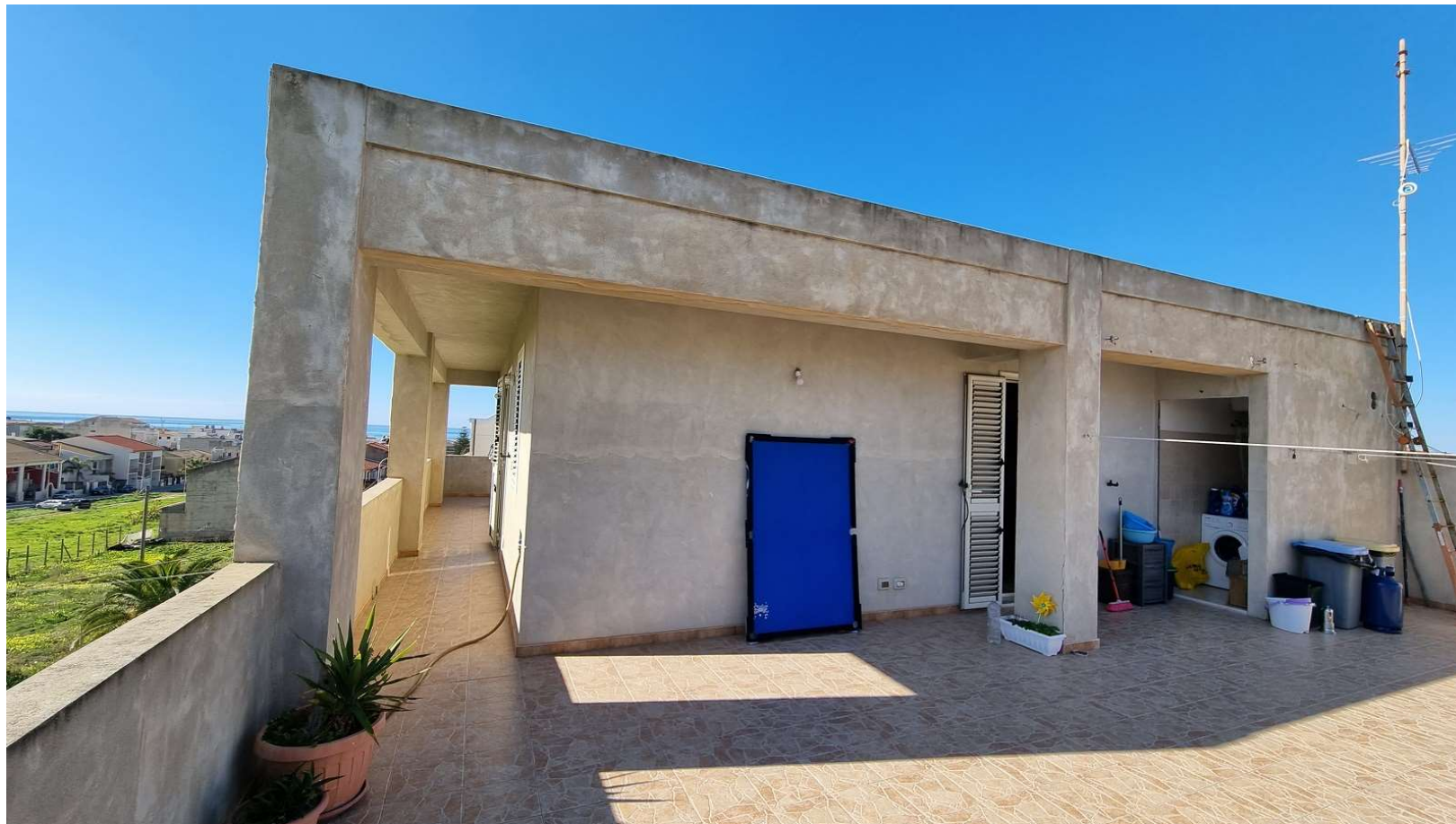
FOTO N. 4 -prospetto est su terrazza