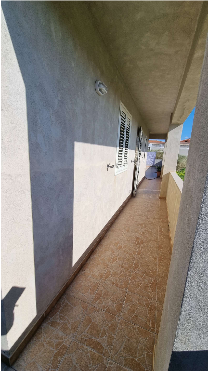
FOTO N. 6 - balcone