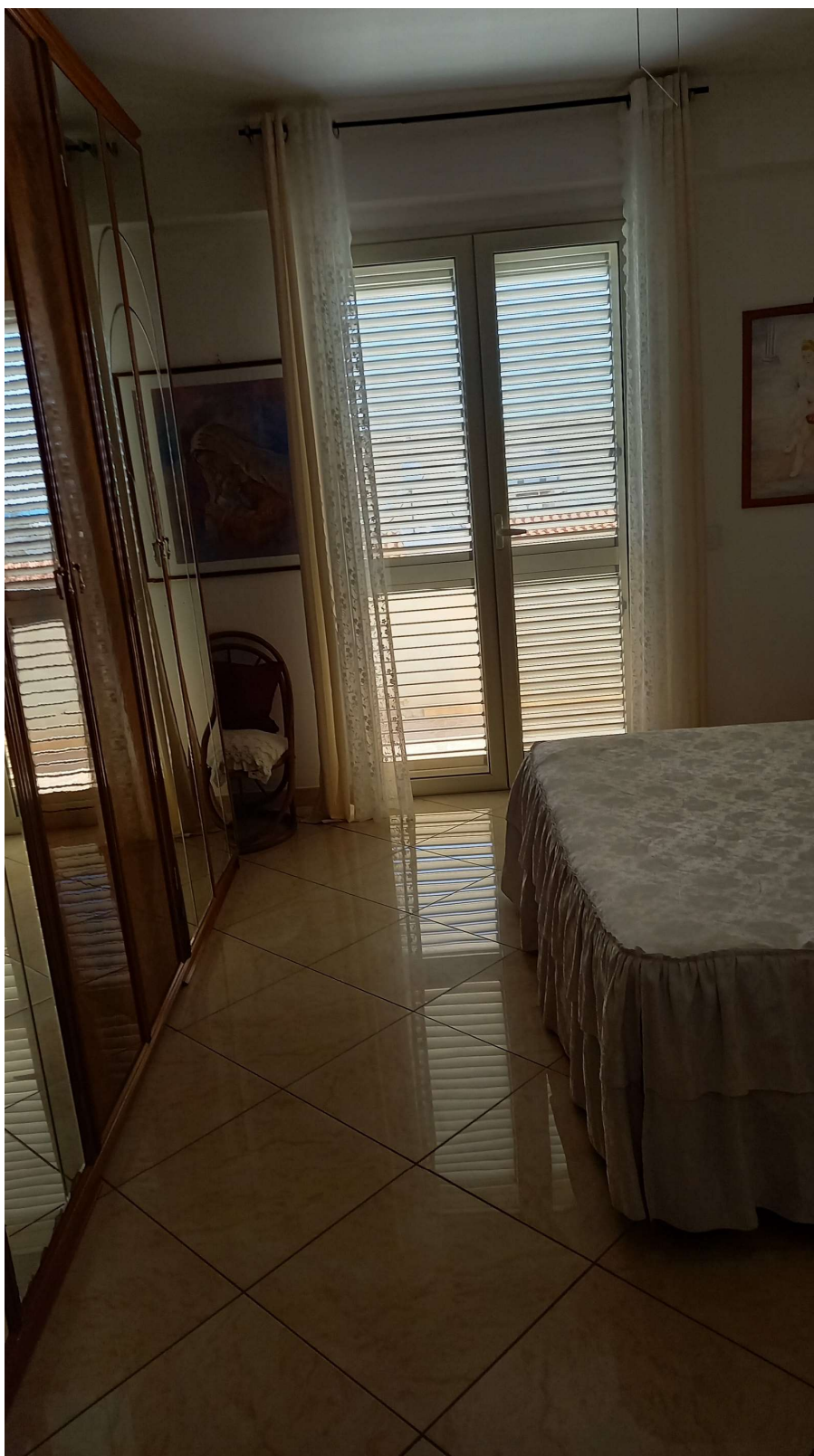
FOTO N. 11 - camera 1