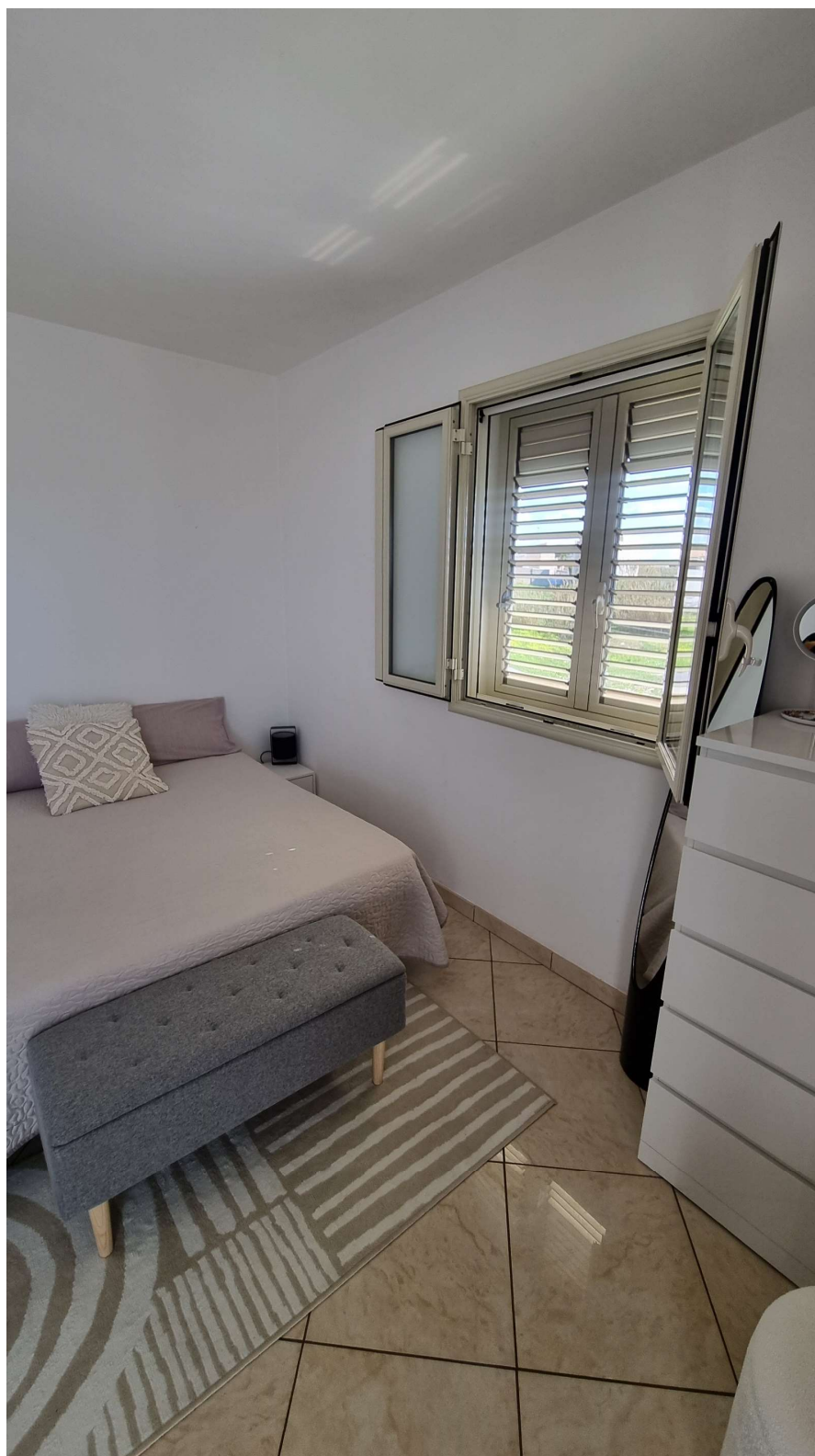
FOTO N. 10 - camera 2