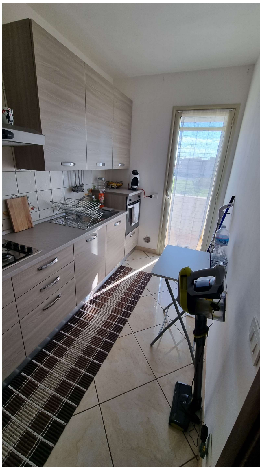
FOTO N. 9 - cucina