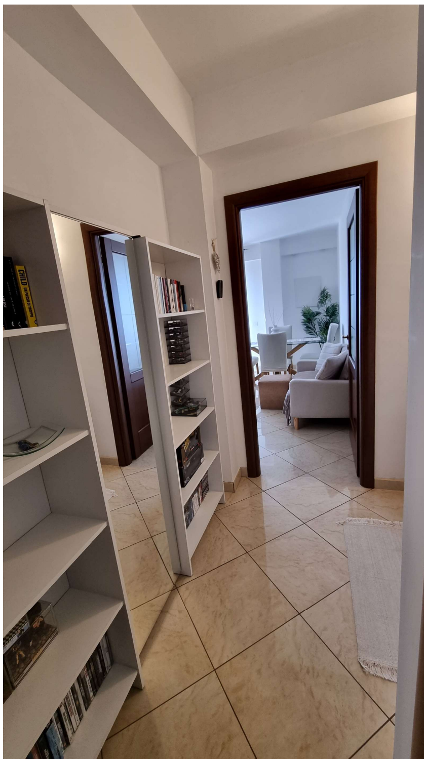
FOTO N. 7 - disimpegno 2