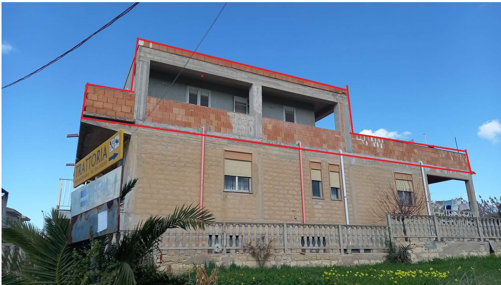
FOTO N. 2 - prospetto sud con indicazione immobile