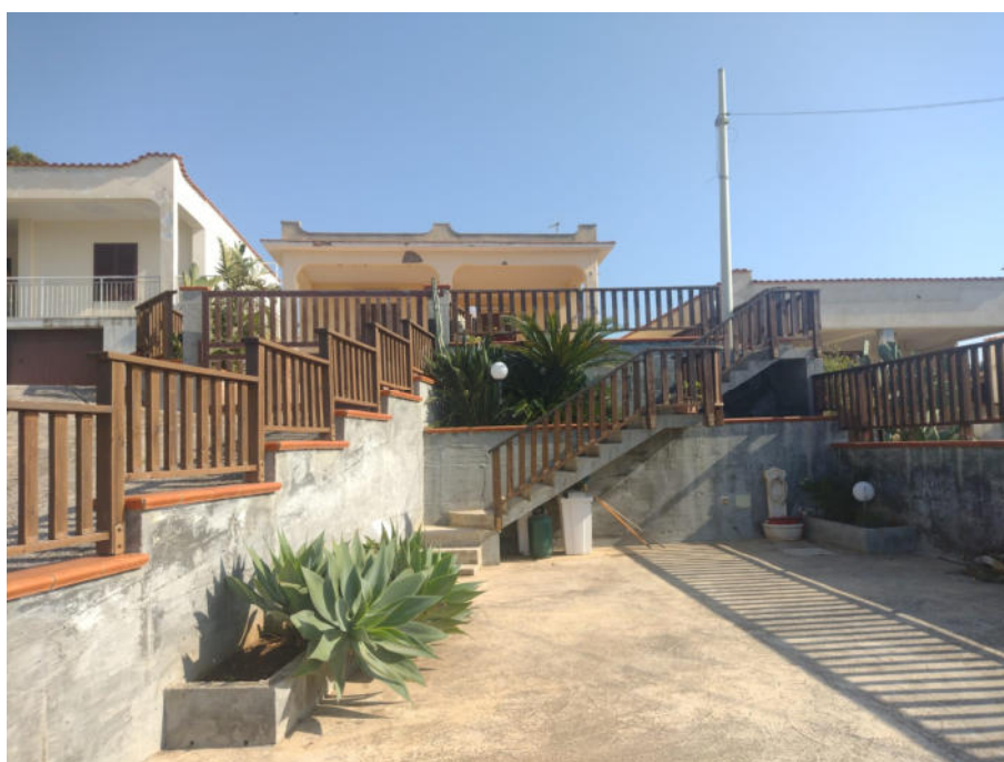
Foto n.2 Spazio esterno con accesso pedonale.