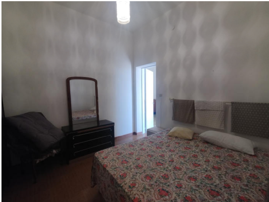
Foto n.12 Camera da letto.