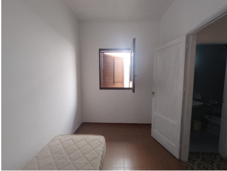
Foto n.7 - 8 Vano, Bagno.