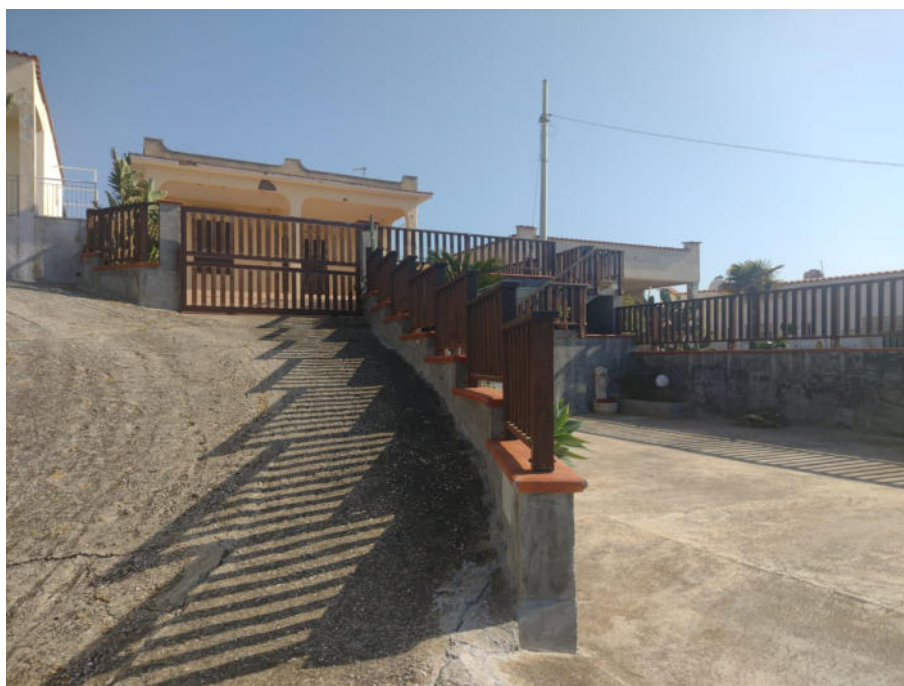
Foto n.1 Accesso carrabile.