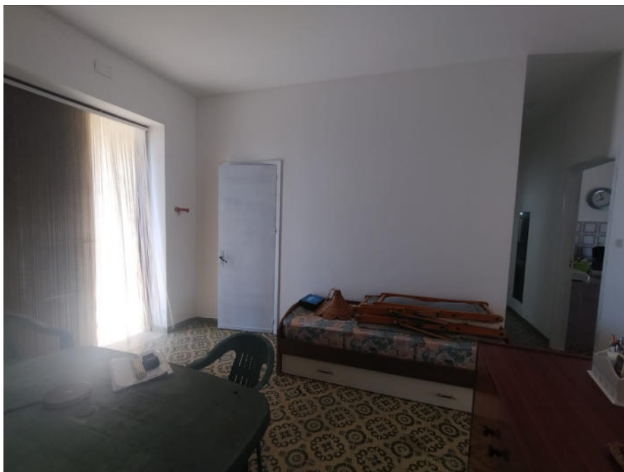
Foto n.11 Soggiorno.