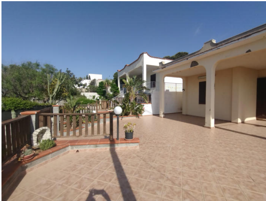
Foto n.4 Spazio esterno veranda.