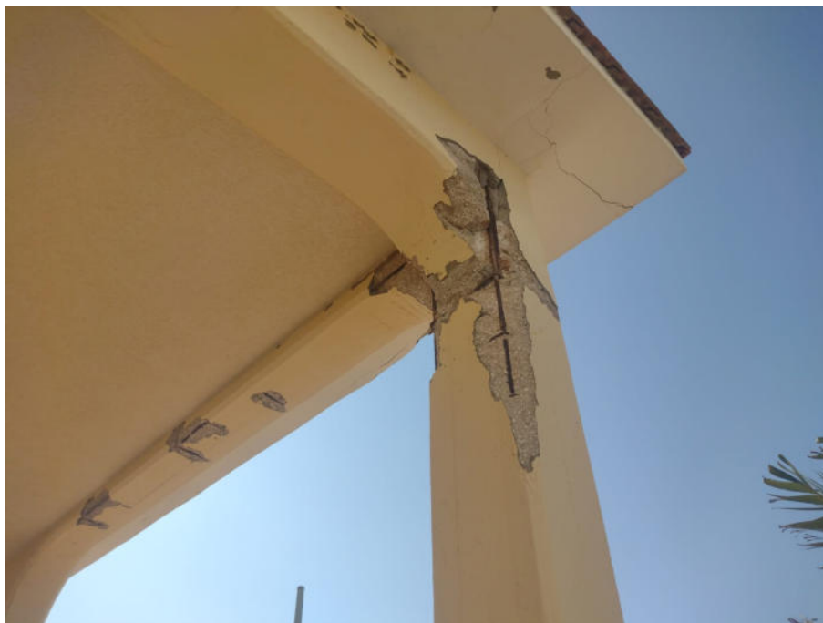
Foto n.17 – 18 Manifestazione di fenomeni di ossidazione dell'armatura con conseguente distacco del conglomerato cementizio.