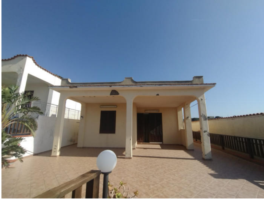
Foto n.3 Prospetto principale con portico.