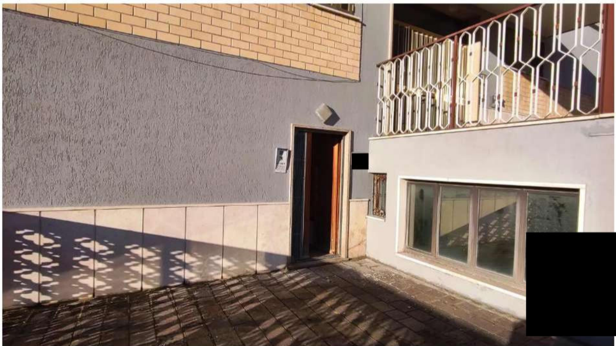
Foto n. 3 – ingresso su terrazzo piano S1. U.I. n. 1 – Fg. 44 p.lla 136 sub. 14