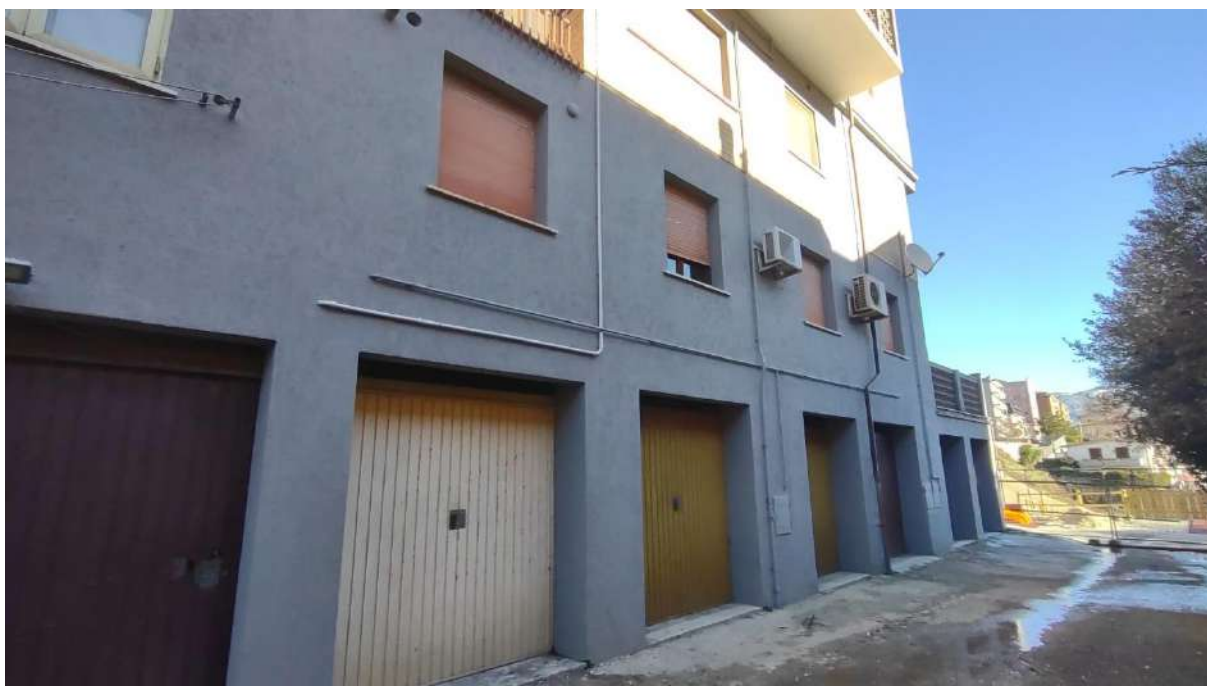
Foto n. 4 – vista da via Saragat. U.I. n. 1 – Fg. 44 p.lla 136 sub. 14