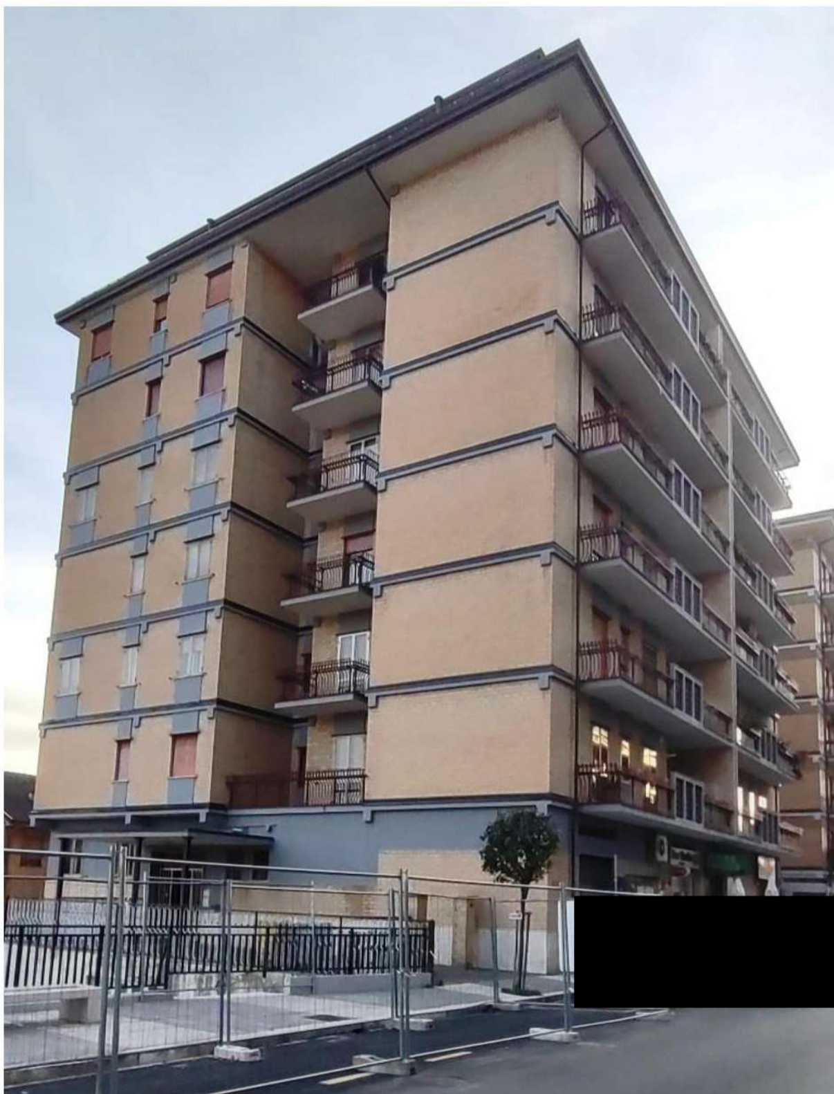
Foto n. 1 – Palazzina condominiale [REDACTED] – In N.C.E.U. Fg. 44 p.lla 136