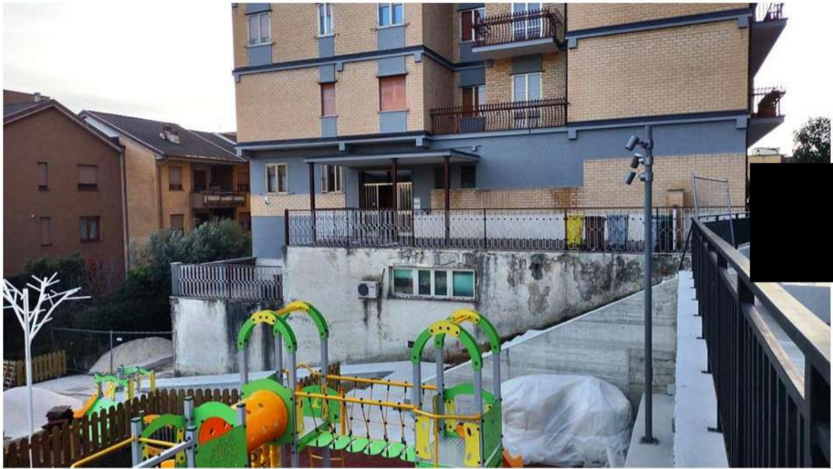
Foto n. 2 — Prospetto laterale U.I. n. 2. Piano S1. In N.C.E.U. Fg. 44 p.lla 136 sub. 47