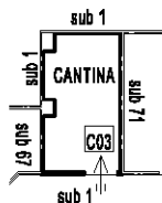
Pianta Piano interrato - h 2.40