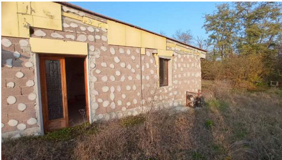
Fascia sud particella 385 (angolo est)