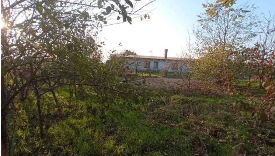
Vista da est