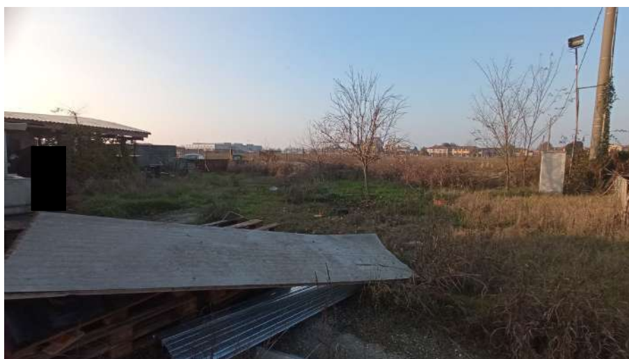
Area interna in prossimità dell'ingresso (nord-ovest)