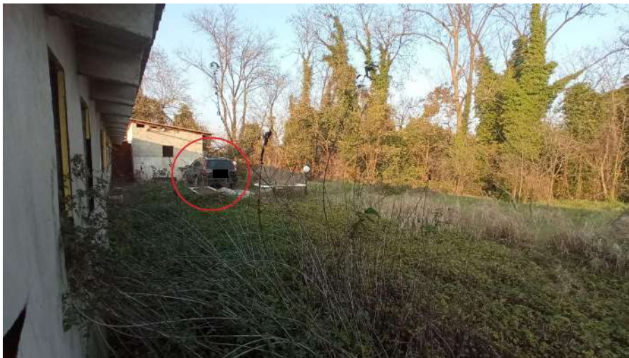
Auto di proprietà dell'esecutata