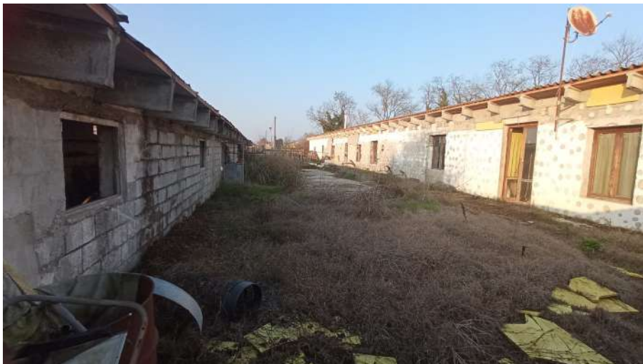
Area interclusa tra i fabbricati 383 (vista sud-nord)