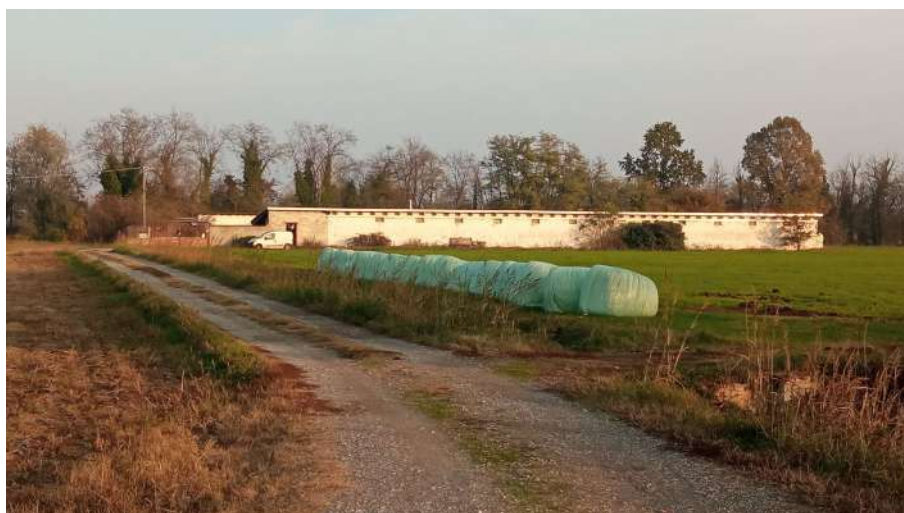
Panoramica da ovest