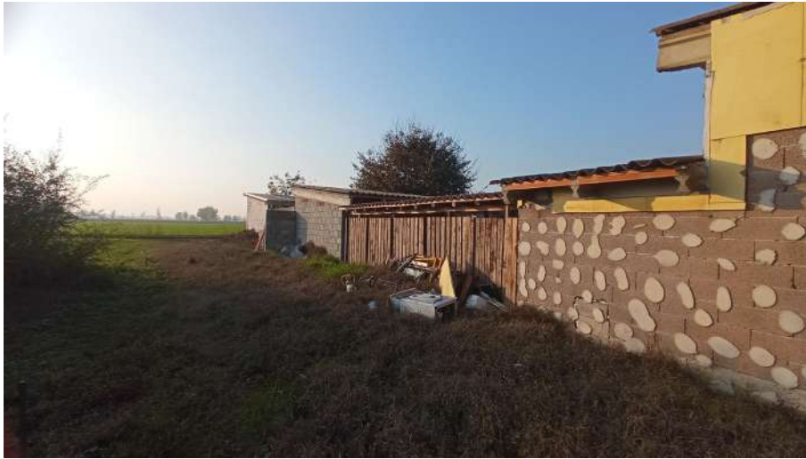
Fascia sud particella 385