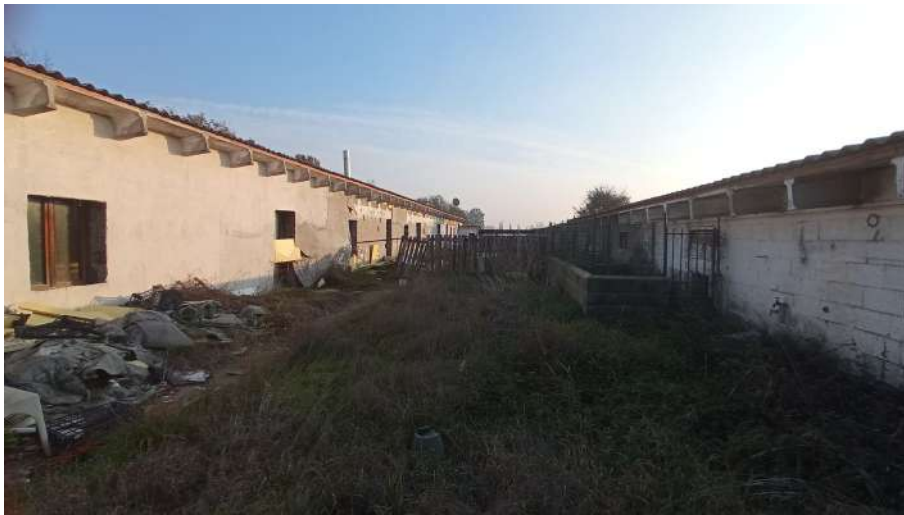
Area interclusa tra i fabbricati 383 (vista nord-sud)