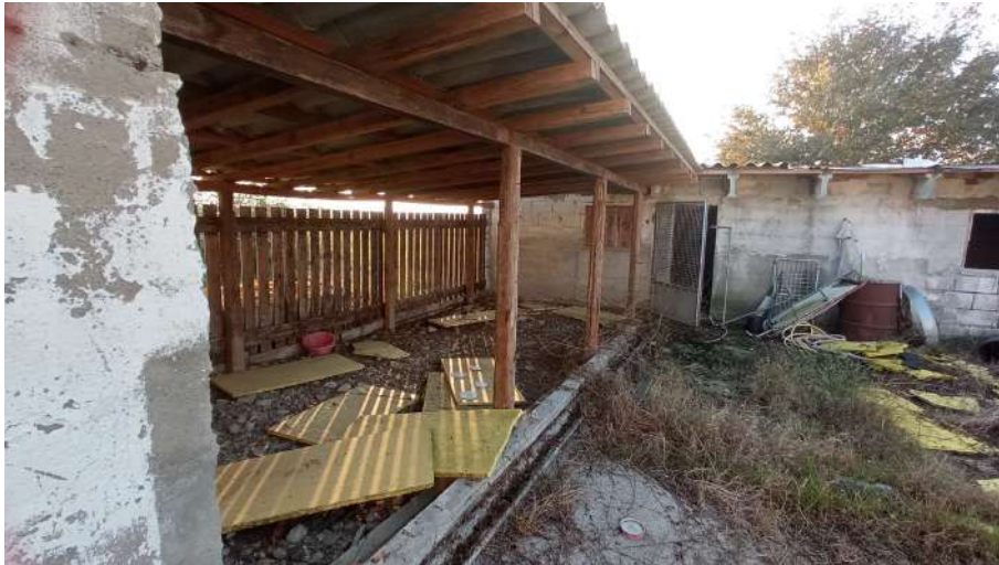
Porticato sud tra i fabbricati 383