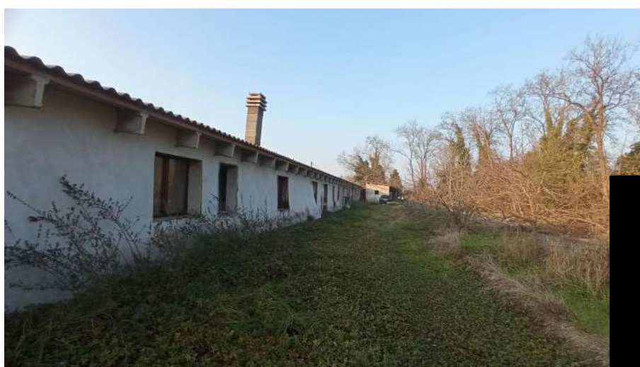
Esterno est della particella 383 (vista da sud)