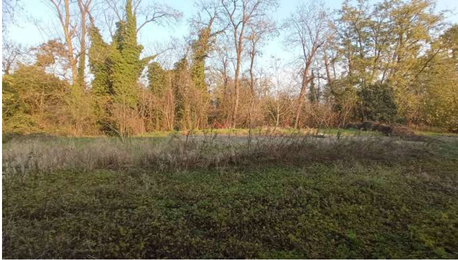
Pioppeto (Particella 235) visto dalla particella 385