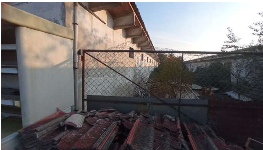
Tipologia di materiali edili di scarto