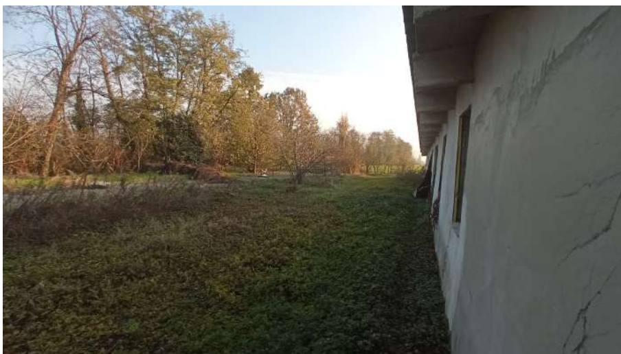
Facciata est del fabbricato di cui alla particella 383 Vista da nord in direzione sud