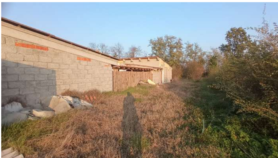
Fascia sud particella 385