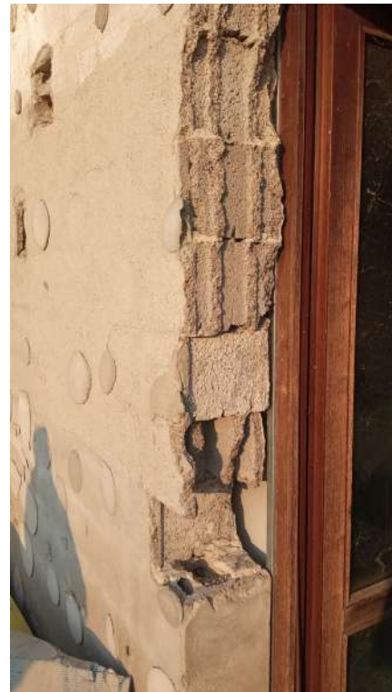
Completo distacco dell'isolamento a cappotto della facciata