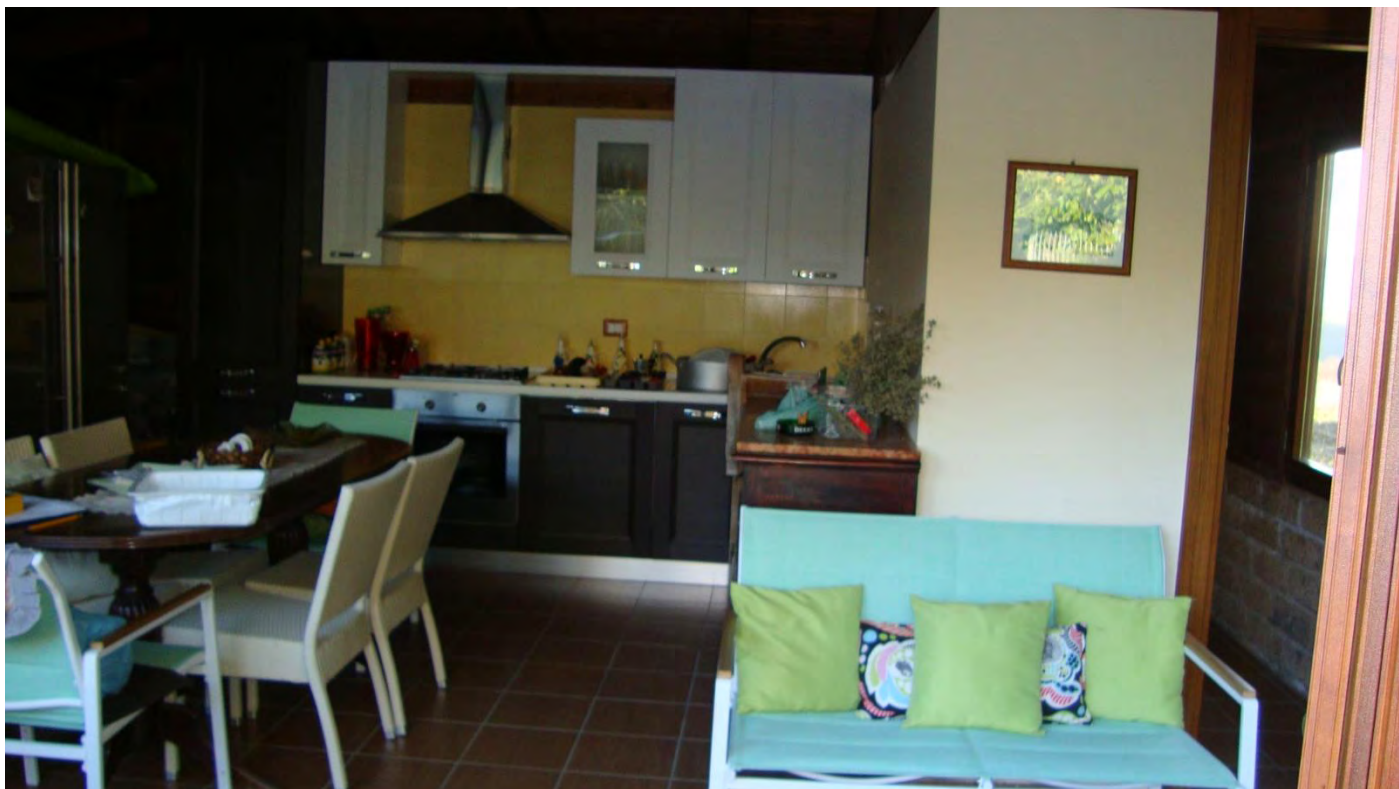
FOTO N. 28 – LOCALETTO PERTINENZIALE – CUCINA/PRANZO - U.I.U. SUB. 8