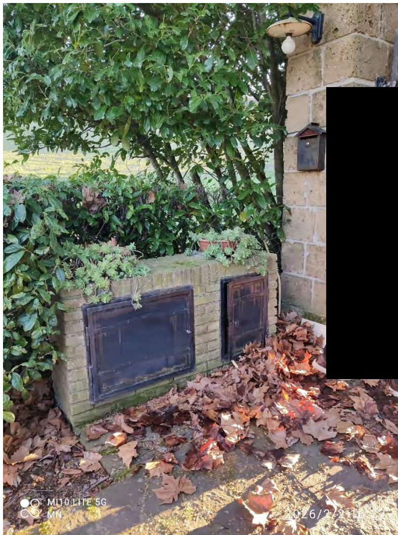
FOTO N. 4 – PAVIMENTAZIONE ESTERNA AL FABBRICATO NELL'AREA RECINTATA