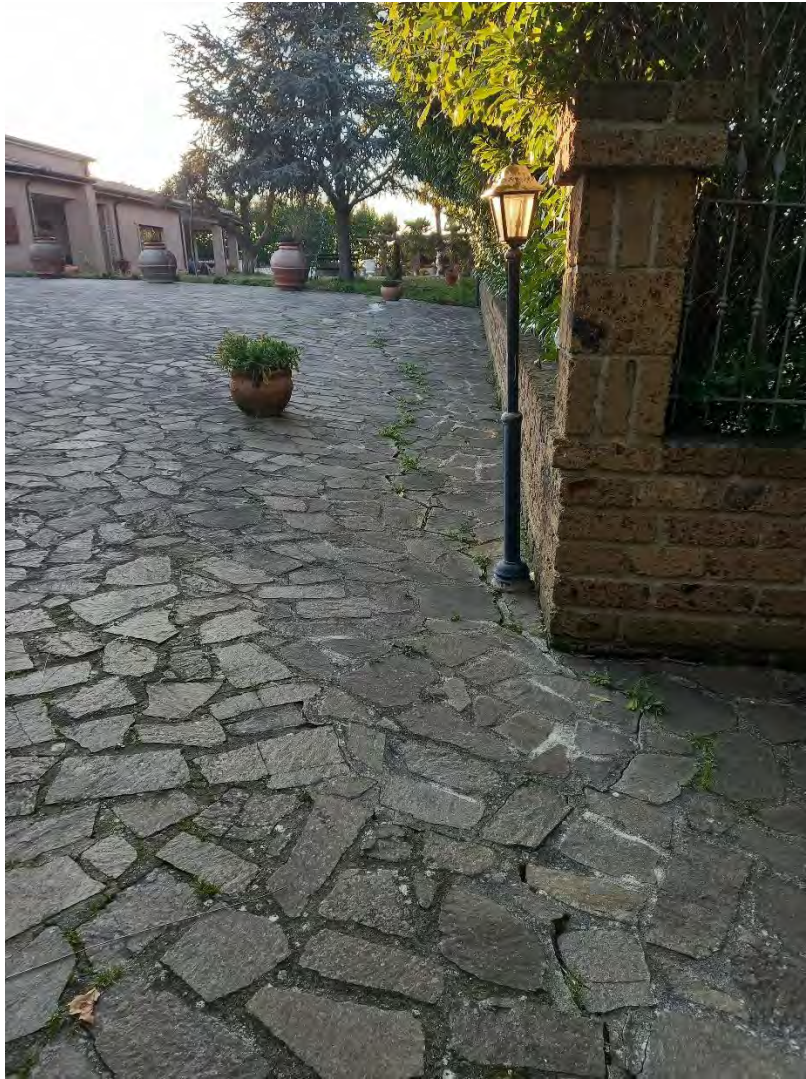
FOTO N. 6 – PAVIMENTAZ. ESTERNA AL FABBRIC NELL'AREA RECINTATA, SULLO SFONDO IL FABBRICATO