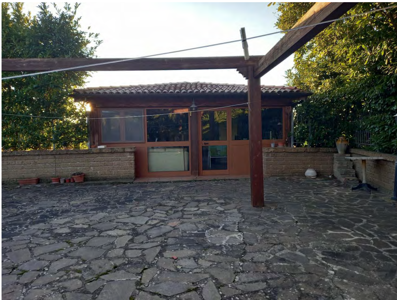
FOTO N. 14 – PROSPETTO OVEST DEL LOCALE AUTORIMESSE - U.I.U. SUB. 6