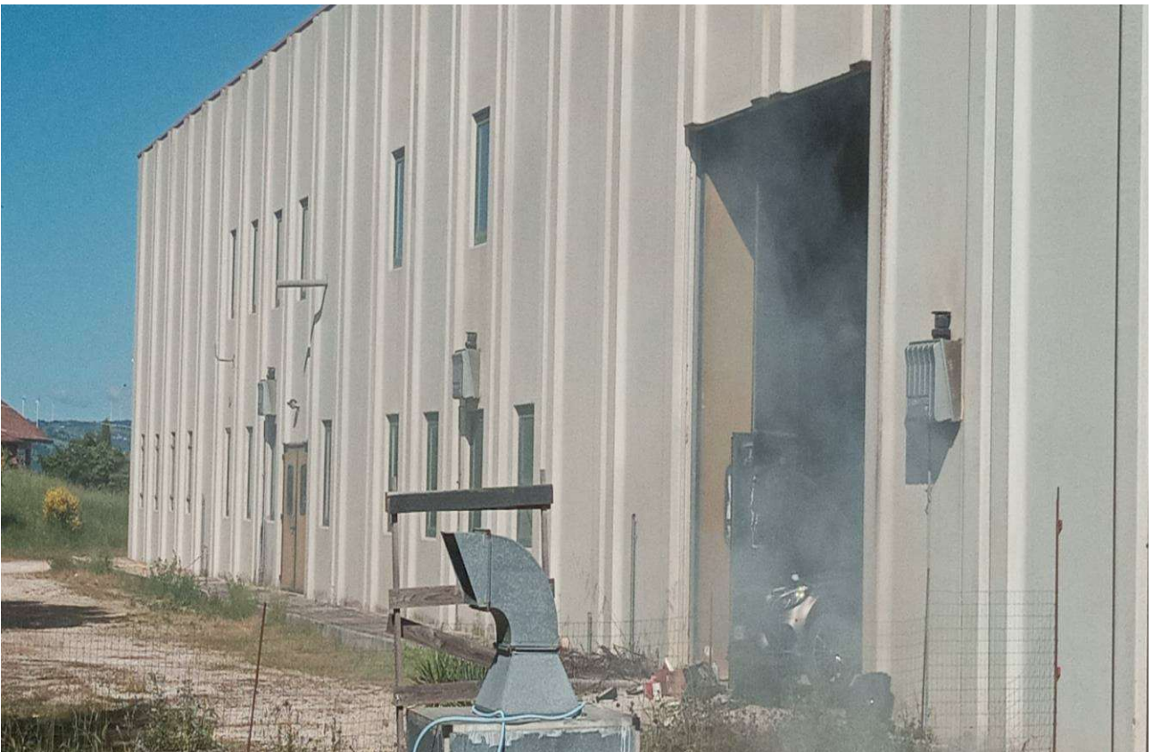
LATERALE LABORATORIO E DEPOSITO 2