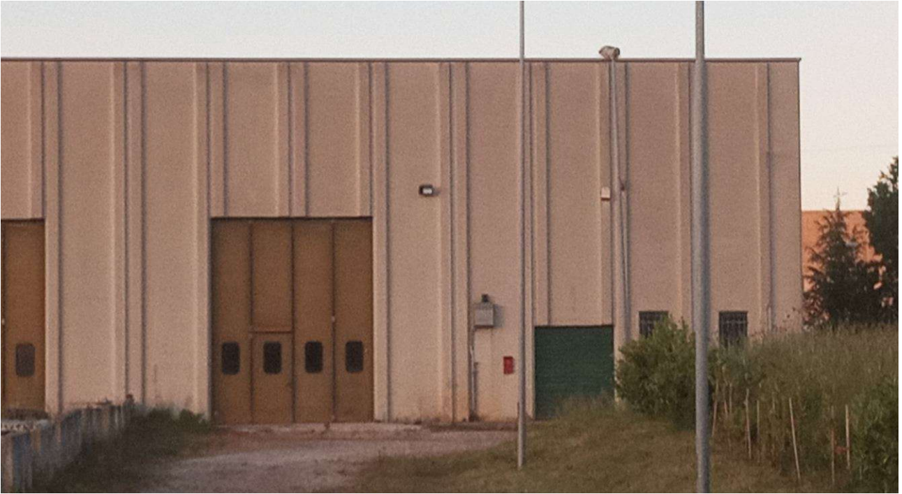
FRONTE DEPOSITO 1 CON UFFICI