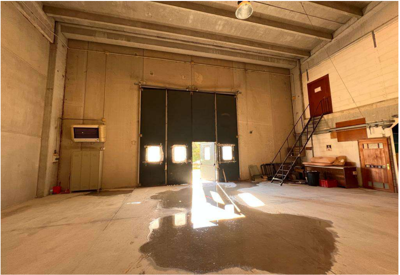
DEPOSITO CON SCALA ACCESSO PIANO SUPERIORE