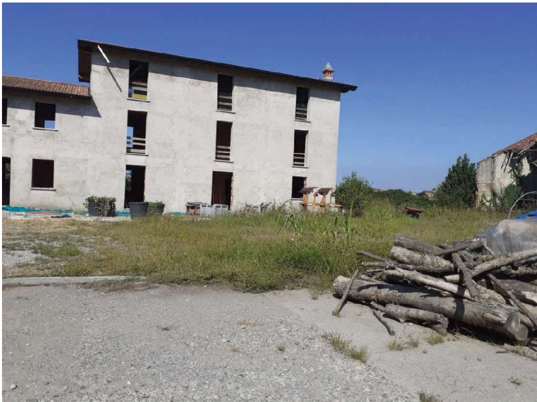
Veduta porzione edificio crollato e fabbricato non ultimato mapp 380 sub 3 ex mappale 256