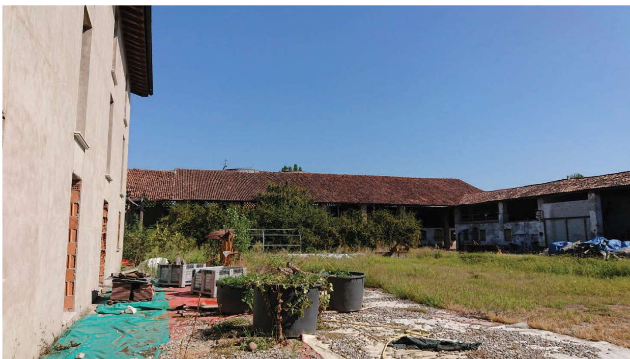
Veduta porzione mappali 380 sub 3 e sub 2 lato est ex mapp 259 e porzione 256 non ultimato