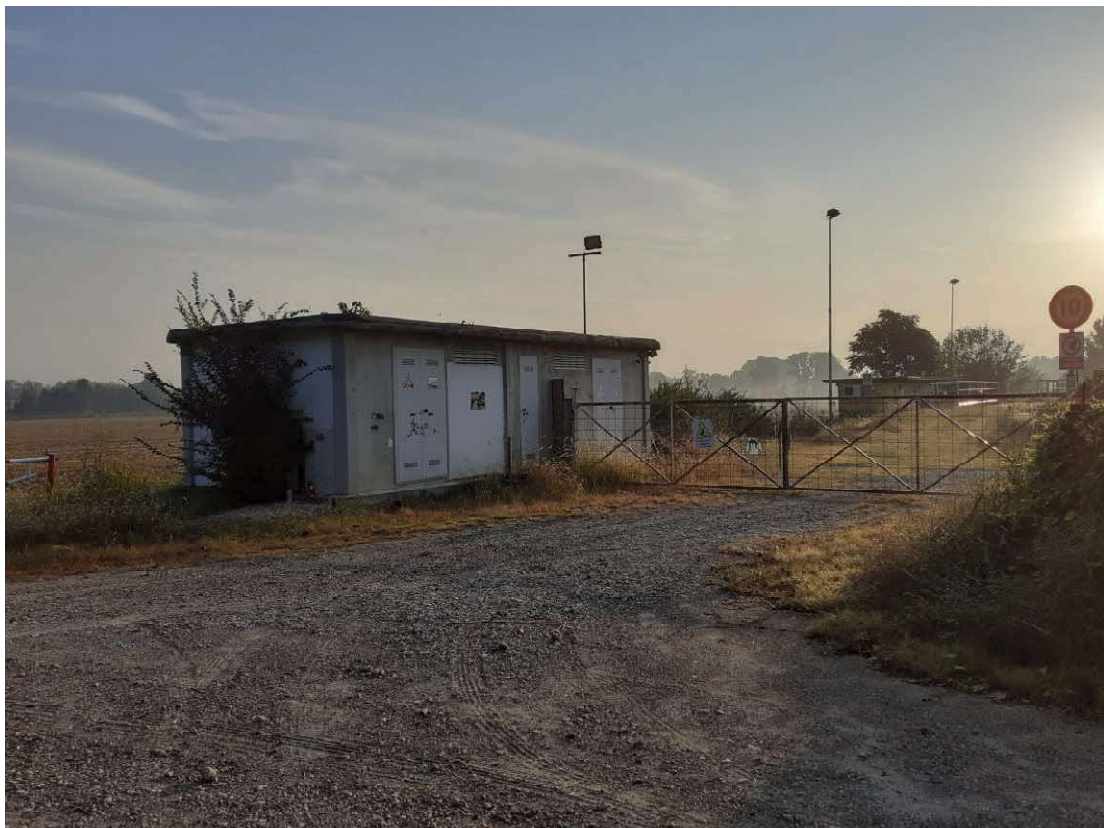
Veduta mappale 331 lato nord dove si evince la presenza della cabina elettrica e delle strutture utilizzate per i lavori di scavo della cava