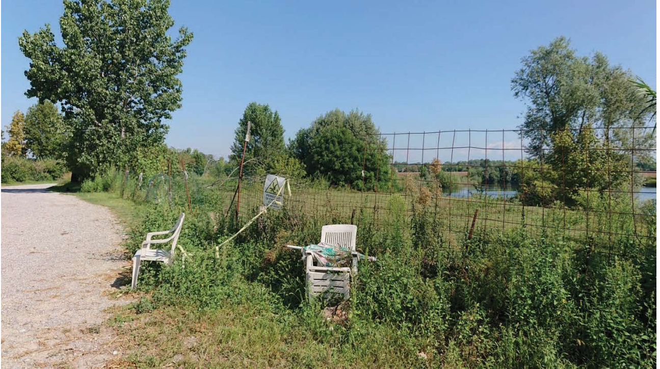
FOTO N. 6 Veduta dalla strada del mappale 190