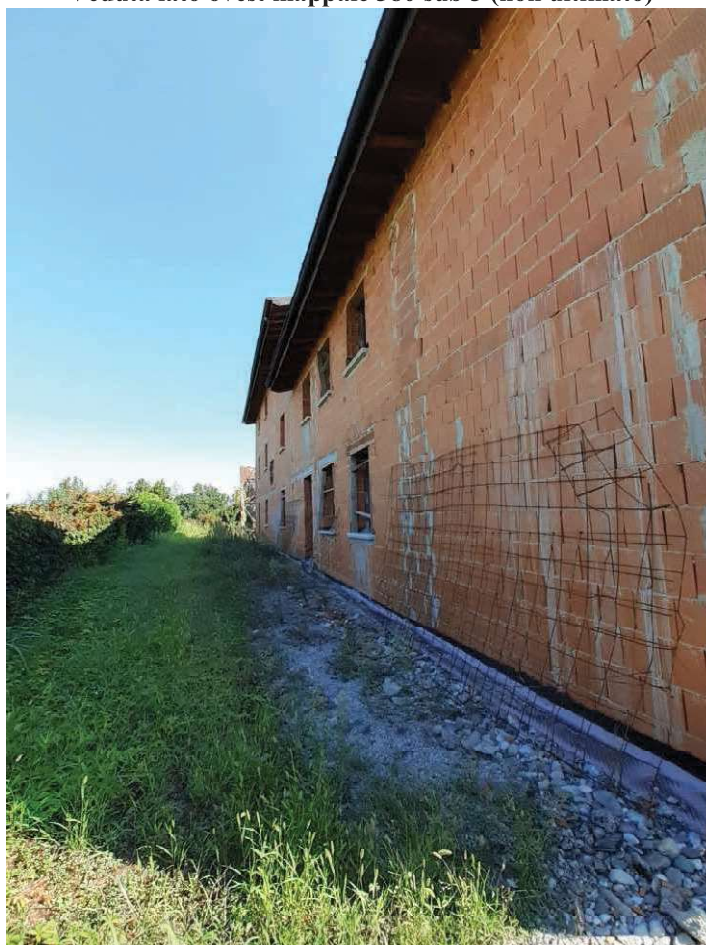
Veduta lato ovest mappale 380 sub 3 (non ultimato)