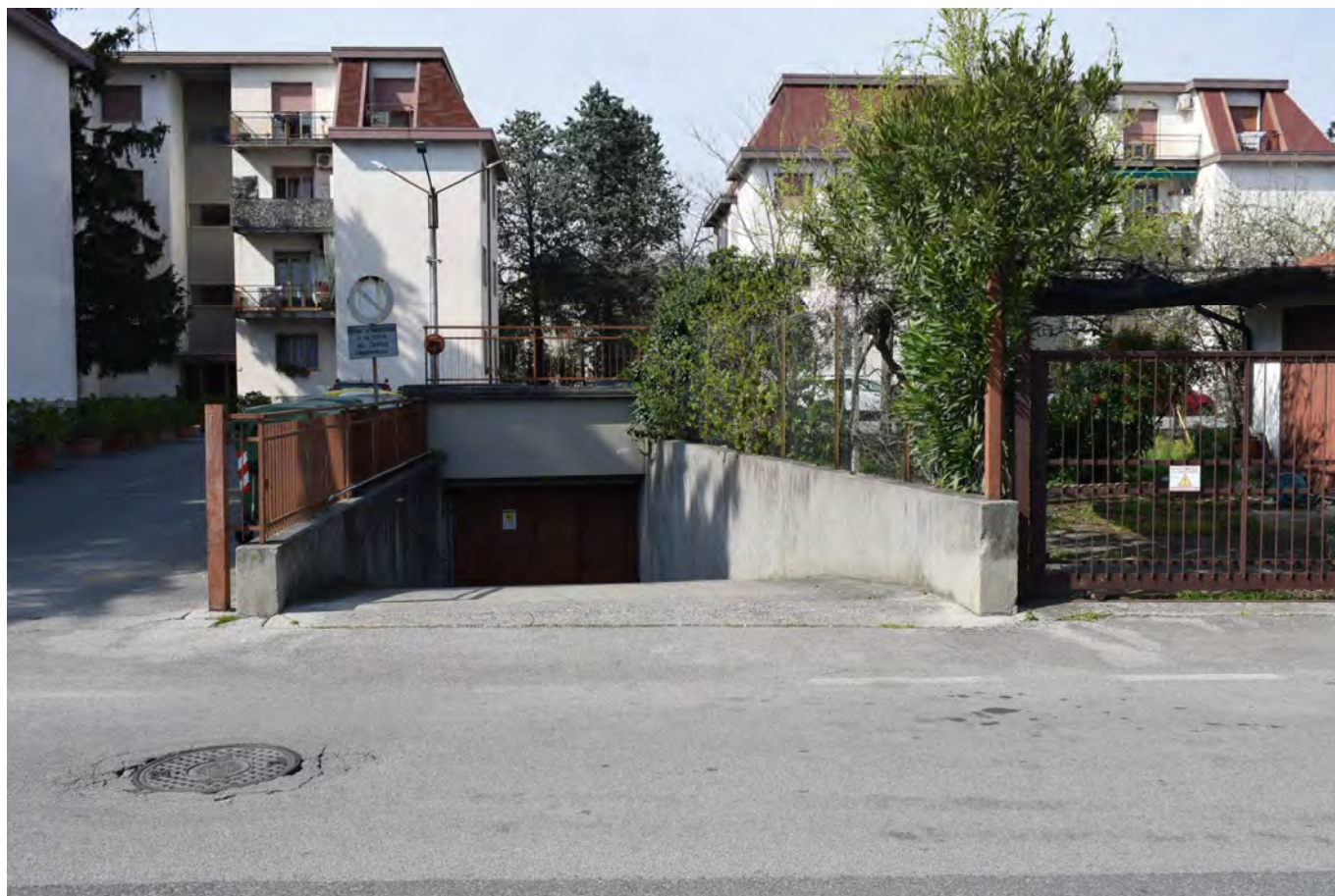
PASSO CARRAIO POSTI AUTO