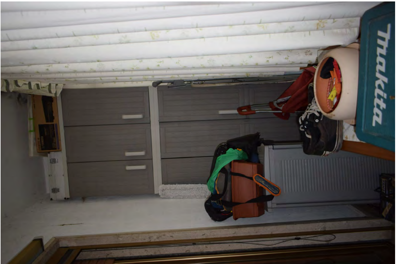
TERRAZZA – VERANDA