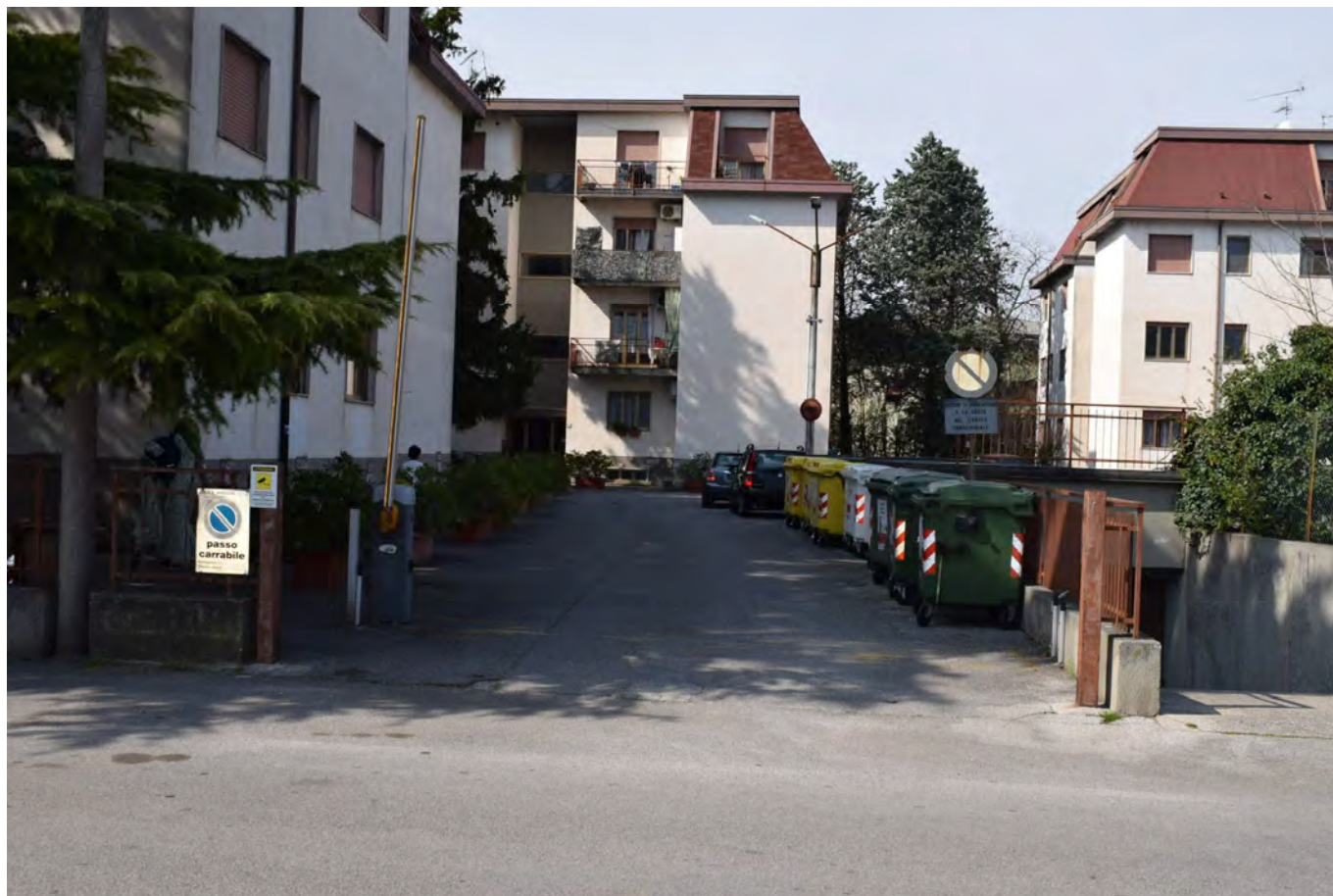
PASSO CARRAIO CONDOMINIO