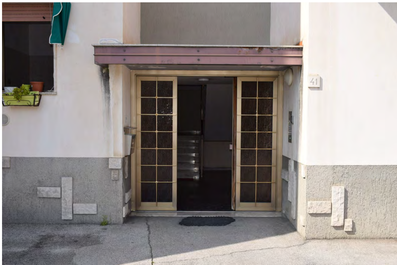
INGRESSO – PROSPETTO PRINCIPALE