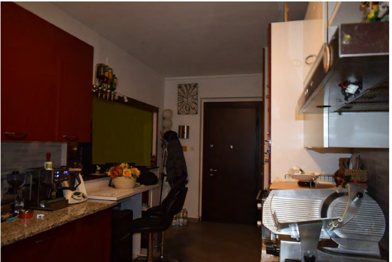
INGRESSO – CUCINA