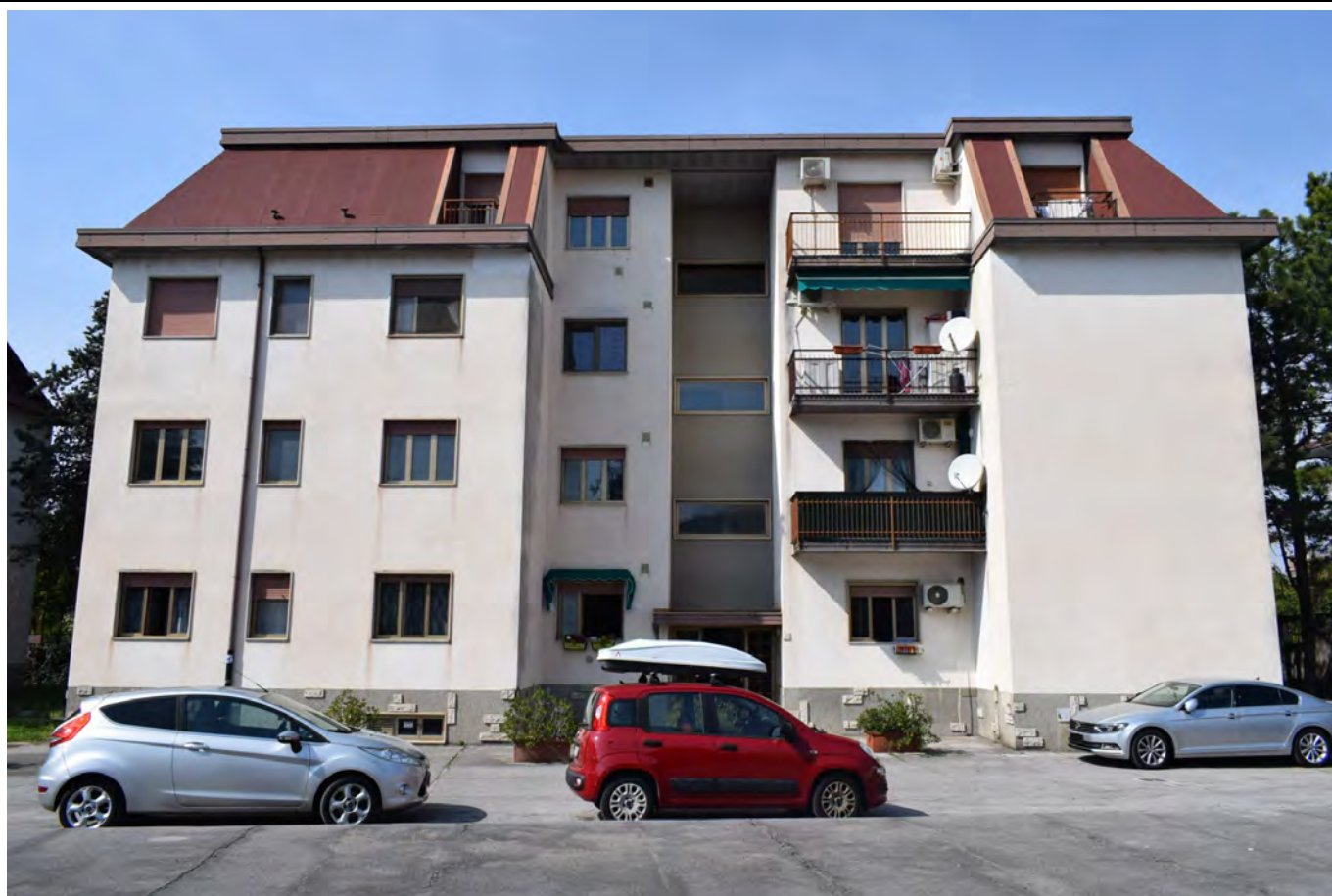
INGRESSO – PROSPETTO PRINCIPALE