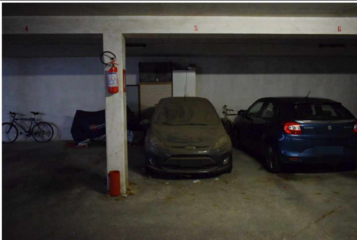
POSTO AUTO COPERTO