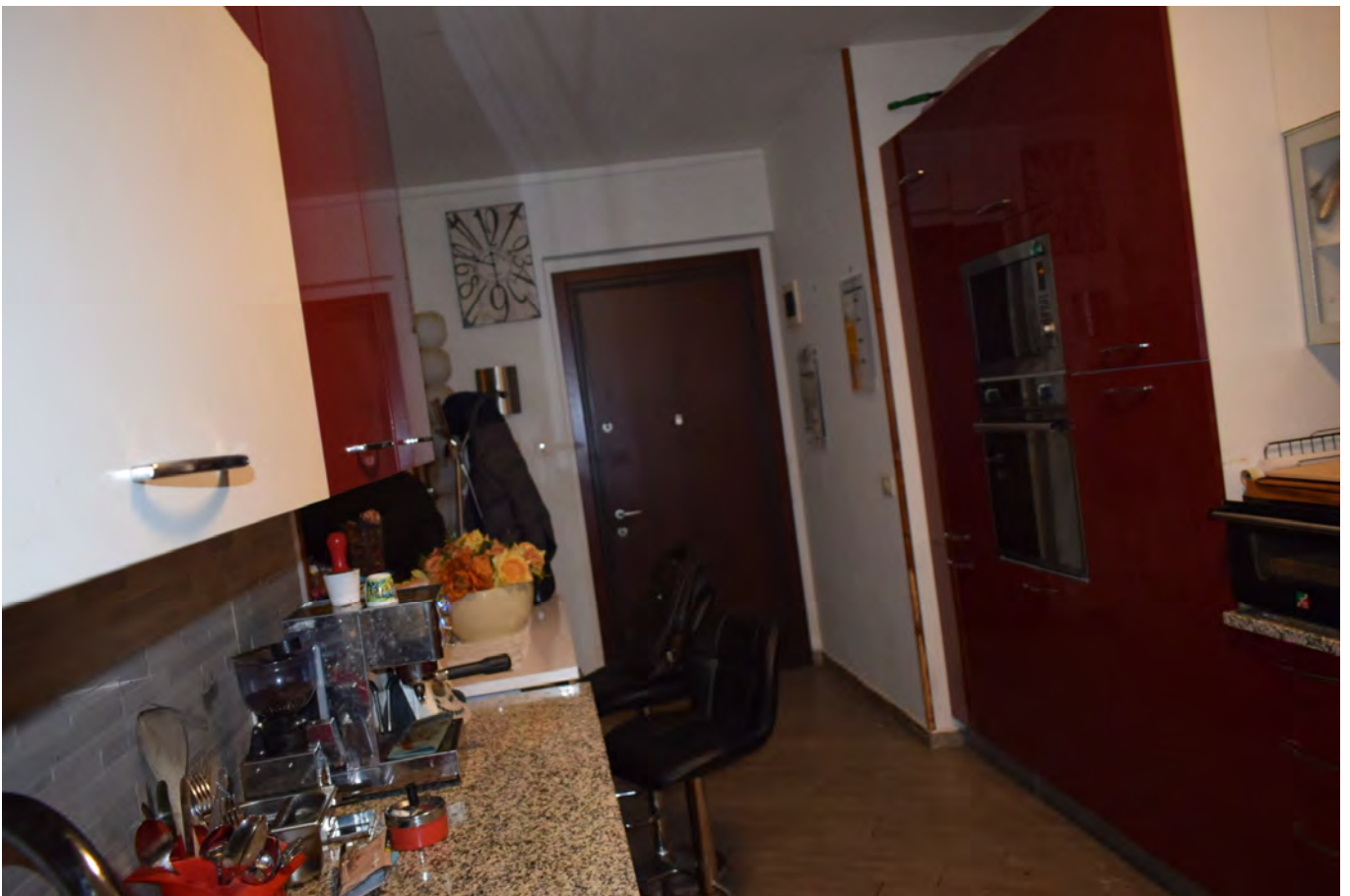
INGRESSO – CUCINA