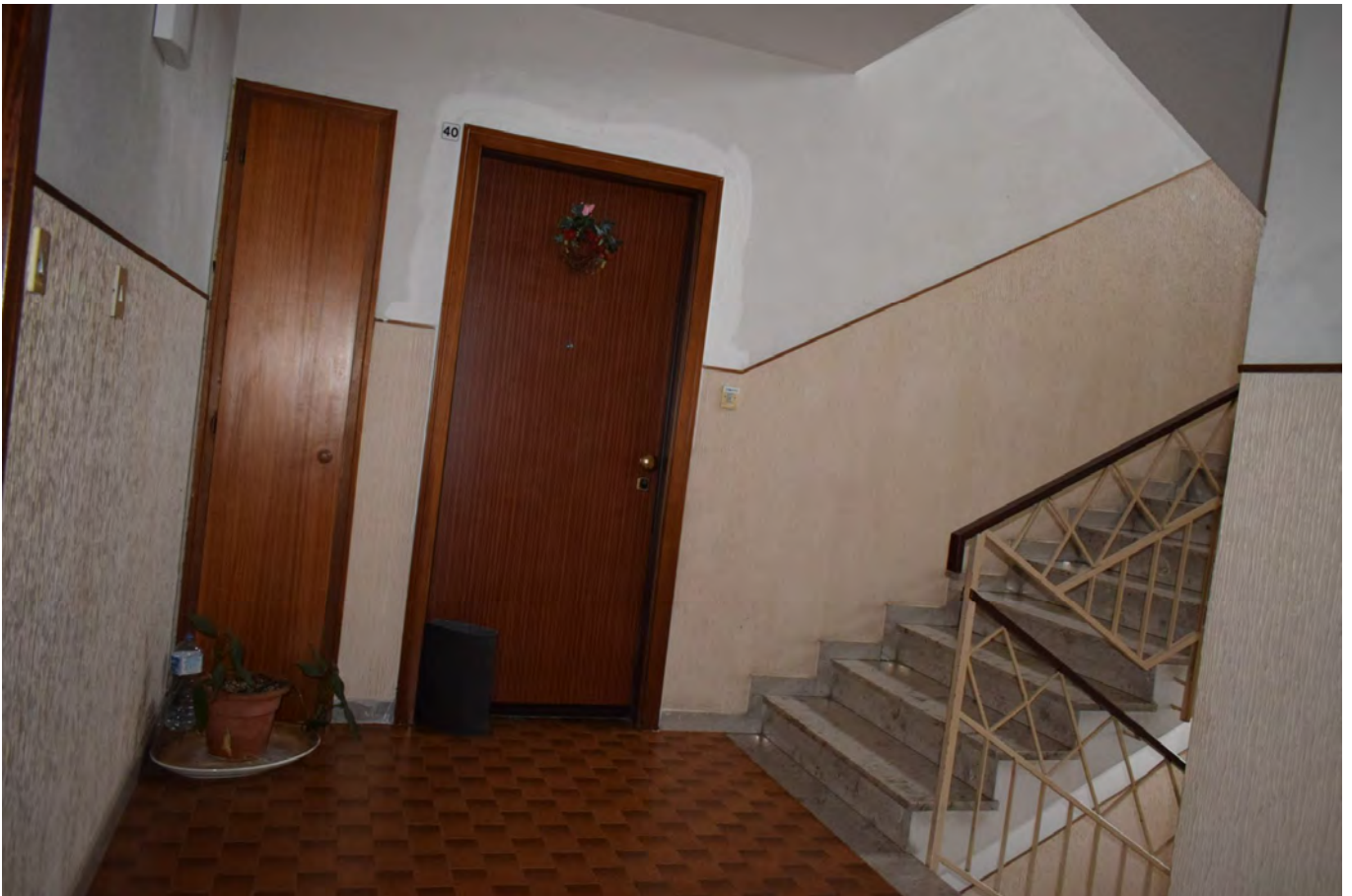
PARTI COMUNI PIANEROTTOLO