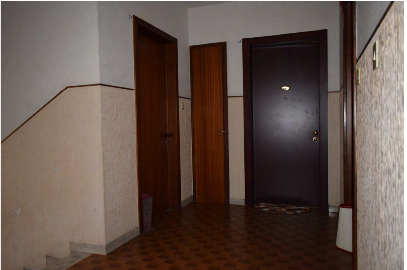
PARTI COMUNI PIANEROTTOLO