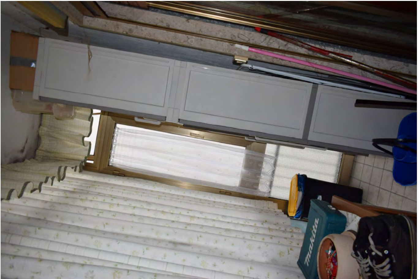
TERRAZZA – VERANDA