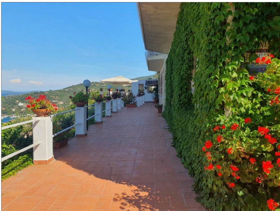
Foto 6 - Vista parti esterne