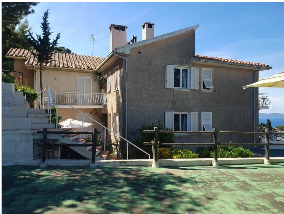
Foto 2 - Vista del retro del fabbricato