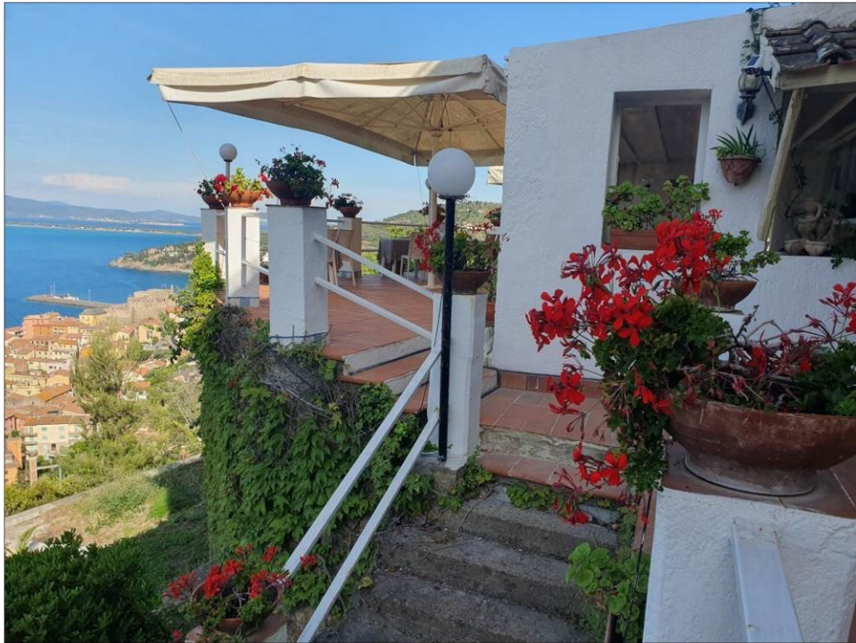
Foto 5 - Vista parti esterne