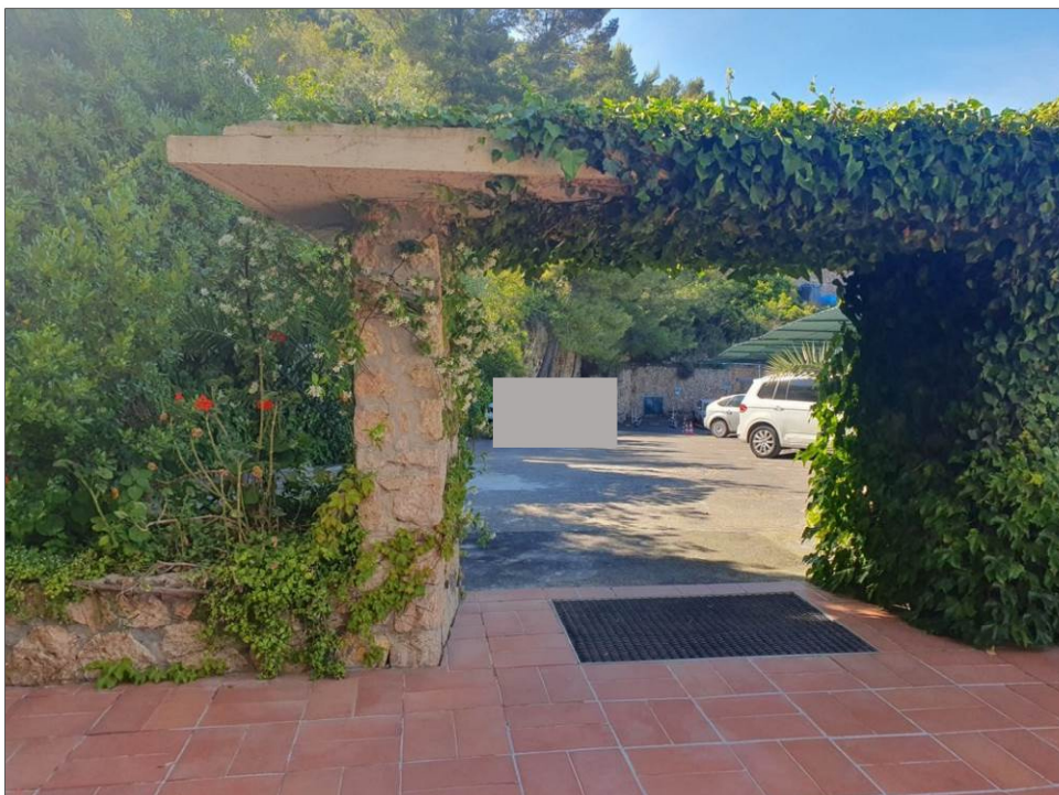
Foto 4 - Vista zona ingresso del fabbricato e parcheggio