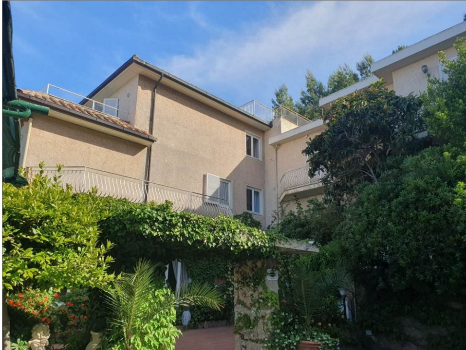
Foto 1 - Vista ingresso struttura alberghiera

Struttura Alberghiera in Via del Sole, Porto Santo Stefano, Comune di Monte Argentario (GR), C.F. Foglio 6 – P.IIa 21