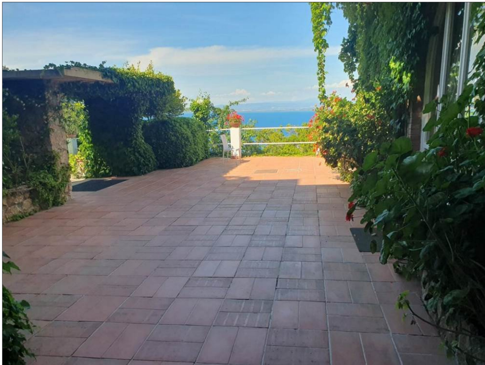
Foto 3 - Vista zona ingresso del fabbricato