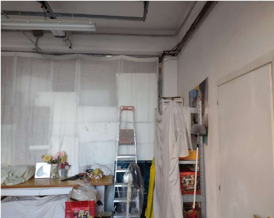
interno sub 13 zona fronte strada , vista parete di confinamento