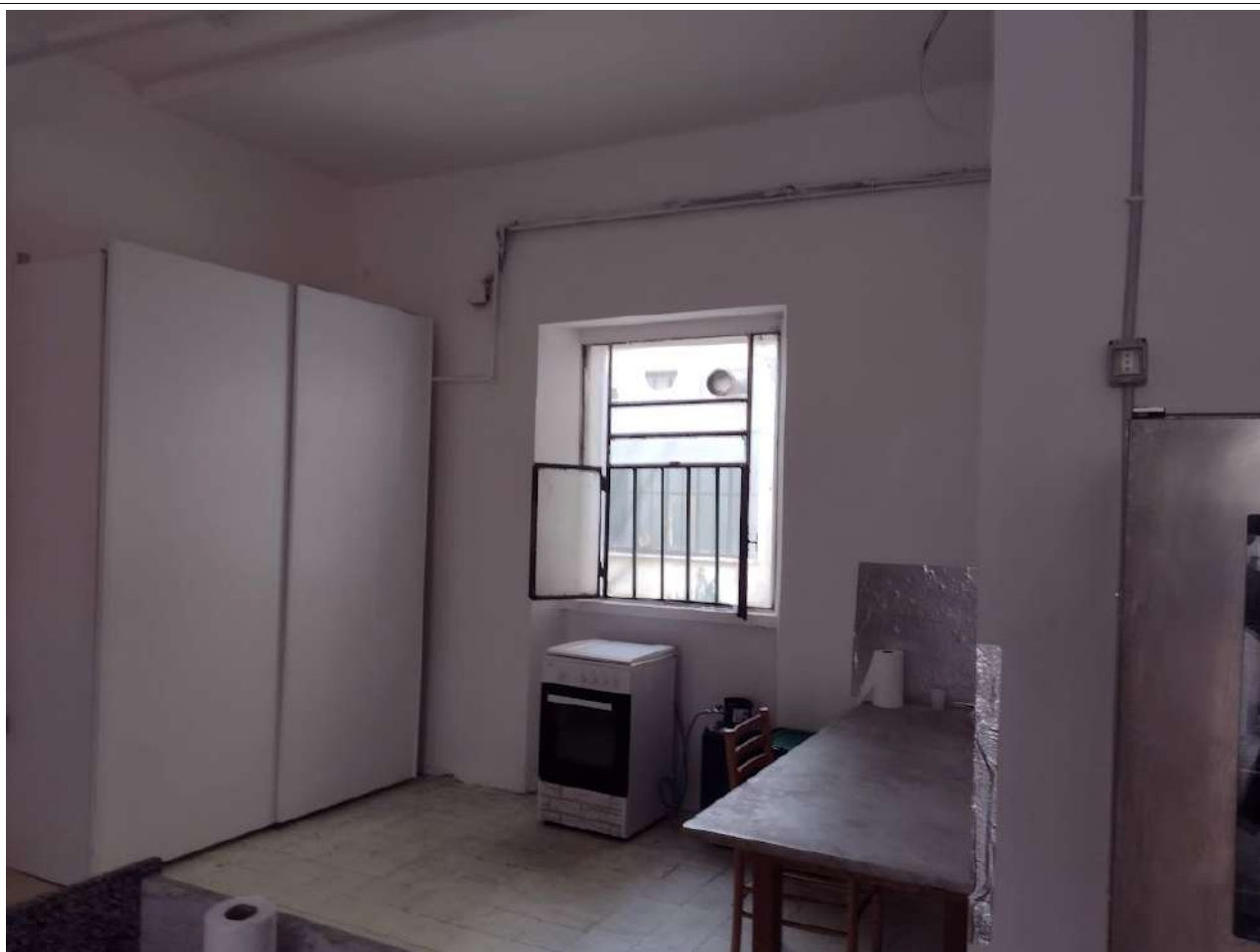
Interno zona sud . Finestra verso area condominiale ovest