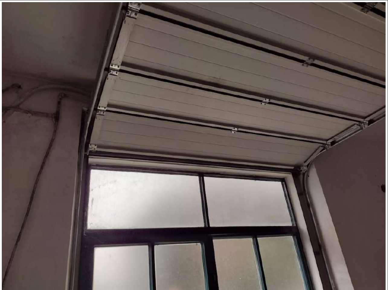
Part portone sezionale interno sub 13 fronte strada su via Manzoni