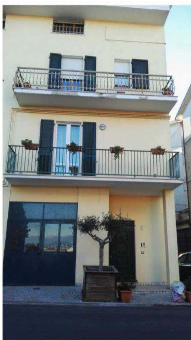
Fronte principale via A. Manzoni