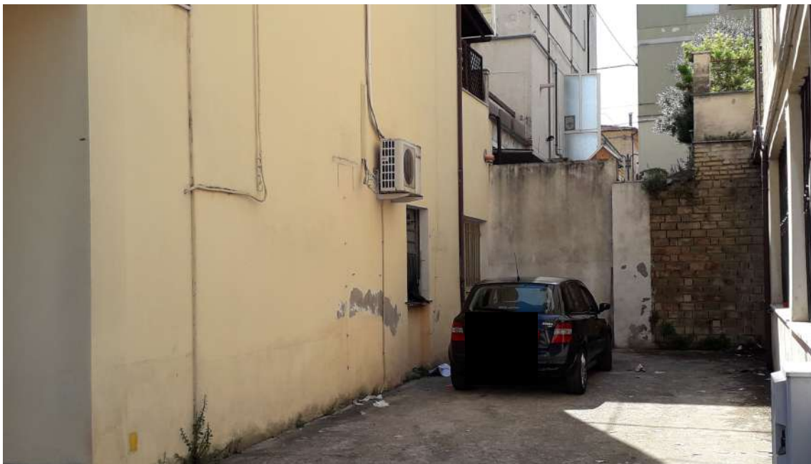
Corte esterna sud est