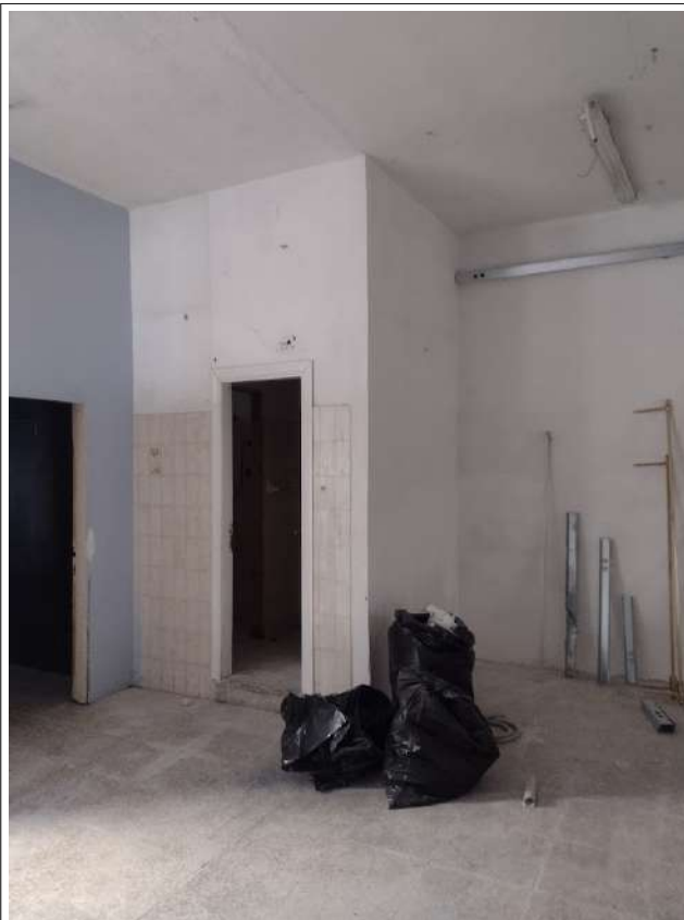
Vista interno zona interclusa sub 13 con accesso da sub 14 non oggetto della procedura- ingresso WC sub 13