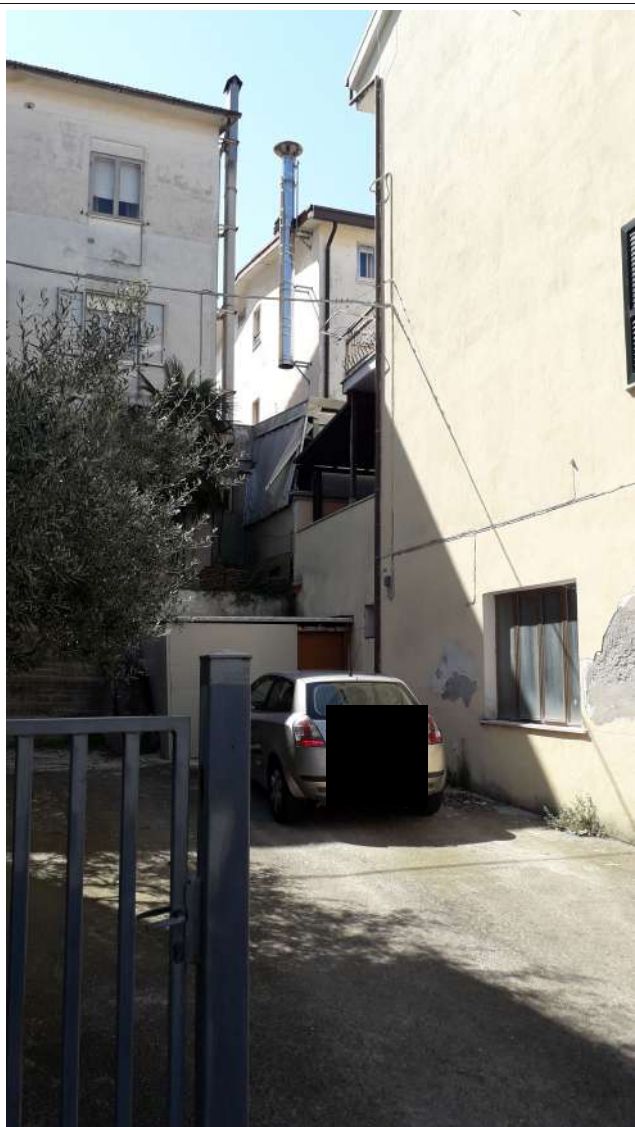
Corte esterna nord-est