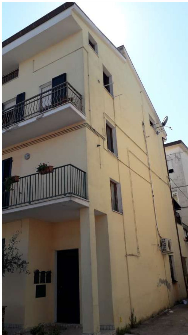
Angolo loggia ingresso