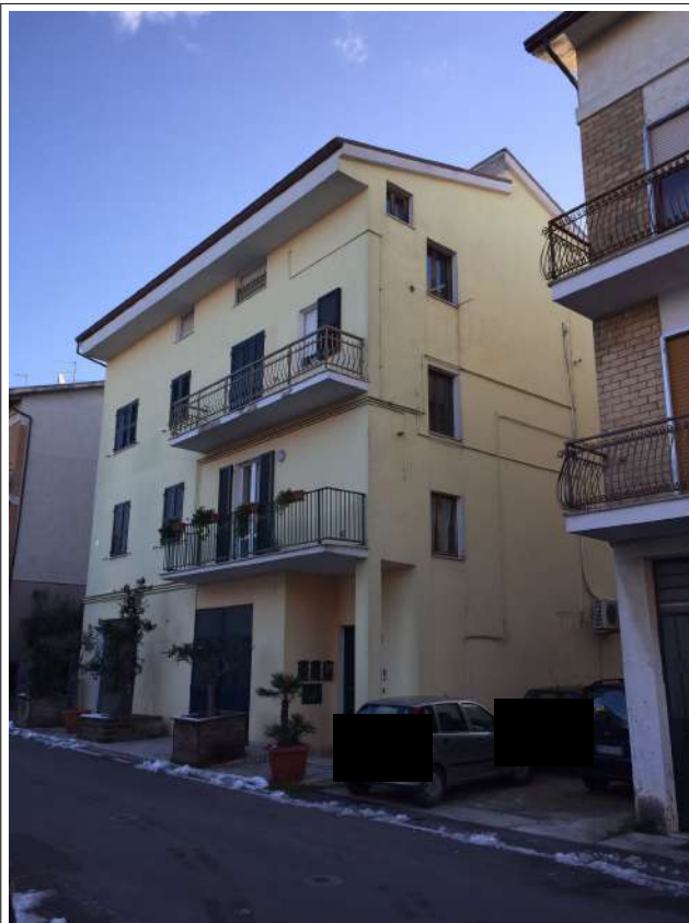
Foto 14/2/21 fronte nord /ovest via Manzoni