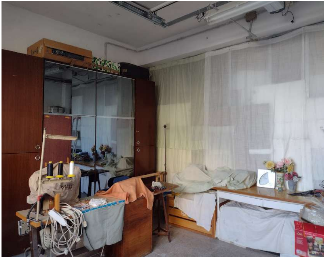
interno sub 13 zona fronte strada con accesso da via Manzoni vista parete di confinamento con la zona sud