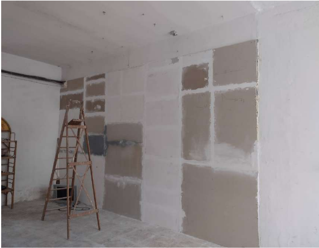
Zona interclusa del sub 13 Parete non autorizzata di compartimentazione tra la zona sud e la zona fronte strada