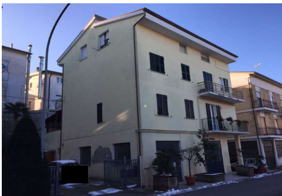
Foto del 14/2/21 fronte nord-est nord/ovest via A.Manzoni