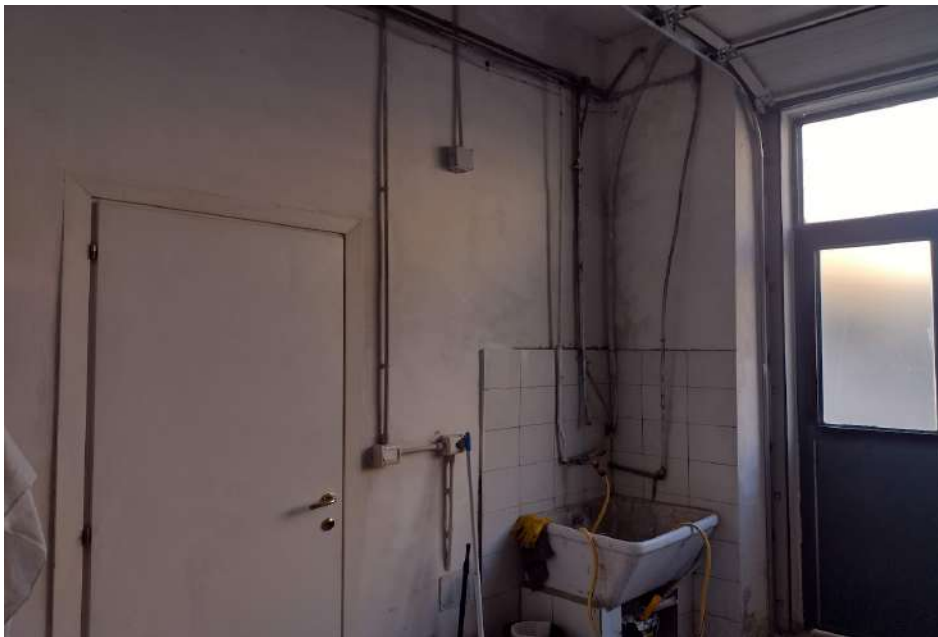
vista interna porzione sub 13 fronte strada