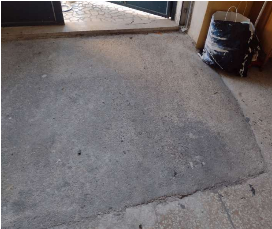
part pavimentazione sub 13 fronte strada