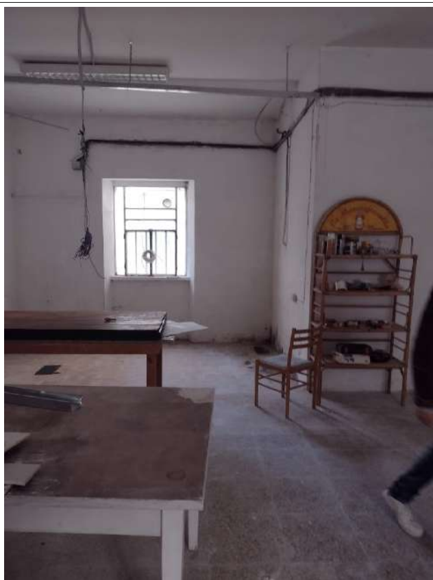
Vista interno zona interclusa sub 13 con accesso da sub 14 non oggetto della procedura