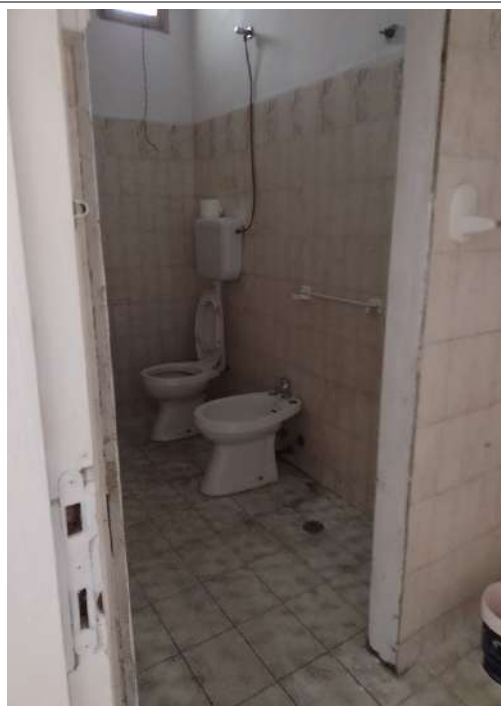
Part interno sub 13 -WC