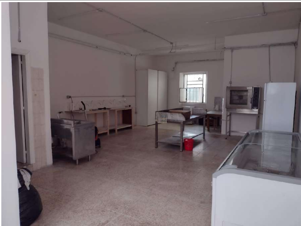
Vista interno zona interclusa sub 13 con accesso da sub 14 non oggetto della procedura