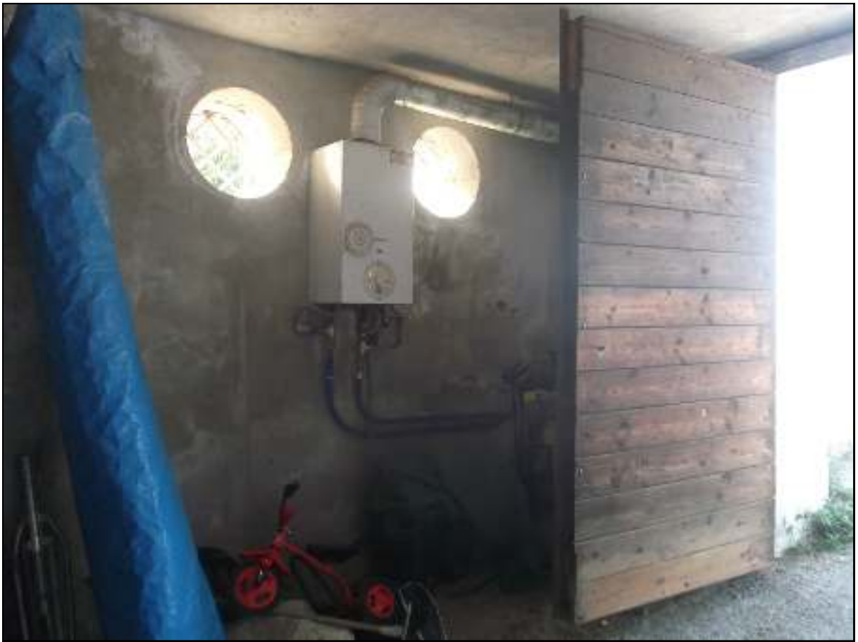
Foto n. 9. Comune di Pozzuoli - Via Cuma di Licola n°152. Causa R.G.E. 241/2017. Interni. Vista dall'interno verso l'ingresso sulla strada pubblica. Sono visibili le due finestre tipo oblò, che forniscono luce naturale e aerazione al locale. Nel garage-deposito è installata una caldaia.