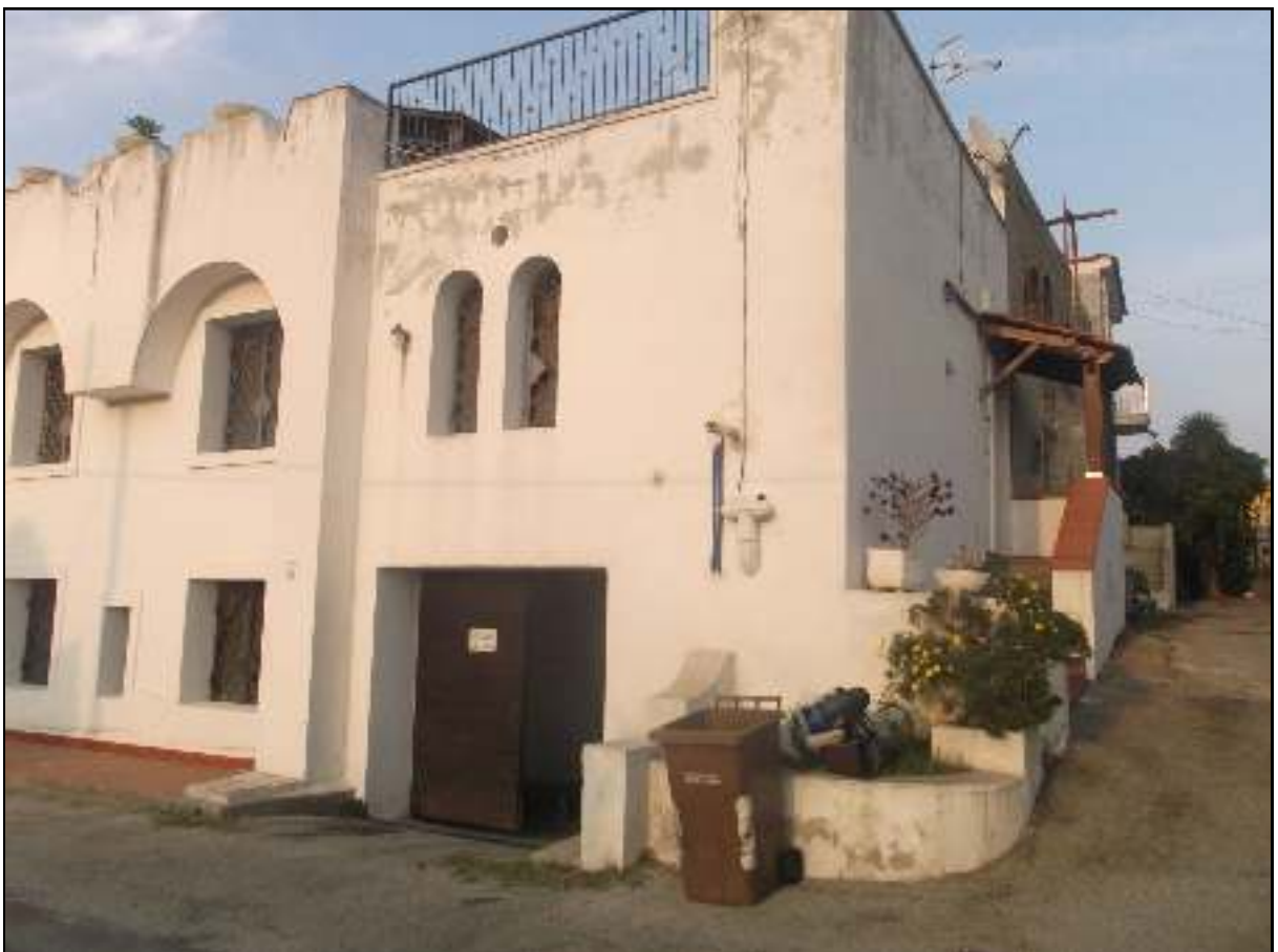
Foto n. 5. Comune di Pozzuoli - Via Cuma di Licola n°152. Causa R.G.E. 241/2017. Esterni. Vista dalla strada pubblica: particolare dell'ingresso al garage-deposito e dell'appartamento con scala di accesso laterale sub 8.