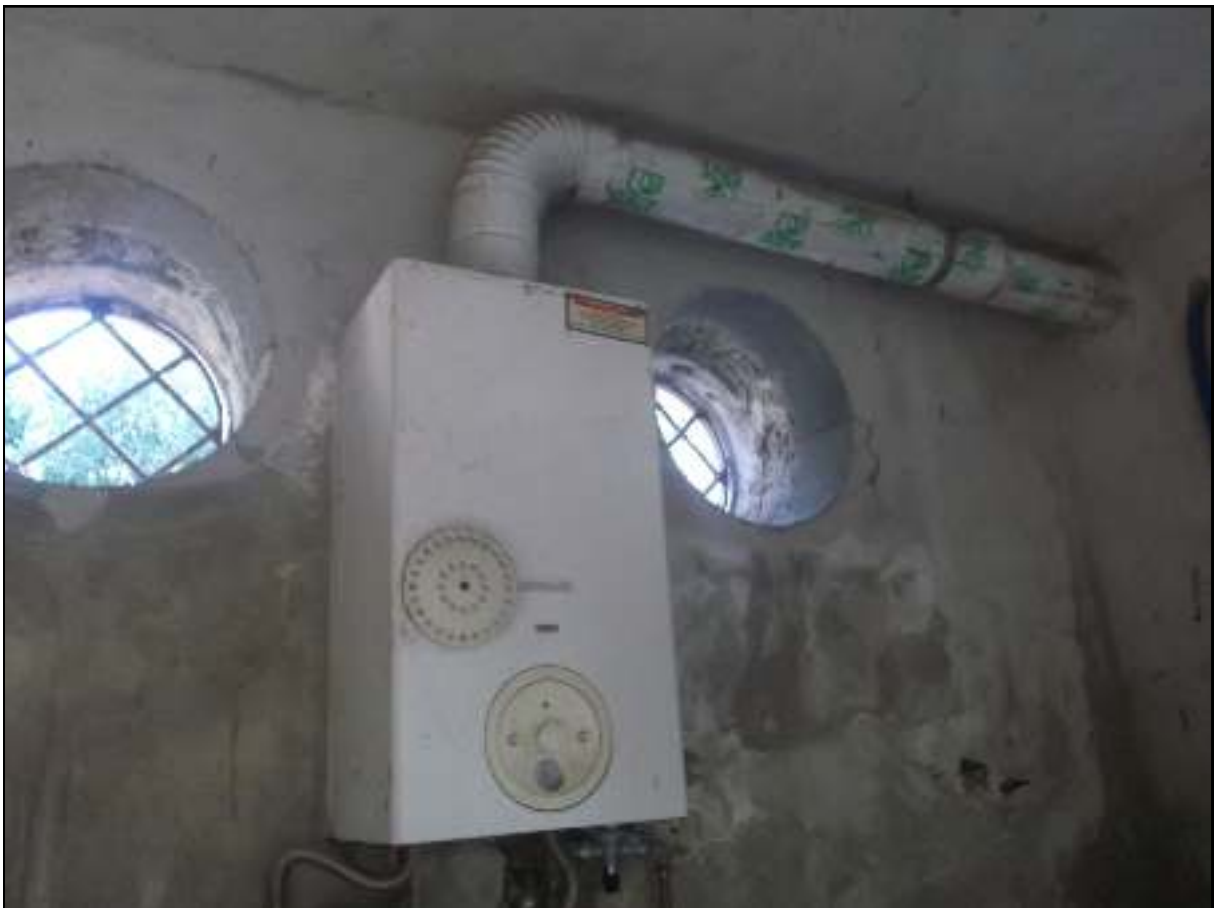
Foto n. 10. Comune di Pozzuoli - Via Cuma di Licola n°152. Causa R.G.E. 241/2017. Interni. Particolare della caldaia installata all'interno del garage-deposito.