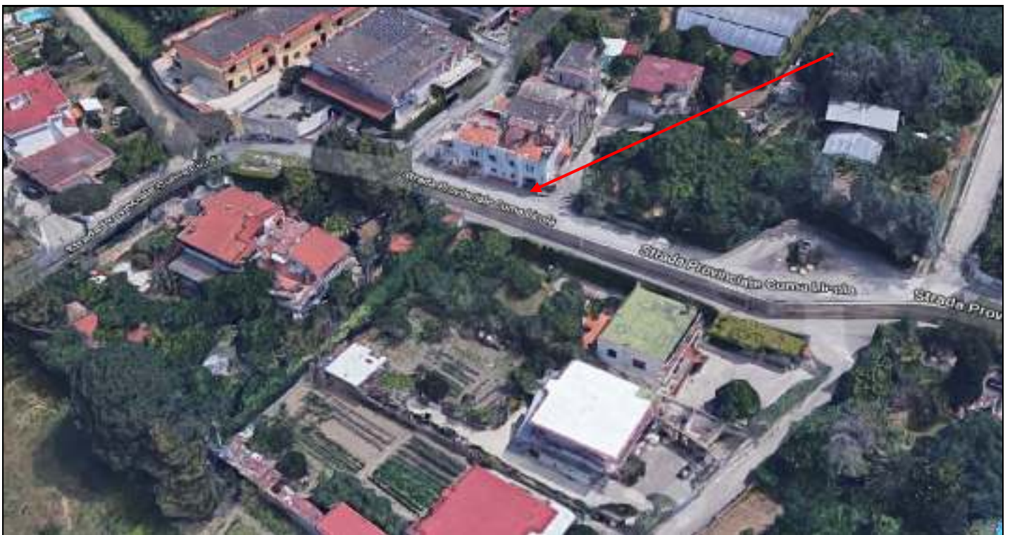
Foto n. 2. Comune di Pozzuoli - Via Cuma di Licola n°152. Causa R.G.E. 241/2017. Esterni. Vista dall'alto del fabbricato, nel quale a piano terra si trova l'immobile in questione: garage-deposito, con ingresso direttamente dalla strada pubblica.