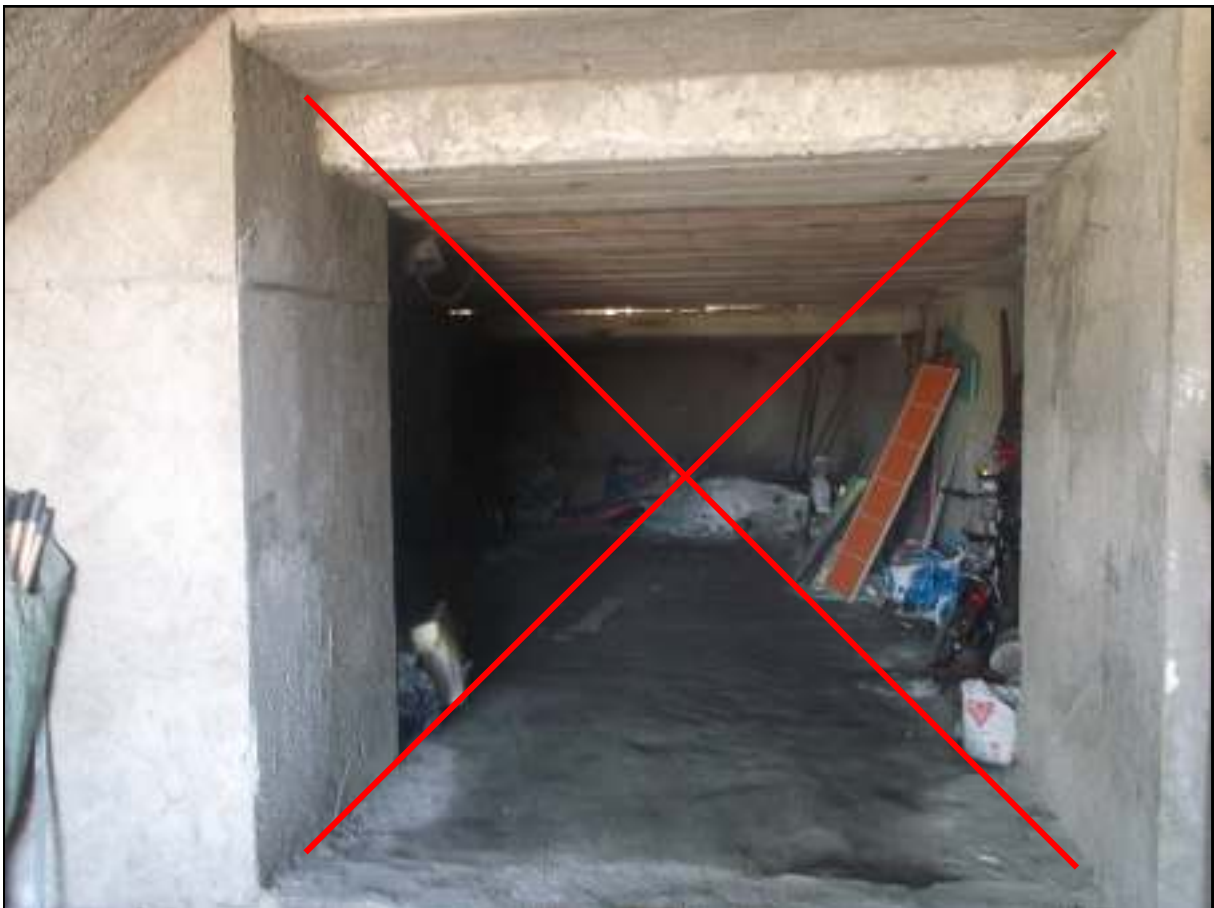
Foto n. 8. Comune di Pozzuoli - Via Cuma di Licola n°152. Causa R.G.E. 241/2017. Interni. Vista dal limite dell'immobile oggetto della procedura. Gli ambienti posteriori non sono parte di codesta procedura di esecuzione immobiliare.