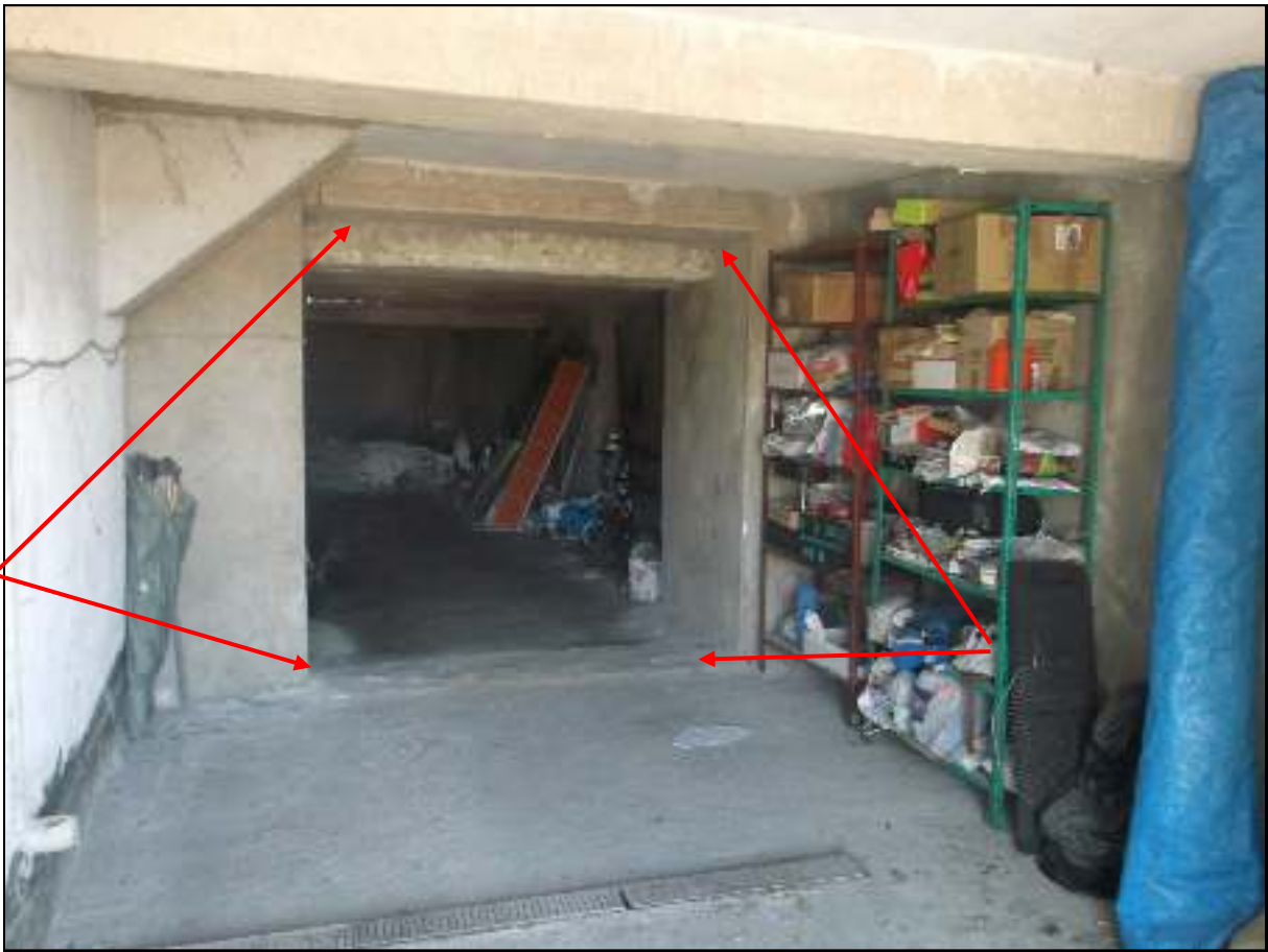
Foto n. 7. Comune di Pozzuoli - Via Cuma di Licola n°152. Causa R.G.E. 241/2017. Interni. Vista dalla strada pubblica dell'interno dell'immobile garage-deposito. L'immobile oggetto della procedura ha limite indicato dalle frecce, inferiormente soglia, superiormente piattabanda. In tale posto dovrà essere chiuso la comunicazione con la zona posteriore, estranea alla procedura.