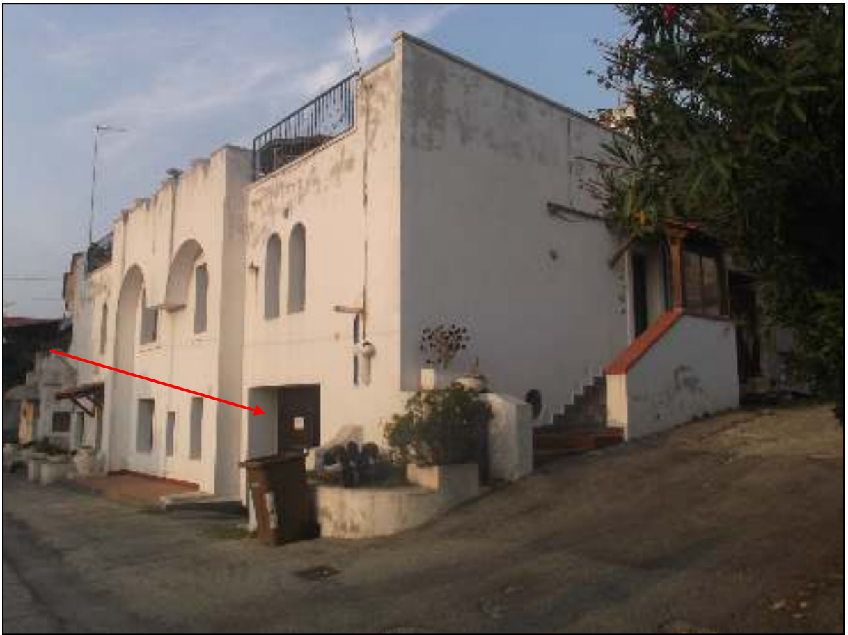
Foto n. 4. Comune di Pozzuoli - Via Cuma di Licola n°152. Causa R.G.E. 241/2017. Esterni. Vista dalla strada pubblica: è indicato l'ingresso al garage-deposito. Il fabbricato, dati catastali Fabbricati Pozzuoli Fgl. 8 P.lla 1159, è composto da altre due unità immobiliari: sulla sinistra l'immobile (a due piani) sub 7; a questo adiacente e superiormente al garage-deposito de quo e con ingresso laterale con scala al livello primo immobile sub 8.