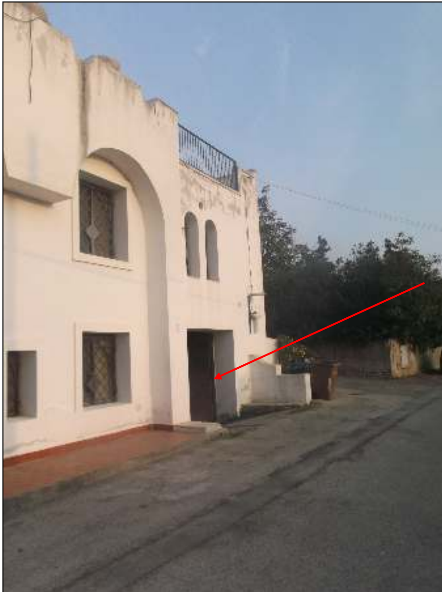
Foto n. 3. Comune di Pozzuoli - Via Cuma di Licola n°152. Causa R.G.E. 241/2017. Esterni. Vista dalla strada pubblica: è indicato l'ingresso al garage-deposito.