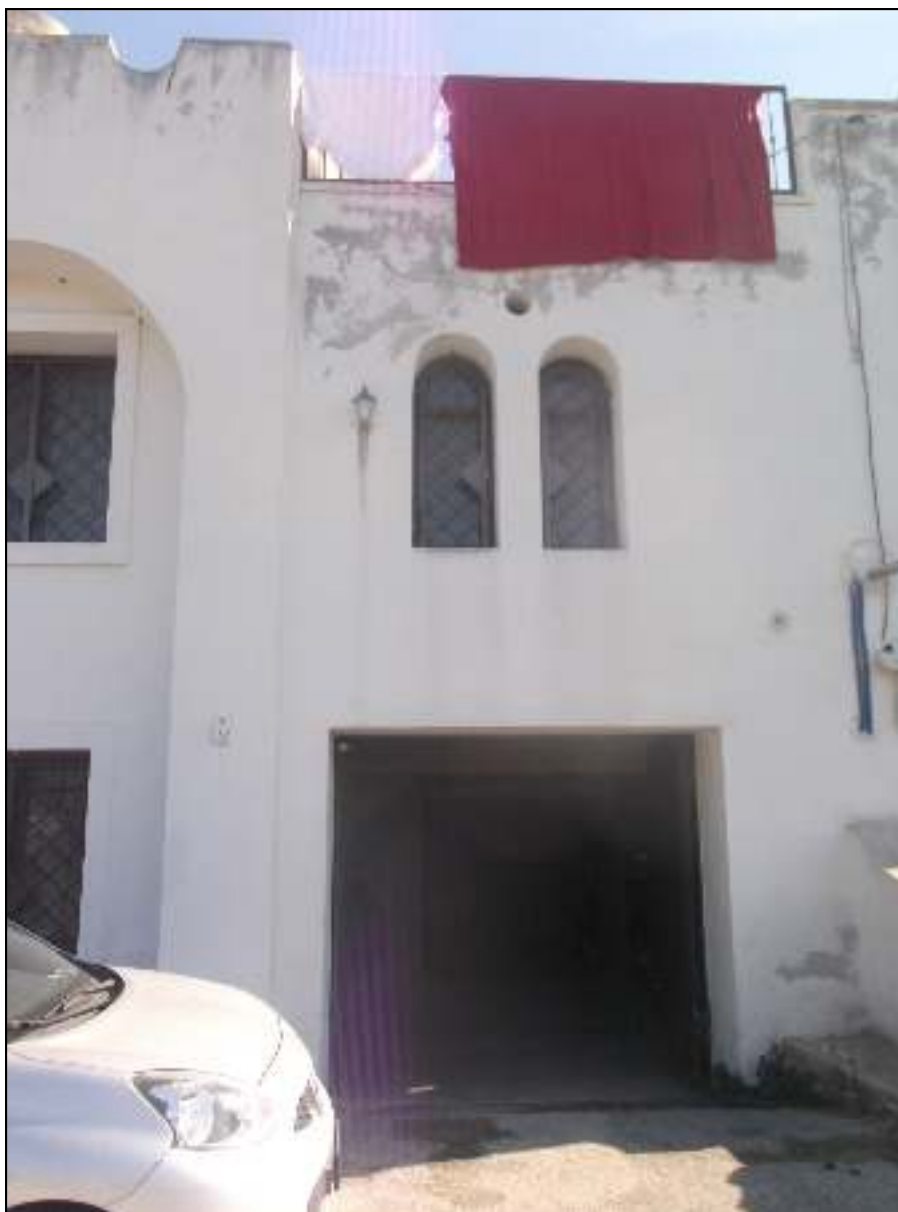
Foto n. 6. Comune di Pozzuoli - Via Cuma di Licola n°152. Causa R.G.E. 241/2017. Esterni. Vista dalla strada pubblica: particolare dell'ingresso al garage-deposito. Dalla strada pubblica all'interno c'è una differenza di quota di circa 50 cm, superato con una rampa.