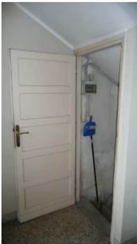
ACCESSO AL PIANO CANTINATO