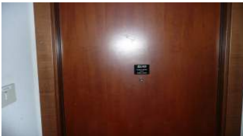
PORTA DI ACCESSO