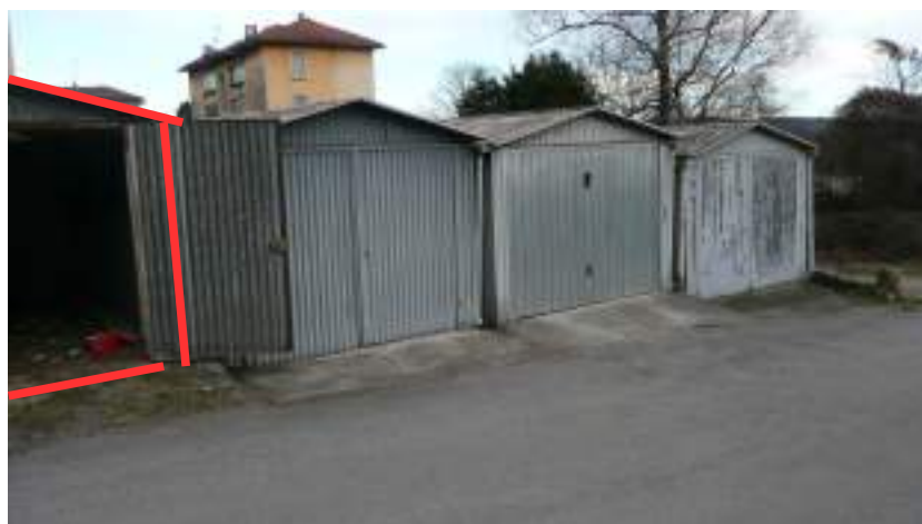
BARACCA POSTERIORE SU AREA DI PROPRIETA'