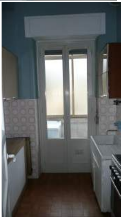
VANO CUCINA ( CUOCIVIVANDE)