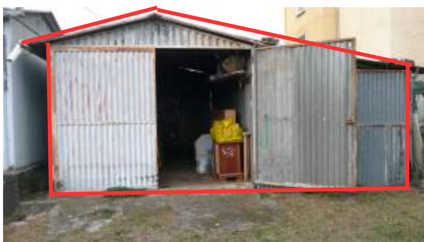
BARACCA LATERALE SU AREA DI PROPRIETA'