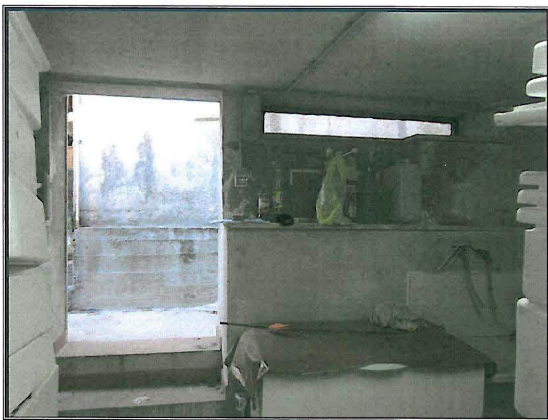
Magazzino abusivo Viste interne dell'edificio ad uso residenziale