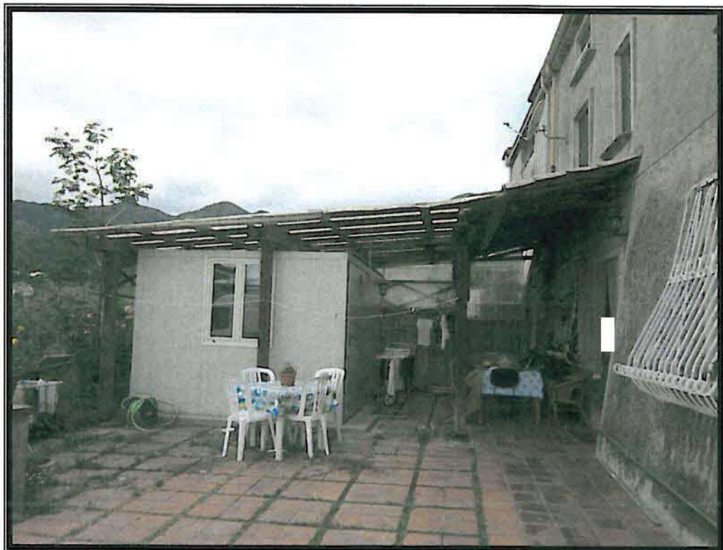
Vista Esterna- Area Cortilizia