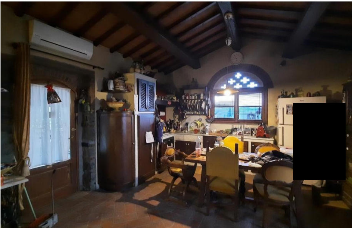
Foto 10 - zona pranzo e angolo cottura