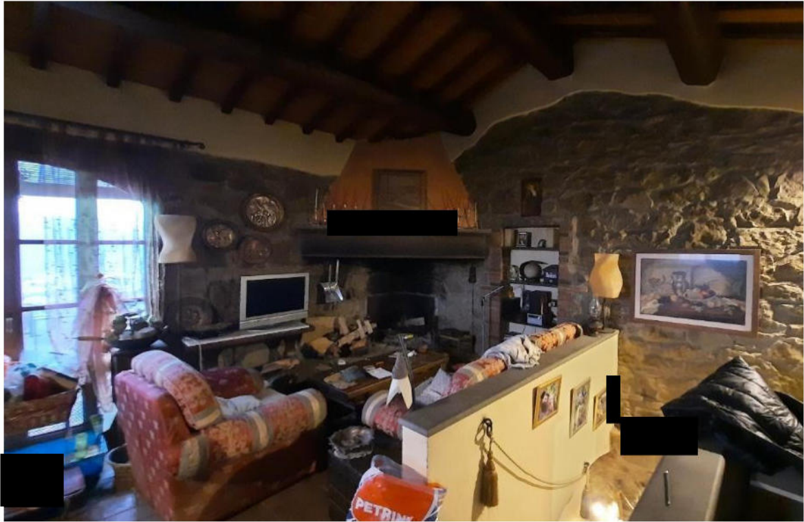
Foto 9 - soggiorno