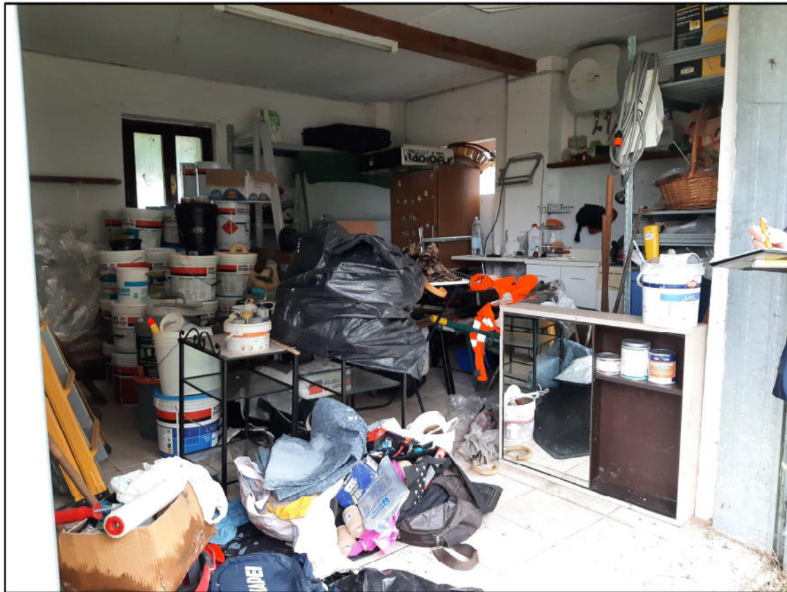
F 13 - Autorimessa