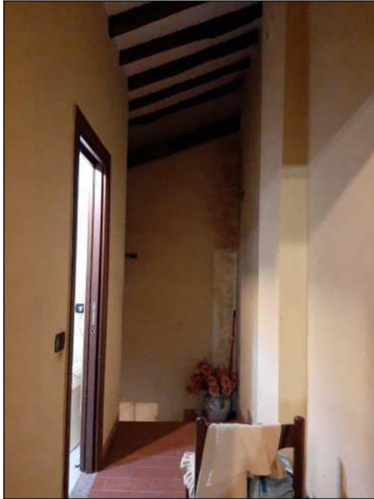
F 9 - Primo Piano