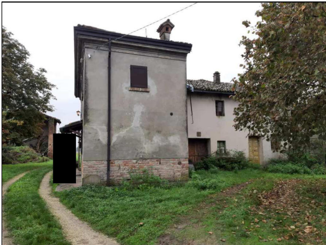
F 2 - Fronte Nord