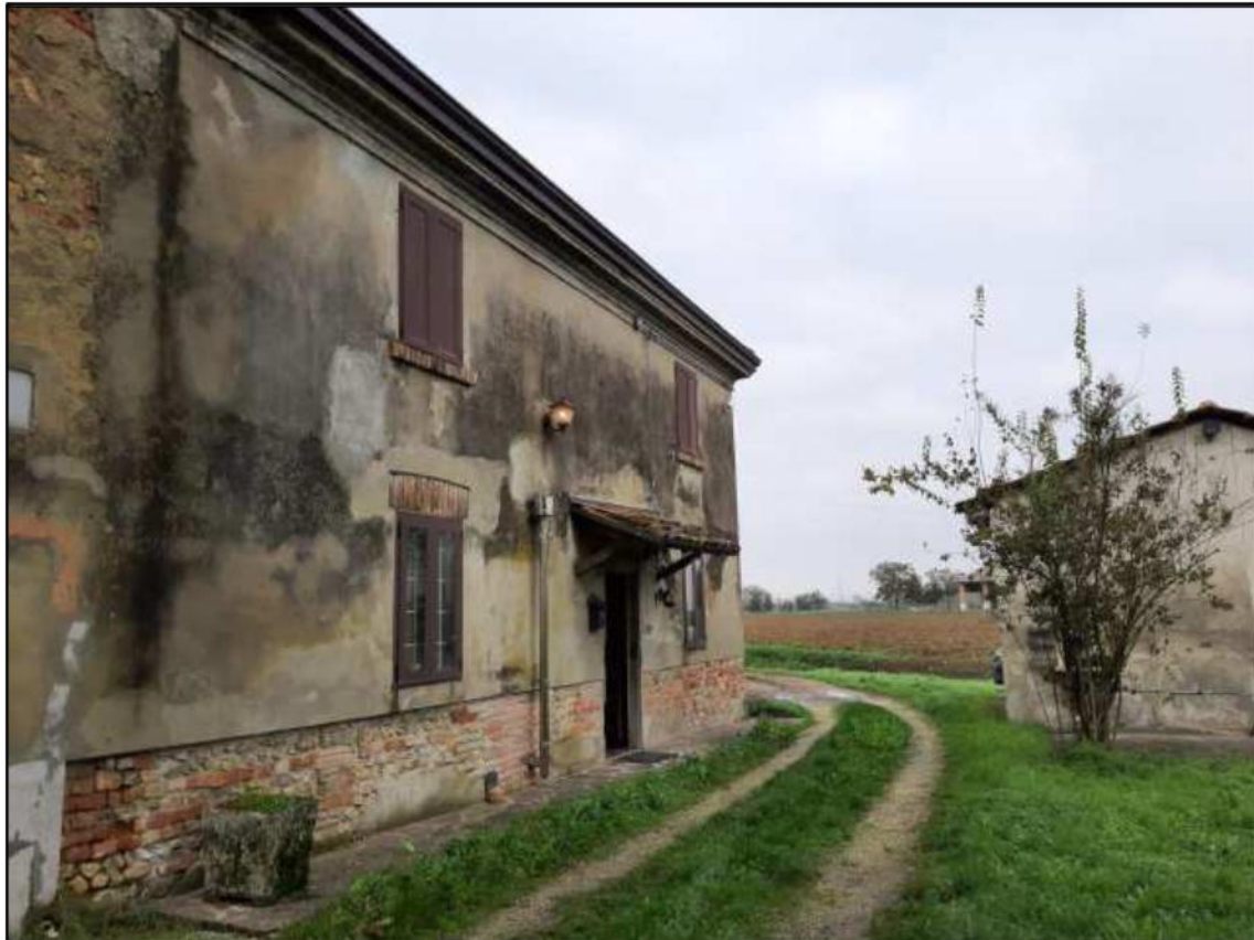
F 1 - Fronte Est