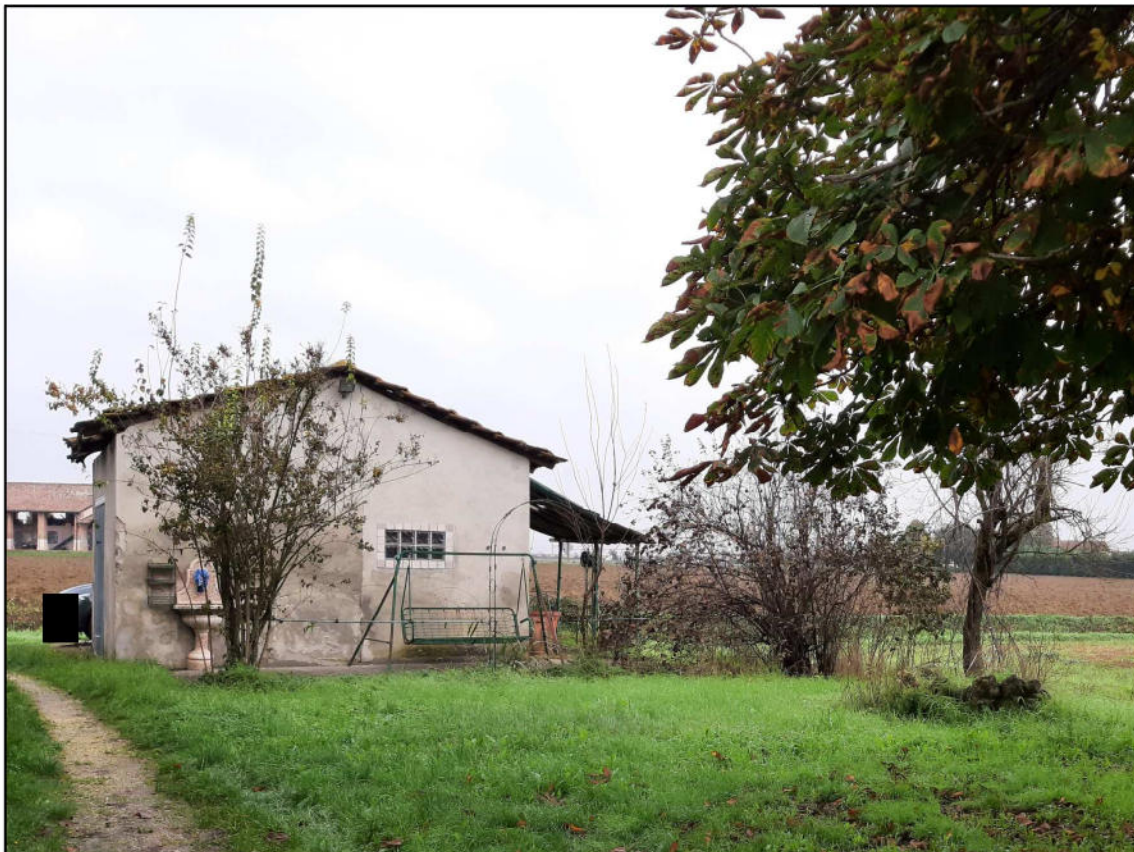
F 12 - Autorimessa