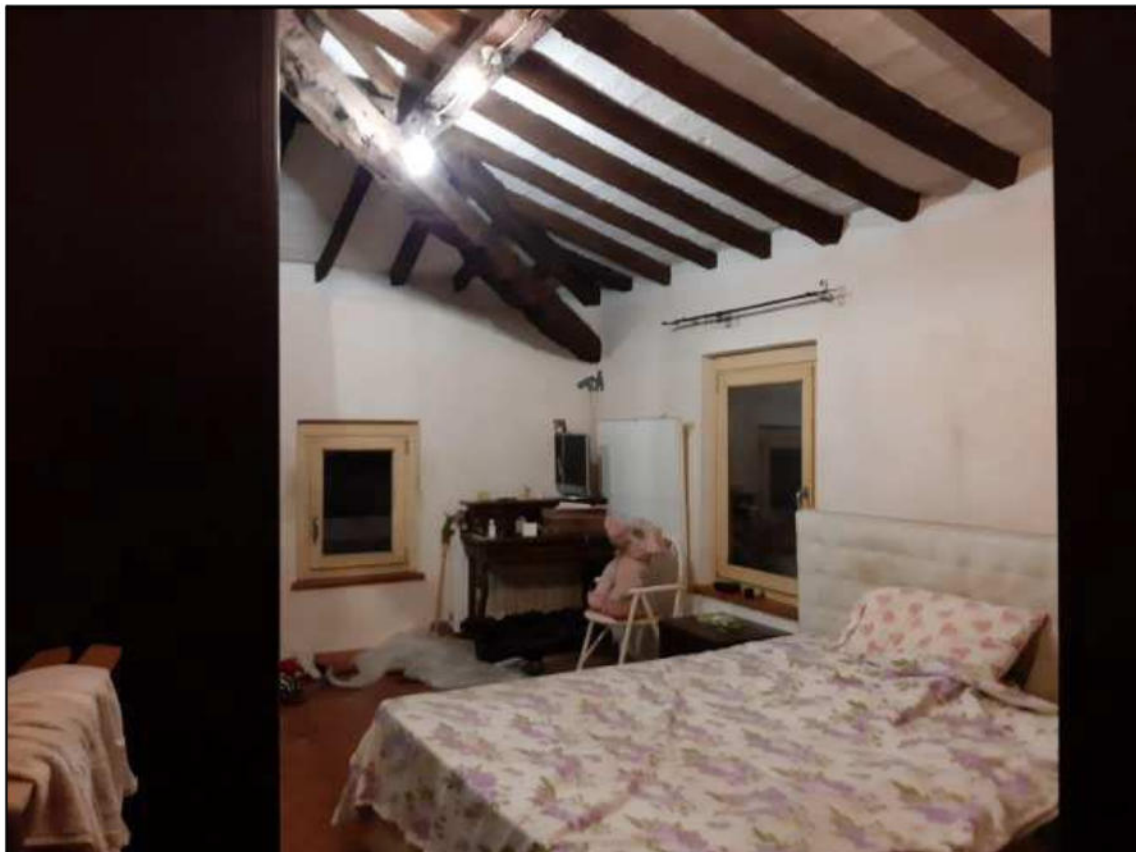
F 8 - Primo Piano