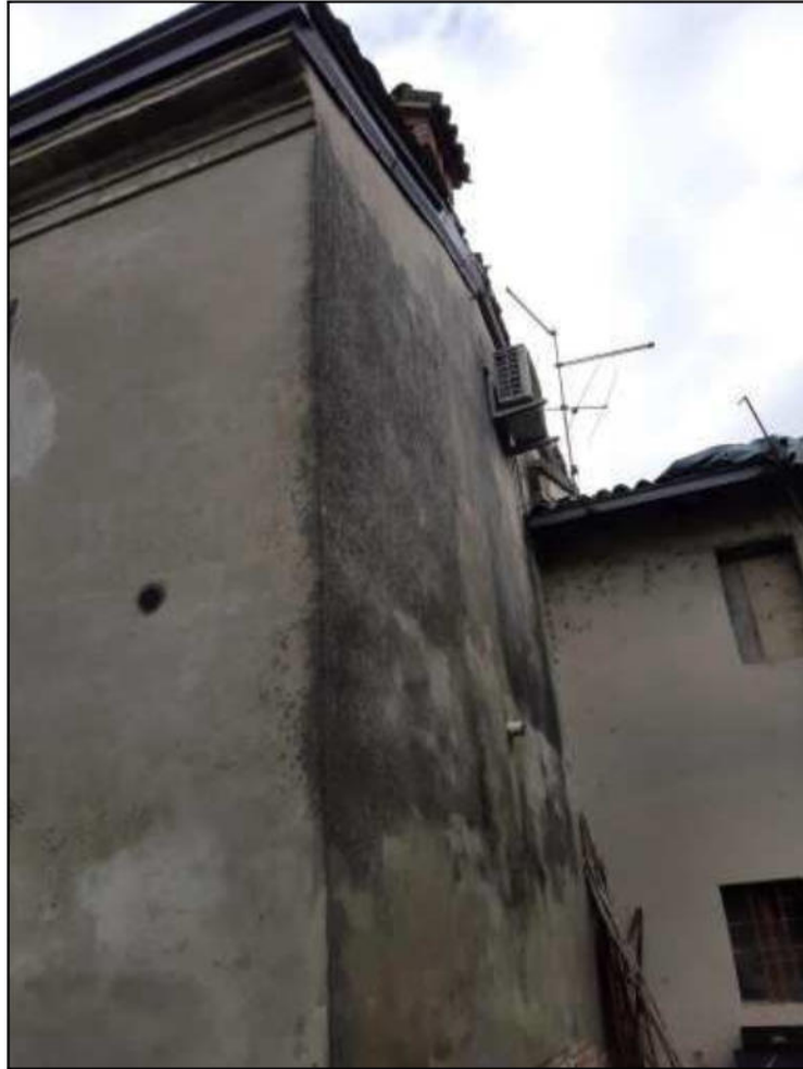
F 5 - Fronte Ovest