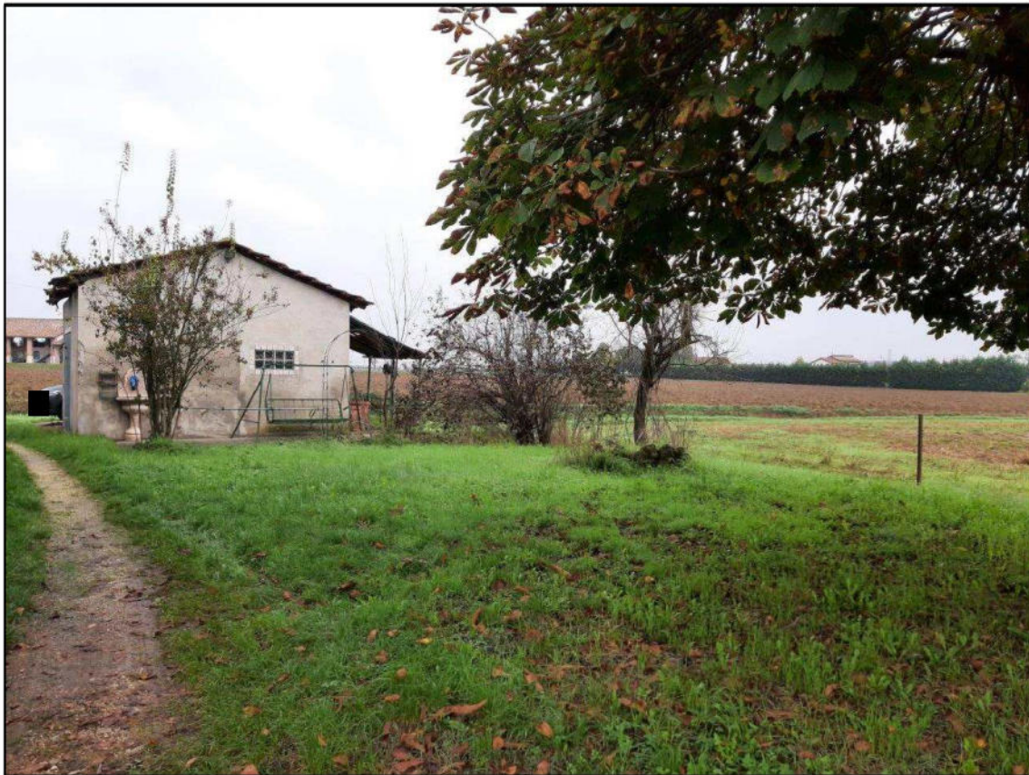
F 3 - Area di pertinenza e autorimessa