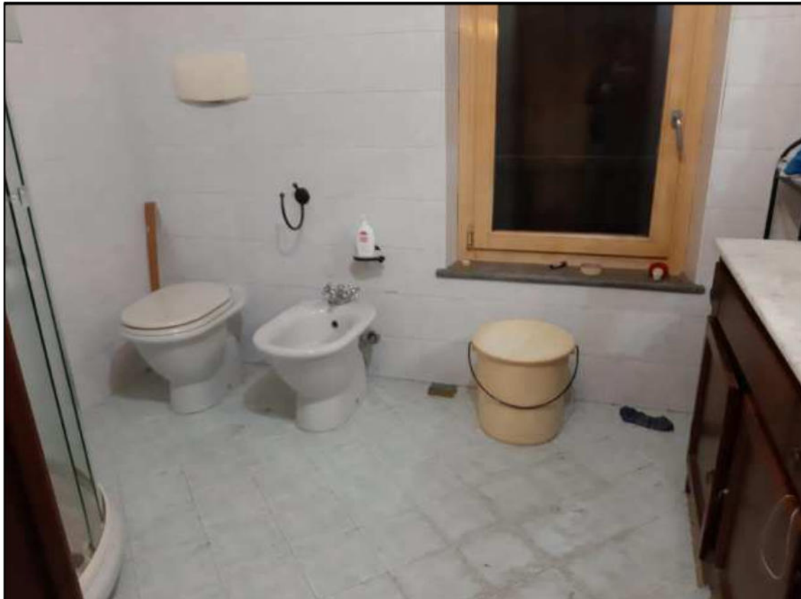
F 10 - Primo Piano