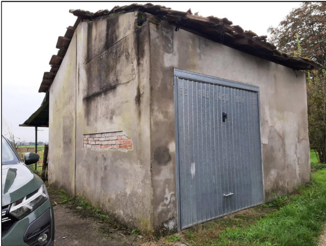
F 11 - Autorimessa