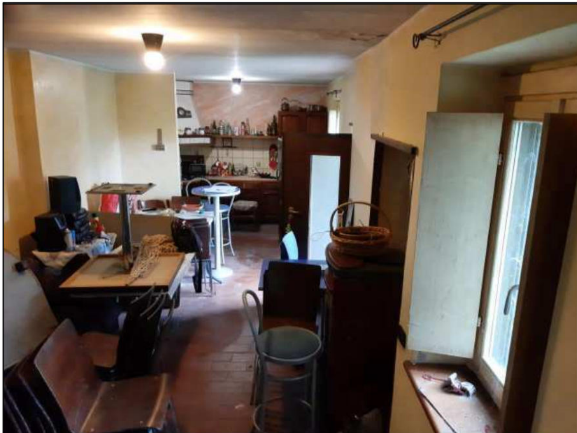
F 7 - Piano Terra