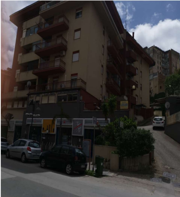
Foto n.1 Prospetto dalla via Imera

A) L'immobile a cui il locale appartiene è un fabbricato sito nella via Imera n. 149 a sei elevazioni fuori terra oltre piano seminterrato realizzato con struttura portante in c.a. e copertura in parte piana e in parte a tetto (v. foto n. 1 e 2).