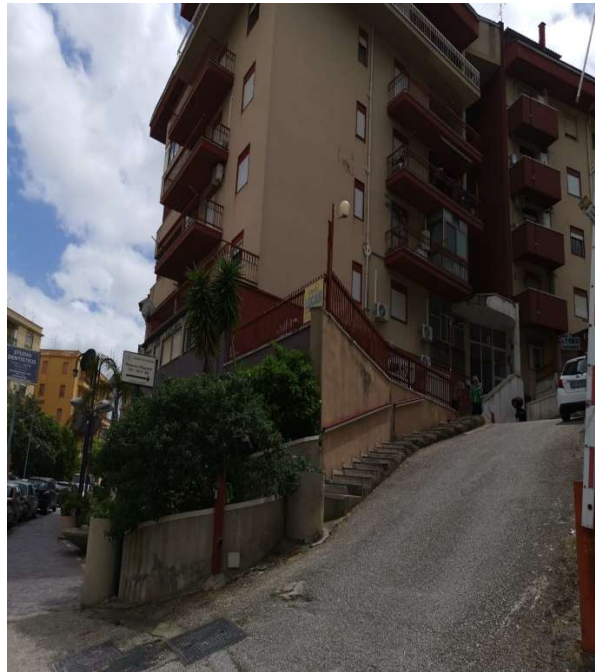
Foto n.2 Prospetto dalla traversa di via Imera

L'unità immobiliare, ha accesso dalla traversa di via Imera a mezzo portone posto al civico n.149 (v.foto n.3) e corridoio interno (v. foto 4-5) che conduce, procedendo a sinistra all'interno n.4 (v. foto n.6).