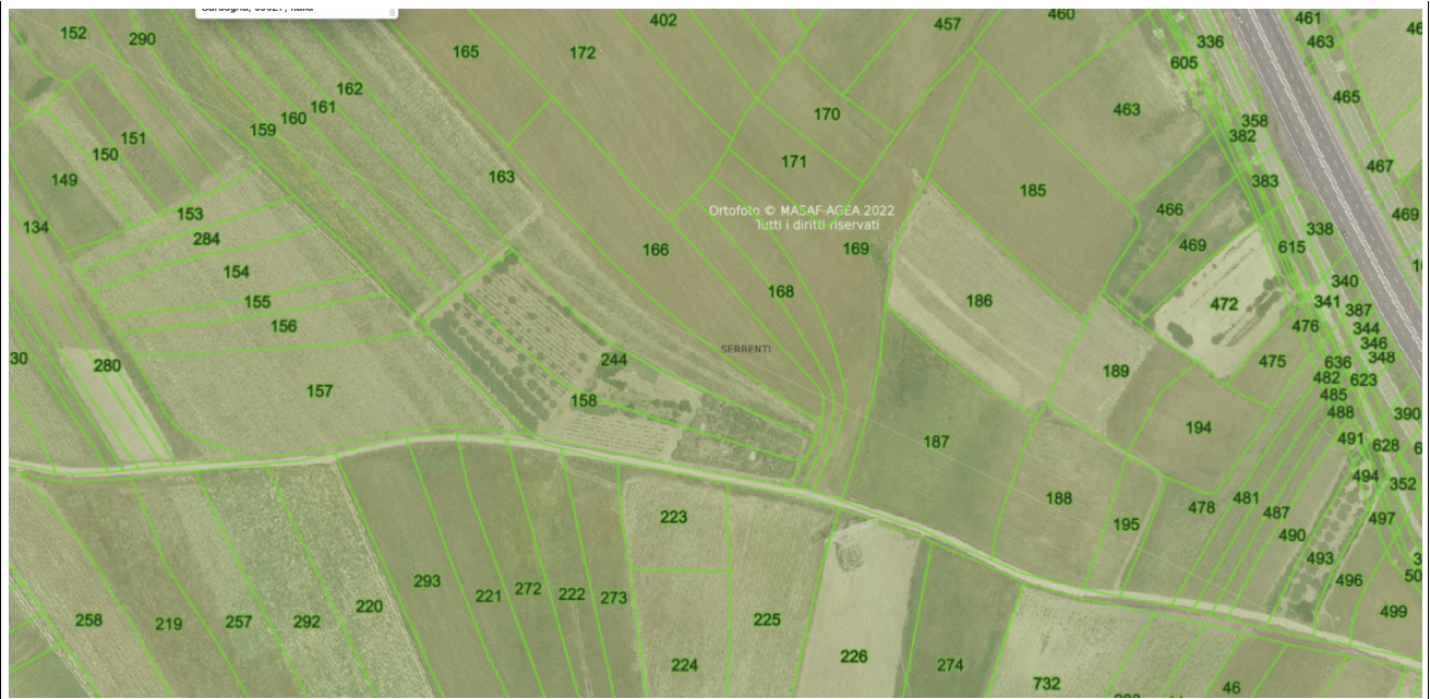
LOTTO N° 2 FOGLIO 16 MAPPALE 481 – 284