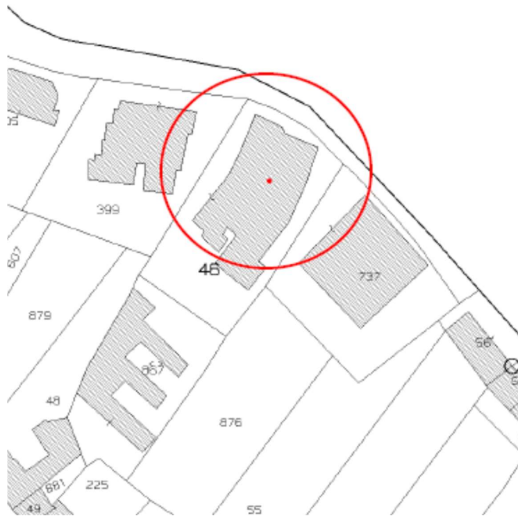
Stralcio mappa catastale