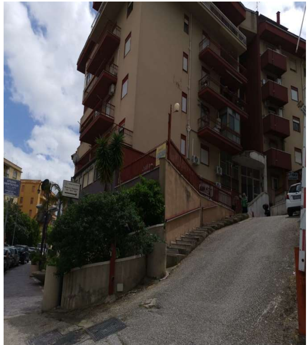
Foto n.2 Prospetto dalla traversa di via Imera

L'unità immobiliare, ha accesso dalla traversa di via Imera a mezzo portone posto al civico n.149 (v.foto n.3) e corridoio interno (v. foto 4) che conduce, procedendo subito a destra all'interno n.7 (v. foto n.5).