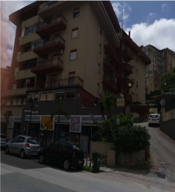
Foto n.1 Prospetto dalla via Imera

A) L'immobile a cui il locale appartiene è un fabbricato sito nella via Imera n. 149 a sei elevazioni fuori terra oltre piano seminterrato realizzato con struttura portante in c.a. e copertura in parte piana e in parte a tetto (v. foto n. 1 e 2).