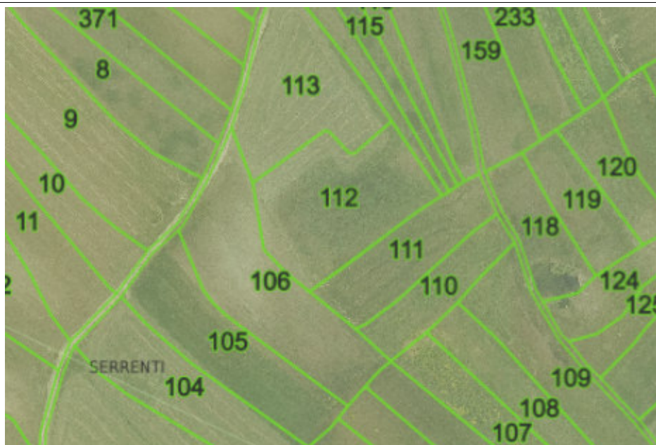
LOTTO N° 1 FOGLIO 12 MAPPALE 110