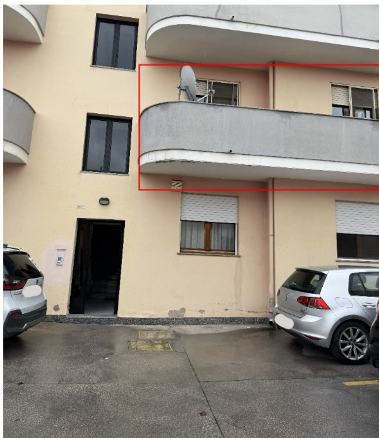
Prospetto principale e individuazione dell'immobile

DOTT. ING. ELISABETTA MASSA Valutatore Immobiliare Livello Avanzato UNI 11558:2014 Cepas n. 598 Via Messina 38, 09126 Cagliari (CA) P. IVA 03526930924 C.F. MSSLT70M71B354M Iscriz. Ordine Ingegneri Prov. CA n.3606 - Polizza professionale Lloyd's Insurance A45S475324A-LB