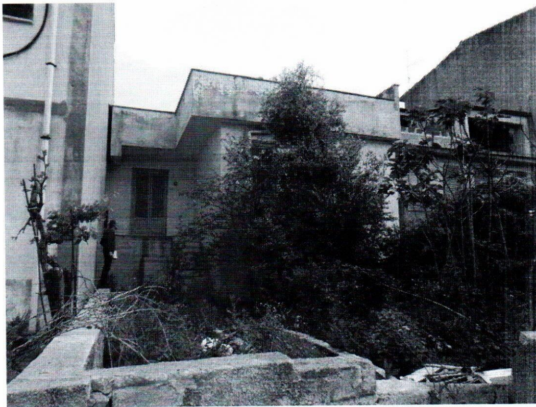
foto n. 7: vista del prospetto posteriore con giardino in Via Leopardi