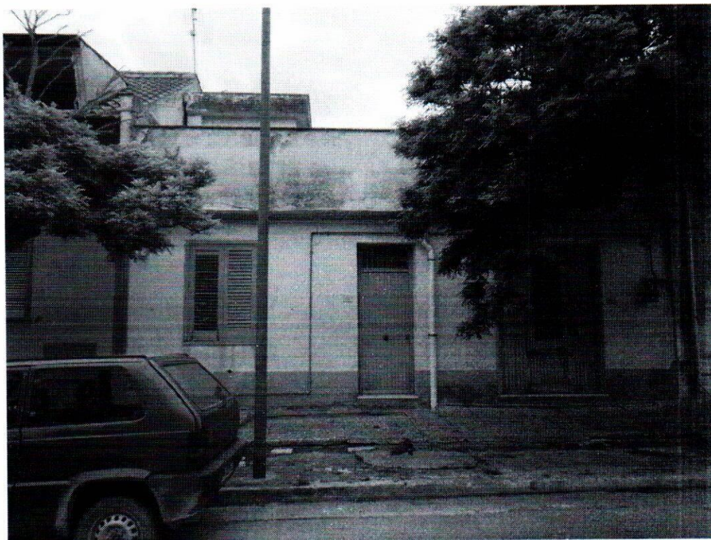
foto n. 1: prospetto di Via Ugo Foscolo con ingresso abitazione n. 44 e autorimessa n. 42