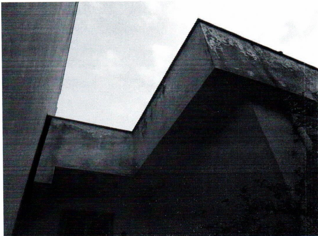
foto n. 10: particolare dello stato di degrado del prospetto posteriore