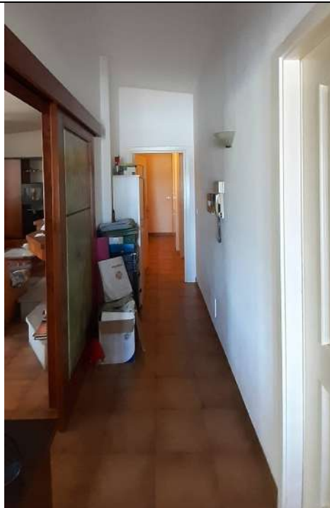
14. Disimpegno 1