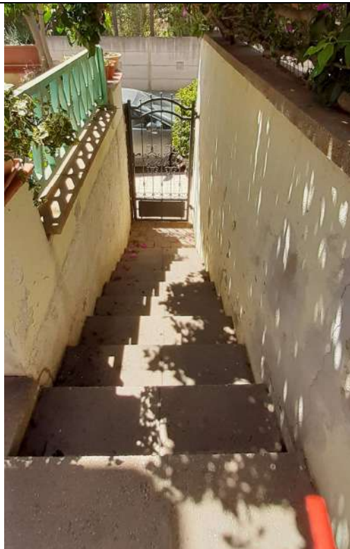
4. Accesso comune da via A. Volta n. 82