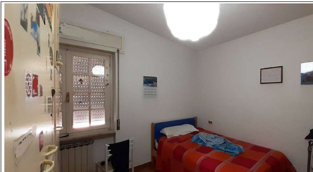
19. Camera 2