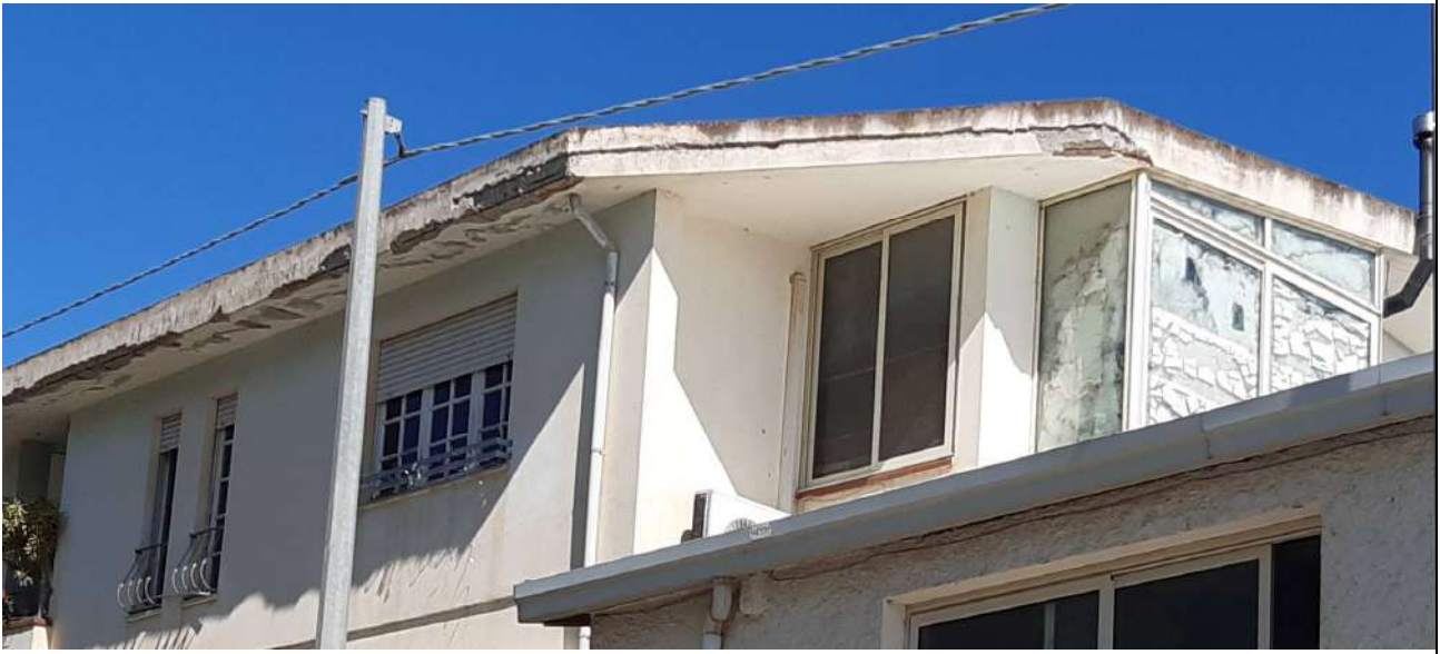
13. Veranda 1 (chiusa con infissi vetro alluminio)