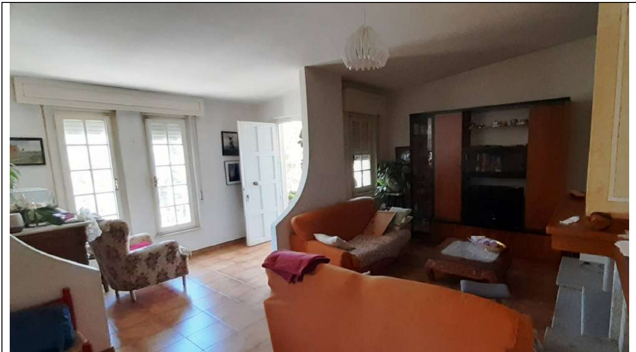
9. Ingresso e soggiorno-pranzo