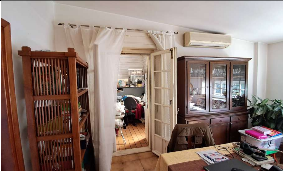
21. Vista della veranda (ripostiglio) dal soggiorno