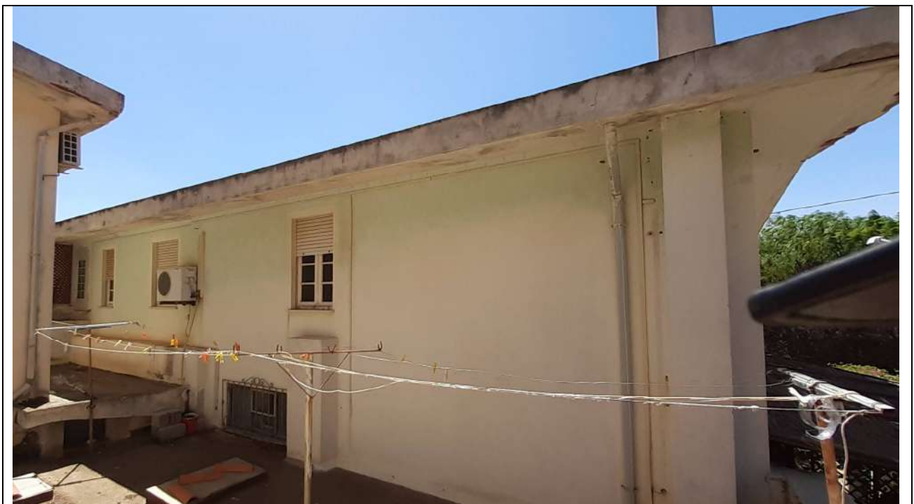
8. Prospetto posteriore (Nord)