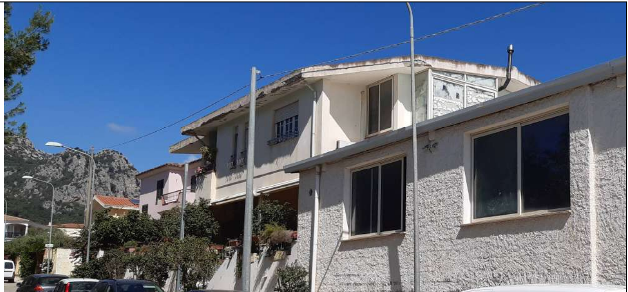
2. Vista appartamento al piano 1° da via A. Volta