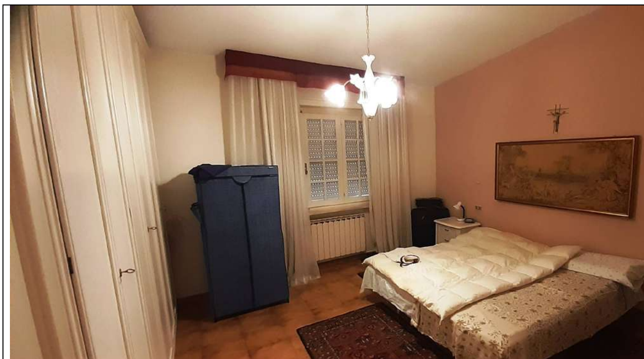
18. Camera 1