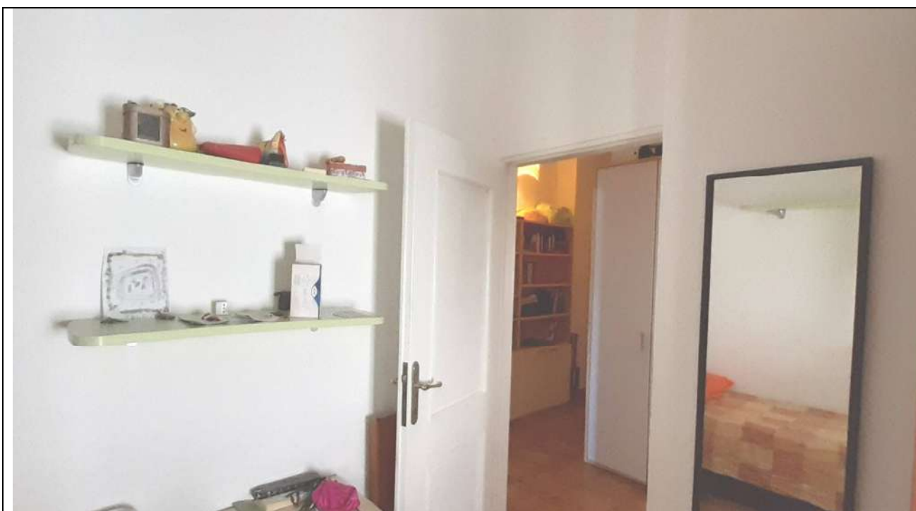
20. Ripostiglio uso camera