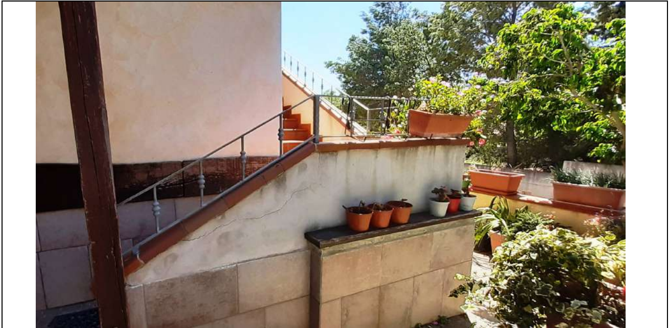
5. Scala di collegamento al piano 1°