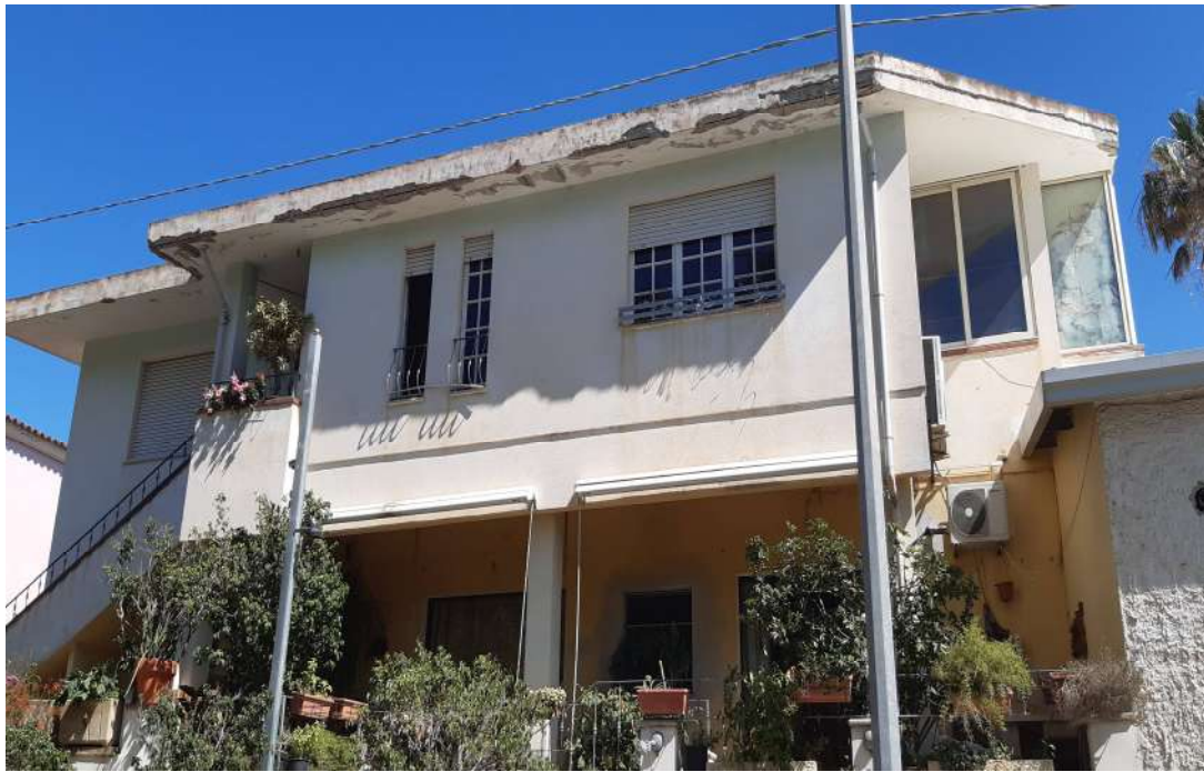
3. Prospetto principale (Sud)