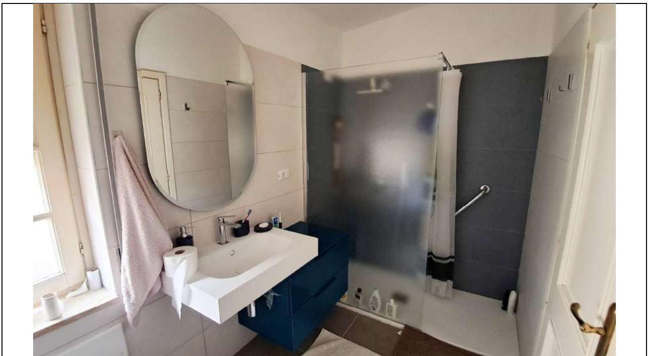
16. Bagno 2