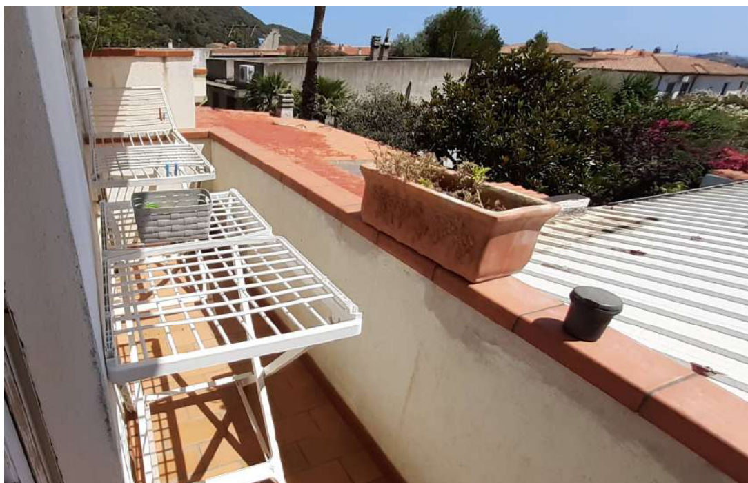
12. Veranda 2, con accesso dalla cucina (Est)