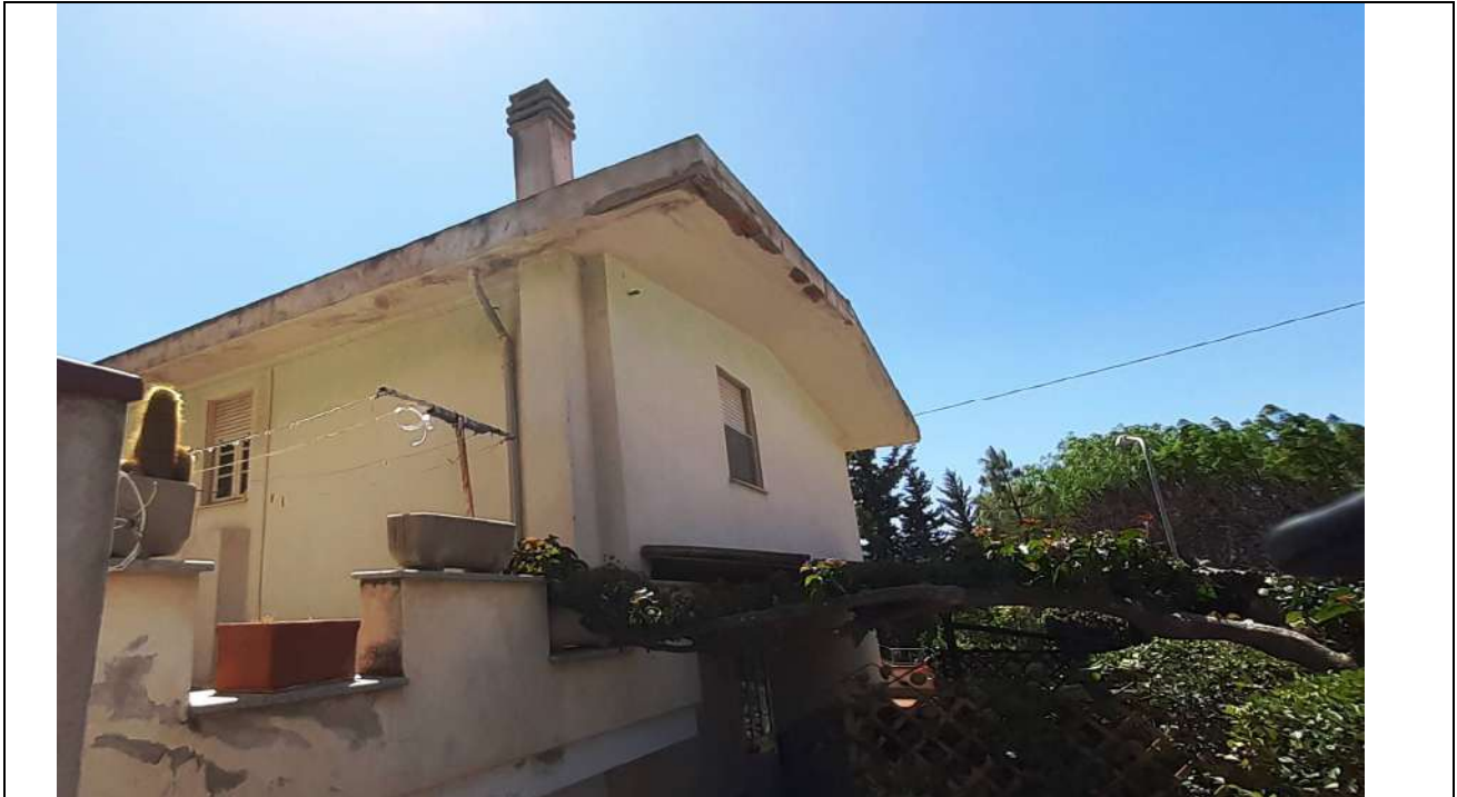
7. Vista laterale (Ovest)