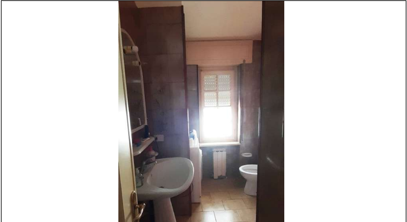
15. Bagno 1