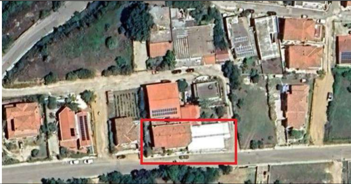
1. Via Alessandro Volta - Siniscola (Nu)

LOTTO 1 – Appartamento di civile abitazione al NCEU di Siniscola al Fg. 37, Part. 1668, Sub. 14 - Cat. A/2