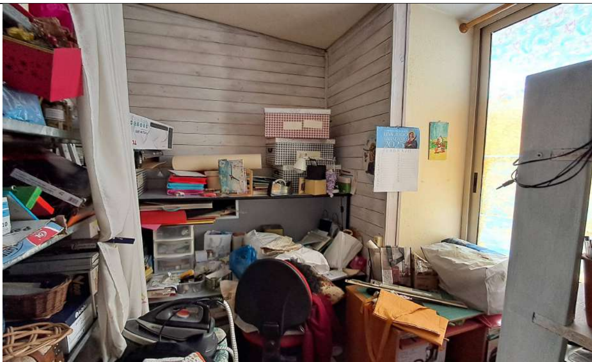
22. Veranda 2 (uso ripostiglio)