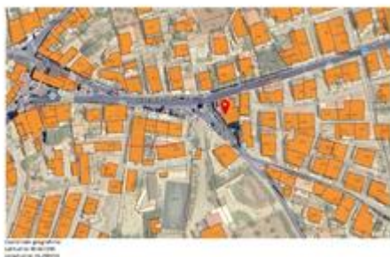
Catastale su ortofoto

Il Lotto n.2 è ubicato in un'area centrale, nei pressi della piazza dedicata ai caduti di guerra.