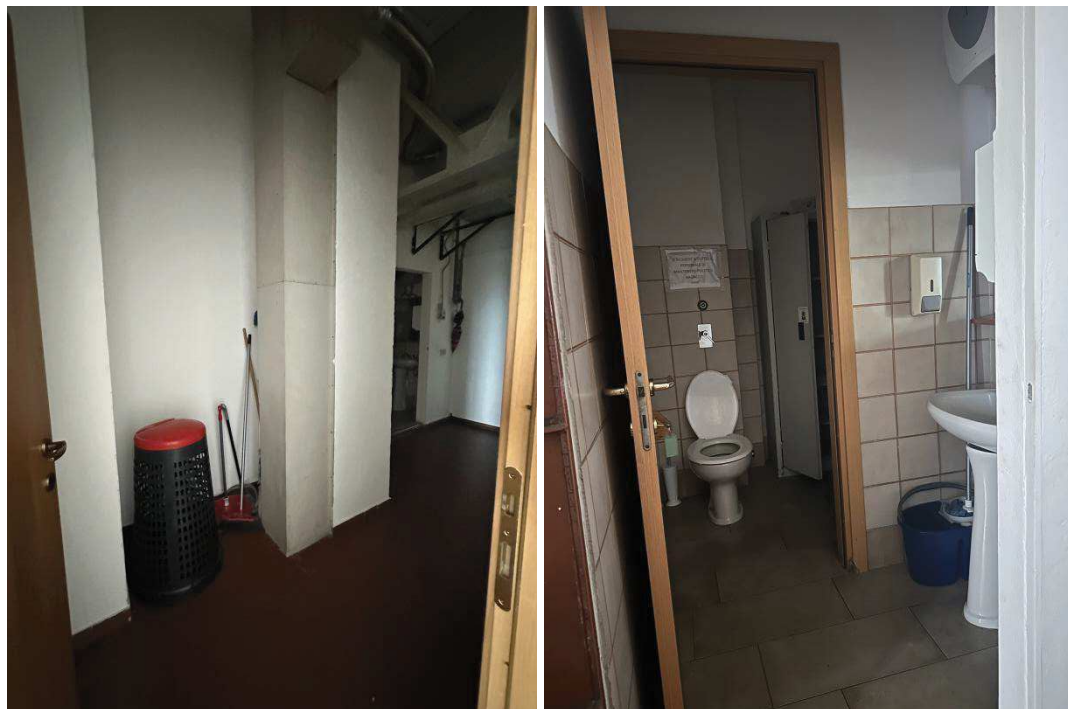
Particolare interno disimpegno e locali servizio