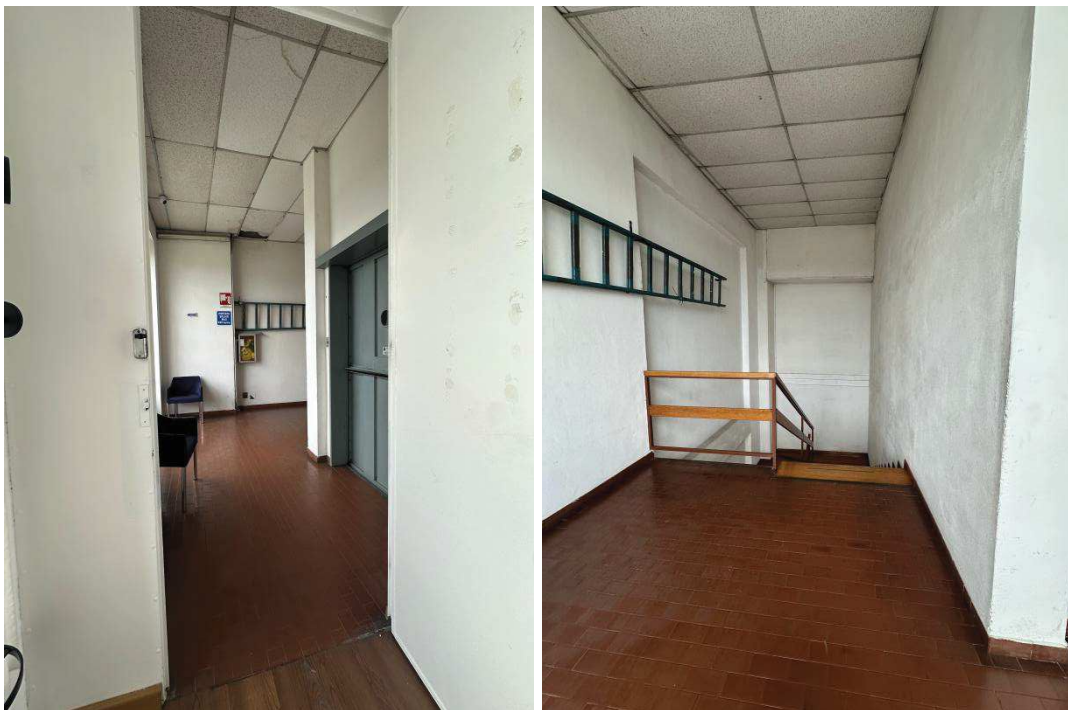
Particolare vano scala comune