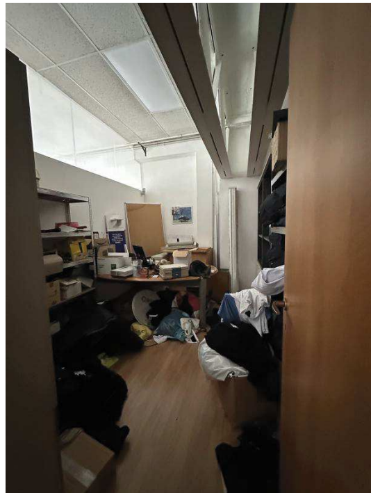
Particolare interno locali e uffici