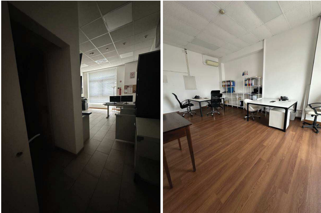
Particolare interno locali e uffici