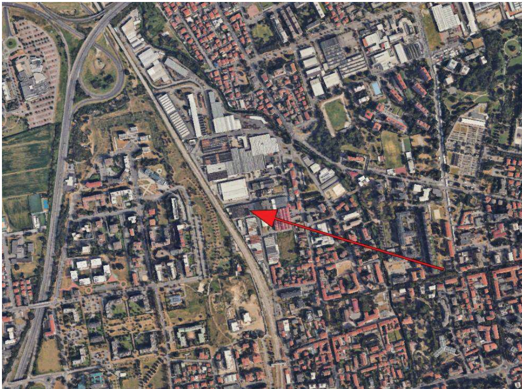
Inquadramento territoriale: estratto Google Maps