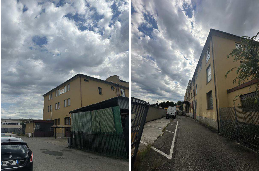
Particolare esterno edificio