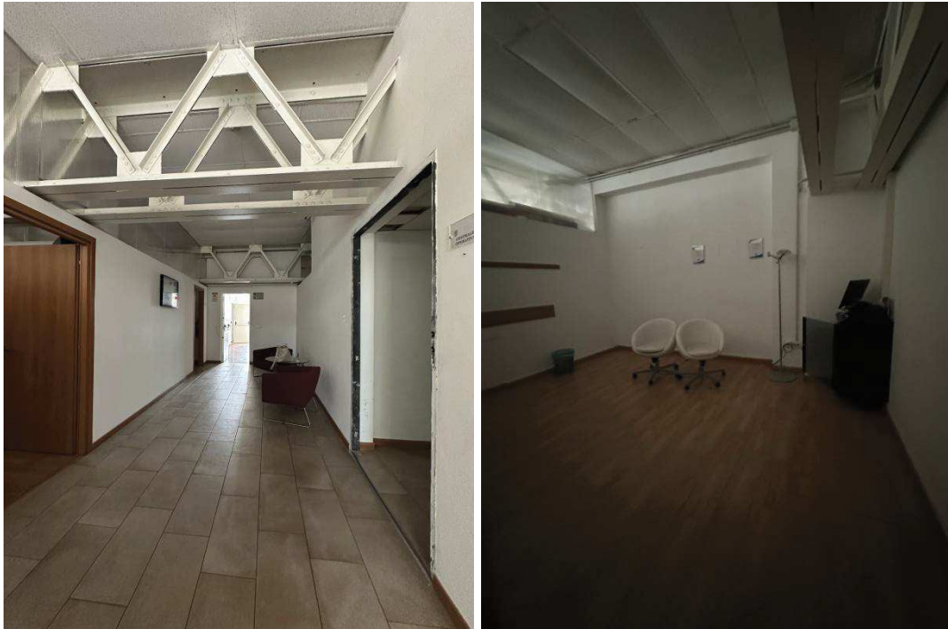
Particolare interno disimpegno e locali