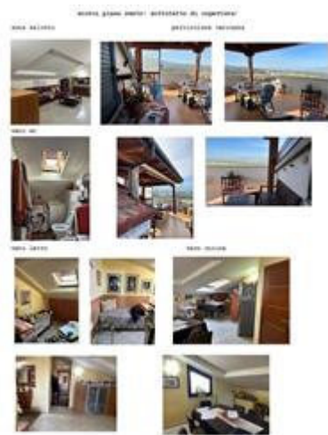
foto piano sesto sottotetto di copertura