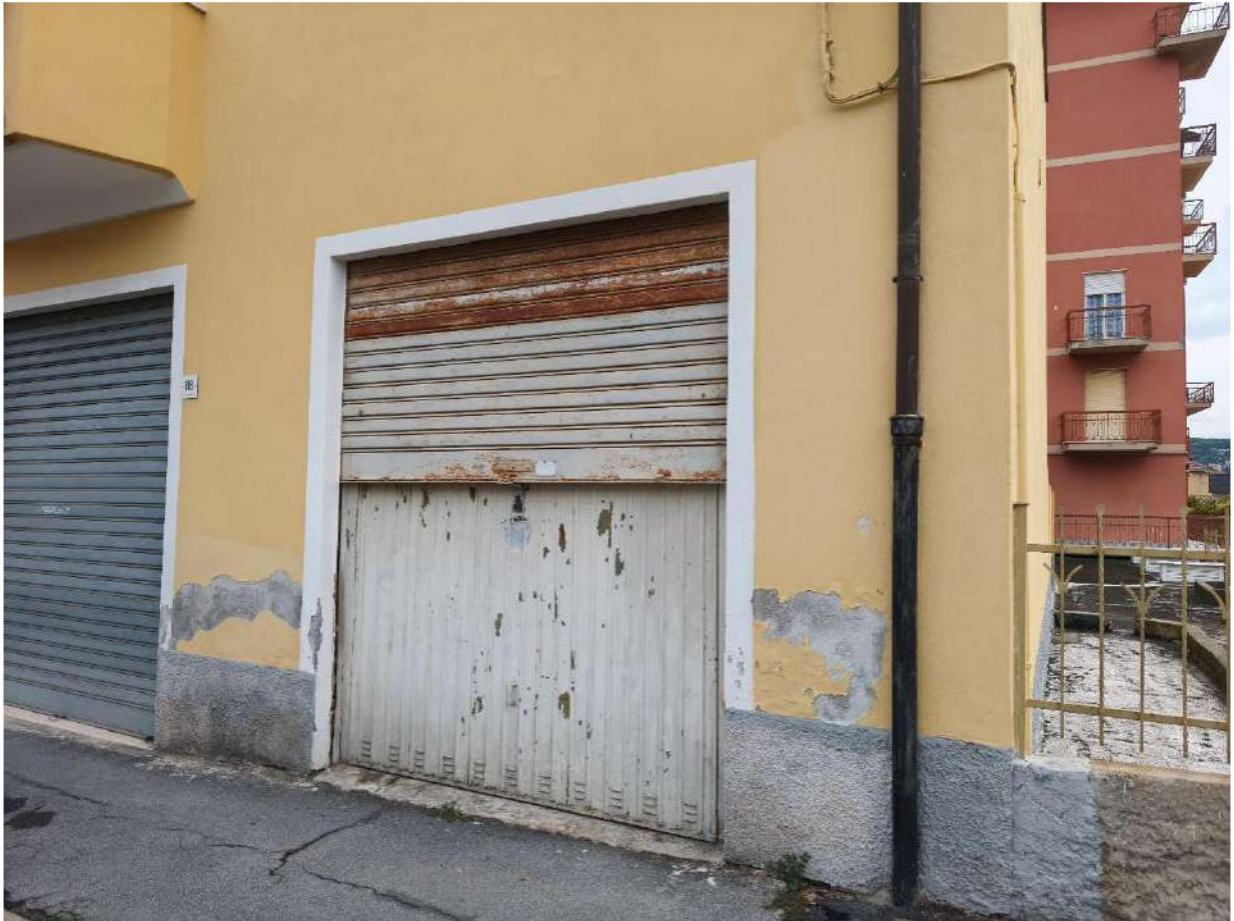
Fotografia 15: la saracinesca d'accesso a ovest