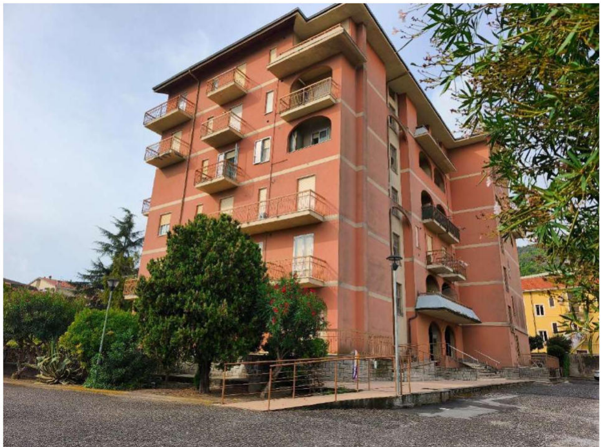
Fotografia 3: vista del condominio da nord-est