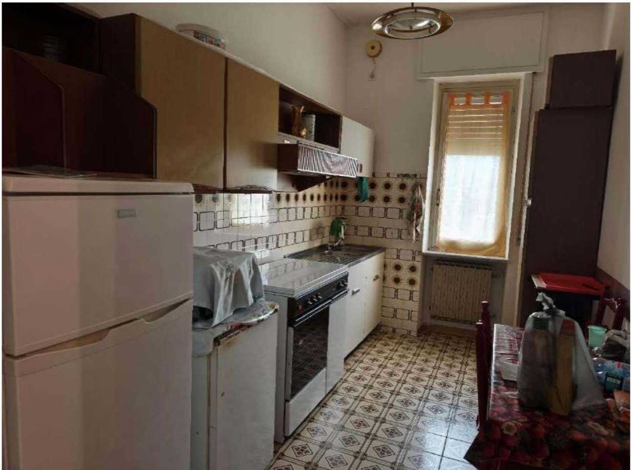
Fotografia 7: cucina