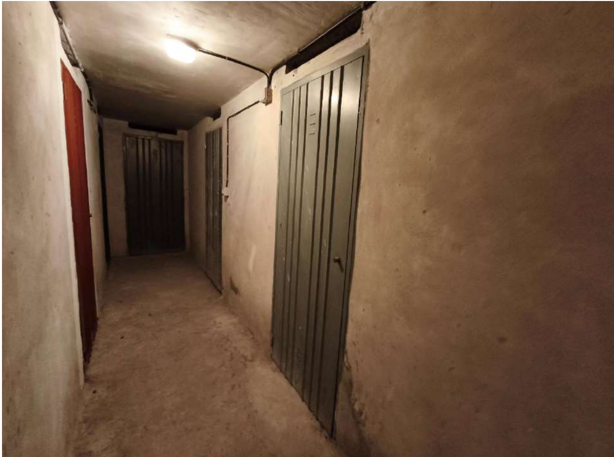
Fotografia 12: corridoio e porta cantina