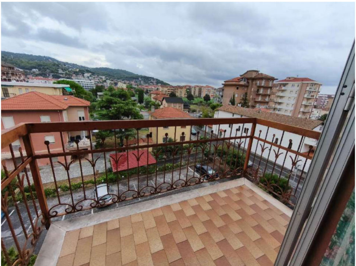
Fotografia 11: balcone