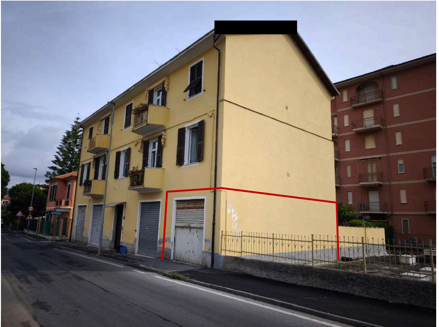
Fotografia 14: vista sud-ovest del fabbricato con individuazione del magazzino