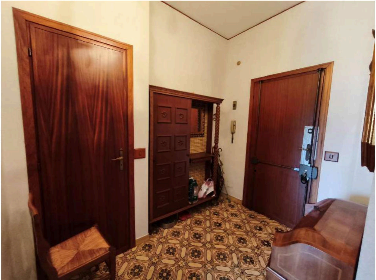
Fotografia 4: ingresso