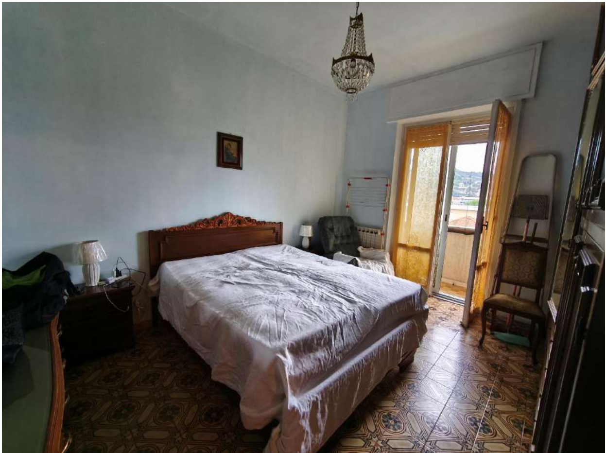
Fotografia 8: camera