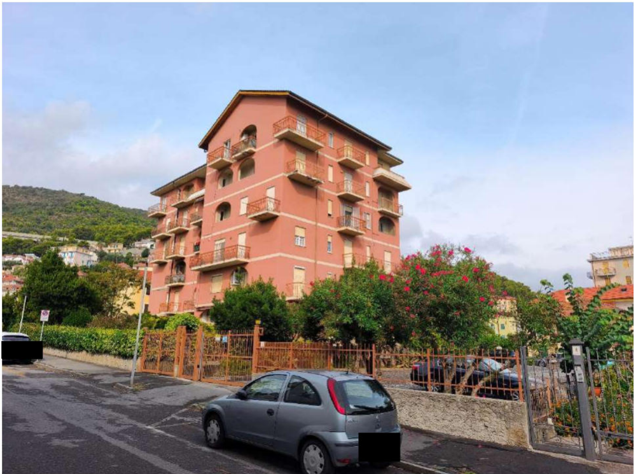
Fotografia 2: vista del Condominio da sud-est