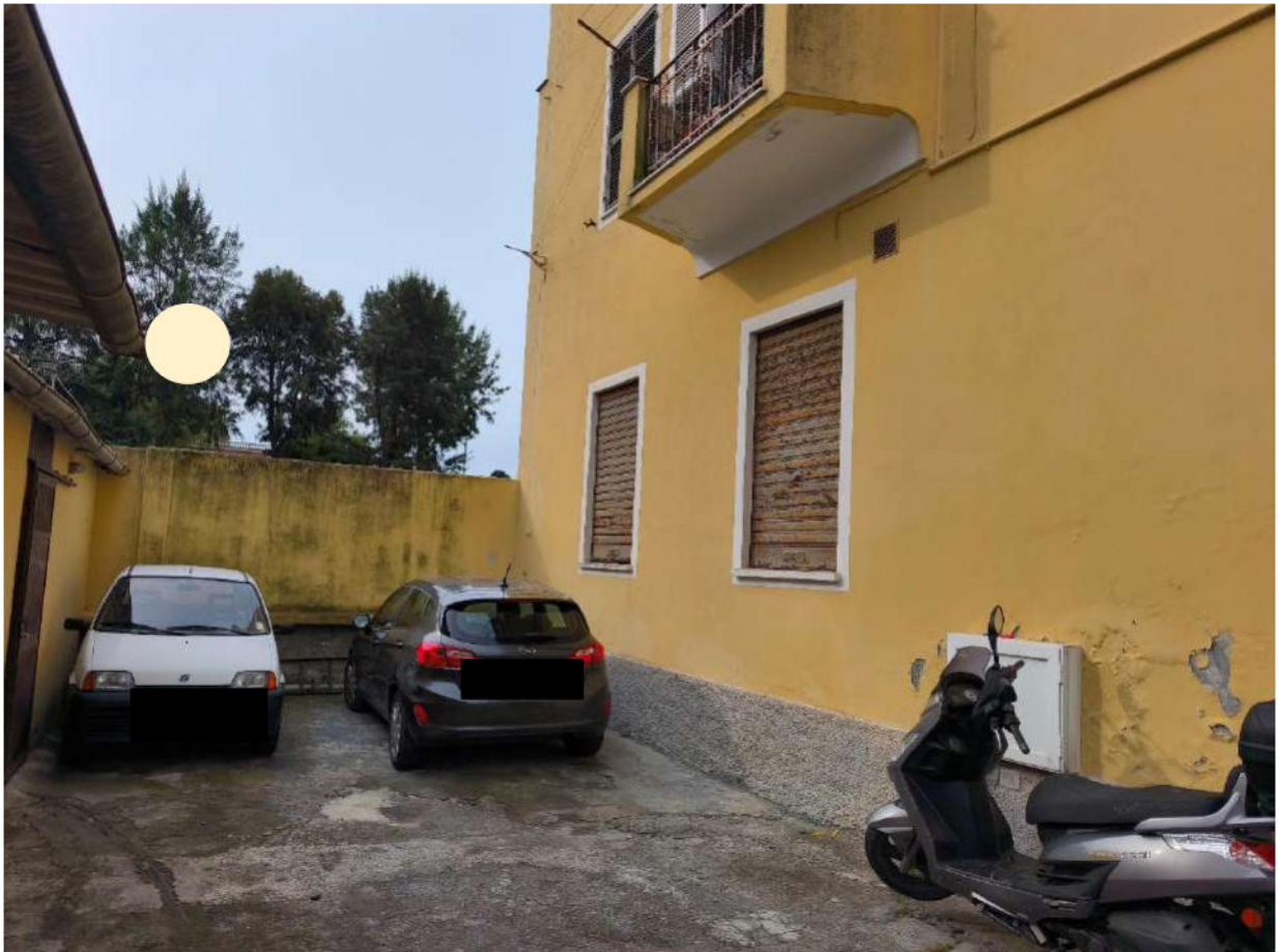
Fotografia 16: il prospetto est su corte esterna