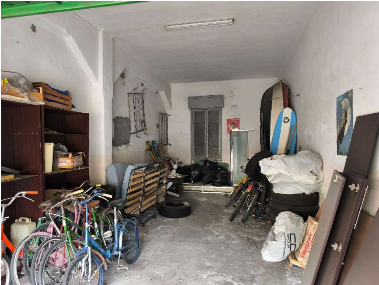
Fotografia 17: il magazzino all'interno