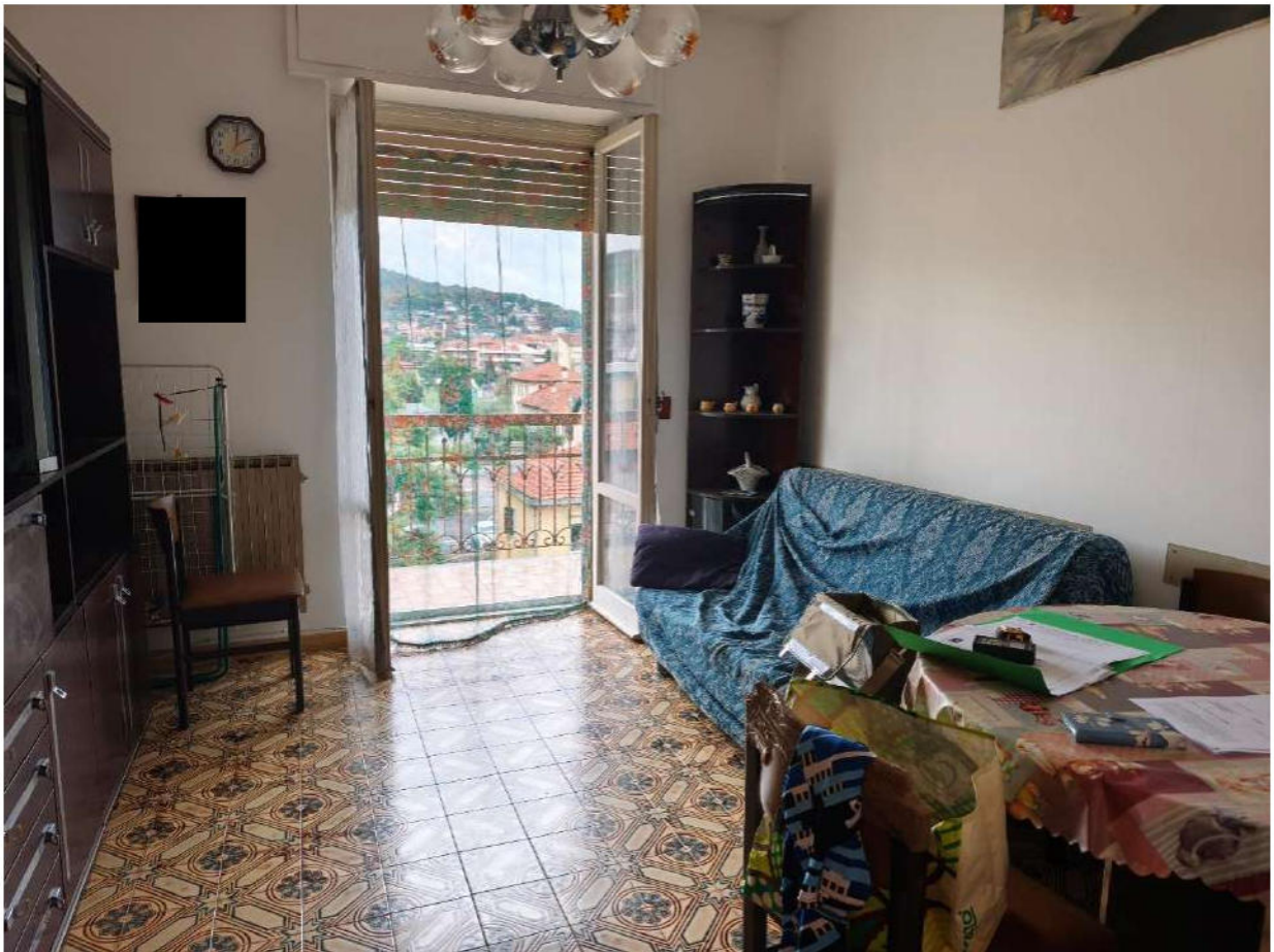
Fotografia 6: soggiorno