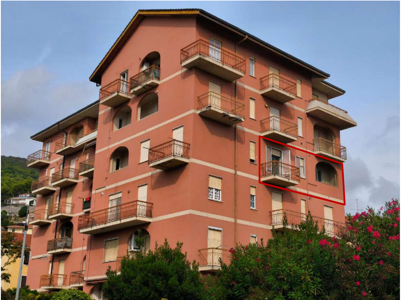
Fotografia 1: prospetto est con individuazione dell'alloggio