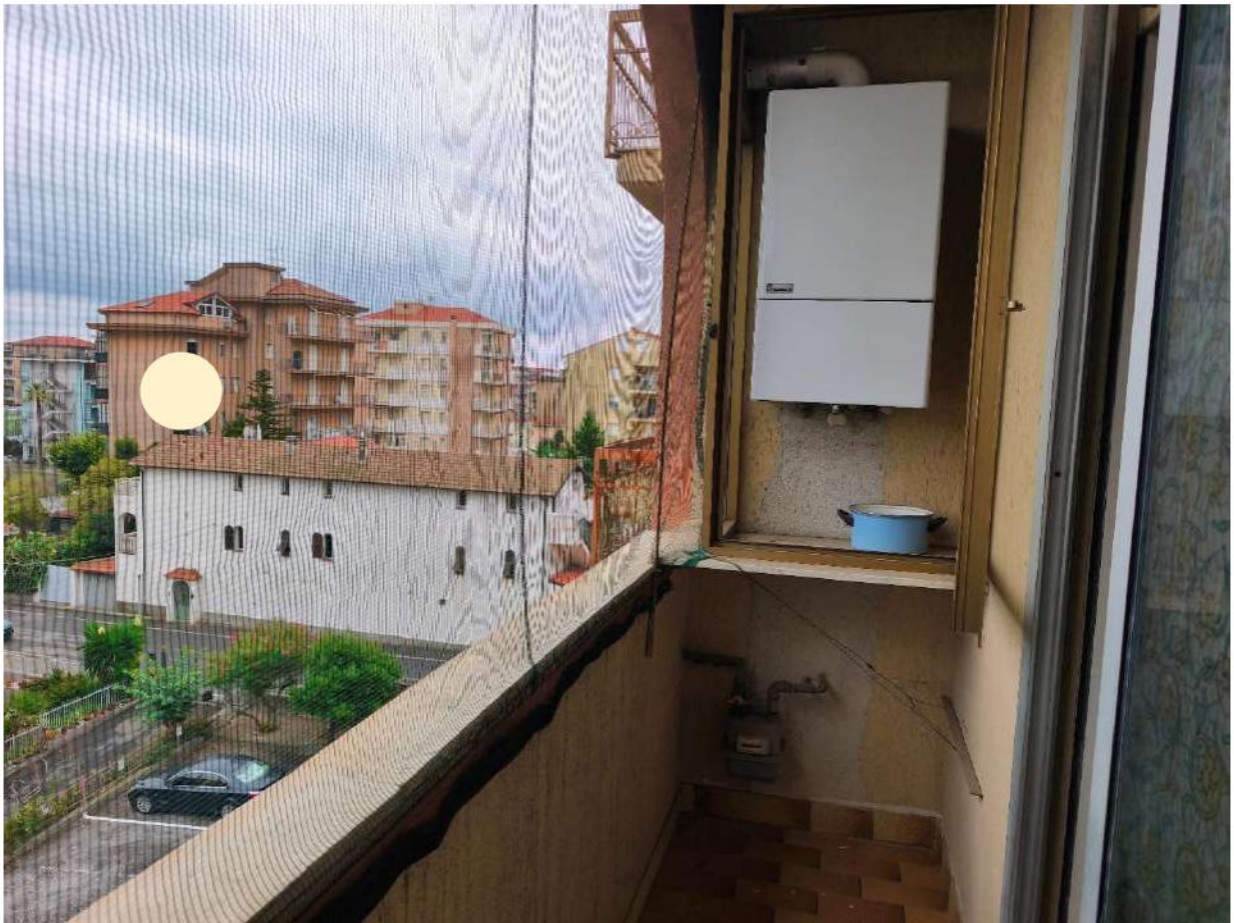
Fotografia 10: loggia