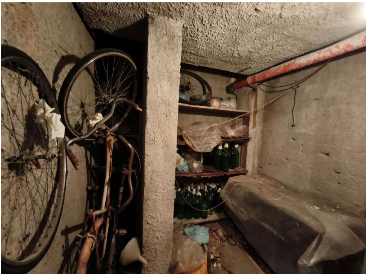
Fotografia 13: interno cantina